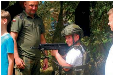
Instruktaż nurkowania klubu „Paskuda”