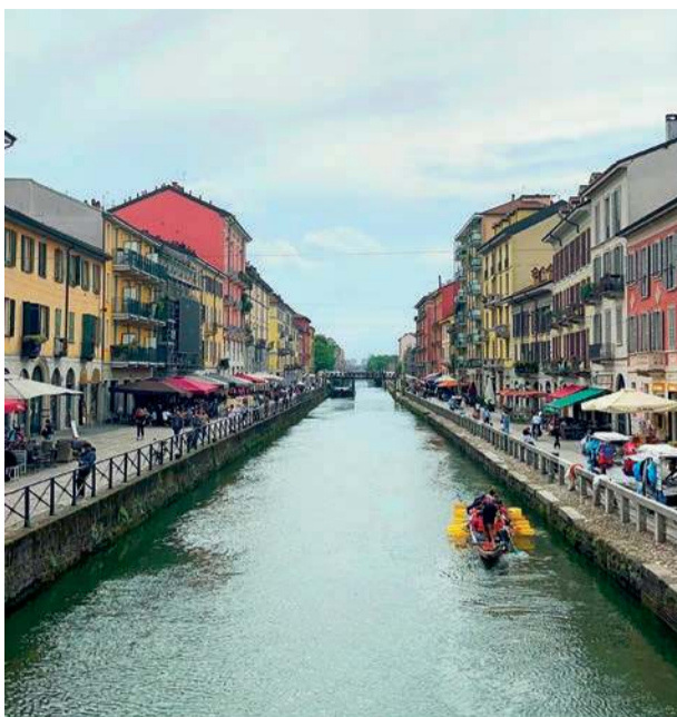
Kanał Naviglio Grande – dawna arteria handlowa, dziś serce tętniącej życiem dzielnicy artystyczno-kawiarnianej Mediolanu