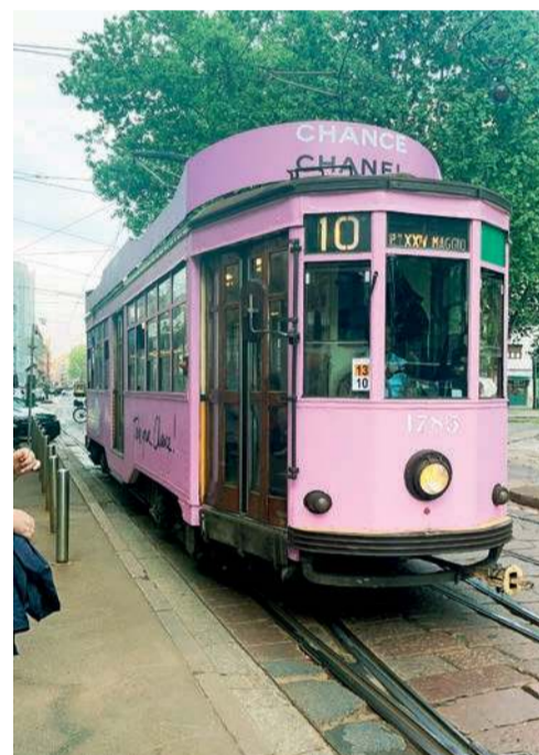
Tramwaj numer 10 w odcieniu Chanel