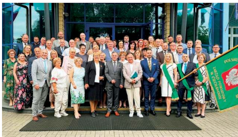
Zjazd delegatów PSL w Ciechanowie

w zjeździe delegatów, wręczył Złotą Koniczynkę wójtowi gminy Gliniojeck