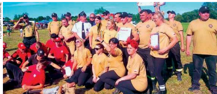
Niedzielne zawody wygrała OSP Kucice