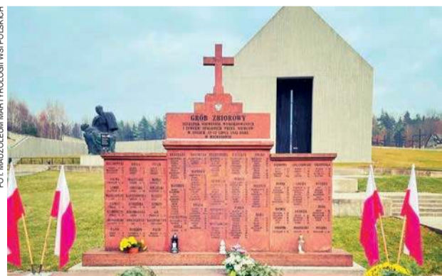
Grób zbiorowy w Michniowie – hołd pomordowanym mieszkańcom wsi