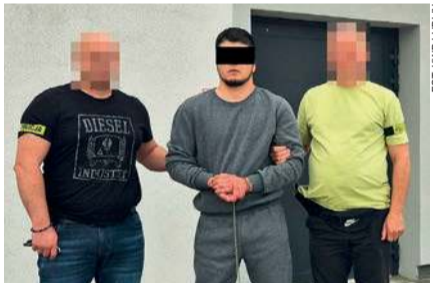
Na terenie powiatu płońskiego zatrzymano 22-latkę podejrzanego o udział w oszustwach w Chelmie, Olsztynie i Ciechanowie

Lubelscy kryminalni ustalili mężczyznę, który brał udział w oszustwie. Okazał się nim 22-letni obywatel Uzbeki.