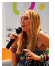
Gościem sochocińskiej biblioteki była Beata Pawlikowska, podróżniczka, pisarka, dziennikarka.

Wydarzenie zorganizowała sochocińska biblioteka - w ramach projektu dofinansowanego ze środków ministra kultury i dziedzictwa narodowego (Fundusz Promocji Kultury). KO