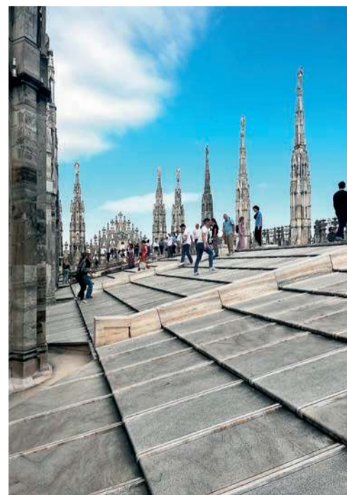
Na dachu katedry – kamienna koronka nad miastem