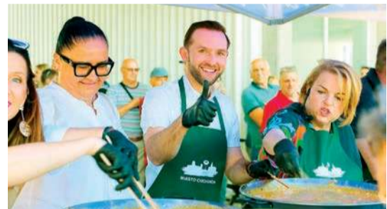
Wielkie smażenie jajecznicy

Jeszcze dwa lata temu funkcjonowało przy Płońskiej podpadające miejskie targowisko - z budami, szczękami i nierównym chodnikiem. Po blocie jesienią i kurzu w sezonie letnim nie ma już śladu. Podczas oficjalnego otwarcia Zielonego Targu, które miało miejsce