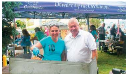
Dzieci chętnie korzystały ze stoiska MBOT