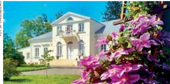
Rozpoczyna się kolejny etap renowacji dziewiętnastowiecznego dworu w Chociszewie

W poprzednim etapie m.in. wymieniono dach, wykonano izolację ścian fundamentowych i nową elewację budynku.