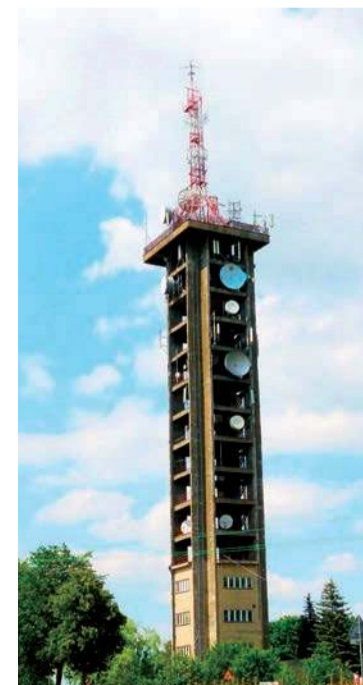
Wieża telewizyjna powstała w 1962 roku