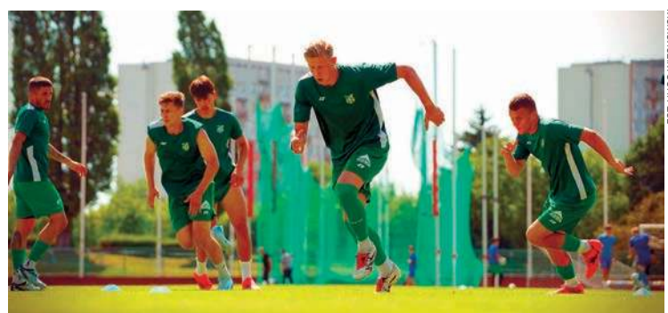
Piłkarze Mławianki podczas sparingu z Elaną Toruń

Trzeciogowcy poznali już terminarz rundy jesiennej. Jak wspomnieliśmy na początku, tegoroczny sezon ruszy 2 sierpnia. Mławianka zagrał wtedy na wyjeździe z beniaminkiem Żąbkovia