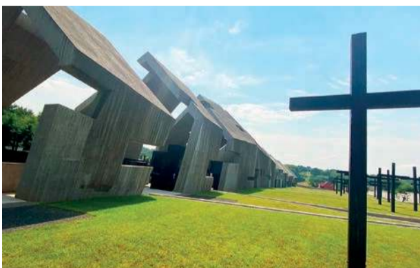
Mauzoleum Martyrologii Wsi Polskich w Michniowie – monumentalne świadectwo zagłady