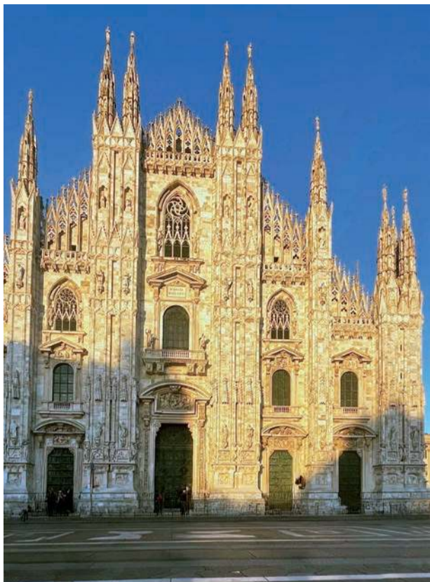
Duomo di Milano w złotym blasku zachodzącego słońca