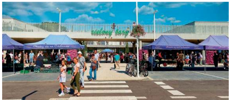
Zielony Targ powstał w miejscu starego targowiska przy ulicy Płońskiej

skal w ramach preferencyjnych środków zwrotnych z instrumentu „Zielona Transformacja Miast” w ramach Krajowego Planu Odbudowy i Zwiększenia Odporności (fundusze europejskie). Prace wykonała firma Rembud. Miejsce zarządzane będzie PUK. erem