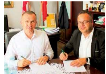
Gmina zakupi nowoczesny autobus dla gminnych szkół

Przetarg na dostawę autobusu wygrała firma z Gierłatowa. Koszt zadania to ponad 1,4 mln zł.