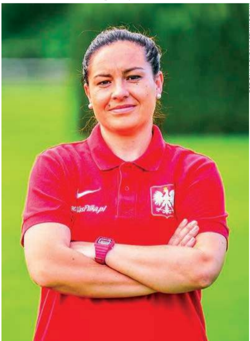
FOT. PAULINA DUDAŁACZYŃSKA NAS PIŁKAR

Grała w reprezentacji U-19. Reprezentowała Polskę na Uniwersjadzie 2009 w Belgradzie, gdzie Biało-Czerwone zajęły 9. miejsce. Niestety, obecną selekcjonerką nie ominęły poważne kontuzje. Siedmiokrotnie poddawała się operacji kolana. bardzo chciała wrócić na boisko, ale w pewnym momencie zdała sobie