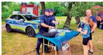
Policjanci na plaży miejskiej

Kąpielisko nad Narwią czynne jest przez całe wakacje, codziennie w godzinach 11:00-19:00. RK