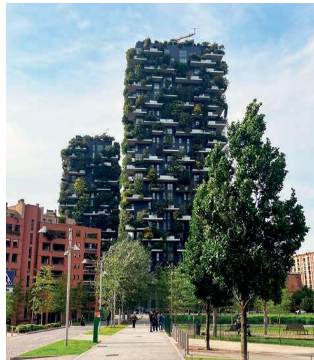
Bosco Verticale – wieżowce zaprojektowane przez Stefano Boeriego stanowią zielone płuca nowoczesnego Mediolanu