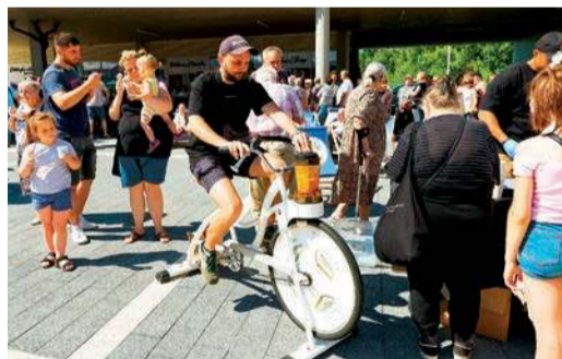
Sok można było wycisnąć... jadąc na rowerze

w sobotę 5 lipca, na gości czekały m.in. jajecznica z ponad 600 jaj, lody i świeżo wyciskane soki. Oczywiście, rozpoczął się również handel - klienci mogli zająć już do 1 z 17 lokali handlowo-usługowych czy po prostu zrobić zakupy u kupców i rolników, którzy wrócili na rynek, aby sprzedawać lokalne produkty