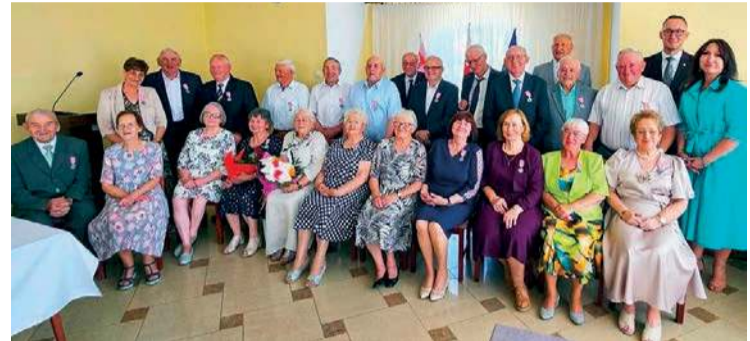
Jubileusz pożycia małżeńskiego świętowało 12 par z terenu gminy Baboszewo