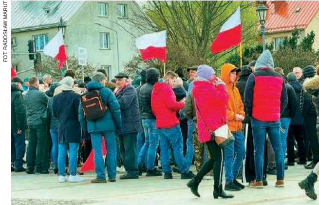
W byłych miastach wojewódzkich nie powstaną, jak planowano, centra integracji cudzoziemców. Protest przeciwko utworzeniu takiej placówki miał miejsce również w Ciechanowie

- Nasze zadania w tej kwestii nie zmieniają się – nadal będziemy integrować społecznie, zapewniać informację niezbędną do tego, by obcokrajowcy mogli się odnaleźć w polskich realiach. Wciąż w planach jest edukacja i informacja międzykulturowa dla kadr pomocy społecznej czy pracowników oświaty. Zmienia się nieco spo-