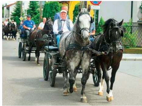
Po uroczystym podpisaniu umowy samorządowcy i zaproszeni goście pojechali bryczkami obejrzeć miejsce, gdzie powstanie zbiornik

Europie, nie tylko w Polsce. Mamy do czynienia ze zjawiskiem suszy, i to suszy hydrologicznej, a w związku z tym musimy prowadzić świadomą i dale-