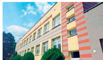
Budynek szkoły w Sochocinie przejdzie termomodernizację