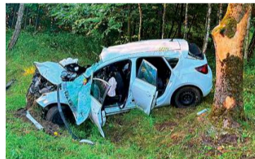
Policja apeluje o ostrożność, sezon letni to okres wzmożonej aktywności dzikich zwierząt

Na drodze wojewódzkiej w gm. Nowe Miasto doszło do groźnego wypadku. Kierowca chciał uniknąć zderzenia z łosiem i uderzył w drzewa.