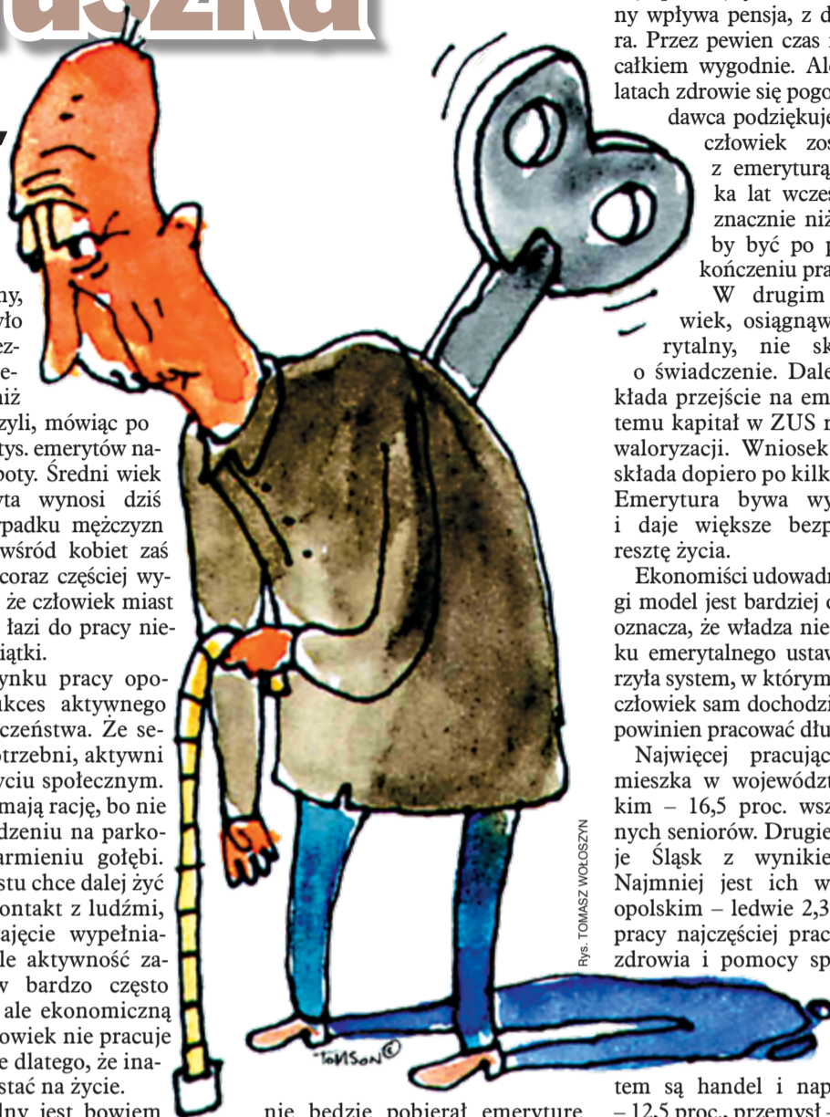
Rys. TOMASZ WOLCZYŃ