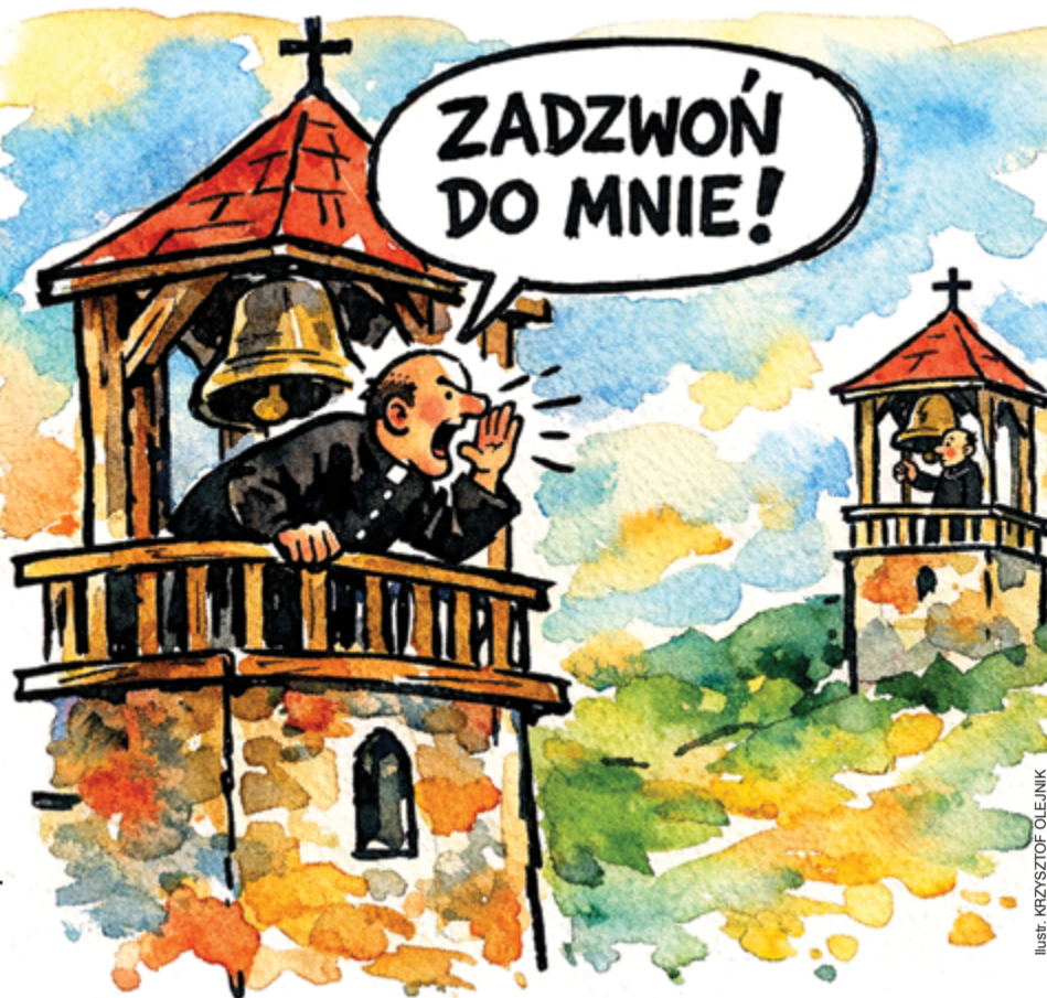
Ilustr. KRZYSZTOF OLEJNIK

Po drugie, zapewne za ową masową dźwiękową agresją stoi tanioc. Dzisiejszy „głos pański” to zazwyczaj chińska elektronika najpodlejszej próby. Prawdziwe dzwony z brązu, z ich szlachetnym sercem i czaszą, to obecnie rzadkość zabytkowych katedr. To, co słyszysz z okna, to wytwór technologii z Shenzhen, dzięki której proboszcz-technokrata może zapro-