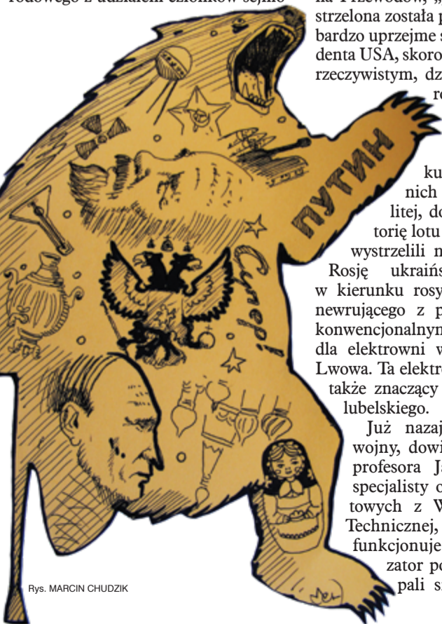
Rys. MARCIN CHUDZIK