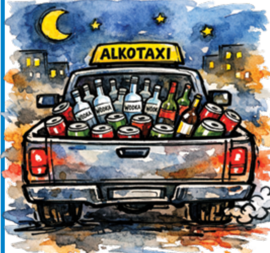
Ilustr. KRZYSZTOF OLEJNIK

● Od 1 czerwca w Warszawie w godz. 22.00–6.00 nie wolno już sprzedawać alkoholu w sklepach. Pomysłodawcy nocnej prohibicji opowiadali o bezpieczeństwie, zdrowiu publicznym, porządku i innych wzniosłych ideach. Jak zwykle przy tego typu projektach zabrakło jedynie odpowiedzi na pytanie, które ekonomia zadaje sobie od lat – co zrobi człowiek, który czegoś chce, a władza mu tego zabroni? Warszawa potrzebowała zaledwie tygodnia, aby odpowiedzieć, i już po siedmiu dniach od wejścia w życie zakazu internet zaroił się od tego, co media ochrzciły mianem „e-melin”. Trudno o bardziej polski sukces przedsiębiorczości. Oferta jest przejrzysta. Pół litra wódki kosztuje od 50 do 70 zł, piwo – od 7 zł, a butelka różowego wina – 40 zł. Dostawa – do 15 zł. Wszystko zgodnie z najlepszymi tradycjami