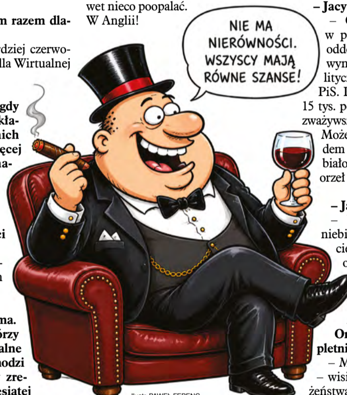
Ilustr. PAWEŁ FERENC

– Tak, jak Bruksela i Brugia. Ale można skoczyć, godzina pociągiem. I moja przyjaciółka Becia właśnie tak zarządziła. A że akurat zaczęła się na wyspach fala upałów – o której, nawiasem mówiąc, BBC mówi dużo więcej niż o dymisji premiera, więc to musi być jakaś rewelacja – zdążyłam się nawet nieco poopalać. W Anglii!