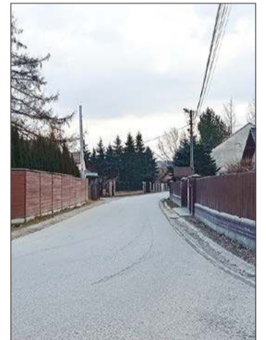
Co dalej m.in. z ul. Partyzantów?

Ale to nie jedyny problem, z którym w najbliższym czasie będzie musiał zmierzyć się władz miasta. Kilka dni temu miasto otworzyło oferty złożone na wykonanie projektu budowy ulic za Nadleśnictwem Dębica. Na to zadanie zaplanowane zostało 80 tys. zł. Tymczasem najniższą ofertą była ta na kwotę 298 tys. zł. Ale to jeszcze nic w porównaniu do przetargu na projekt budowy i przebudowy Partyzantów. Tu miasto zabezpieczyło 100 tys. zł, tymczasem najniższa oferta opiewa na kwotę ponad 590 tys. zł. Czy to oznacza, że przetargi zostaną unieważnione? Nie.