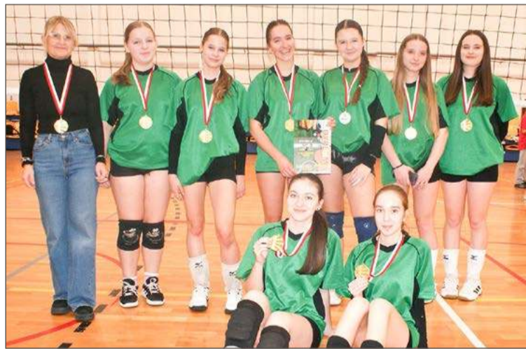
Zawody w piłce siatkowej dziewcząt wygrały reprezentantki SP nr 3.