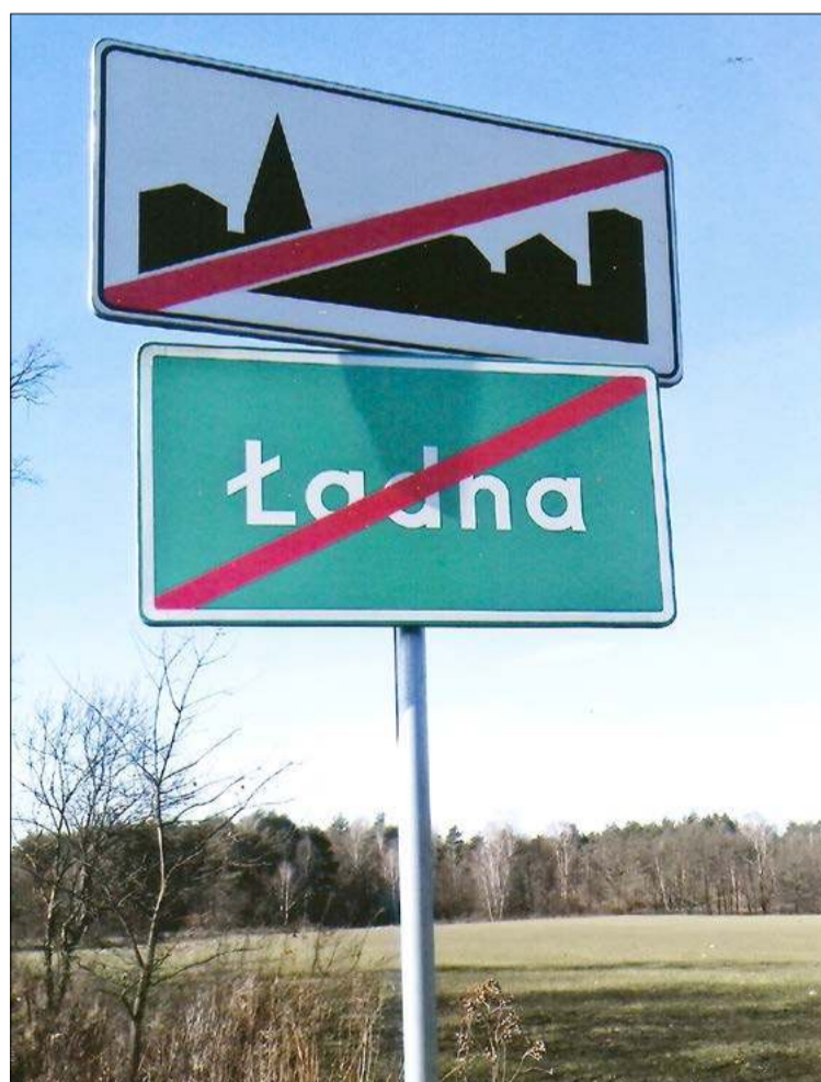
Zaraz będzie brzydka.