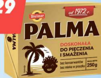
Palma 250 g [9,16 zł/1kg]