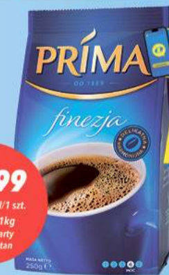
Kawa mielona Prima Finezza 250 g [43,96 zł/1kg] Limit 3 szt. paragon

51,96 zł/1kg Cena bez karty Mój Lewiatan