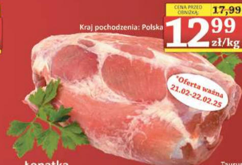
Łopátka w p b/k 1kg