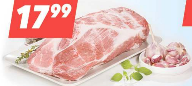
Karkówka wieprzowa 1 kg [17,99 zł/1kg]