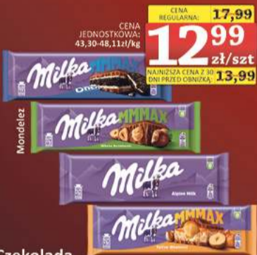
Czekolada Milka 270g-300g (wybrane rodzaje)