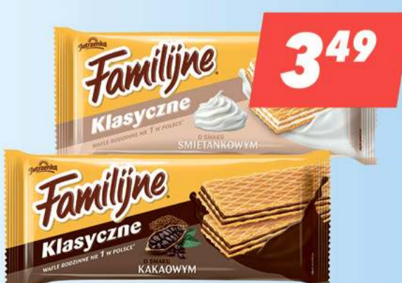
Wafle Familijne Jutrzenka kakaowe, śmietankowe 180 g [19,39 zł/1kg]