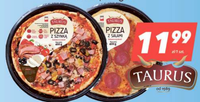
Pizza z szynką, Pizza z salami 400 g [29,98zł/1kg]