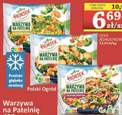
Warzywa na Patelnię 450g

NAJNIŻSZA CENA Z 30 DNI PRZED OBNIŻKĄ: 9,99