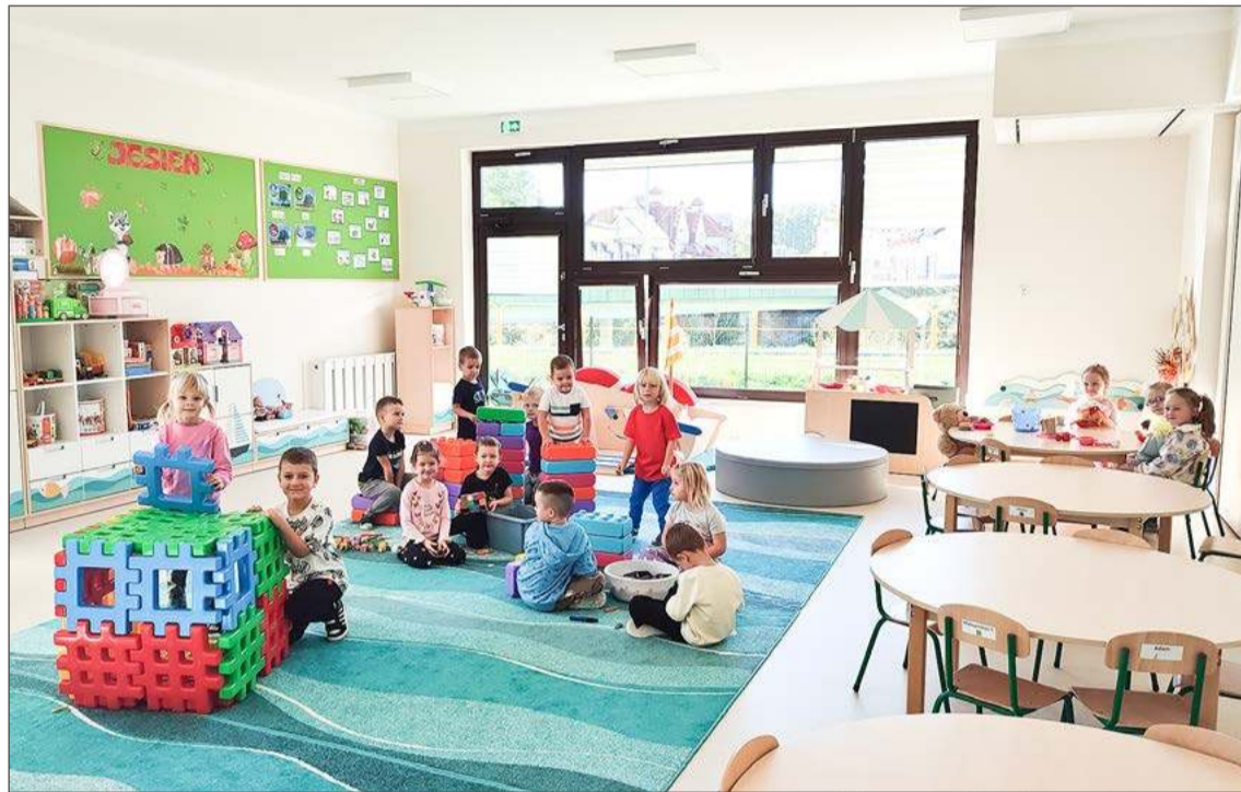
Do przedszkola w Czarnej na kolejny rok szkolny zapisanych zostało 98 dzieci.

W przedszkolach i oddziałach przedszkolnych przy szkołach podstawowych na najmłodsze dzieci czekały 543 miejsca. Chętnych do skorzystania z nich jest dużo mniej, bo 411. Mimo to dwójka dzieci ma chwilowo status nieprzyjętych.