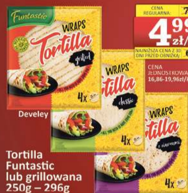
Tortilla Funtastic lub grillowana 250g – 296g