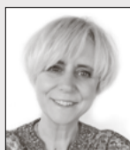
majba@ol.com.pl tel. 14 670 27 87

Nasi dziennikarze czekają na Twoje zgłoszenie