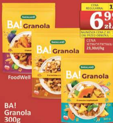
BA! Granola 300g

NAJNIŻSZA CENA Z 30 DNI PRZED OBNIŻKĄ: 6,99