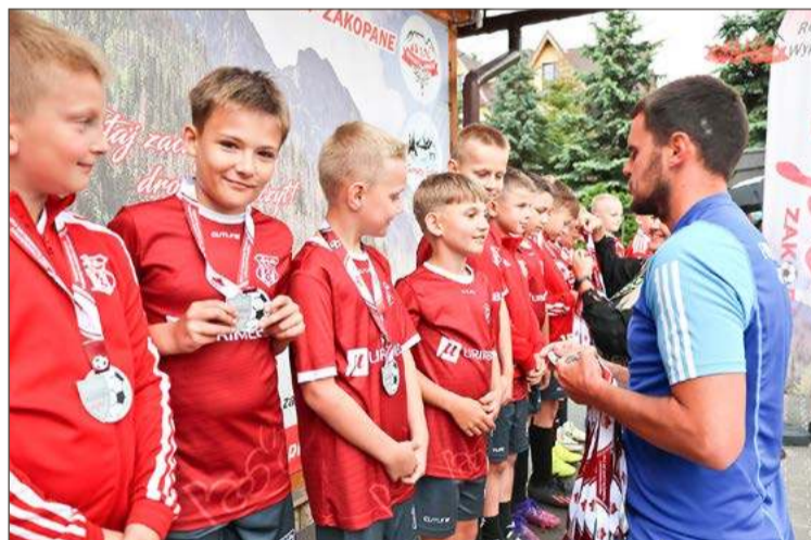
Młodzicy z Pilzna mogą pochwalić się wieloma sukcesami.

Sam nabór do klas I i IV trwał będzie do 28 lutego. Kandydaci do OMS przejść będą musieli testy sprawnościowe, które zaplanowane zostały na 7 marca.