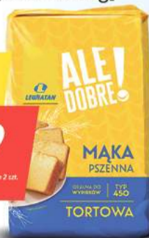
Mąka pszenna Tortowa Ale dobre! typ 450, 1 kg [1,99 zł/1kg] Przy zakupie 2 szt. cena za pakiet wynosi 3,98 zł. Limit 3 pakiety na paragon.