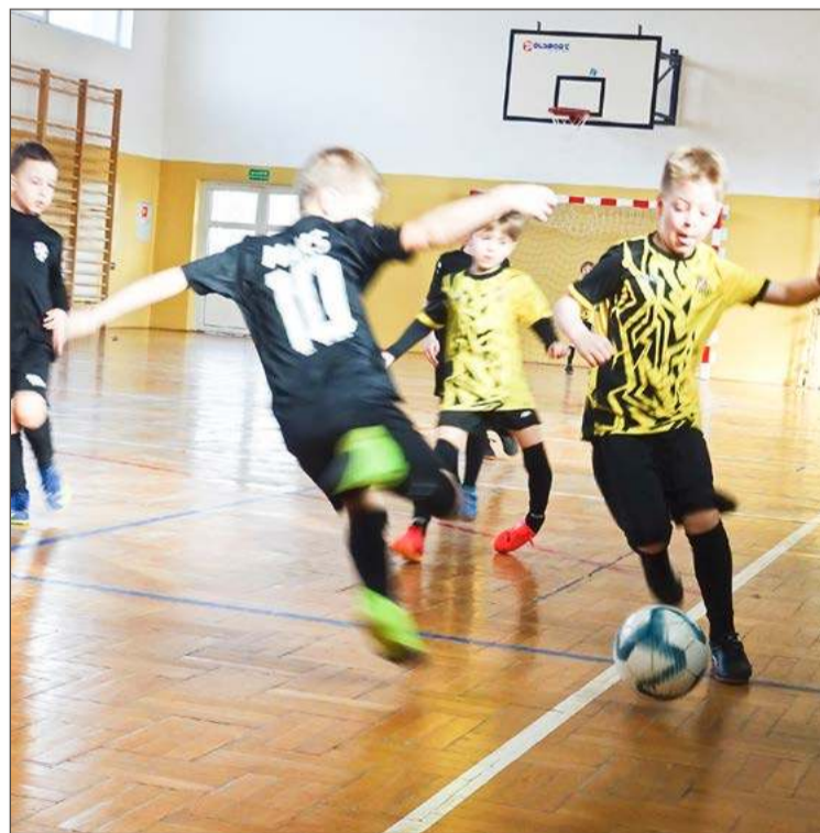
Młodzi piłkarze z Żyrakowa (żółte koszulki) wygrali cztery z pięciu meczów.