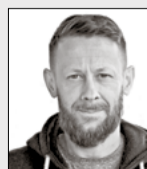
krol@ol.com.pl tel. 14 670 27 87