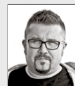
ratuszniak@ol.com.pl tel. 14 670 27 80