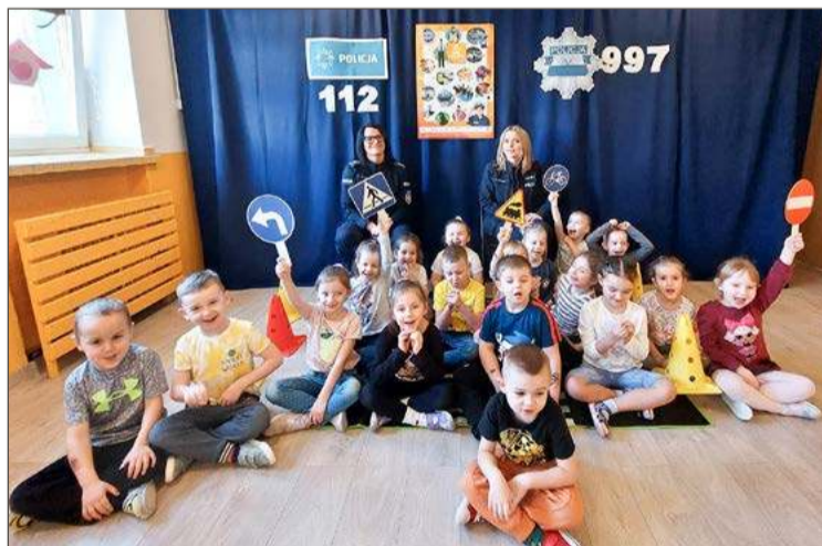
Podczas spotkania w Przedszkolu nr 6 w Dębicy.