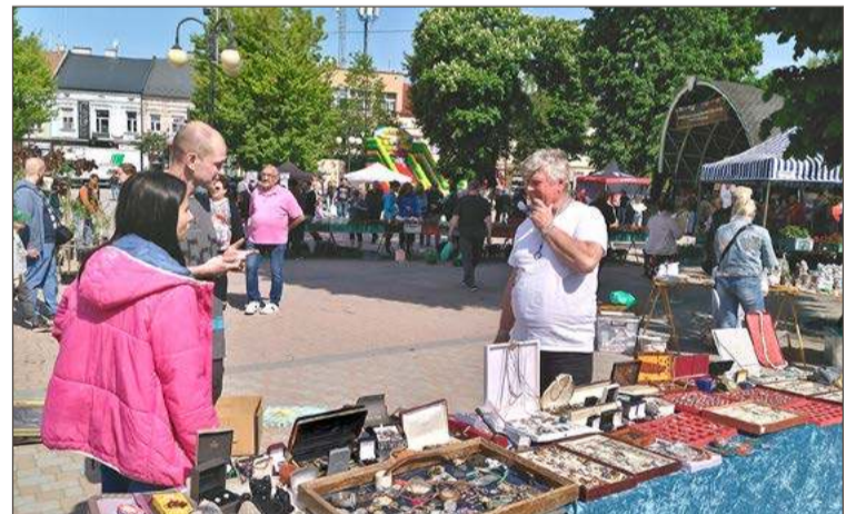
Na pierwszą giełdę staroci trzeba jeszcze poczekać.