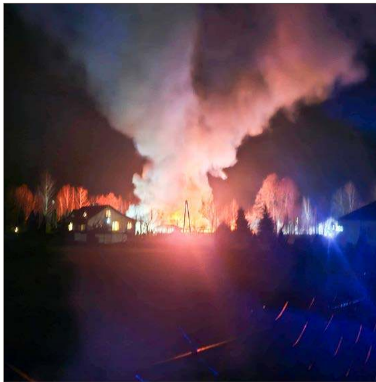
Pożar zabudowań widać było z daleka.

Przyczynę pożaru ustalią biegli, w pomieszczeniu, z którego rozprzestrzenił się ogień nie by-