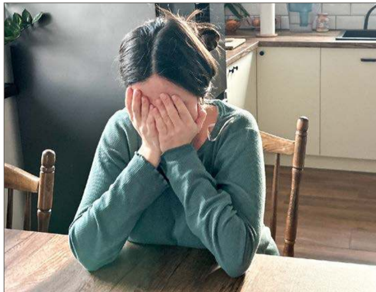
Depresja częściej dotyka kobiety. Ale cierpieć na nią może każdy.

- I sporo gabinetów prywatnych. Ale pomocy w pierwszej kolejności możemy szukać nawet u lekarza