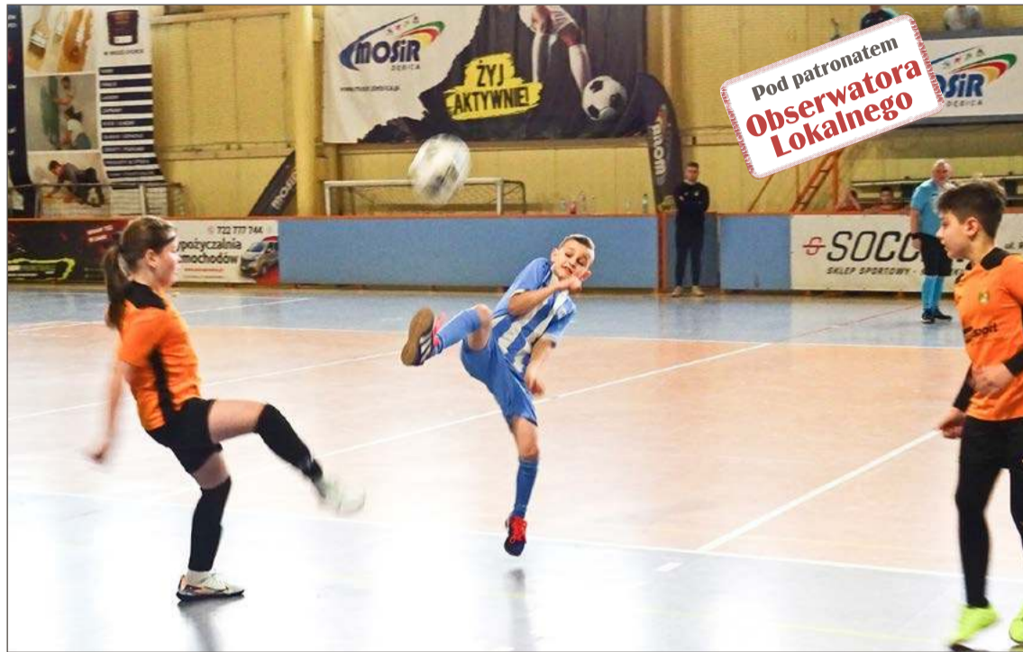
W tym meczu Diament Jodłowa (pomarańczowe koszulki) pokonał Igloopol Dębica 3:1

Wśród uczestników były drużyny z niemal każdej gminy, zabrakło tyl-