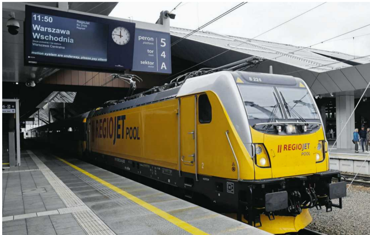
• Pociąg RegioJet

Od tamtego czasu minęły niemal 2 tygodnie. Pracownicy wciąż nie wiedzą, co dalej z ich zatrudnieniem. Słowak ma podpisaną umowę do lipca, ale przynajmniej, że w biurze nie ma już