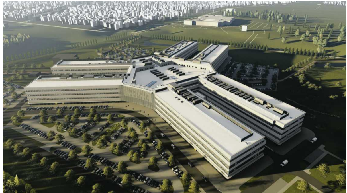
Dolnośląskie Centrum Onkologii, Pulmonologii i Hematologii

Będzie to więc bardzo duży obiekt. Zajmie powierzchnię nieco ponad 100 tys. metrów kwadratowych. Zaprojektowano w nim aż 26 oddziałów, 30