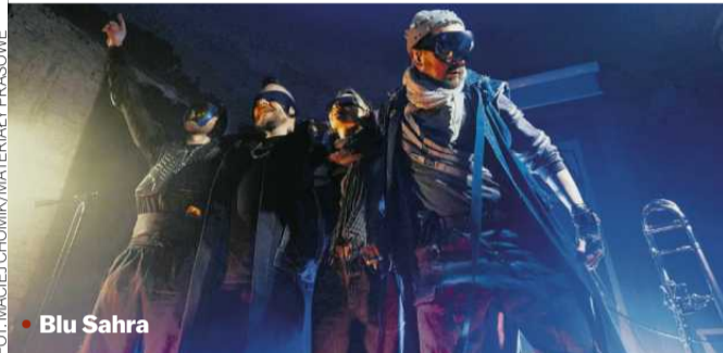
• Blu Sahara

Skąd się biorą młode talenty polskiej muzyki? Między innymi z takich festiwali jak showcase'owy Next Fest, na którym gra ponad setka artystów czekających na uznanie i sławę.