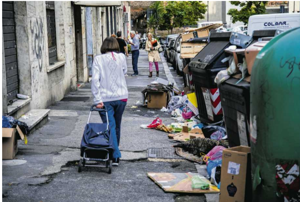
• Śmieci na ulicach Rzymu

W „Gomorrze”, bodaj najważniejszej książce opisującej mentalność mafijnych Włoch, Roberto Saviano opowiadał, jak syndykaty z Południa nawoziły odpadami rodzinne ziemie. „Bosowie nie mieli żadnych wewnętrznych oporów przed nasączeniem rodzinnej ziemi trucizną, przed zanieczyszczeniem terenów otaczających ich wspaniałe wille. W biznesach robionych tu i teraz nie bierze się pod uwagę ich odległych, negatywnych skutków, liczy się tylko jak najwyższy zysk” – tłumaczył pisarz.