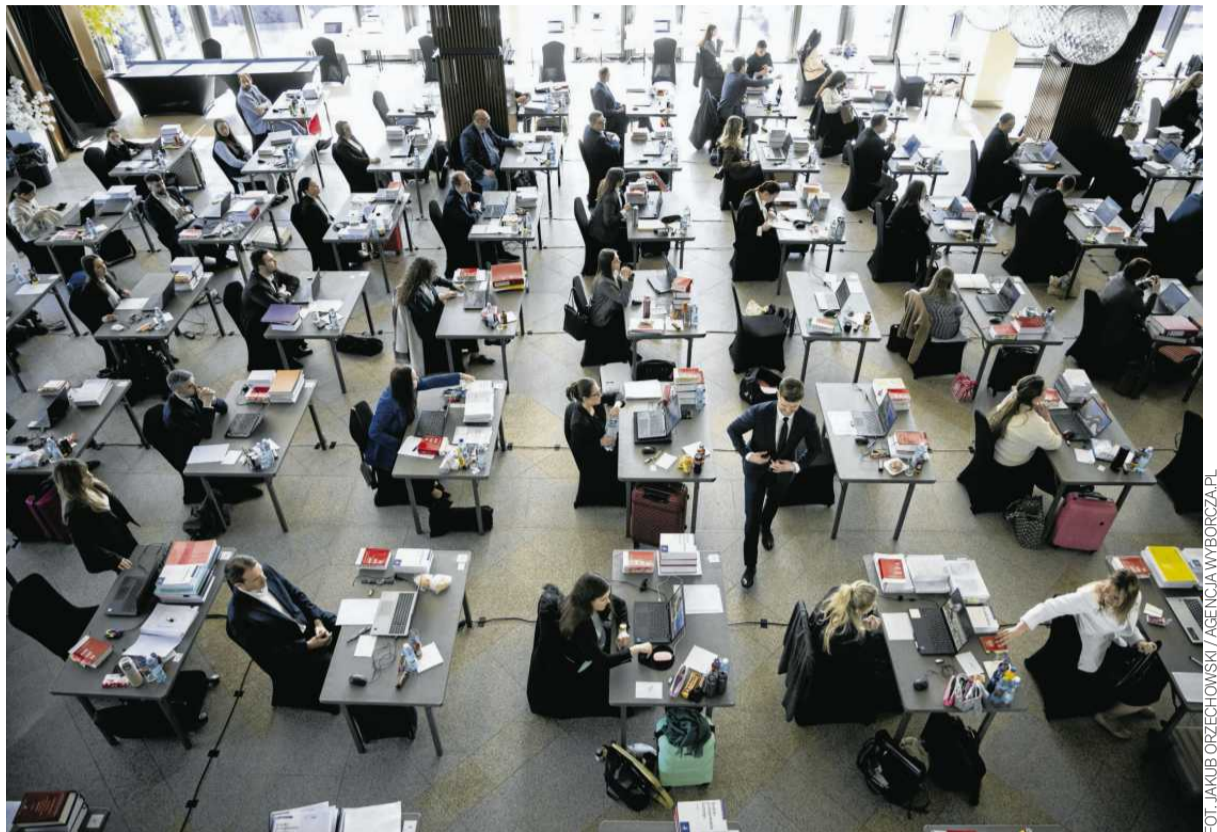
21.04.2026 roku, Hotel Atelia w Lublinie. Pierwszy dzień egzaminu zawodowego dla przyszłych radców prawnych. Więcej zdjęć z Polski i ze świata oraz niezwykłych galerii na Wyborcza.pl/zdjecia