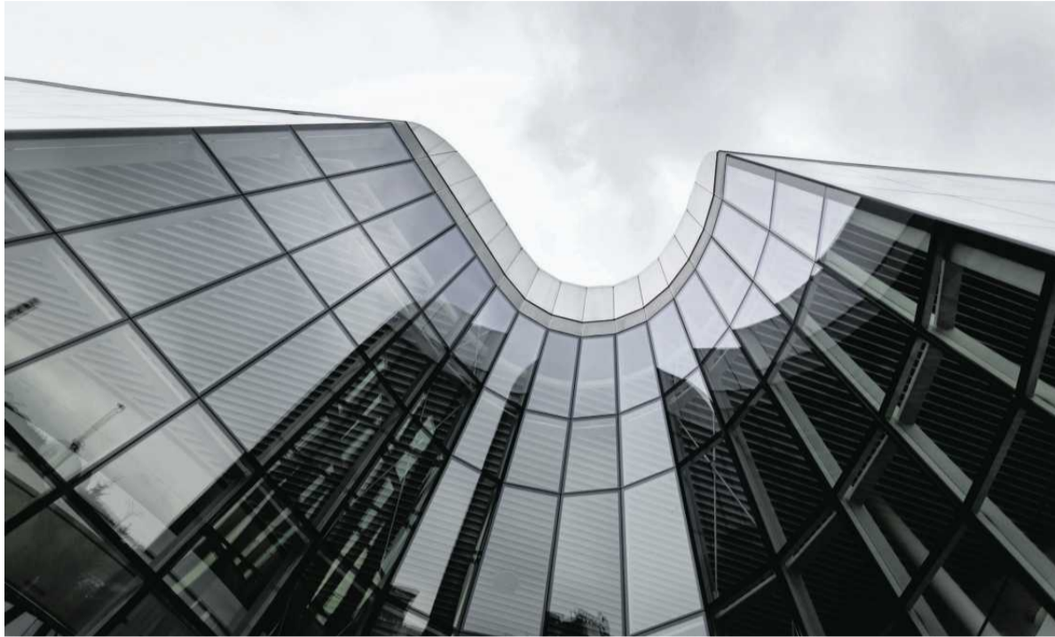
• Centrum Kongresowe ICE Krakow, ulica Marii Konopnickiej 17

Portal wpolityce.pl (należący do braci Karnowskich) zamieścił obszerne