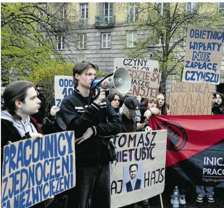
• Protest w sprawie pracowników Etno Cafe. Nawet 50 poszkodowanych osób, spółka jest im winna co najmniej 100 tys. zł

W końcu jednak pieniądze przestały wpływać na konta pracowników. – Była frustracja, ale chodzili-