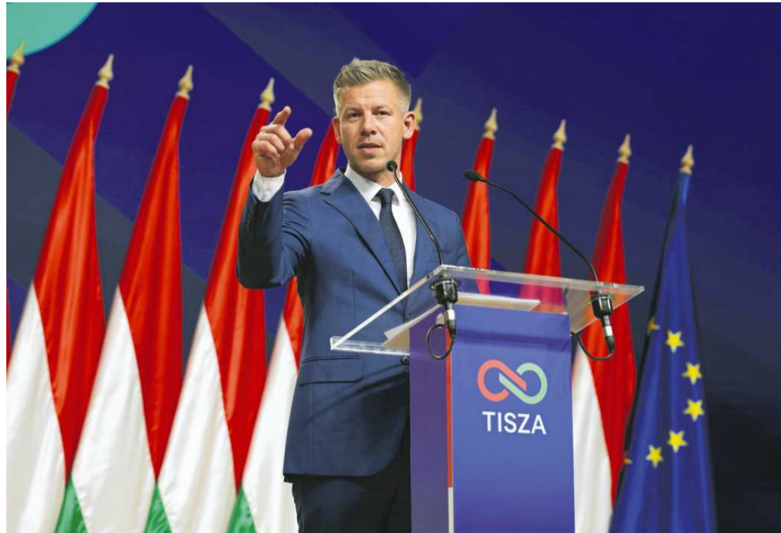
• Peter Magyar na konferencji prasowej po wyborczy zwycięstwie, 13 kwietnia 2026 r.

Po drugiej stronie sceny politycznej mieliśmy próbę odwrotną, wychylenia wahadła jeszcze mocniej w prawo. Jarosław Kaczyński, by kontrować zagrożenie ze strony Konfederacji i Konfederacji Korony Polskiej Grzegorza Brauna, namaszczył na stanowisko pisowskiego premiera skrajnościowca Przemysława Czarnka – agresywnego, dogmatycznego i „kopalnego” konserwatystę.