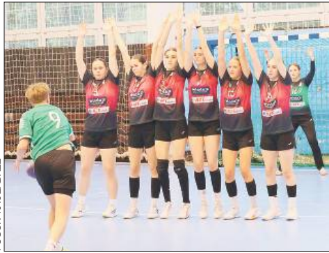
POGOŃ 1945 ZABRZE