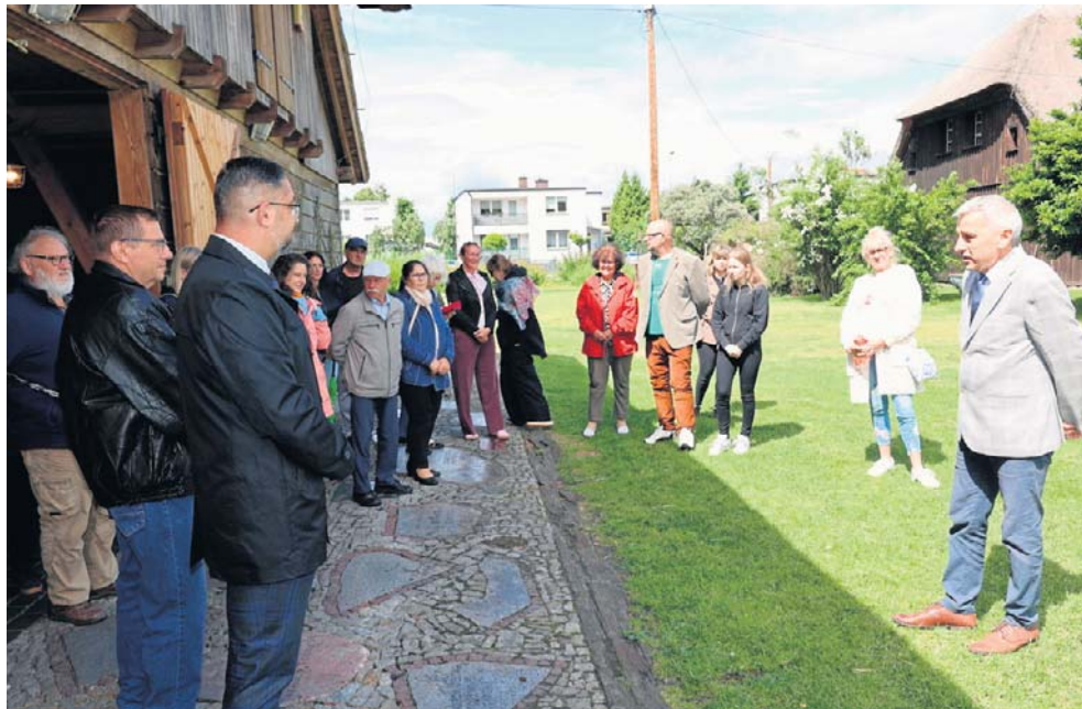
W tegorocznej edycji udział wzięło 17 uczestników