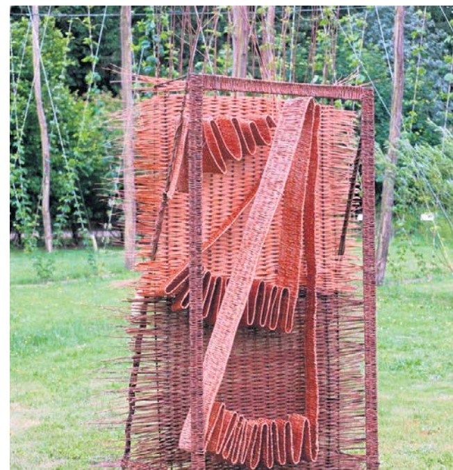
Efektom tej współpracy stało się osiem form przestrzennych