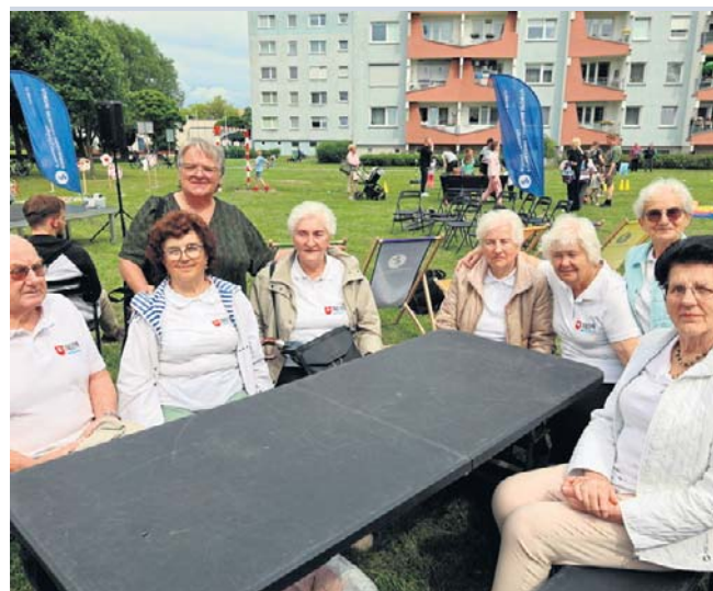
Wśród gości znaleźli się między innymi przedstawiciele środowisk seniorskich z Nowego Tomysłu i Zbąszynia

Dominika Kapalka dominika.kapalka@polskapress.pl