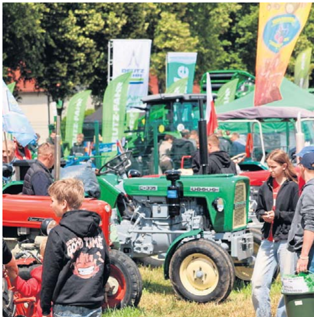
W Sielinku tradycja łączy się z nowoczesnością

Organizatorzy zadbali również o rodziny z dziećmi. Naj-