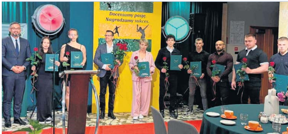
Wydarzenie było okazją do podsumowania sukcesów lokalnych sportowców

odnoszących znaczące sukcesy w swoich dyscyplinach.