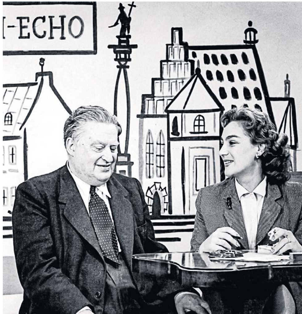
Cat szybko wskoczył w PRL-owskie realia. Zapraszano go nawet do telewizji. Romans z realnym socjalizmem skończył się w 1964 r., gdy został sygnatariuszem „Listu 34”