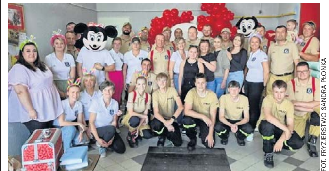
Strażacy z Bolewic po raz kolejny udowodnili, że ich działalność wykracza daleko poza akcje ratownicze

Na miejscu przygotowano również poczęstunek dla dzieci i rodziców. Dzięki temu każdy mógł znaleźć coś dla siebie i spędzić sobotnie popołudnie w miłej atmosferze. ©©