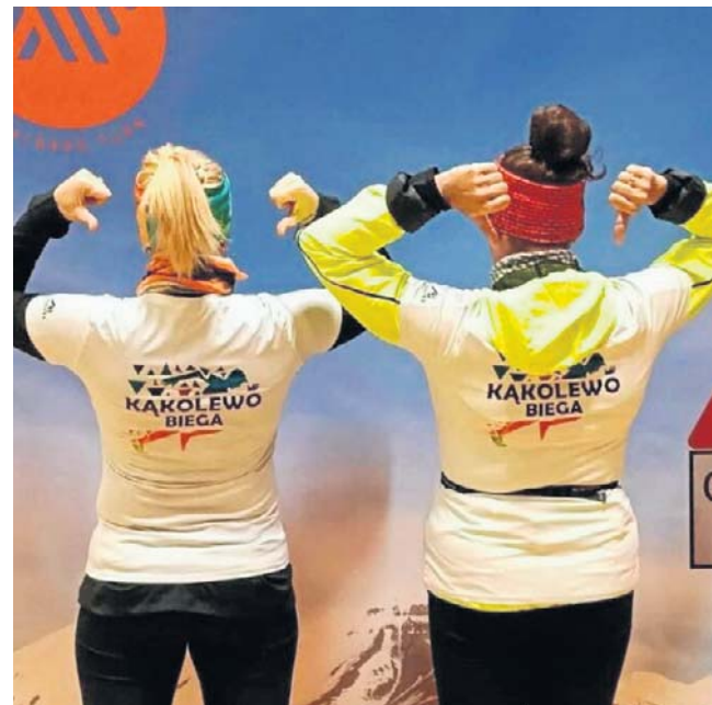
Ukończenie tak specyficznego i trudnego biegu przez reprezentantów klubu „Kąkolewo biega” to duża rzecz nie tylko dla nich samych, ale i dla lokalnego środowiska sportowego

społeczności nie brakuje ludzi z ogromną pasją, którzy nie boją się stawiać sobie poprzeczki niezwykle wysoko.