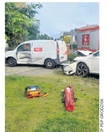
Zderzenie zostanie zakwalifikowane jako kolizja

giej i Warzywnej. - Kierowca pojazdu marki Renault, 58-letni mieszkaniec powiatu poznańskiego, nie ustąpił pierwszeństwa przejazdu i doprowadził do zderzenia z Citroenem, którym kierował 55-letni mieszkaniec powiatu grodzkiego. Na szczęście odniesione przez uczestników obrażenia okazały się niegroźne, zdarzenie zostanie zakwalifikowane jako kolizja - przekazał mł. asp. Karol Płóciniczak, oficer prasowy Komendy Powiatowej Policji w Grodzisku Wielkopolskim. ©©