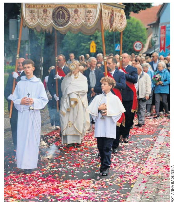
FOT. ANNA BADZIŃSKA

W Nowym Tomyszu po mszy wierni wyruszyli do ołtarzy zlokalizowanych wokół Placu Chopina. Uczestnicy modlili się i śpiewali pieśni eucharystyczne, dając świadectwo swojej wiary oraz przywiązania do lokalnych tradycji. ©©