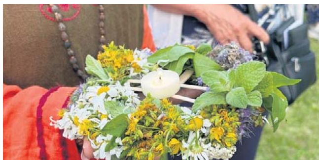
Tegoroczne „Cudawianki nad stawem” porzucają nudne schematy i stawiają na zabawę z przymrużeniem oka (zdj. ilustracyjne)

Chwilę później publiczność zostanie zaproszona na pokaz mody z epoki PRL oraz cykl występów artystycznych pod tytułem „Twoja Twarz Brzmi Znajomo w stylu PRL”. Będzie można usłyszeć największe przeboje m.in. Maryli Rodowicz, Czesława Niemena, Je-