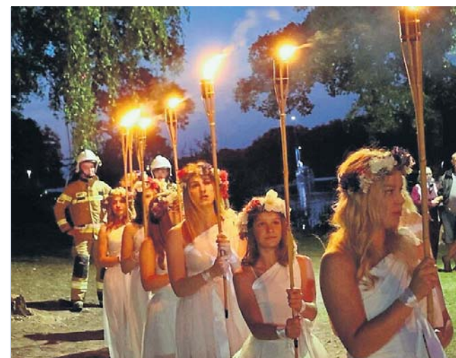
Tradycyjne wianki, muzyka i wspólna zabawa – tak świętowano ubiegłoroczną Noc Świętojańską

Zmysła o dojezdnych przygotowano również specjalny transport publiczny. Autobusy będą kursować na kilku trasach obejmujących m.in. Zbąszyń, Stefanowo, Chrośnice, Łomnice, Przyprostynię, Zakrzewo i Strzyżewo. ©©