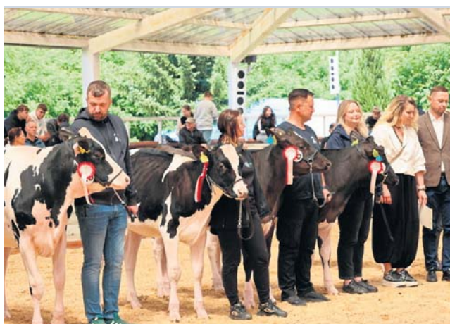
Ogromnym zainteresowaniem cieszyły się również ekspozycje zwierząt. Najlepsze nagrodzono

młodzi mogli korzystać z licznych warsztatów edukacyjnych, poznawać świat roślin, brać udział w konkursach czy spróbować swoich sił w symulatorach maszyn rolniczych.