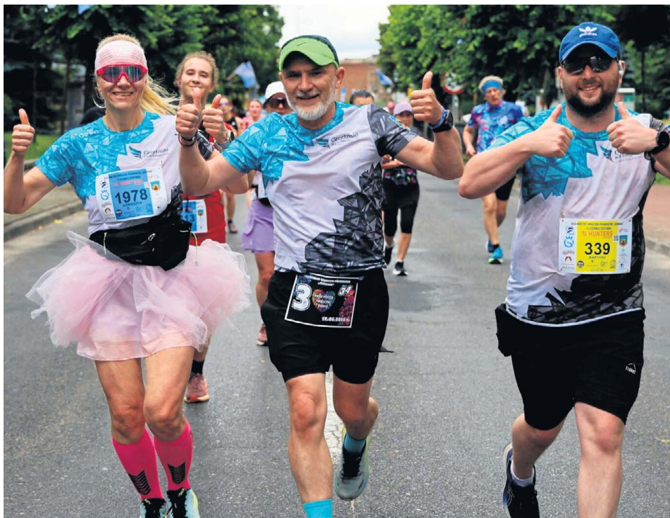
Podczas XVIII Hunters Grodzkiego Półmaratonu „Słowaka” towarzyszyliśmy zawodnikom na trasie, dokumentując ten dzień. Więcej zdjęć na www.grodzisk.naszemiasto.pl

Setki zawodników startowało z jasnym planem i wiarą we własne siły, gotowych na bicie życiowych rekordów i przekraczanie barier, które jeszcze niedawno wydawały się nie do pokonania. Szczególne wyrazy uznania należą się kibicom, którzy z nieślabnącym entuzjazmem, przez cały czas trwania biegu, wspierali absolutnie każdego uczestnika - od liderów po zamykających stawkę. Kreatywność nie