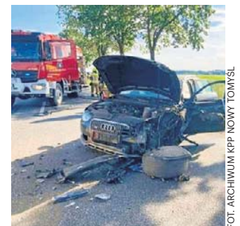
Kierująca zjechała na przeciwległy pas ruchu i uderzyła w prawidłowo jadący pojazd ciężarowy marki DAF,

Policja przypomina kierowcom o zachowaniu szczególnej ostrożności na drogach, zwłaszcza na ruchliwych trasach krajowych, gdzie nawet chwila nieuwagi może doprowadzić do niebezpiecznych sytuacji. ©©