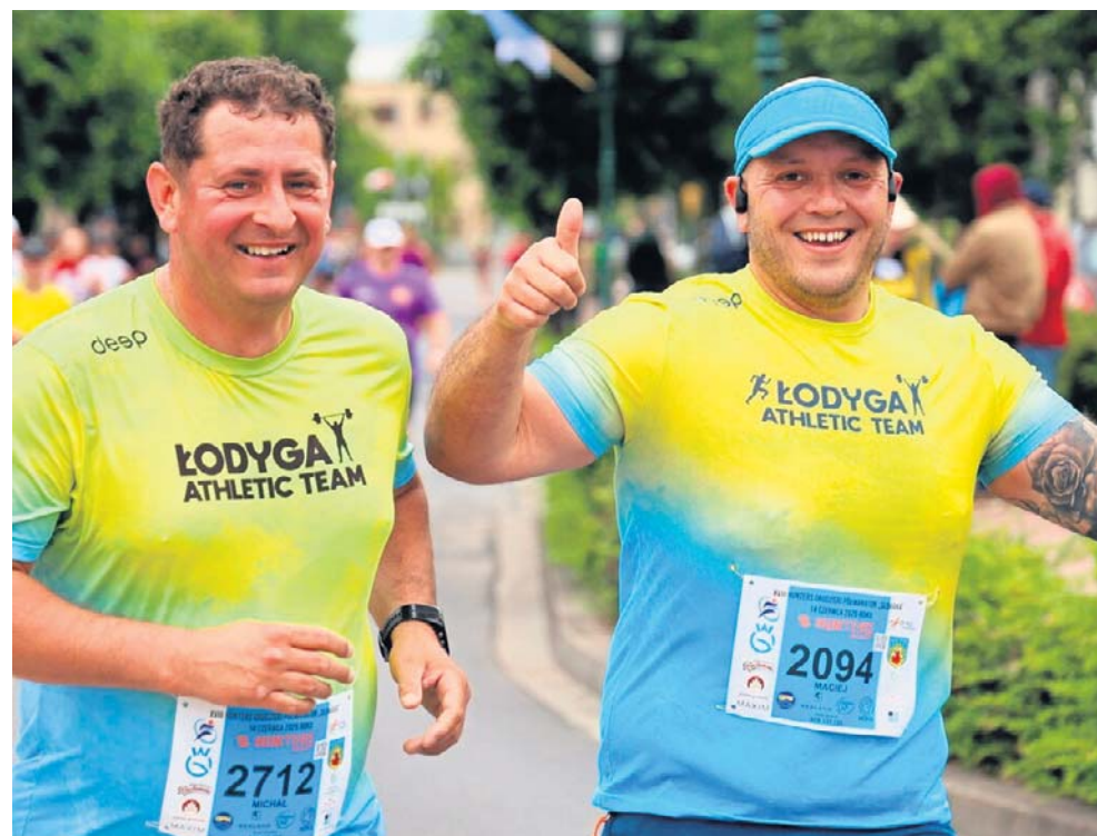
Zawodnicy ruszyli na ponad 21-kilometrową trasę z pełną determinacją, gotowi na bicie własnych rekordów

Wszyscy uczestnicy, bez względu na zajęte miejsce i wywalczony czas, opuszczali Grodzisk Wielkopolski z uśmiechem na twarzy i poczuciem dobrze spełnionego obowiązku, deklarując szybki powrót za rok.