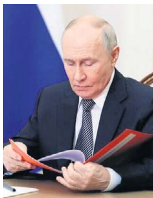
Do Putina docierają jedynie wybrane informacje

- Było tak. Powiedzmy, że o 20.00 na antenie szło zwykłe wydanie „Więsti”, po czym ekipa produkcyjna zostawała. Cóż, mieliśmy oczywiście wytyczne,