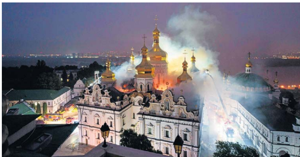
Prawosławna Ławra Peczerska stanęła w płomieniach po uderzeniu dronem. Według dyrekcji klasztoru ikony i inne cenne przedmioty udało się uratować

Reuters zaznacza, że atak nastąpił wkrótce po rozmowie