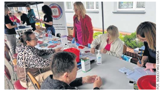
Regularne badania to najskuteczniejsza broń w walce z chorobami cywilizacyjnymi

- Serdecznie dziękuję wszystkim za poświęcony czas, profesjonalizm, zaangażowanie oraz udzielanie fachowych porad dotyczących zdrowia.