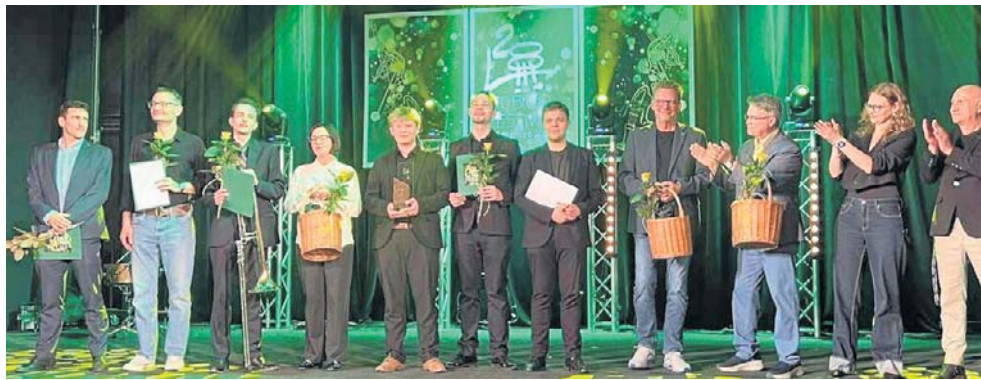
Po wysłuchaniu wszystkich występów jury wyłoniło laureatów tegorocznej edycji. Gratulujemy

Po koncercie gwiazdy wieczoru rozpoczęły się przesłuchania konkursowe, podczas których na scenie zaprezen-