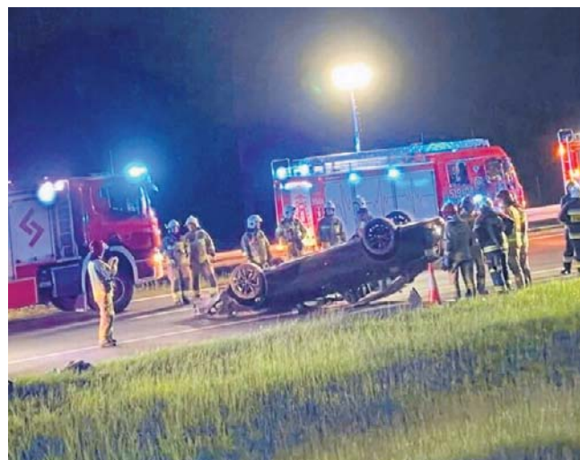
Groźnie wyglądające zdarzenie spowodowało duże utrudnienia dla kierowców podróżujących autostradą A2 w kierunku Świecka

Groźnie wyglądające zdarzenie spowodowało duże utrudnienia dla kierowców podróżujących autostradą A2 w kierunku Świecka. Na czas działań służb ruch został całkowicie zablokowany, a na trasie zaczęły tworzyć się korki. Strażacy, policjanci oraz służby autostradowe przez kilkadziesiąt minut prowadzili działania