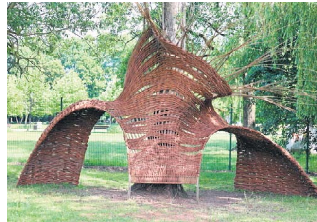
Powstające od lat dzieła można podziwiać na terenie przy muzeum