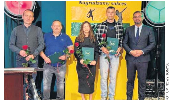
Laureatom życzą kolejnych medali, sportowych wyzwań oraz nieustającej pasji

Podczas uroczystości nie zapomniano również o trenerach, którzy każdego dnia wspierają zawodników w rozwijaniu talentów i osiąganiu kolejnych sukcesów.