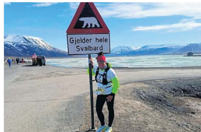
Na trasie biegu trzeba uważać nie tylko na skurcze mięśni, ale i na... niedźwiedzie. To najdalej wysunięty na północ bieg tej rangi na świecie. 78 stopni szerokości geograficznej północnej

Ukończenie tak specyficznego i trudnego biegu przez reprezentantów klubu „Kąkolewo biega” to duża rzecz dla lokalnego środowiska sportowego. Pokazuje, że amatorska pasja, która na co dzień jednocy mieszkańców naszej gminy na ścieżkach wokół Grodziska, potrafi zaprowadzić ich na sam kraniec świata. To też najlepszy dowód, że w naszej lokalnej