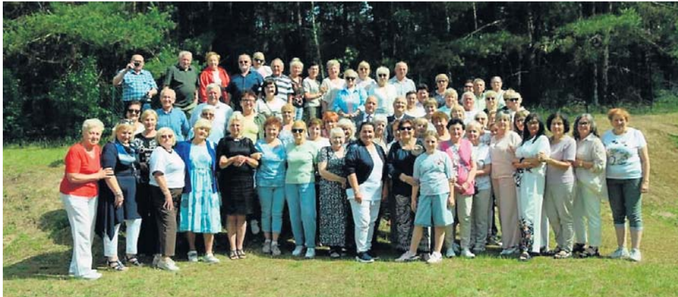
Zakończenie roku akademickiego Uniwersytetu Trzeciego Wieku odbyło się w podgrodziskim Zdroju

Sluchacze Grodzkiego Stowarzyszenia Uniwersytetu Trzeciego Wieku oficjalnie podsumowali i zakończyli rok akademicki 2025/2026. Uroczystość, która odbyła się w poniedziałek, 8 czerwca, udowodniła, że grodzki UTW to nie tylko instytucja edukacyjna, ale przede wszystkim bezcenna przestrzeń dla seniorów, która dla wielu z nich stała się początkiem nowego, pięknego rozdziału w życiu.