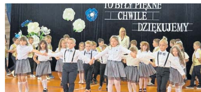
Czas spędzony w przedszkolu minął jak jedna chwila

Przedszkolne sale, wspólne posiłki i ulubione zabawki ustąpią teraz miejsca szkolnym korytarzom, zeszytom i nowym obowiązkom. Życzymy powodzenia. ©©