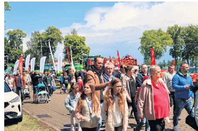
Tegoroczna edycja targów rolniczych odbyła się w wyjątkowym roku – 70-lecia państwowego doradztwa rolniczego w Wielkopolsce

Nie brakowało również dobrego jadła. Kulinarna Strefa Wielkopolski przyciągnęła mi-