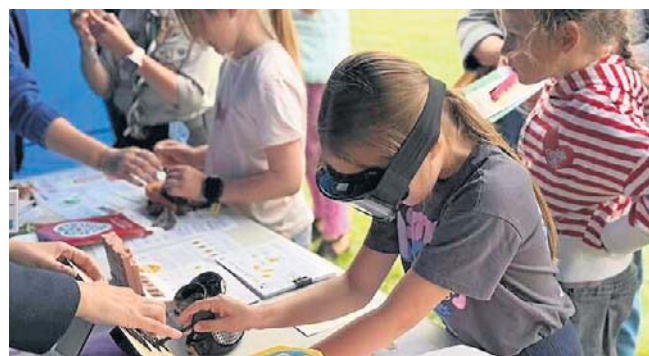
Wspólna zabawa przyciągnęła całe rodziny. Organizatorzy zadbali o atrakcje dla dzieci, młodzieży, dorosłych i seniorów

Na Górcie Osiedlowej w Nowym Tomysłu odbyło się w środę wyjątkowe wydarzenie integrujące mieszkańców w każdym wieku. Festyn rodzinny „Od przedszkola do seniora” przyciągnął dzieci, młodzież, rodziców oraz seniorów, którzy wspólnie spędzili popołudnie pełne zabawy, aktywności sportowych i edukacyjnych.