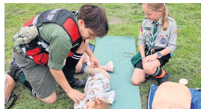
Na miejscu prowadzono także pokazy i naukę udzielania pierwszej pomocy

Epidemiologicznej w Nowym Tomysłu, Komendy Powiatowej Policji oraz Powiatowego Centrum Pomocy Rodzinie. Za organizację wydarzenia odpowiadało kilka instytucji i organizacji, m.in. gmina Nowy Tomysłu, PCPR, Powiat Nowotomyski oraz Hufiec ZHP Nowy Tomysłu im. Emilii Sczanieckiej. Włączyli się również partnerzy: KP PSP, Policja, PCS, ośrodek kultury, sanepid oraz Spółdzielnia Mieszkanio-wa w Nowym Tomysłu. ©©