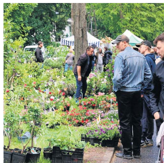
Podczas imprezy można też było zakupić rośliny

łośników regionalnych smaków, przygotowanych zgodnie z ideą slow food. Na stoiskach swoje produkty prezentowały koła gospodyń wiejskich, lokalni producenci i wielkopolscy winiarze.