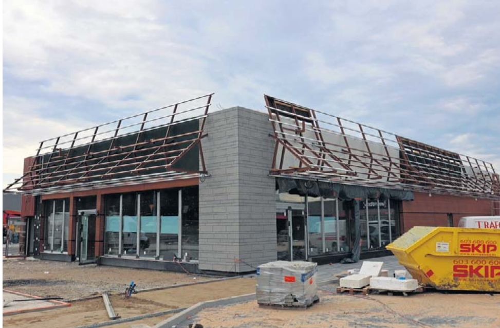
Prace budowlane są już bardzo zaawansowane, a obiekt nabiera ostatecznego kształtu

Nowotomyski N-Park od momentu otwarcia cieszy się dużym zainteresowaniem