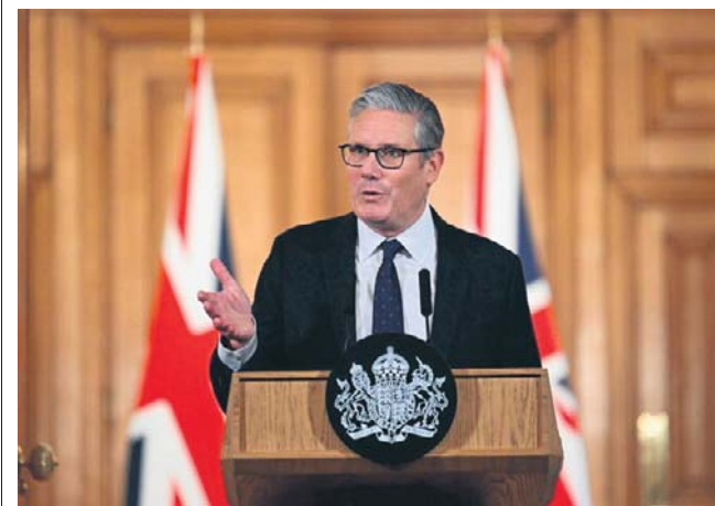
Jak powiedział Starmer, regulacje mają wejść w życie na początku przyszłego roku, prawdopodobnie wiosną

Ofcom, brytyjski regulator ds. mediów, ma teraz przeprowadzić badania na temat najbardziej efektywnego sposobu weryfikacji wieku użytkowników.