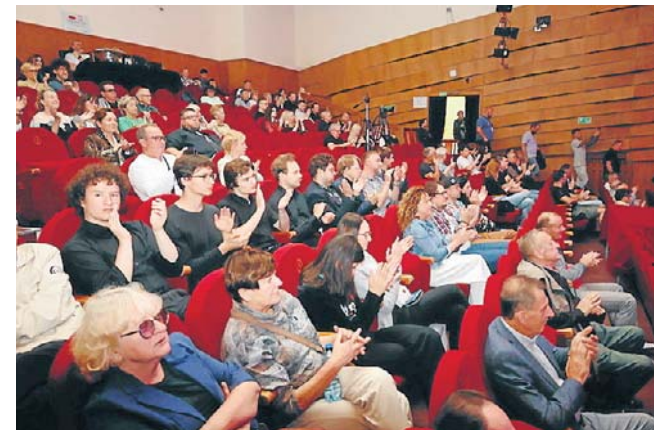
Big Band Festiwal od lat pozostaje jednym z najważniejszych wydarzeń muzycznych w Nowym Tomysłu

Po wysłuchaniu wszystkich występów jury wyłoniło laure-