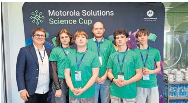
Za tą wciągającą rozgrywką kryją się setki godzin spędzonych na programowaniu, projektowaniu oraz testowaniu kodu

Drużyna z Zespołu Szkół Technicznych udowodniła, że w dziedzinie nowoczesnych technologii i programowania nie ma sobie równych w całym kraju. Ich autorski projekt gry poświęconej cyberbezpieczeństwu zachwycił ekspertów z branży IT i przyniósł im zwycięstwo w konkursie Motorola Solutions Science Cup. To spektakularne osiągnięcie to efekt trzech miesięcy ciężkiej pracy.