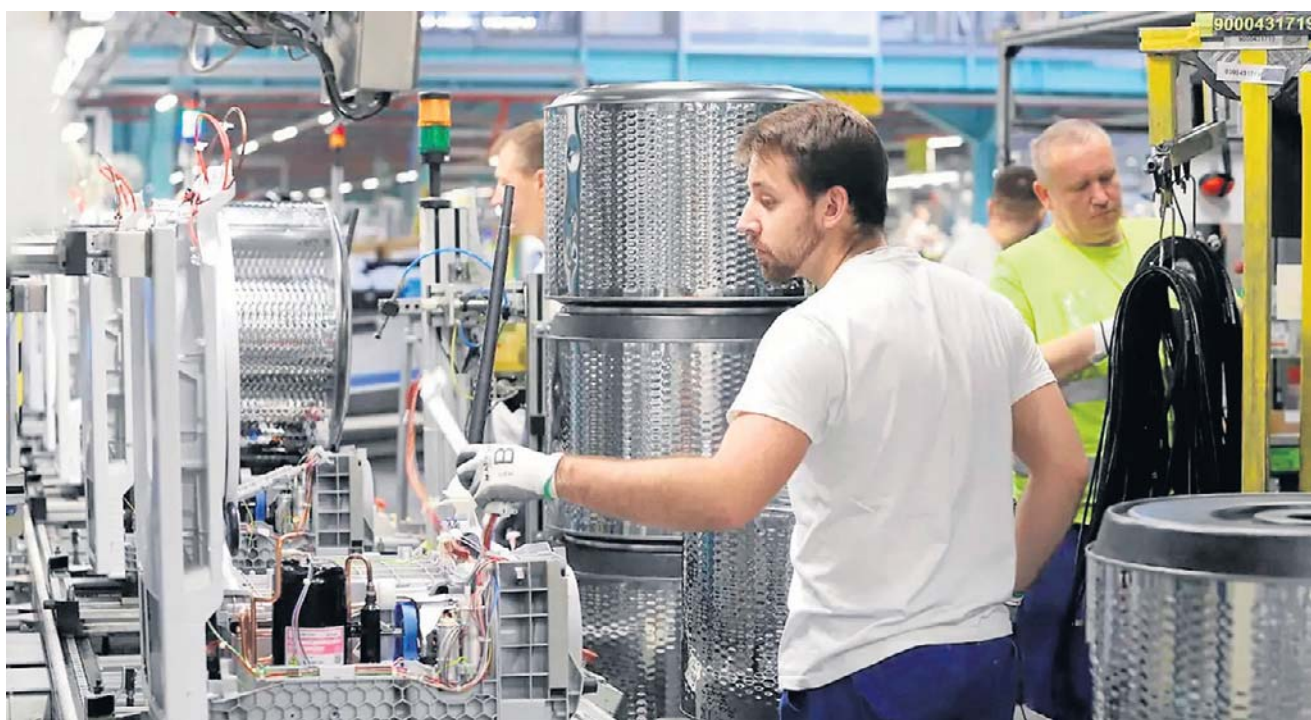
Rząd zaproponował, aby minimalne wynagrodzenie za pracę w 2027 r. wynosiło 4950 zł brutto