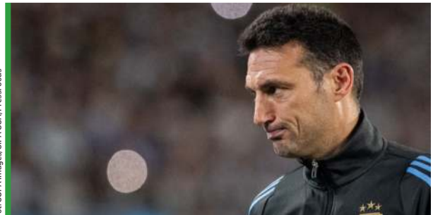
Trener Argentyny, Lionel Scaloni jest spokojny przed mundialem.

■ Argentyna - Honduras 2:0 (1:0) 1:0 - Martinez (37), 2:0 - Simeoni (54)