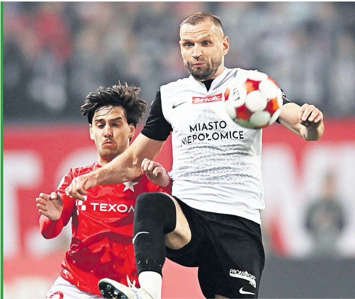
Kto by pomyślał, że człowiek z Podlasia tak dobrze odnajdzie się w małopolskiej Puszczy?

– To przyszło z czasem. To znaczy ja byłem cały czas taki sam, ale swoim zachowaniem z dnia na dzień zdobywałem zaufanie kolegów z szatni, sztabu trenerskiego, działaczy. Wszyscy muszą cię zaakceptować, a ty musisz pokazać charakter