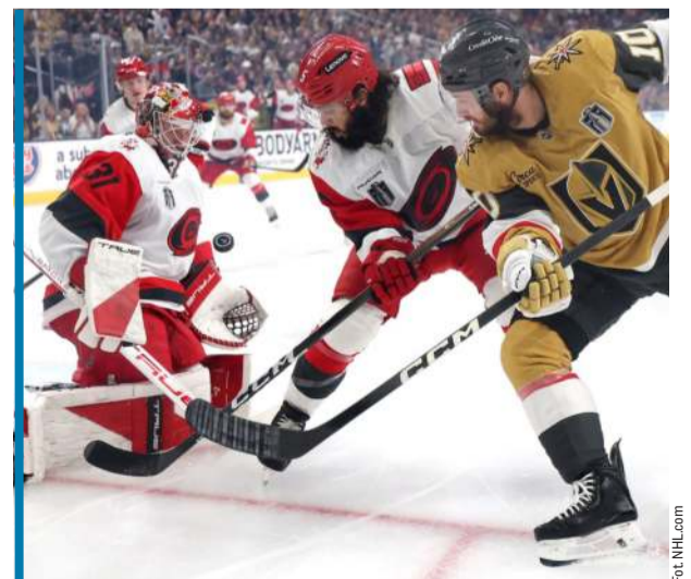
Od 4:0 do 4:4 w regulaminowym czasie. O wygranej Vegas zdecydował gol w 86 min.

1:0 - Hertl - Eichel - Marner (30:26, w przewodzie), 2:0 - Marner - Karlsson - Theodore (30:42), 3:0 - Marner - McNabb (34:32), 4:0 - Marner - Hertl (36:52), 4:1 - Martinook - Jarvis - Stankoven (47:03), 4:2 - Hall - Aho - Blake (47:29), 4:3 - Staal - Slavin - Robinson (47:42), 4:4 - Swiecznikow - Staal - Aho (48:18, 6 na 4), 5:4 - Theodore - McNabb - Howden (85:38). Kary: Vegas - 4 min, Carolina - 4 min.