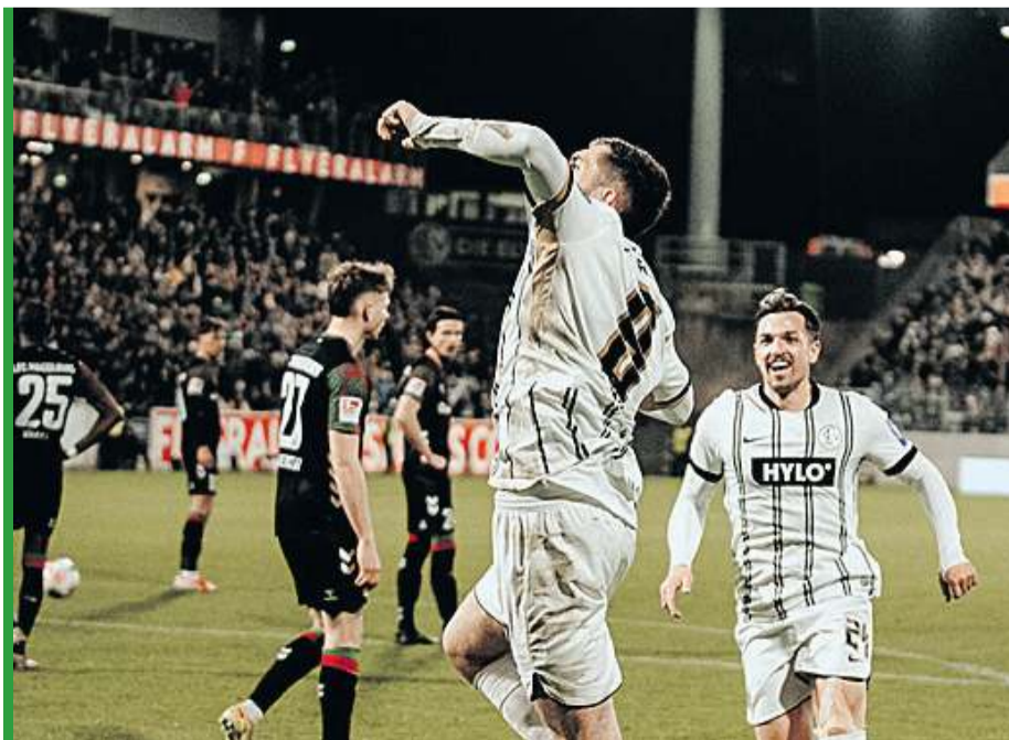
26-latek z Legnicy (w wyskoku) to niezastąpiona postać w szeregach Elversberga.