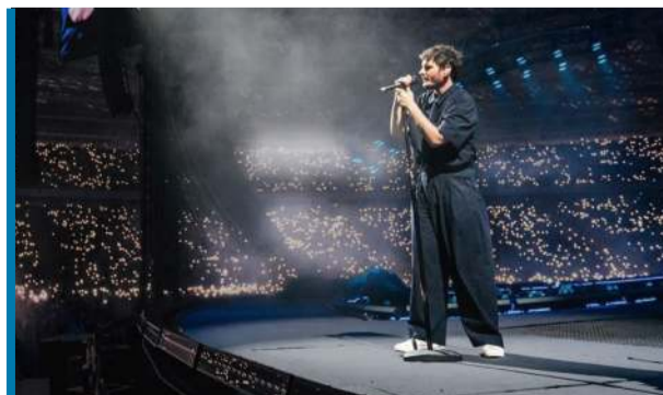
Wszyscy Maję znają i kochają...