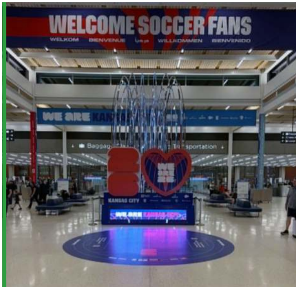
Kibice soccera już są witani w Kansas City.

Każde z 16 miast, gdzie rozegranych zostanie 104 mecze amerykańskiego mundialu, na swój sposób przygotowuje się do tego, co będzie w czerwcu i lipcu. Nie inaczej jest w Kansas City, w stanie Missouri. To region Midwest na amerykańskiej mapie, rejon interioru. Na miejscowym Arrowhead Stadium zostanie rozegranych sześć meczów MŚ. Zagrają tam między inny-