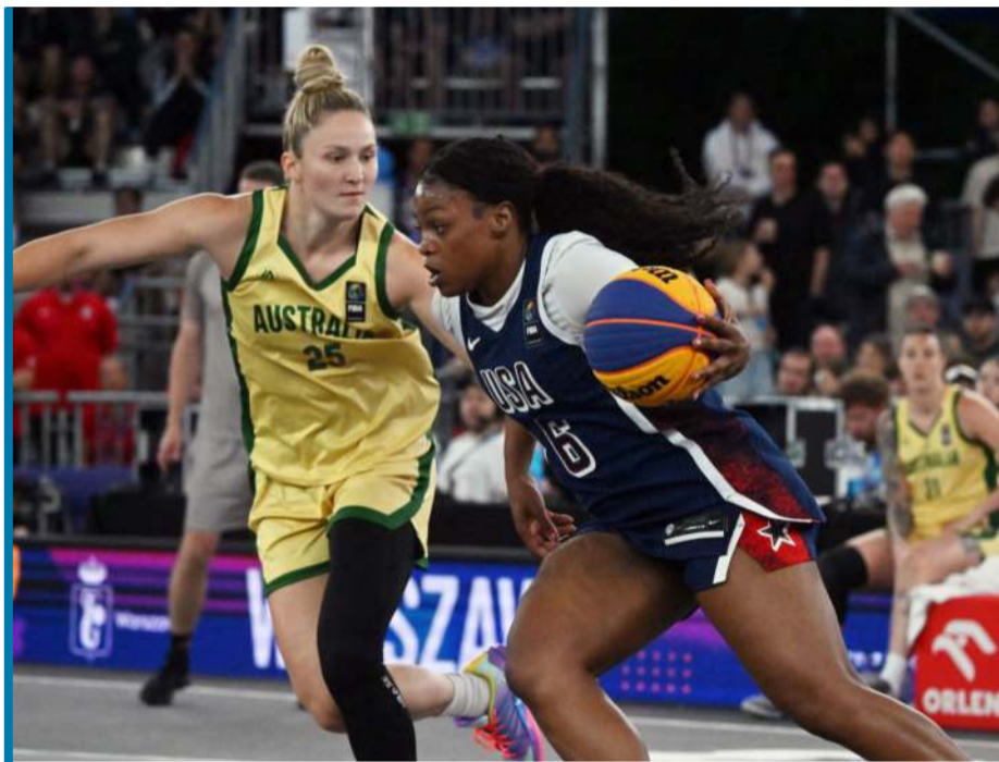
W finale turnieju kobiet Amerykanki lepsze od Australijek.