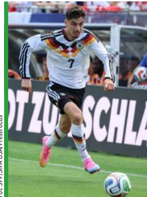
Selekcjoner liczy na Kaię Havertza.

Jedynym, który na 99 procent wtedy nie zagra, jest bramkarz Oliver Baumann. W sparingach – wcześniej z Finlandią – golkeeper Hoffenheim stanął między słupkami, bo uraz leczył Manuel Neuer. Piłkarz Bayer-