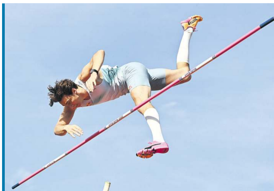
Armand Duplantis przegrał konkurs skoku o tyczce po raz pierwszy od trzech lat.

Kolejny mityng Diamentowej Ligi odbędzie się 10 czerwca w Oslo.