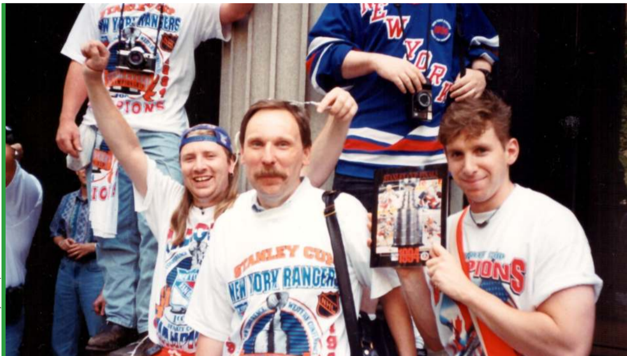
Koszulka dawno wyblakła i sprana już nie istnieje, ale zdjęcie pozostało. Tego dnia byłem kibicem Rangersów.

P odróż przez mundialową Amerykę rozpocząłem w połowie czerwca 1994 roku w Nowym Jorku. Nie można było więc zacząć tej przygody inaczej niż od meczu Włochy – Irlandia w tymże mieście. Jej kresem miał być finał w Los Angeles. Widziałem na żywo 11 meczów (z 52) na pięciu (z dziewięciu) stadionach – więcej widzieli... koledzy w redakcji, bo przecież na miejscu drugiego spotkania tego samego dnia nie dało się obejrzeć nawet w telewizji. Głównie w hiszpańskojęzycznej, bo amerykańskie stacje nie zanudzały widzów obcym jeszcze wówczas w USA i pogardzanym „soccerem”.