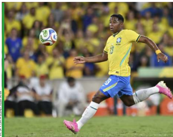
Endrick zyskał zaufanie Carlo Ancelottiego.

W najbliższy weekend, w nocy z soboty na niedzielę czasu polskiego, Brazylia zagra pierwszy mecz na mistrzostwach świata – z Marokiem. Podopieczni Carlo Ancelottiego na finiszu przygotowań rozegrali sparing z Egiptem, który zakończył się ich wygraną 2:1. Mimo zwycięstwa było kilka niedociągnięć w poczynaniach Canarinhos. Przede wszystkim brakowało skuteczności. Mecz powinien zakończyć się znacznie wyższym rezultatem, bo w pierwszej połowie okazji na gole mieli mnóstwo. Tymczasem po 45 minutach było 1:1, co... wzbudziło w brazylijskich mediach pewne obawy, ponieważ był to piąty mecz z rzędu, w którym Brazylijczycy stracili co najmniej jednego gola, a mierzyli się w tym czasie m.in z Tunezją (1:1) i Panamą (2:6), przeciwko którym utrzymanie