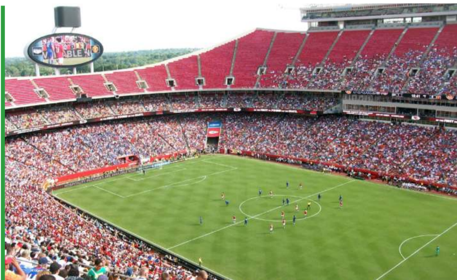
Arrowhead Stadium w Kansas City należy do... najgłośniejszych w NFL.

nie - w New Jersey. Podobnie jest ze stadionem w Dallas, który nie jest zlokalizowany tam, ale w Arlingtonie. W materiałach pojawia się nazwa „Dallas Stadium” co wzbudziło protest... Japończyków. – W Japonii traktujemy geograficznie poważnie. Studiujemy ją uważnie przez całą ósmą klasę. To nie jest tylko zamieszanie. To geograficzne przywiązanie. W Japonii, gdy mówimy Kioto, to jest Kioto. To nie jest „zasadniczo