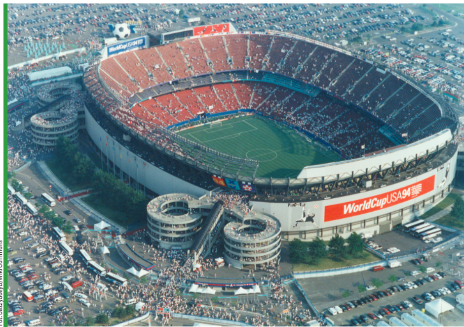
Gigantyczny stadion Gigantów już nie istnieje. Zburzono go w 2010 roku, budując tuż obok MetLife Stadium, na którym odbędzie się finał tegorocznego mundialu.

z Przeglądu Sportowego ostrzegł mnie: „Nie wychodź, tam jest piekło!” Miał rację, w Nowy Jorku było tego dnia 100 stopni Fahrenheita (około 40 na nasze Celsjusze), czyli cieplej niż w Miami. Miejscowi pocieszali siebie i nas, że w Dolinie Śmierci w Kalifornii zmierzono aż 109. Na widowni był taki sam upał, ale dało się wytrzymać przy VIP-owskich łóżkach, gdzie przez otwarte drzwi docierał do najbliższych rzędów miły wiaterek pracującej na pełnych obrotach klimatyzacji. Liza Minelli, śpiewając na powitanie widzów i drużyn „New York, New York”, stała na środku boiska otoczona wielkimi dmuchawami, piłkarze nie mieli jednak takiego komfortu. Bardzo długo trwały dyskusje, czy wolno będzie