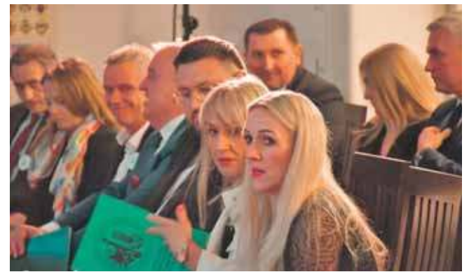
Zainteresowanie benefisem było tak duże, że odbyły się dwa spotkania

Szkoła została założona w 1945 roku. Na przestrzeni lat zmieniały się kierunki nauczania, gdyż rozpoczęto kształcenie w zawodach nierolniczych. Od stycznia 2008 roku szkoła prowadzona jest przez Ministerstwo Rolnictwa i Rozwoju Wsi, w związku z czym Zespół Szkół Agroekonomicznych i Ogólnokształ-