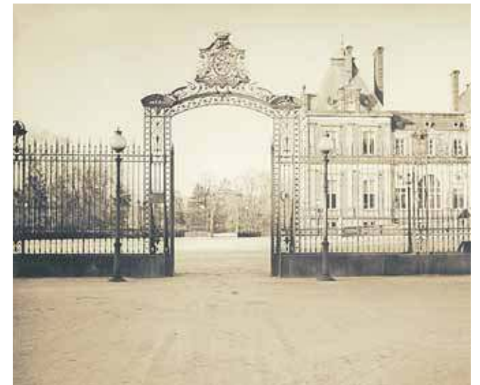
Ogrodzenie wraz z bramą, która ma trafić do Świerklańca