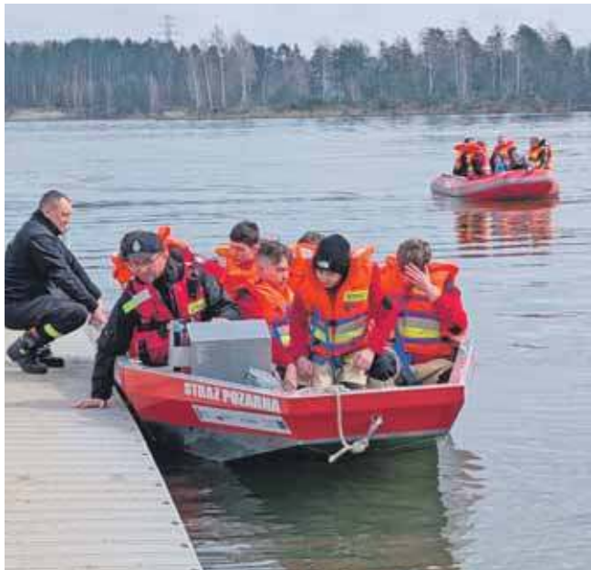
Atrakcją była między innymi przejażdżka łodzią