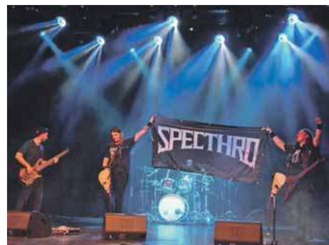
Koncert zespołu Specthro

W tym roku grupa zamierza wydać dwie płyty.