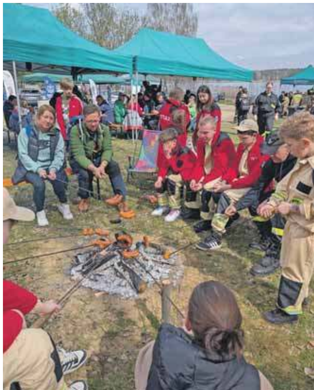
Na koniec ognisko

Atrakcją sobotniego spotkania była przejażdżka łodzią motorową i ognisko z pieczeniem kielbasek. (EKA)