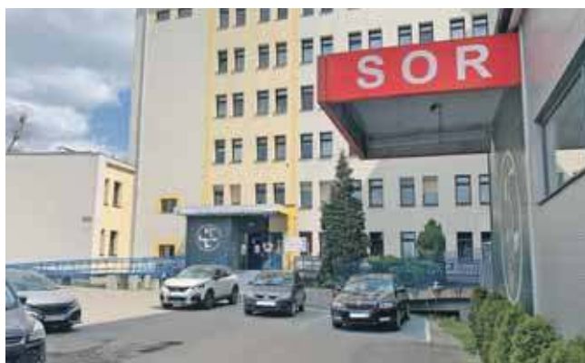
Od kwietnia w nocy i w święta można skorzystać z opieki pielęgniarskiej w szpitalu

Od początku kwietnia w nocy, w dni wolne i święta można też skorzystać z opieki pielęgniarki w dodatkowym punkcie, który uruchomiono w szpitalu powiatowym w Tarnowskich Górach przy ul. Pyskowskiej. W „Trójce” w ramach nocnej i świątecznej opieki zdrowotnej można