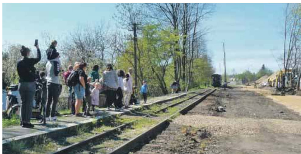
1 maja rusza kolej wąskotorowa na trasie Bytom – Tarnowskie Góry

Nie zabraknie też popularnej w minionym sezonie