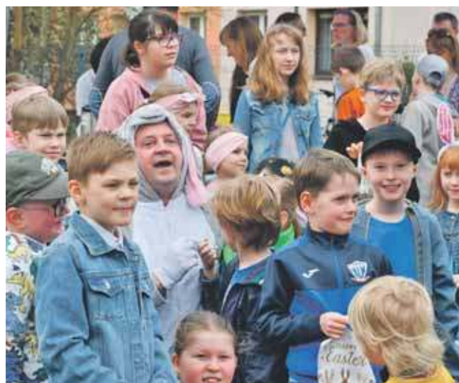
W poszukiwaniach pomagał Wielkanocny Zając

– Integracja mieszkańców i dobra zabawa to główne cele takich wydarzeń – pod-