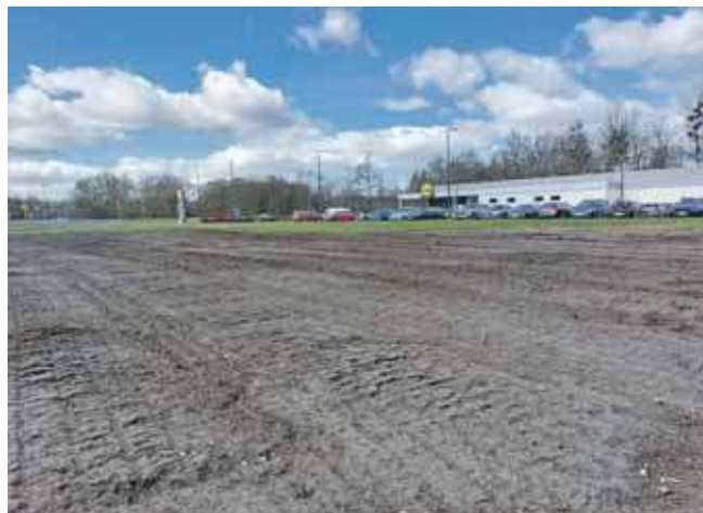
Restauracja McDonald`s ma powstać między marketem Lidl a stacją paliw w Świerklańcu

Roboty budowlane muszą być rozpoczęte przed upły-