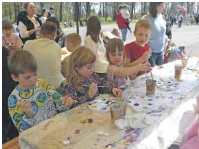
Zorganizowano także warsztaty