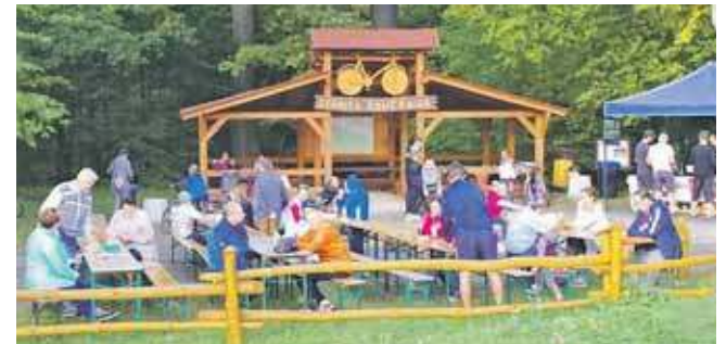
Stacja rowerowa w Truszczy. Konstrukcja wszystkich kaletańskich stanic jest podobna: zadaszenie, ławy, stoły, stojaki na rowery, do tego mapa z atrakcjami okolicy oraz mobilna stacja naprawy rowerów

Przy każdej z trzech kaletańskich stanic rowerowych zorganizowano różne atrakcje. Przy Stacji Donnersmarcka był m.in. ener-