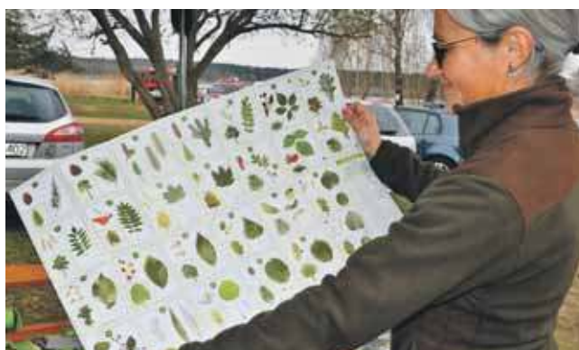
Nadleśnictwo Świerklaniec rozdawało materiały edukacyjne