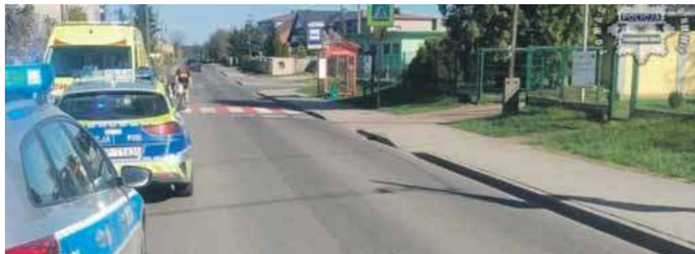
Mężczyzna trafił do szpitala