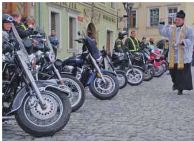
W sobotę o godz. 15 będzie święcenie motocykli na rynku w Tarnowskich Górach