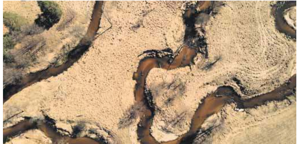
Niedaleko miejsca, gdzie powstanie stacja w Drutarni, można oglądać meandry Małej Panwi

– Wykorzystujemy warunki naturalne Kalet i polityka promowania miasta jako przyjaznego rowerzystom sprawdza się od kilku lat. Zależy nam na tym, żeby ruch rowerowy w powiecie tarnogórskim skupić na terenie Kalet, temu mają służyć te stacje. Przybywa turystów, słyszę głosy przedsiębiorców, że dzięki temu lepiej mają się restauracje i sklepy spożywcze – powiedział wtedy burmistrz Kandzia.