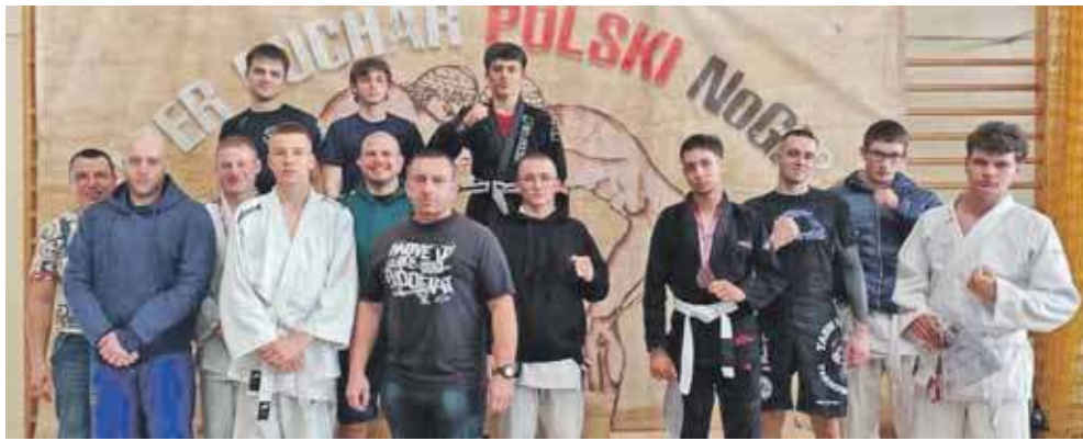
Zawodnicy TASW Budokan Tarnowskie Góry zdobyli łącznie 30 medali – 17 w kategorii seniorów i 13 w kategorii młodzieżowej.

W Siewierzu odbył się Super Puchar Polski w Brazylijskim Jiu Jitsu. Zawody miały dwie odsłony: 29 marca dla seniorów, a tydzień później dla dzieci i młodzieży.