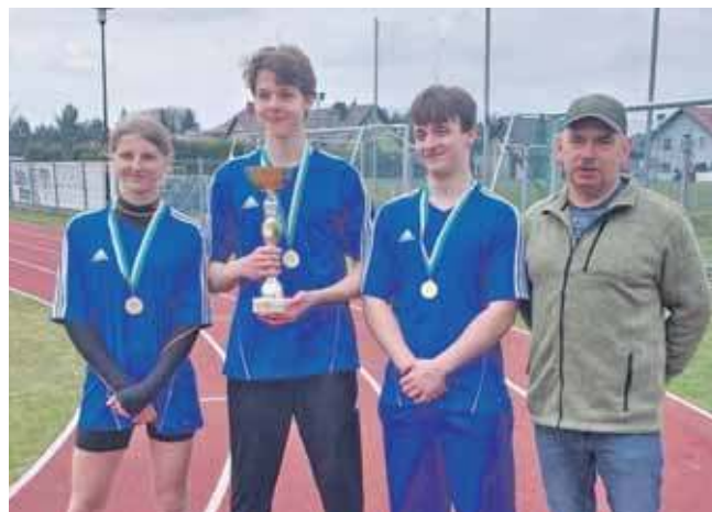
Czwartą konkurencją wieloboju sołectw gminy Zbrostawice był trójbój lekkoatletyczny.

Po 4 konkurencjach wieloboju prowadzi Zbrostawice, drugie jest Przechlebkie, a trzecia Wieszowa. Na czwartym miejscu z taką samą ilością punktów są Czekanów i Miedary. (ESP)