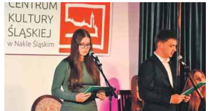
Wieczór wspomnień, który odbył się w pałacu w Nakle Śląskim, historycznej pierwszej siedzibie szkoły rolniczej, przyciągnął liczną grupę absolwentów i przyjaciół szkoły