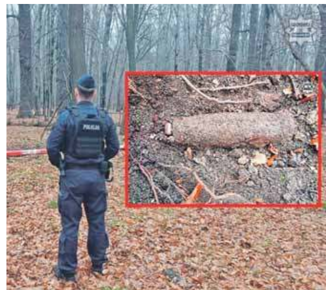
Służby szybko potwierdziły, że są to pociski artyleryjskie