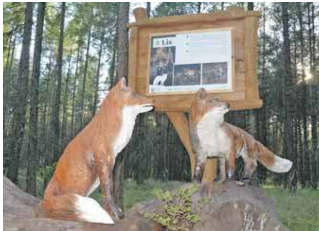
Przy Stacji Myśliwskiej jest ścieżka edukacyjna na temat zwierząt leśnych

– Wzrost ruchu rowerowego w Kaletach poniekąd zmusił nas do tego, żeby stworzyć naszym mieszkańcom i turystom, którzy jeżdżą po duktach leśnych, miejsca, gdzie rowerzysta może odpocząć, zjeść posiłek, naprawić rower, a także spotkać się z innymi rowerzystami i wy-