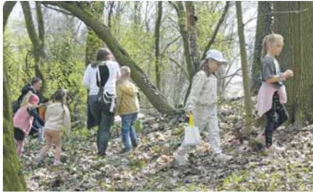
Były dwie tury szukania jajek niespodzianek

Szkoda, bo organizatorzy bardzo się starali, żeby dzieci świetnie się bawiły, a niestety znaleźli się tacy, którzy bawić się nie umieją, bo jak coś jest za darmo... Jednak szukanie jajek nie było jedyną atrakcją szafowego pikniku. Zorganizowano m.in. warsztaty kreatywne dla dzieci i czytanie bajek. Nie zabrakło również dmuchańca. (ESP)