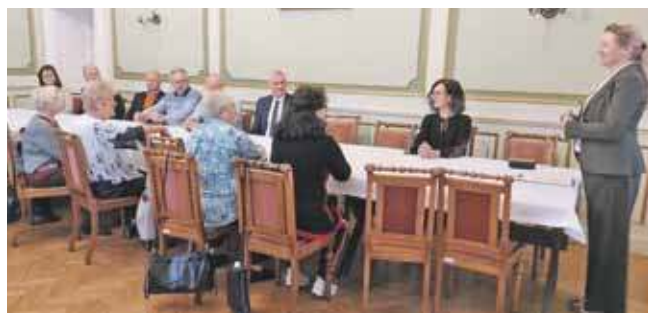
Oficjalne otwarcie było w Pałacu Kawalera w Świerklańcu, ale klub seniora działa w Orzechu

Pomocna Dłoń działa przy ul. Wieczorków 41 w Orzechu, w godz. 8-15. To miejsce dla mieszkańców gminy Świerklańiec, którzy skończyli 65 lat, chcą być aktywni, spotykać się oraz korzystać z różnorodnych form wsparcia.