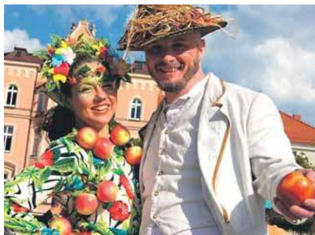
Wybory Pięknej z Rept organizowane są po raz czwarty. Tak było dwa lata temu

W okresie powojennym sadzona była także w Niemczech, ale na niewielką skalę. Aktualnie można ją traktować jako odmianę lokalną,