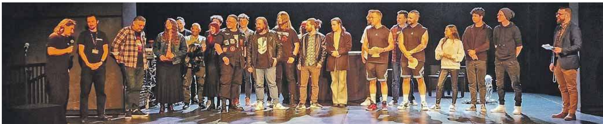
Za zajęcie pierwszego miejsca w przeglądzie Srebrny Longplay zespół nagrywa płytę