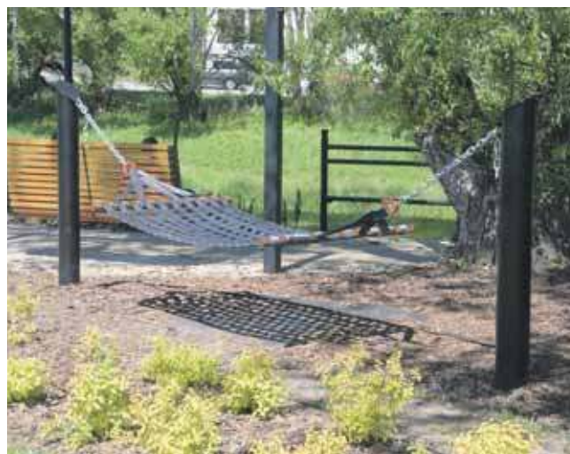
Na bulwarze można korzystać z hamaków

Nieopodal znajdziemy przystanek dydaktyczny „Ptasie kwatery – czyli kto tu mieszka”. To drewniana konstrukcja z ośmioma bud-