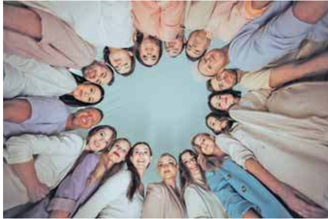
Gwiazdą sobotniego wieczoru będzie zespół Sound`n`Grace