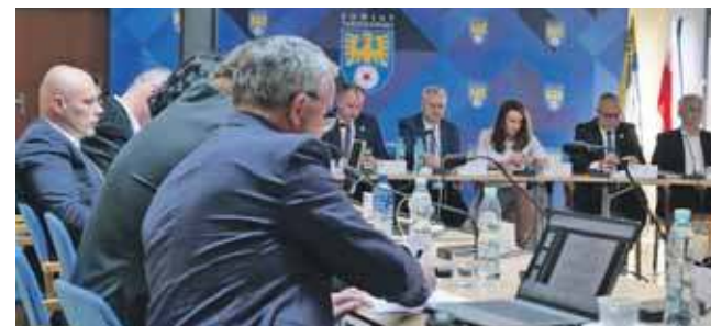
Powiat przeprowadził dotychczas dziewięć edycji budżetu partycypacyjnego. Najczęściej mieszkańcy głosowali na inwestycje drogowe