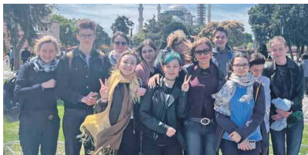
Erasmus+ i Zespół Szkół Artystyczno-Projektowych w Tarnowskich Górach – w ramach unijnego programu uczniowie pojechali do Turcji

Był też czas na zwiedzenie Stambułu, w tym Błękitnego Meczetu i Hagii Sophii, zakupy na tradycyjnych tureckich bazarach czy rejs po wodach Bosforu. Uczestnicy wyjazdu podkreślają turecką gościnność. (ESP)