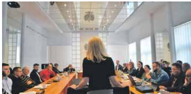
Głos zabrała też przedstawicielka rady rodziców Zespołu Szkolno-Przedszkolnego w Potępie