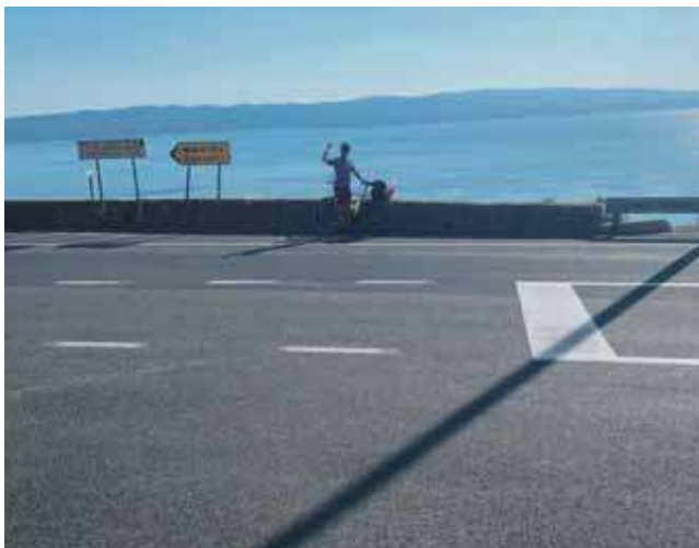
Przez Chorwację mieszkańcy Krupskiego Młyna jechali trzy dni