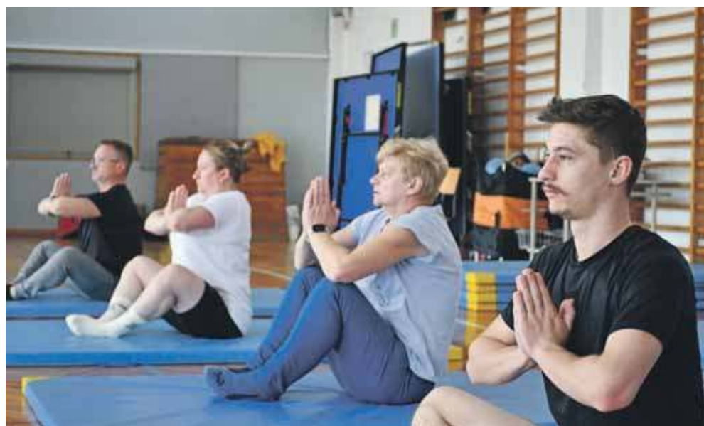
Poświęćmy czas na ruch, bo jest on nam potrzebny

W powszechnej opinii utrwaliło się przekonanie,