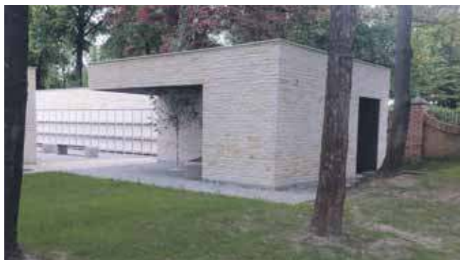
W kwietniu zostało oddane nowe kolumbarium na cmentarzu komunalnym i wraz z nim wybudowano sanitariat

„Mieszkańcy zwracają szczególną uwagę na brak jakiegokolwiek toalety w okolicach placu zabaw, co stanowi istotny problem, zwłaszcza dla rodzin z małymi dziećmi, które nie mają możliwości skorzystania z toalety podczas zabawy na świeżym powietrzu. Zgłaszane są również przypadki opuszczania parku z powodu braku takiej infra-