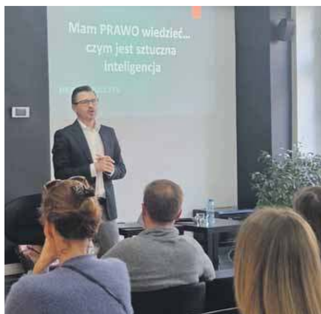
Z cyklu „Mam PRAWO wiedzieć...” odbyło się już m.in. spotkanie dotyczące sztucznej inteligencji

Natomiast w piątek, 23 maja, będzie Noc Otwartych Sądów. To okazja do poznania historii i obejrzenia wnętrza zabytkowego budynku tar-