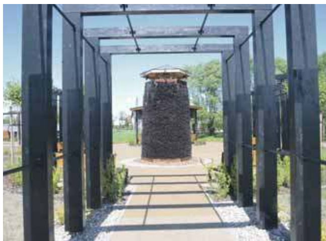
Projekt powstał na powierzchni 3,5 tys. metrów kwadratowych, a jego sercem jest tężnia solankowa

Konkurs Zielona Przestrzeń ma na celu wspieranie inicjatyw, które przyczyniają się do poprawy jakości życia mieszkańców poprzez tworzenie ekologicznych przestrzeni w miastach. W Kaletach to się udało.