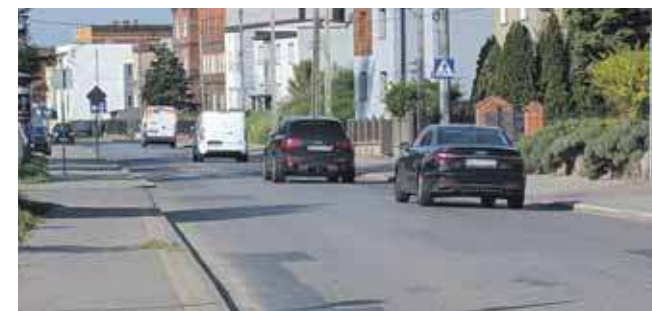
Ulica św. Wojciecha wymaga modernizacji. Od lat remontu domagają się mieszkańcy Radzionkowa