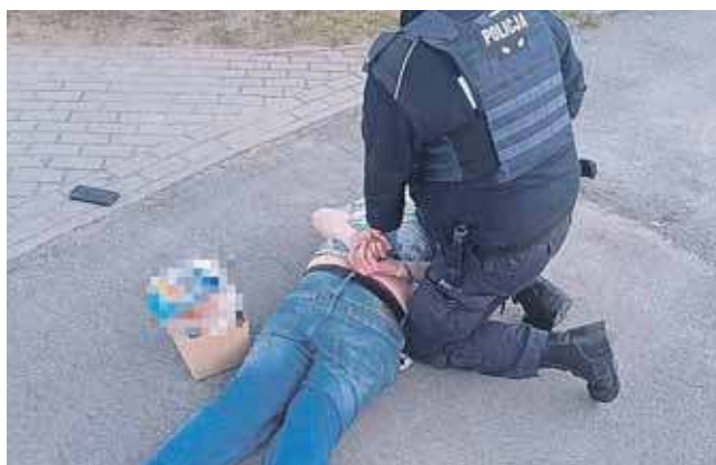
Pościg był krótki i policjanci zatrzymali 38-letniego mieszkańca Two- roga

– Pracownik szpitala przekazał, że słyszał podej- rzane hałasy w momencie rozpoczynania swojej pracy. Zauważył również zniszcze- nia na drzwiach, a później mężczyznę, który włamywał się do automatu i z łupem oddalił się w nieznanym kie- runku – relacjonuje podkom.