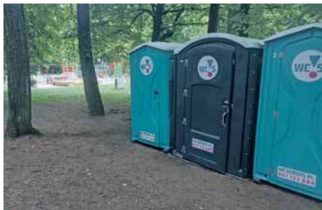
Trzy toalety przenośne ustawiono przy parkowej alejce w odległości około 50 metrów od placu zabaw

Burmistrz Czech zapowiedział, że zostaną ustawione trzy toalety przenośne. Gdzie? Przy parkowej alejce w odległości około 50 metrów od placu zabaw. Zgodnie z zapowiedzią toalety miały