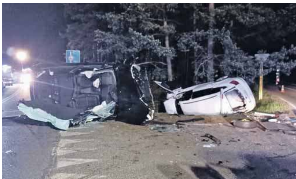
31-latek zginął na miejscu, kobieta w ciężkim stanie trafiła do szpitala

Niestety, młody mężczy- zna zginął na miejscu. Pro- wadzająca audi 27-latką, też mieszkanka gminy Koszę- cin, trafiła w ciężkim stanie