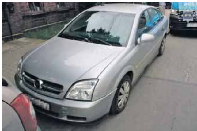
Nikomiu nic się nie stało, ale kierowca odpowie przed sądem

75-latką opiekowała się rodzina. Mężczyzna odpowie przed sądem. Sąd zdecyduje także o przepadku pojazdu, którym kierował, ponieważ zgodnie z prze- pisami samochód podlega przepadkowi, gdy stężenie alkoholu w organizmie kie- rowcy przekracza 1,5 promi- la. (EKA)