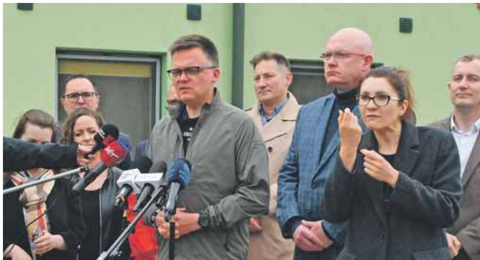
Szymon Hołownia odwiedził ośrodek w Ziemięcicach

Mówił, że w Polsce powinniśmy mieć sieć szkół specjalnych, integracyjnych i ogólnodostępnych, by każ-