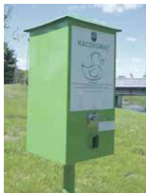
Automat z karmą dla ptactwa wodnego

Bulwar był już gotowy w listopadzie ubiegłego roku, zgodnie z zaplanowanym