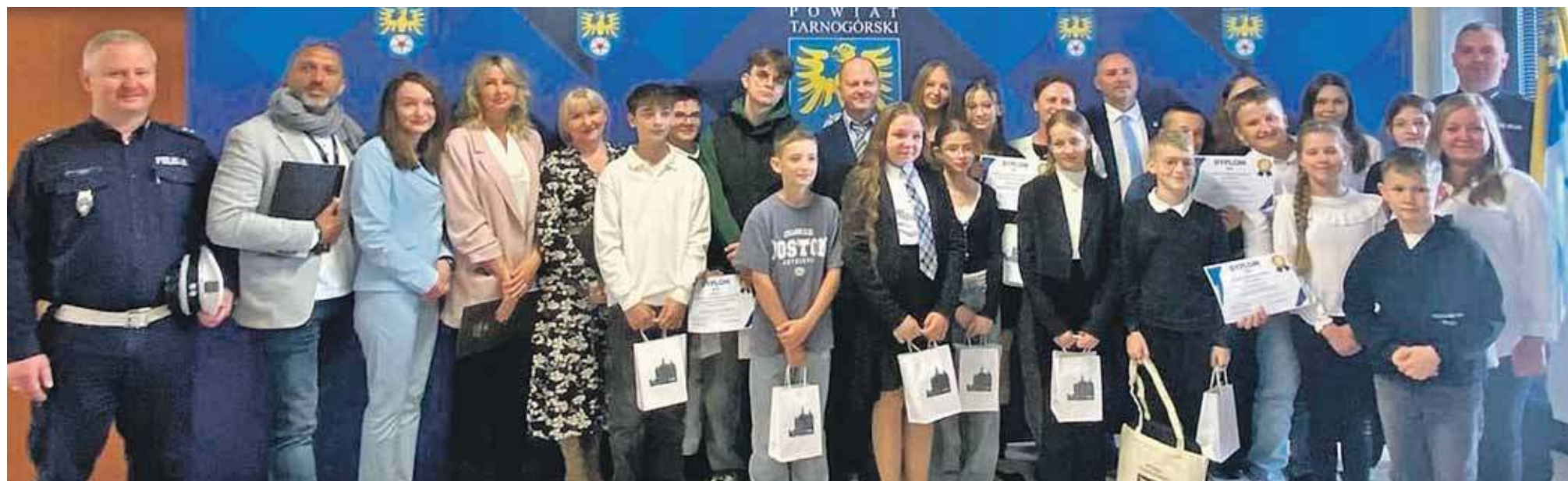
W Starostwie Powiatowym w Tarnowskich Górach wręczono we wtorek nagrody zwycięzcom Powiatowego Konkursu Wiedzy o Ruchu Drogowym