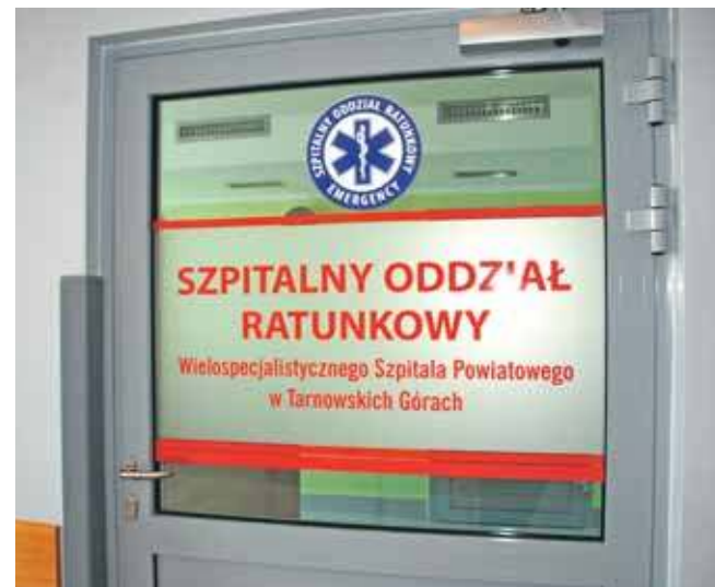
Od początku roku policjanci byli wzywani na SOR ponad 30 razy

Kara za naruszenie nietykalności cielesnej osób biorących udział w działaniach ratowniczych i niosących pomoc ma wynosić od 3 miesięcy do 5 lat pozbawienia wolności.