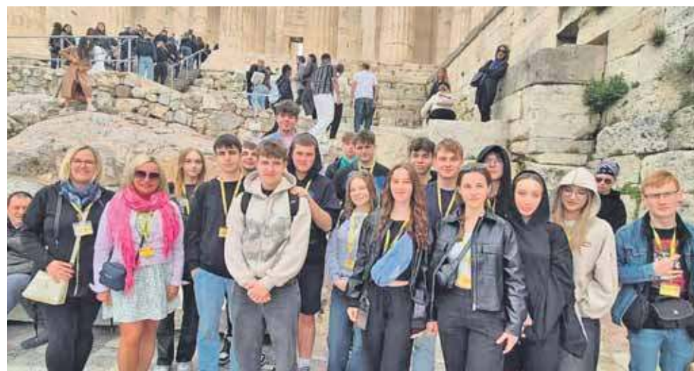
Był i czas na zwiedzenie Aten, w tym Akropolu

Projekt realizowany był ze środków unijnych i dzięki partnerowi White Blue Tour Service Oksana Wioska. (ESP)