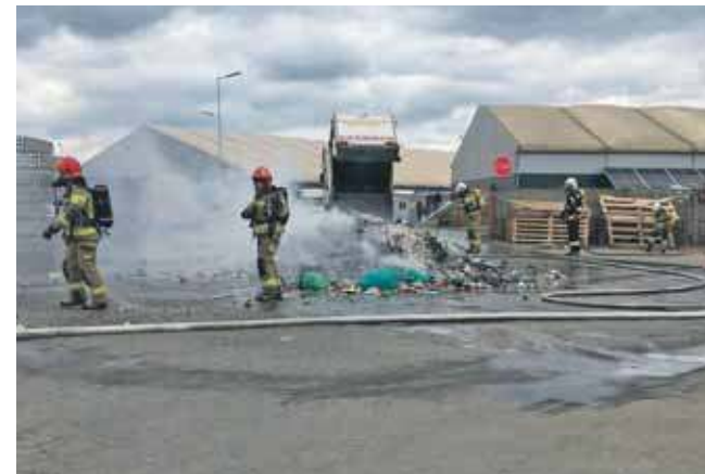
Zimną krwią wykazał się kierowca śmieciarki z Remondisa