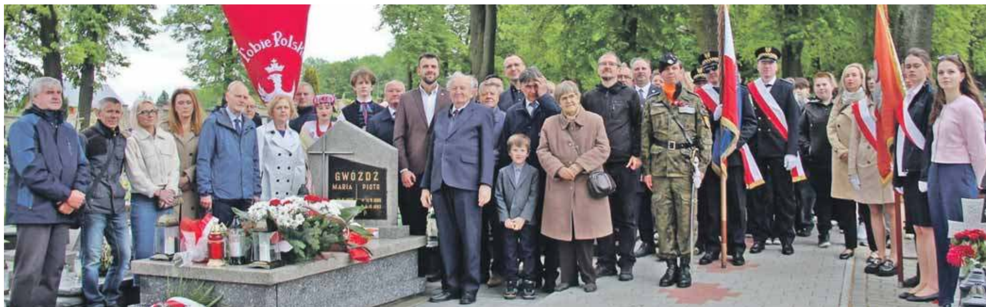
Na uroczystości nie zabrakło przedstawicieli władz, jak również członków rodzin zmarłych powstańców śląskich