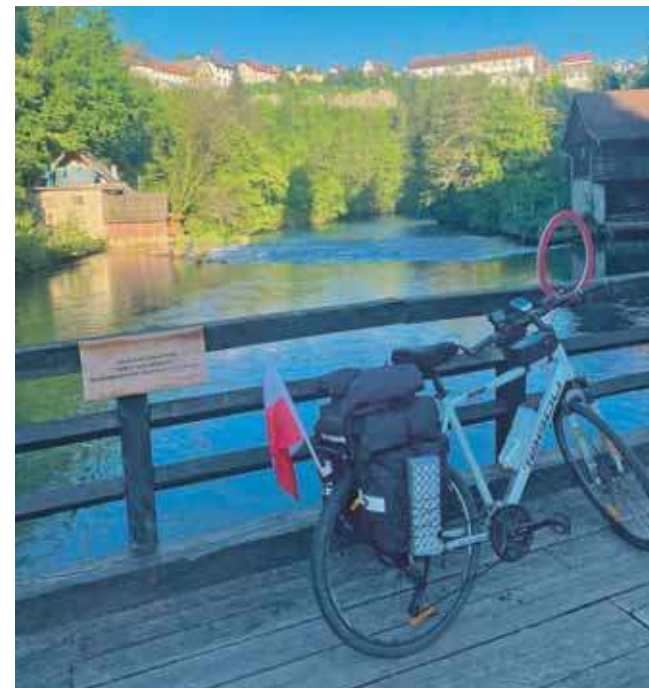
Wyprawa nieraz wykańczała psychicznie i fizycznie, ale radość dawały widoki i dojazd do celu