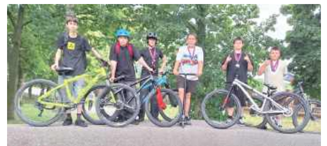
To była świetna rywalizacja, a przede wszystkim zabawa