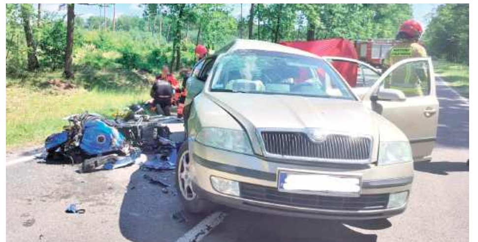
W wyniku zderzenia motocykla z samochodem osobowym marki Skoda Octavia do szpitala trafiło aż sześć osób, w tym dzieci

Do poważnego wypadku drogowego doszło w sobotę, 5 lipca, kilka minut po godzinie 10:00, na drodze krajowej nr 63 w miejscowości Stasinów, w gminie Radzyń Podlaski.