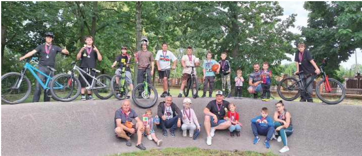
Pamiątkowe zdjęcie uczestników rywalizacji

Sobotnie popołudnie upłynęło pod znakiem sportowych emocji, radości i zdrowej rywalizacji.