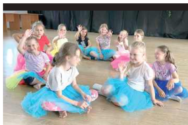
Młodzi uczestnicy byli uzdolnieni i ambitni