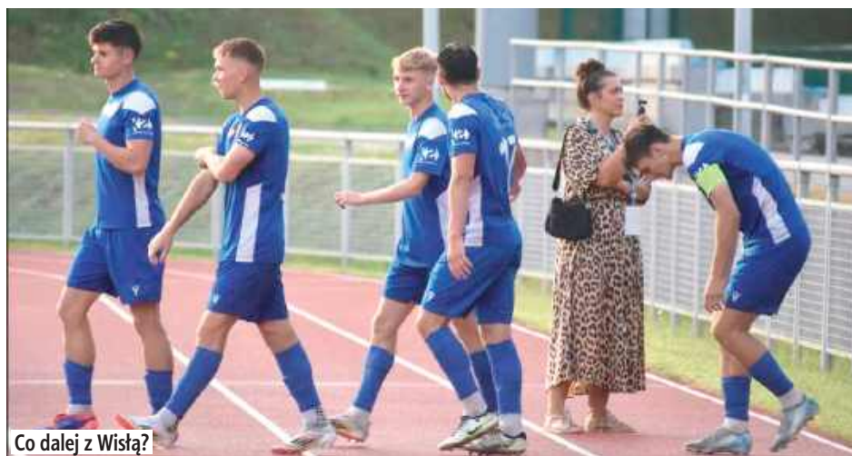
Co dalej z Wisłą?

Nie jest tajemnicą, że klub zmaga się z poważnymi trudnościami finansowymi. To właśnie one są głównym powodem, dla którego obecni zawodnicy, którzy rywalizowali jeszcze niedawno na poziomie II ligi, prawdopodobnie nie pozostaną w drużynie. Z każdą chwilą pojawiają się doniesienia o kolejnych piłkarzach, którzy szukają nowych klubów, gdzie będą mogli kontynuować swoją karierę. Ta destabilizacja kadrowa to ogromny problem, bo budowanie zespołu od nowa w tak krótkim czasie jest bardzo trudne.