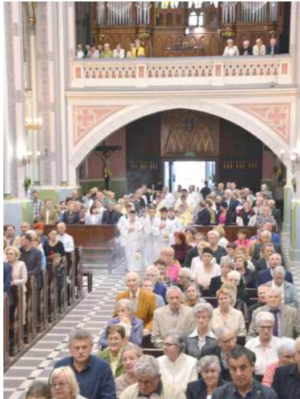
Świątynia pękała w szwach

- Z wdzięcznością w sercu za dwa lata jego posługi w naszej parafii dziękujemy Panu Bogu, że mogliśmy patrzeć jak młody kapłan, pełen gorliwości i Bożej mądrości pięknie rozwija swoje powołanie, udziela sakramentów, posługuje w wielu wspólnotach, z oddaniem towarzyszy młodzieży i pociąga przykładem swojego życia do służby liturgicznej zarówno dzieci, młodzież, jak i dorosłych. Żeg-