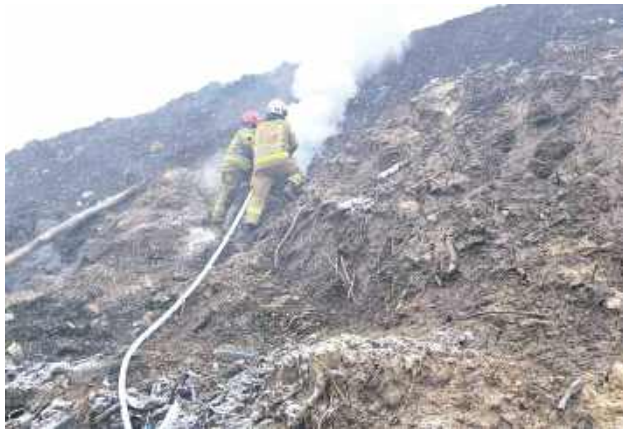
W ciągu kilku ostatnich lat strażacy co jakiś czas wzywani byli do gaszenia pożarów na wysypisku śmieci w Poniatowej Wsi

Sytuacja na wysypisku śmieci w Poniatowej Wsi nadal wzbudza duże poruszenie wśród mieszkańców, którzy mają szereg zastrzeżeń do jego funkcjonowania. Trwa prokuratorskie śledztwo.