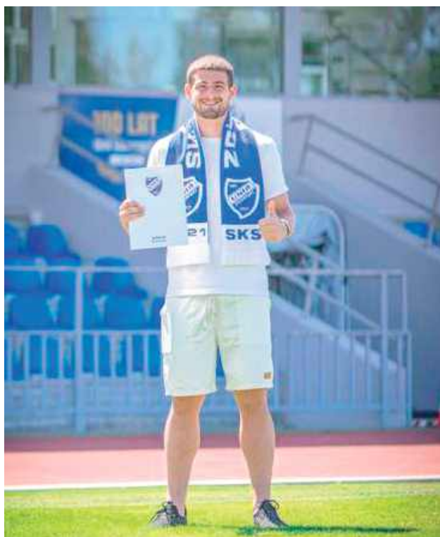
Brazylijczyk podpisał już kontrakt z nowym klubem, Unią Swarzędz

Tonin był jednym z kluczowych zawodników Huraganu w sezonie 2024/2025. Na boiskach IV ligi zdobył aż 24 bramki, co dało mu trzecie miejsce w klasyfikacji strzelców całych rozgry-