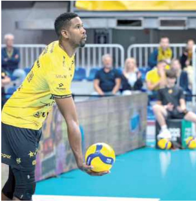
Wilfredo Leon - gwiazda Bogdanki LUK Lublin

Mistrzowie Polski rywalizować będą w siatkarskiej Lidze Mistrzów, a priorytetem będzie oczywiście obrona tytułu na boiskach PlusLigi. Ta rozpocznie się 21 października, bo wówczas ruszy nowy sezon polskiej ligi. Szczegółowego terminarza jeszcze nie ma, ale do tego czasu lublinianie mają czas na przygotowania.