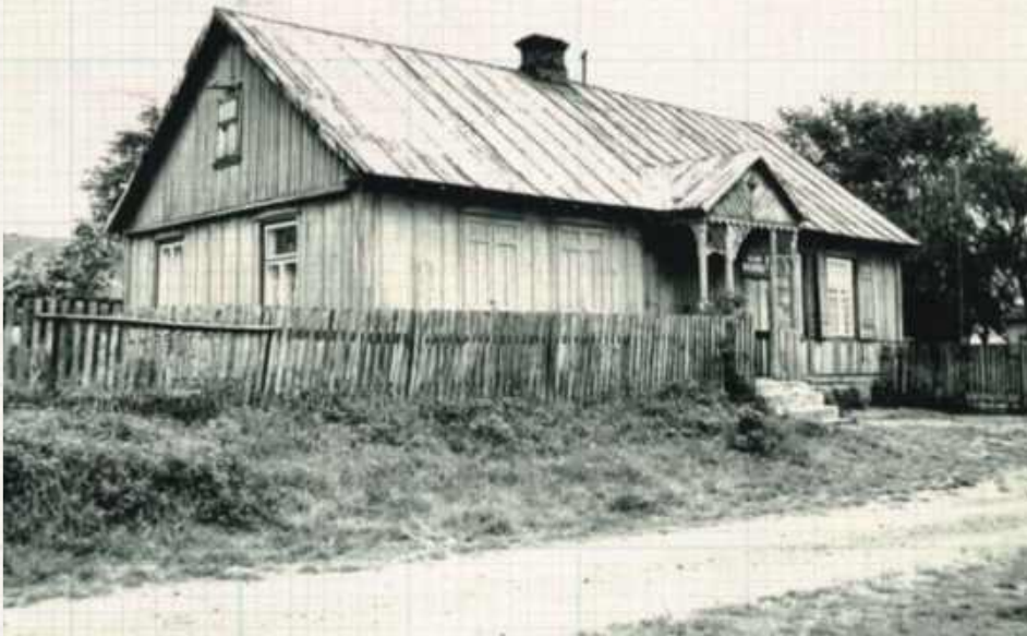
W tym budynku przed laty była karczma, potem szkoła, klub rolnika, sklep. Usytuowany w południowo-wschodniej części wsi, fot. A. Krzak, 1987 r. Zdjęcia ze studium historyczno-urbanistycznego Serocka opracowanego przez Włodzimierza Borucha w 1987 r.

Jedną z najstarszych w regionie, XIV-wieczną, lokacją wsi na prawie niemieckim, potem prawa miejskie. W XIX wieku, kiedy dzięki Henrykowi Łubińskiemu w okolicy Lubartowa wytworzył się tu znaczący ośrodek przemysłowy, funkcjonowała tu m.in. jedna z najlepszych stalowni, której wyroby mogły iść w paragon z najlepszymi fabrykami zagranicznymi. Obecnie sołectwo w gminie Firlej (pow. lubartowski).