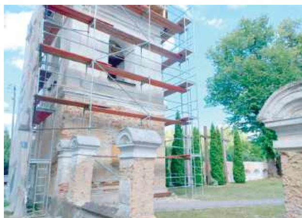
Częściowo zdemontowane zostało ogrodzenie od strony głównego wejścia

- Sam kościół w swojej historii był wielokrotnie remontowany i obecnie znajduje się w bardzo dobrym stanie. Jednak obie dzwonnice i odcinek frontального parkanu między nimi wymagają pilnego remontu. Prace,