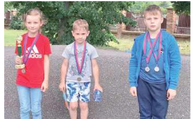
Organizatorzy zadbali, by każdy uczestnik otrzymał pamiątkowy medal, a zwycięzcy poszczególnych kategorii uhonorowani zostali nagrodami rzeczowymi