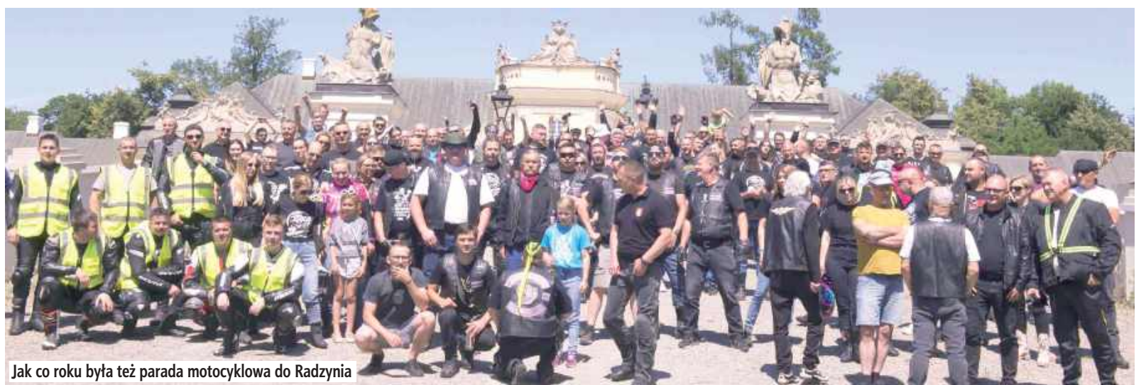
Jak co roku była też parada motocyklowa do Radzyna