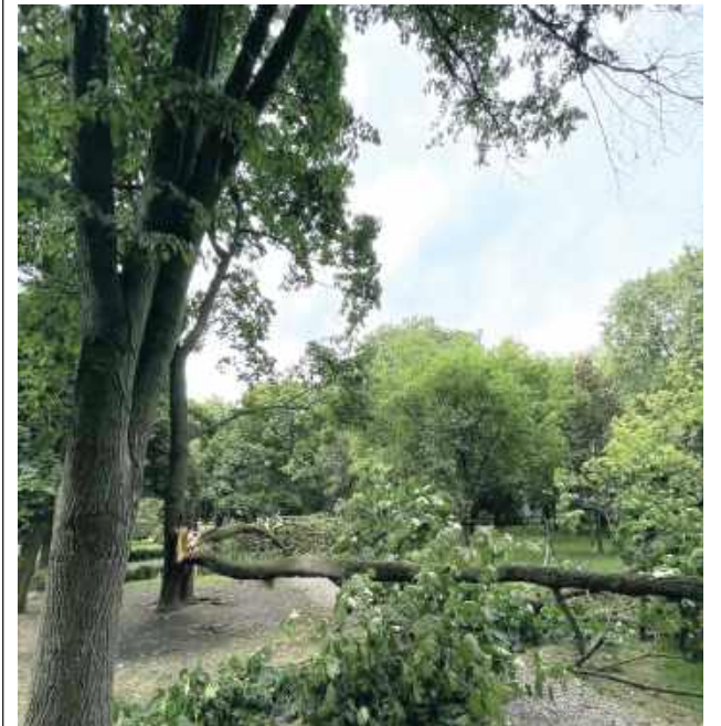
Wichura miała miejsce pod koniec czerwca

Ostatnia wichura niestety nie oszczędziła parku miejskiego w Parczewie. W wyniku silnych podmuchów wiatru ucierpiały drzewa. Część z nich została poważnie uszkodzona i musi zostać usunięta ze względów bezpieczeństwa. W miejsce usuniętych drzew planowane są nowe nasadzenia.