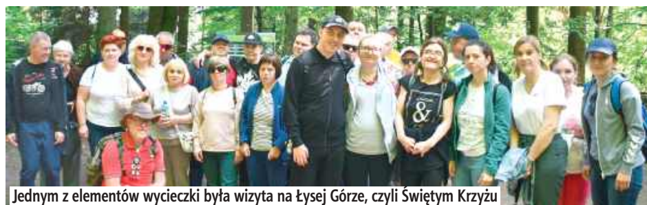
Jednym z elementów wycieczki była wizyta na Łysej Górze, czyli Świętym Krzyżu

Podczas wyjazdu odwiedzili Łysą Górę i Sanktuarium Relikwii Drzewa Krzyża Świętego; w Parku Legend w Nowej Słupi poznawali opowieści o czarownicach; zwiedzali Zamek w Chęcinach, gdzie przymierzali średniowieczne zbroje i hełmy; odwiedzili Centrum Nauki Leo-