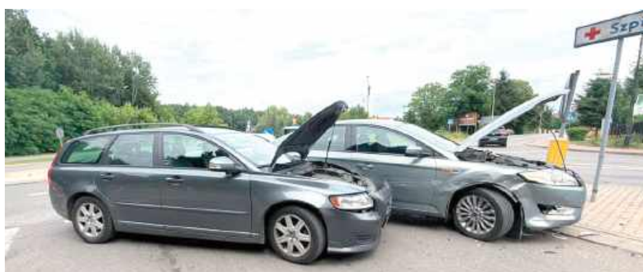
Na miejscu interweniowały służby ratunkowe. Na szczęście nikt nie doznał obrażeń

W piątkowe popołudnie, 4 lipca doszło do kolejnego zdarzenia drogowego na skrzyżowaniu ulic Opolskiej i Fabrycznej w Poniatowej. 70-letni kierowca Forda z gminy Poniatowa, jadąc ul. Fabryczną od strony centrum, nie ustąpił pierwszeństwa przejazdu i wjechał na skrzyżowanie bez zachowania ostrożności, pomimo znaku STOP. W rezultacie zderzył się z nadjeżdżającym Volvo, kierowanym przez 34-latkę z Lublina.