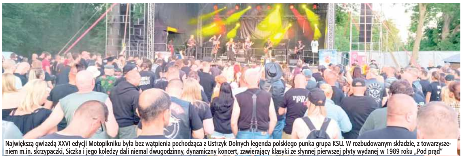
Największą gwiazdą XXVI edycji Motopikniku była bez wątpienia pochodząca z Ustrzyk Dolnych legenda polskiego punka grupa KSU. W rozbudowanym składzie, z towarzyszeniem m.in. skrzypaczki, Siczka i jego koledzy dali niemal dwugodzinny, dynamiczny koncert, zawierający klasyki ze słynnej pierwszej płyty wydanej w 1989 roku „Pod prąd”