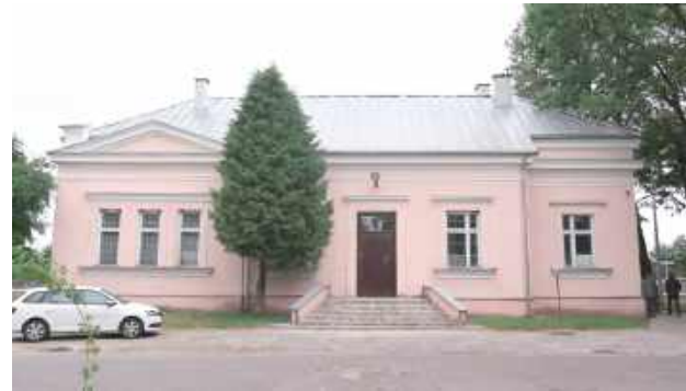
Skala, bryła, forma, wyraz architektoniczny, a także artykulacja architektoniczna elewacji budynków wraz z wieżą ciśnień - zachowane są w stanie bliskim pierwotnego

Decyzją Lubelskiego Wojewódzkiego Konserwatora Zabytków do rejestru zabytków został wpisany „zespół budowlany” dworca kolejowego w Parczewie. Chodzi o sam dworzec, dom i wieżę ciśnień. Decyzja jest prawomocna.