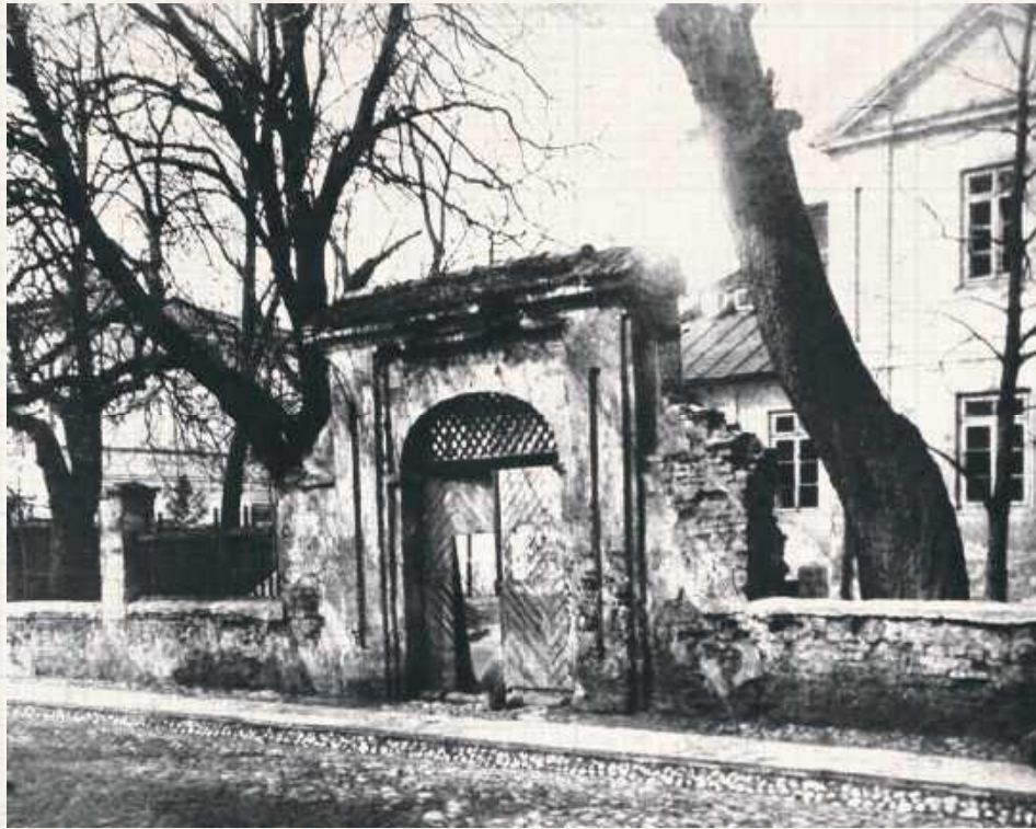
Dawne, nieistniejące już wejście bramne do konwikt Szaniawskich. Obecnie w budynku mieści się Muzeum Regionalne