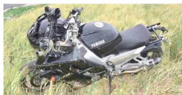
Mężczyzna po zderzeniu ze zwierzęciem stracił panowanie nad jednośladem i wywrócił się

- Jak ustalili policjanci, pod koła motocykla marki Yamaha,