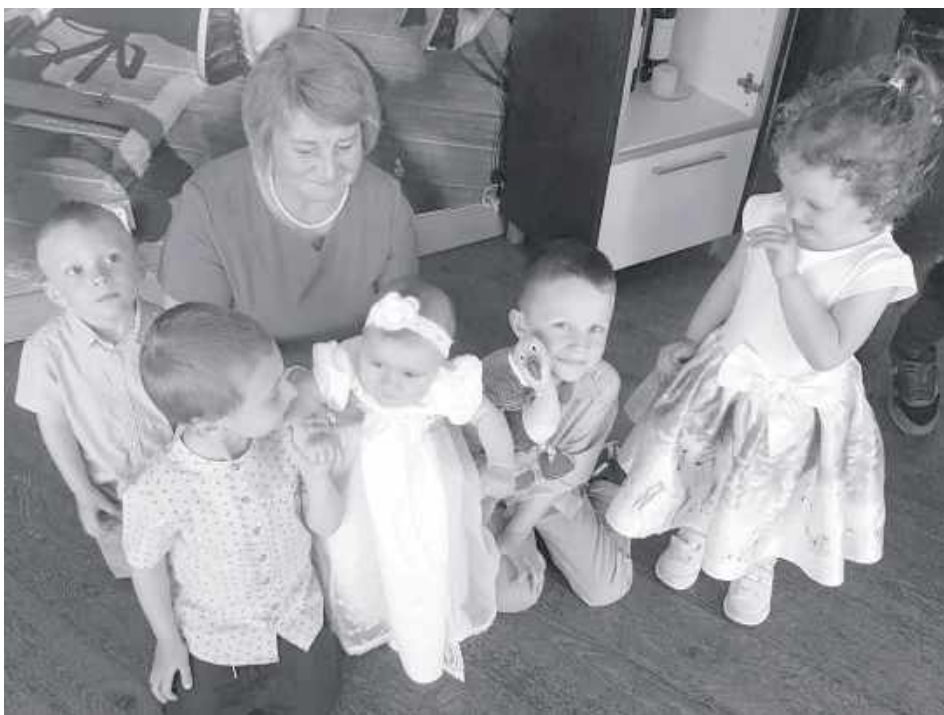
Jak wspominali bliscy, śp. lekarka była oddaną babcią. Często zamieniała się dyżurami z kolegami z pracy, aby spędzić więcej czasu z wnukami

Pracowałem z nią od początku jej pracy w radzyń-