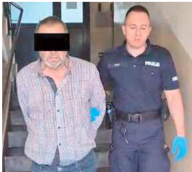
Co najmniej trzy najbliższe miesiące mężczyzna spędzi w areszcie tymczasowym

Jak poinformował asp. szt. z KPP w Łukowie Marcin Józwick - w ubiegłym tygodniu do dyżurnego łukowskiej Komendy Policji wpłynęła informacja o awanturze w jednym z domów w gminie Trzebieszów. Mundurowi którzy przyjechali we wskazane miejsce dowiedzie-