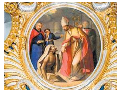
XIX-wieczne wyobrażenie „Wskrzeszenia Piotrowina” z ołtarza w kaplicy Lubomirskich w Łazanach, w powiecie wielickim

O tym, że podobne do powyższego wskrzeszenie miało miejsce także w Polsce w XI w., informuje Wincenty z Kielczy, dominikanin, hagiograf, kanonik krakowski, autor hymnu „Gaude Mater Polonia”, a także hagiografii „Żywot św. Stanisława”. Wskrzeszony miał na imię Piotrowin, a cudu dokonał św. Stanisław ze Szczepanowa, później jeden z głównych patronów Polski.