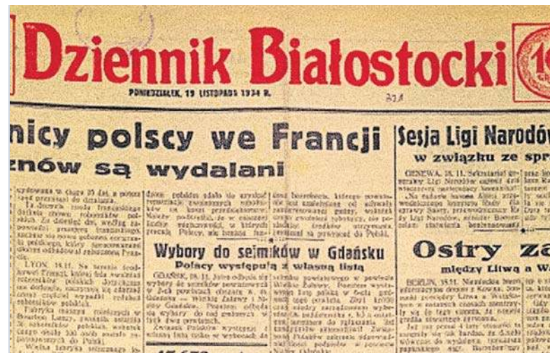
Pierwsza strona „Dziennika Białostockiego” z 19 listopada 1934 r.

Podejrzanie padło na strycharzy miejscowej cegielni. Prawdopodobnie strycharze kradli w okolicznych wsiach nierogaciznę i skradzione sztuki bili na cmentarzu, a następnie ukrywali je w grobie Paulinków.