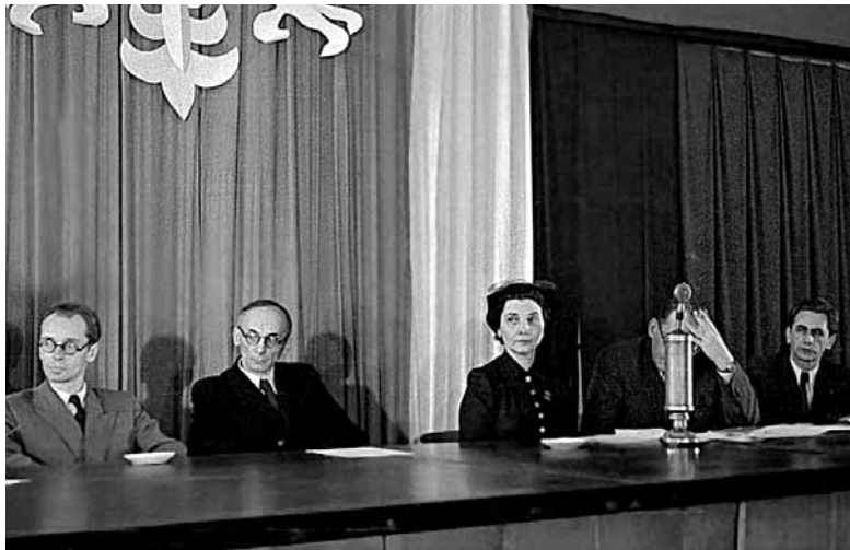
20 stycznia 1949 r. w Szczecinie rozpoczął się IV Zjazd Literatów Polskich, na którym proklamowano socrealizm. Nie było w nim miejsca dla wątpliwych i niezdecydowanych

Napisanie, że w Polsce Ludowej cenzurowano publikacje „zagrożające bezpieczeństwu państwa”, „nawołujące do ponizienia ustroju państwa” lub „godzące w konstytucyjne zasady polityki zagranicznej”, to truizm. Wachlarz tematów, przeciwko którym walczyło Biuro Polityczne KC PZPR, był dość szeroki. Zoczywistych względów blokowano prace poświęcone Józefowi Piłsudskiemu i legionom, nieprzychylnie patrzono na książki o endecji, skrupulatnie przyglądano się wszystkiemu, co tłumaczyłoby bolszewizm. Ale to i tak mały wynek: złe było to, co chwaliło Stany Zjednoczone (w tym indiańskie opo-