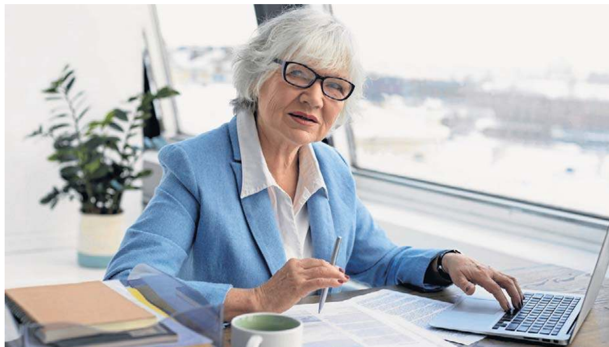
Limity dorabiania powinni sprawdzać emeryci, którzy nie osiągnęli powszechnego wieku emerytalnego (60 lat dla kobiet i 65 lat dla mężczyzn) oraz renciści

Dodatkowo raz w roku, do końca lutego, takie osoby powinny przekazać do ZUS zaświadczenie o wysokości przychodu za ubiegły rok. Takie zaświadczenie wydaje pracodawca lub zleceniodawca. Osoby prowadzące działalność gospodarczą składają własne oświadczenie, w którym jako przychód wskazują podstawę wymiaru składek na ubezpieczenia społeczne. Dane o przychodach są potrzebne, aby sprawdzić, czy świadczenia były wypłacane w prawidłowej wysokości. ©