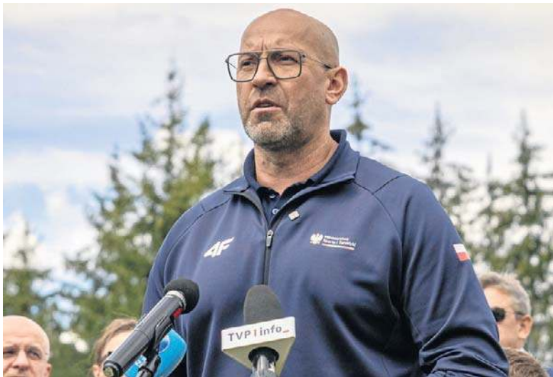
Minister Sportu i Turystyki w Grabówce ogłosił wyniki rządowego programu „Szatnia na Medal”. Dofinansowanie dostało 15 gmin

- To jest nowy program, który zaproponowałem, bo dla mnie jest to rzecz bardzo ważna - mówił Jakub Rutnicki. - Pochodzę z małej miejscowości, wychowałem się w Pniewach, grałem w Sokole Pniewy i dla mnie wielki sport zaczyna się w małych klubach i dlatego ten program, który skierowany jest w większości do mniejszych samorządów, które chcą re-