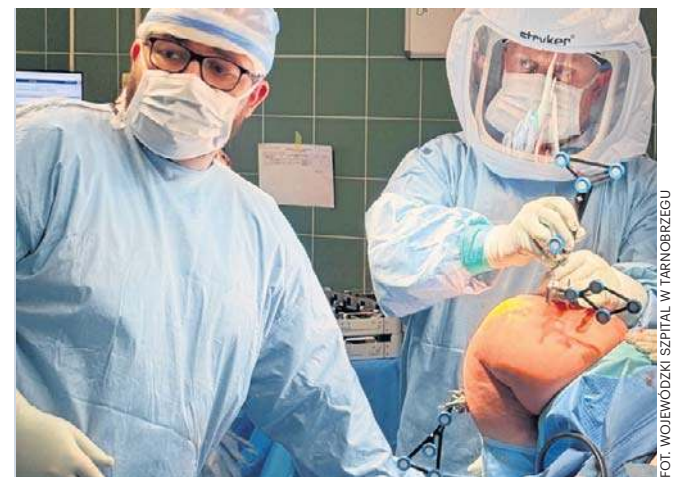
System pozwala jeszcze lepiej zaplanować operację

System robotyczny wspiera lekarza na każdym etapie zabiegu od planowania po jego wykonanie. - Pozwala jeszcze lepiej zaplanować operację, precyzyjnie dobrać rozmiar i ustawienie implantu oraz