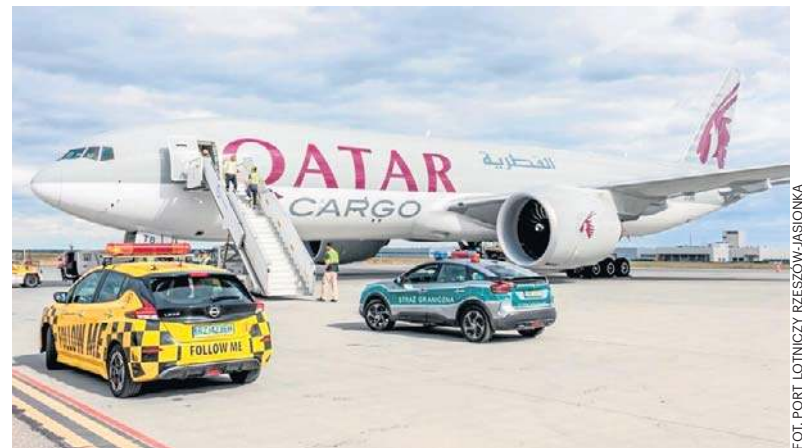
Boeing 777-200 Freighter może przewieźć do 106 ton ładunku

Obsługa operacji realizowanej przez Qatar Airways Cargo potwierdza rosnące znaczenie Portu Lotniczego Rzeszów-Jasionka jako ważnego ośrodka logistycznego Europy Środkowo-Wschodniej. Lotnisko od kilku