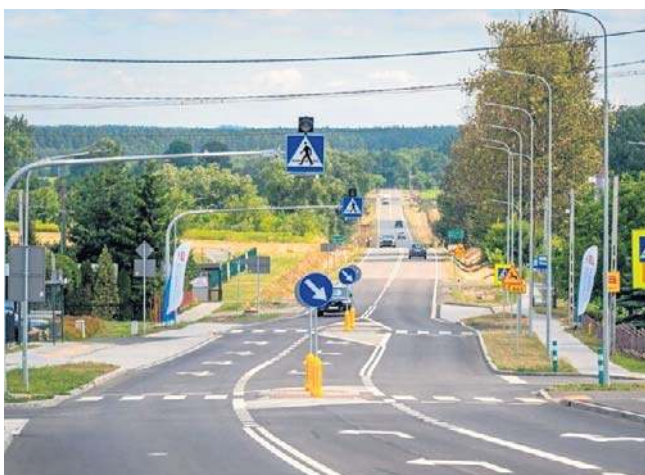
Inwestycja łączy A4 z planowaną drogą S74