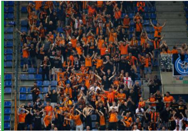
Kibice Chrobrego mogą czuć dumę, choć przykurcz serca jest przecież nieodległy...

A jak widzi to trener rewelacji minionego sezonu pierwszoligowego? – To wielka rzecz, że doszliśmy do finału baraży. Wszystko robiliśmy, żeby w tym finale dobrze się zaprezentować i... tak też było. Było też tak, że prowadziliśmy 1:0 i mie-