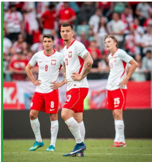
Zdaniem naszego eksperta, reprezentanci Polski myślami są już na urlopie.

- Na pewno podtekst polityczny w tym meczu był spory. Wiemy, co się działo tuż przed meczem, co powiedział prezydent Ukrainy, a w konsekwencji czego nasz prezydent chce mu odebrać Order Orła Białego. Siłą rzeczy jesteśmy wpłątani w politykę i nie da się od tego uciec. Te wszystkie transparenty na stadionie nie stanowiły