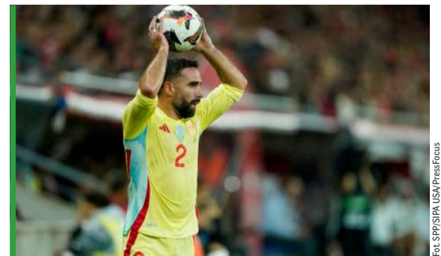
Dani Carvajal grał w MŚ w 2014 i 2018 roku.

Po pierwsze – jest ich niewiele. Największe szanse na wyjazd na mundial miałyby Carvajal, ale 34-latek w tym sezonie głównie leczył kontuzję. Dean Huijzen w tym sezonie debiutował w Realu, ale nie był to jego najlepszy rok. Kilka razy pauzował z powodu urazu. Alvaro Carreras czy Fran Garcia są po prostu gorsi od Alexa Grimaldo i Marca Cucurelli. Raul Asencio po dobrym poprzednim sezonie, w tym zaczął grać słabo. Dani Ceballos jest bez formy. Z kolei Gonzalo Gar-