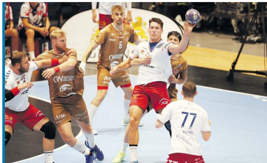
Mecze Wybrzeża i Ostrovii to zawsze walka o każdy centymetr parkietu.