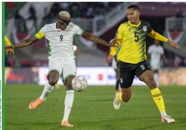
Stynny Victor Osimhen (nr 9) z Polską niestety nie zagra.

W ostatnim tygodniu Super Orły brały udział w Unity Cup, turnieju zorganizowanym w Londynie na stadionie Charltonu z udziałem czterech byłych brytyjskich kolonii: Nigerii, Indii, Zimbabw i Jamajki. W półfinale po dwóch