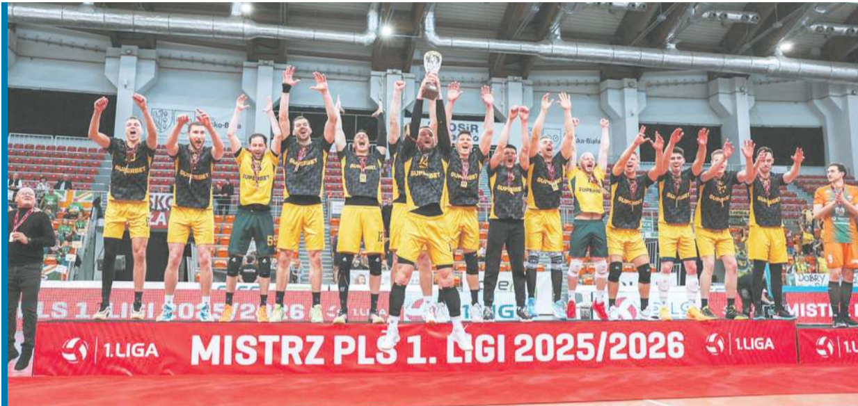
Szczęśliwi siatkarze GKS-u na podium po wygranej meczu w Bielsku-Białej.

- My byliśmy w rozkroku, bo balansowaliśmy na krawędzi spadku, ale jeszcze nie zostaliśmy zdegradowa-