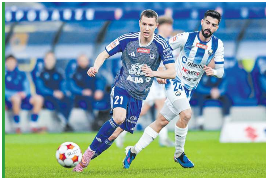
Mało który obrońca potrafi nadążyć za pędzącym „Szwedziem” (nr 21).