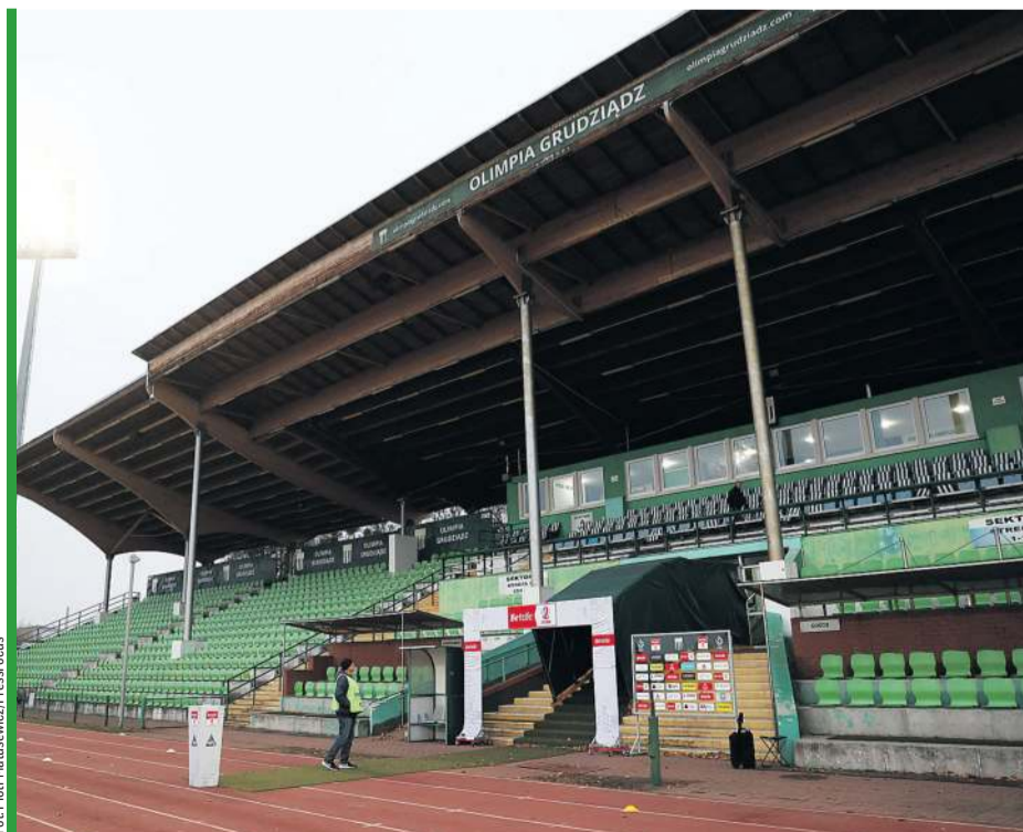
Olimpia Grudziądz dzięki zajęciu trzeciego miejsca ma przywilej gry w barażach u siebie.