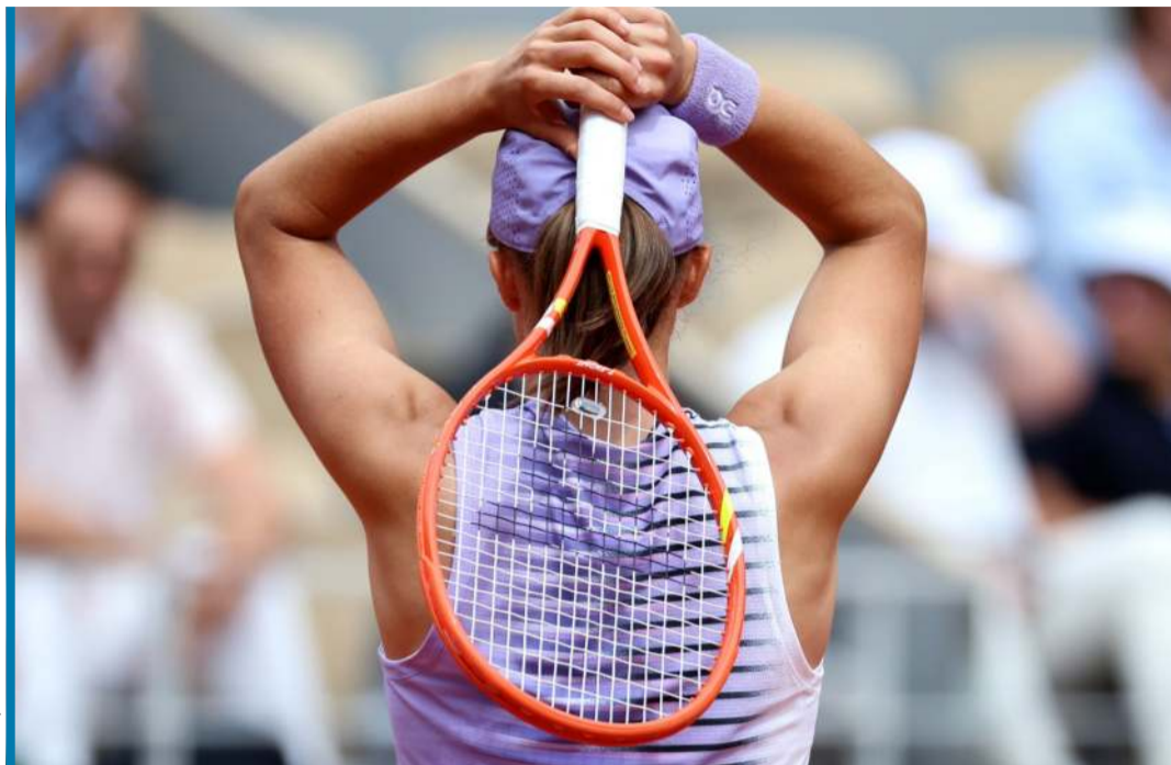
Iga Świątek teraz przegrała, jutro wygra, pozostając w naszych sercach.

nie się z kontuzjami, rywalizacja o miejsce w składzie. Mecz jest jak spektakl teatralny, to ukoronowanie miesięcy i lat harówki pełnej potu, krwi i łez. Rzekome rekiny biznesu i polityki to często pospolici spekulanci. Działając wedle dewizy „tanio kupić - drogo sprzedać” napętniają kieszenie sobie, drenując je u innych. Z etyki prawdziwej pracy nie ma to wiele wspólnego.