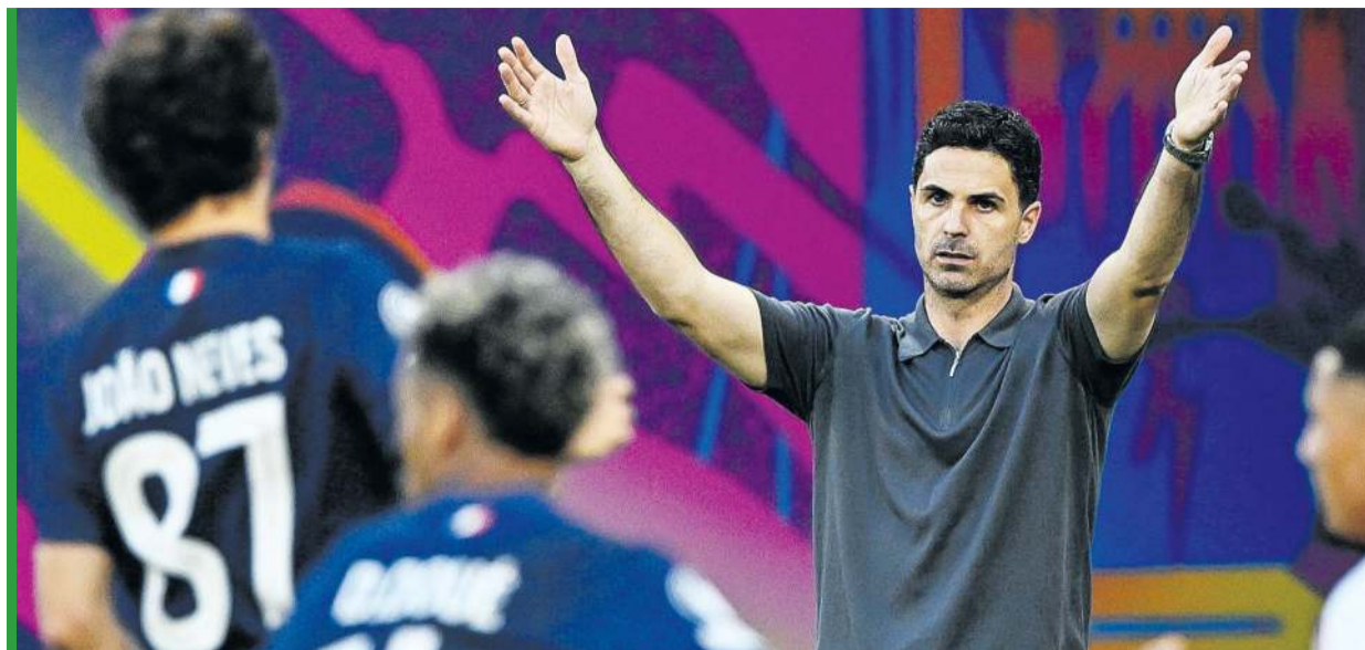
Obserwowanie świętujących rywali boli, choć... czasem może się optać!