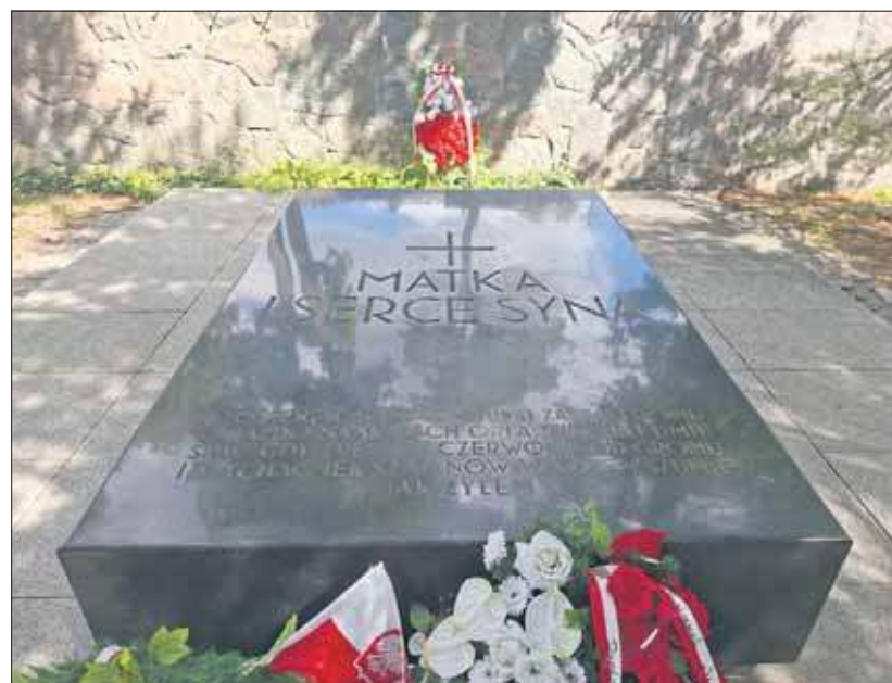
Wilno – cmentarz na Rossie, grób Marii z Billewiczów Piłsudskiej, miejsce pochówku urny z sercem Józefa Piłsudskiego