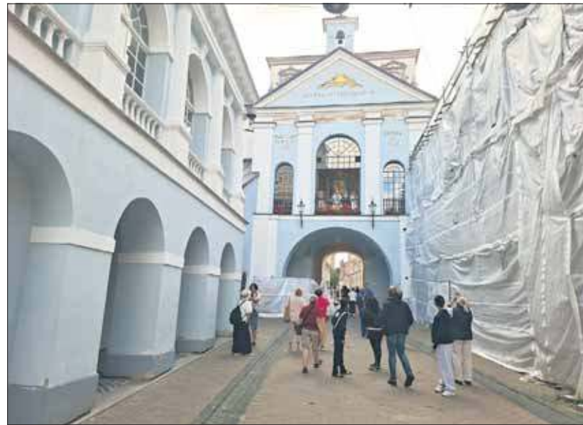
Wilno – Ostra Brama, gotycka brama miejska na Starym Mieście wzniesiona w latach 1503-1514

„oprany” i naładowany energią – dosłownie (sprzęt) i w przenośni – ruszyłem z radością na trasę, bo czekały na mnie dwa uroczyste miasteczka nad Niemnem – Olita i Druskieniki. Pierwsze to 6. miasto Litwy. Nie zachowało się tu wiele pamiątek z przeszłości, a byłoby co oglądać, bo miasto należało w swojej bogatej historii do Rzeczypospolitej Obojga Narodów, Królestwa Prus, Cesarstwa Francuskiego, Imperium Rosyjskiego, Rzeszy Niemieckiej, Królestwa Litwy, ZSRR i wreszcie Litwy. Z kolei Druskieniki to największe i najnowocześniejsze uzdrowisko na Litwie, jedno z najlepszych uzdrowisk klimatycznych i balneologicznych w Europie. Trasę zakończyłem dość późno, więc zwiedzanie Druskienik zostawiłem sobie na jutro (piątek). Pociąg z Suwałk do Sosnowca mam w niedzielę rano. Spałem w namiocie, w Parku Linowym nad Niemnem.