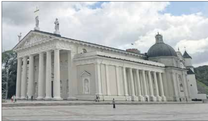
Wilno – bazylika archikatedralna św. Stanisława Biskupa i św. Władysława, miejsce spoczynku królów Polski

Noc z wtorku na środę spędziłem przed Trokami na wygodnym przydrożnym parkingu leśnym wyposażonym w wiatę, palenisko na grilla oraz toi-toia. Zamek w Trokach, które przed laty były stolicą Litwy, położony jest na jeziorze Galwa. Wyspa połączona jest z lądem drewnianym mostem. Na zamku zmarł książę Witold, a kilkakrotnie odwiedził zamek jego brat stryjecz-