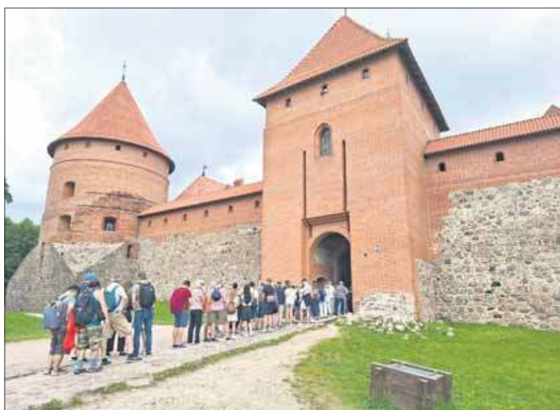
Troki – zamek wzniesiony w XIV-XV w. przez wielkiego księcia litewskiego Kiejstuta i jego syna Witolda

ny król Polski Władysław Jagiełło. W mieście i przy zamku spotkałem wielu turystów z Polski. Z Troków pojechałem do Birsztanów. To miasteczko nad Niemnem otoczone sosnowymi lasami. Kurortem zostało w XIX w., kiedy wybudowano ujęcie wody mineralnej i odkryto pokłady borowiny. Są tu liczne sanatoria. Wody mineralne zawierają m.in. potas i magnez. Spałem w pięknym położonym kempingu NaturCamp (14€). Do końca trasy pozostały mi 2 miasteczka Olita i Druskieniki, i ok. 220 km.