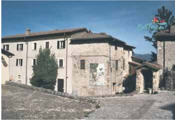
Dom Pielgrzyma Belvedere w Greccio

Nad jaworznicką Wspólnotą Betlejem bacznie czuwa Opatrzność Boża. Cokolwiek tam wymyślą, choćby był to najbardziej zaskakujący pomysł, udaje się zrealizować. Splot wydarzeń i dobrzy ludzie mają w tym swój istotny udział. Tak też było z projektem Domu Pielgrzyma Belvedere we włoskim Greccio, położonym na wysokości 750 m n.p.m. na zboczu góry. Na niej znajduje się klasztor-pustelnia św. Franciszka z Asyżu.