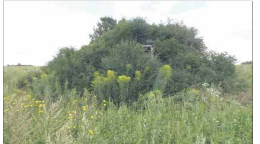
Biogrupa w leju

Od Przygonia po Trzebinę teren łagodnie opada, wystawiając się na wschodzące słońce. Jeśli chodzi o Jaworzno, to stąd jest najbliżej do Słońca. Zachodnia