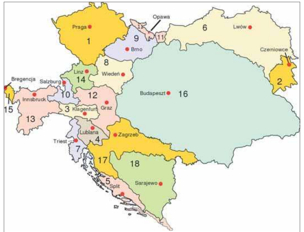
Monarchia Habsburgów, a w jej ramach Królestwo Galicji (wikipedia)

Wielkopolskę zwie się potocznie Pyrlandią, krakowian centusiami, Ślązaków z przedwojennego województwa śląskiego hansami, a chrzanowian Cabanami. Wiele jest potocznych – acz nieformalnych nazw dotyczących społeczności lokalnych. Czy istnieje jednak taka, która dotyczyłaby Jaworzna i jego mieszkańców, budząc jednocześnie jednoznaczne skojarzenia? No właśnie. W dzisiejszym tekście więc o takich nazwach; jakie to określenia, skąd się mogły wziąć i co mogą oznaczać i w jakim wreszcie stopniu mogą nas dotyczyć?