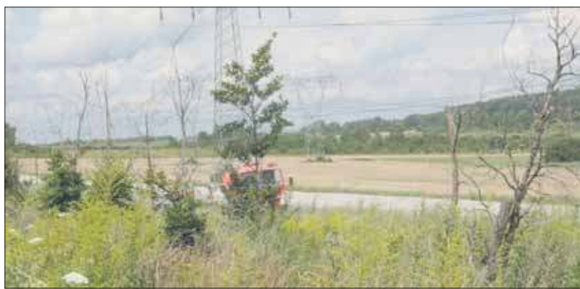
Aleja martwych drzew

Szczególnym rozczarowaniem okazał się tzw. Park Nowych Mieszkańców, w którym rodziny z dzie-