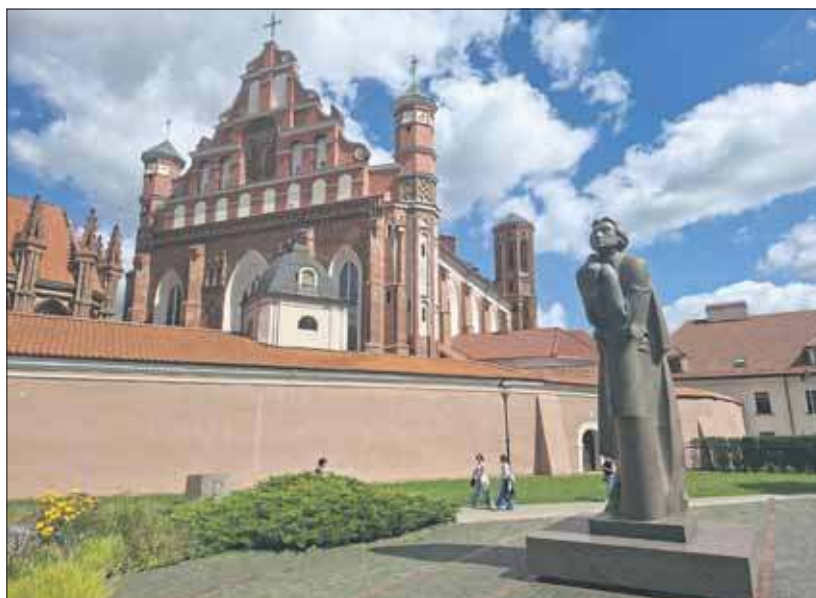
Wilno – pomnik Adama Mickiewicza przy kościele św. Anny, dźgnięty w 1984 roku