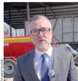
Stopklatka z wideo starosty Łukasza Reszki

Powiat Łęczyński mierzy się z poważnymi problemami finansowymi, które bezpośrednio wpływają na możliwość realizacji inwestycji drogowych. Starosta Łukasz Reszka w nagrany wideo wprost przyznaje, że bez wsparcia samorządów gminnych wiele z nich może w ogóle nie dojść do skutku.