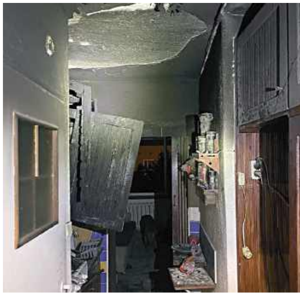
Ustalono, że źródło ognia znajdowało się w kuchni

We wtorek 17 marca o godzinie 3.33 Straż Pożarna w Łęcznej odebrała zgłoszenie o pożarze mieszkania w budynku wielorodzinnym przy ul. Górnicy 5 w Łęcznej.