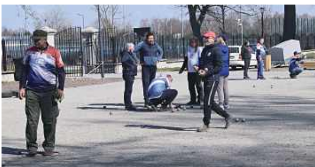
W otwarciu sezonu uczestniczyło ponad 20 członków klubu