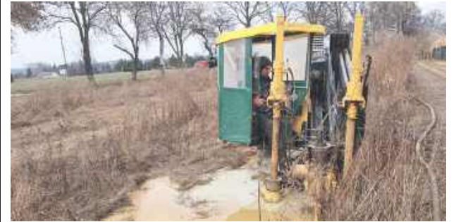
Nowe wodociągi dla stu gospodarstw w gminie Spiczyn

W miejscowościach Charleż, Spiczyn, Jawidz oraz Ludwików trwają intensywne prace przy budowie nowoczesnej sieci wodociągowej. Inwestycja obejmująca blisko dwa kilometry nowych przyłączy pozwoli na doprowadzenie bieżącej wody do około stu domów, co znacząco podniesie standard życia i higieny mieszkańców tych rejonów.