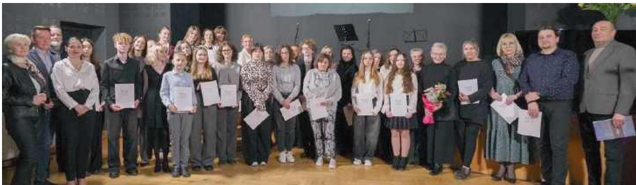
Głównym punktem programu był wernisaż wystawy, na której swoje prace zaprezentowało blisko czterdziestu artystów

Łęczyńskie Centrum Kultury tętniło życiem podczas wyjątkowego wydarzenia artystycznego, które połączyło świat obrazu, słowa i dźwięku.