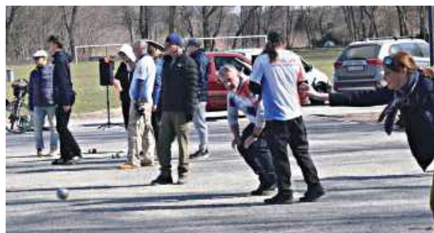
Miłośnicy gry w petanque zebrali się na bulodromie w lubartowskim parku

W otwarciu sezonu w niedzielę uczestniczyło ponad 20 członków klubu. Nie byli jednak jedynymi uczestnikami