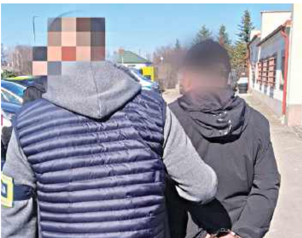
Łęczyńska policja zatrzymała trzech mężczyzn z Gruzji, którzy zostali przyłapani na kradzieży w jednym ze sklepów w Łęcznej

Łęczyńska policja zatrzymała trzech mężczyzn z Gruzji na gorącym uczynku. Wobec zatrzymanych wszczęto procedurę deportacyjną.