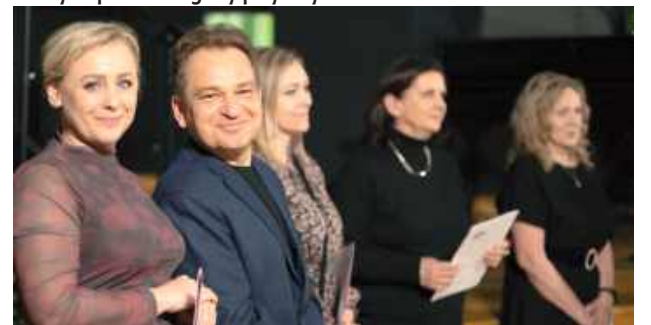
Sukces wieczoru był możliwy dzięki szerokiej współpracy kilku instytucji i grup nieformalnych