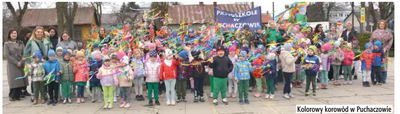
Kolorowy korowód w Puchaczowie

W piątek mieszkańcy Puchaczowa mogli podziwiać barwną paradę najmłodszych obywateli gminy, którzy uroczyście przywitali pierwszy dzień wiosny. Przedszkolaki z Marzanną na czele przemaszerowały ulicami miejscowości, niosąc ze sobą radosną nowinę o odejściu zimy i budzącej się do życia przyrodzie.