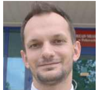
Kami wójt gminy Puławy

Mimo wielu głosów sprzeciwu w samym głosowaniu miejscy radni najpierw 11 głosami wyrazili pozytywną opinię na