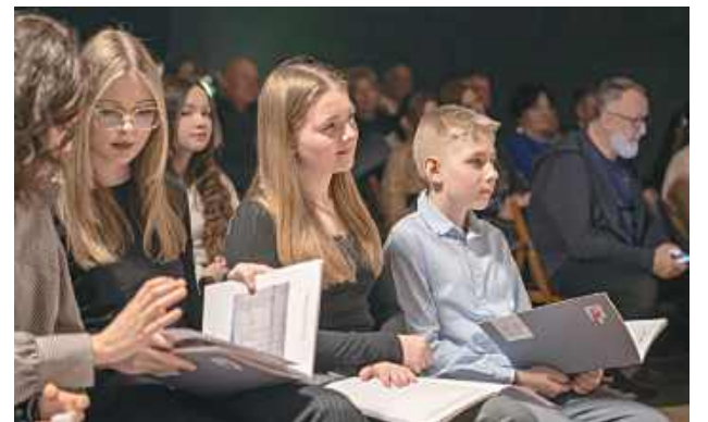
Barwy wspomnień i głosy przyrody