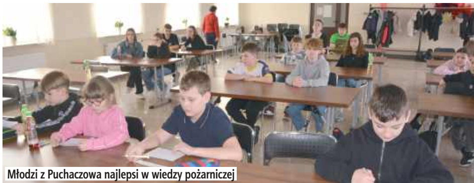
Młodzi z Puchaczowa najlepsi w wiedzy pożarniczej

Dziewiętnastu uczniów ze szkół z terenu gminy Puchaczów stanęło do rywalizacji w gminnym etapie czterdziestej ósmej edycji Ogólnopolskiego Turnieju Wiedzy Pożarniczej pod hasłem „Młodzież zapobiega pożarom”. Turniej, który od lat cieszy się niesłabnącą popularnością, odbył się w Gminnym Ośrodku Kultury, a jego laureaci będą reprezentować gminę na szczeblu powiatowym.