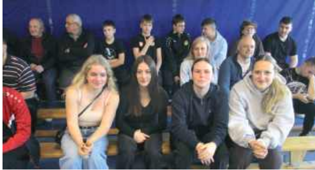
„Rodzinne” zdjęcie sztangistek GULKS

Hala sportowa OSiR w Biłgoraju była areną zmagania sztangistek i sztangistów, którzy rywalizowali w mistrzostwach województwa lubelskiego LZS (Ludowe Zespoły Sportowe). W zawodach świetnie spisali się reprezentanci GULKS Niemce.