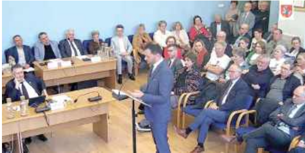
Na miejską sesję w Puławach ponownie przyszedł wójt gminy Puławy oraz mieszkańcy, by przedstawić swoje argumenty przemawiające za odejściem od pomysłu zmiany granic miasta poprzez przejęcie terenów od gminy Puławy

Przez kilka miesięcy miejscy urzędnicy pracowali nad