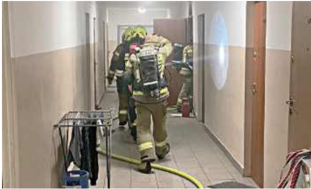
Strażacy sprawdzili mieszkanie oraz klatkę schodową przy użyciu mierników wielogazowych. Nie stwierdzono obecności gazów niebezpiecznych