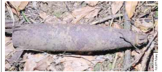
Do czasu przyjazdu patrolu saperskiego, który w bezpieczny sposób podjął znalezisko, miejsce, w którym znajdował się niewybuch było zabezpieczone przez policjantów z KPP w Puławach

Wezwali policję, która do momentu przybycia saperów zabezpieczała teren. W lesie w Bonowie w gminie Puławy spacerujący turyści natknęli się na bombę lotniczą z czasów II wojny światowej.