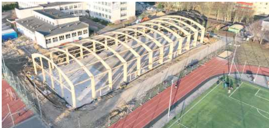
Roboty budowlane przy ul. Bogdanowicza idą pełną parą, co widać po postępach na placu budowy

zadaszenia. Wybór takiej technologii pozwala na uzyskanie dużej, otwartej przestrzeni bez konieczności stosowania wewnętrznych podpór, co jest kluczowe dla komfortu gry na pełnowymiarowym polu o wymiarach 20 na 40 metrów. To rozwiązanie techniczne łączy w sobie trwałość z nowoczesną estetyką, doskonale wpisując się w otoczenie szkoły.