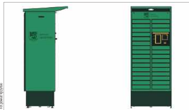
Urzędomat, który zostanie ustawiony przy starostwie

Decyzja zapadła w ramach internetowego głosowania, w którym o wyborze przesądziła liczba reakcji pod jedną z propozycji. Urzędomat ma stanąć przy siedzibie starostwa i umożliwiać odbiór dokumentów poza stan-