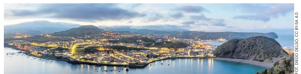
Horta jest jedną z trzech stolic archipelagu Azory

Ostatnie wypowiedzi Donalda Trumpa oraz jego administracji, która przekonuje, że należąca do Danii Grenlandia jest „niezbędna dla bezpieczeństwa Stanów Zjednoczonych”, wzbudziły niepokój wśród kandydatów na prezydenta Portugalii, której Azory