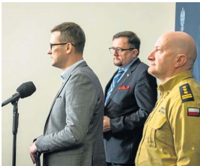
W Bydgoszczy wojewoda zwołał posiedzenie służb w związku z silnymi mrozami, które nadpłyną do regionu

W związku możliwymi trudnościami Generalna Dyrekcja