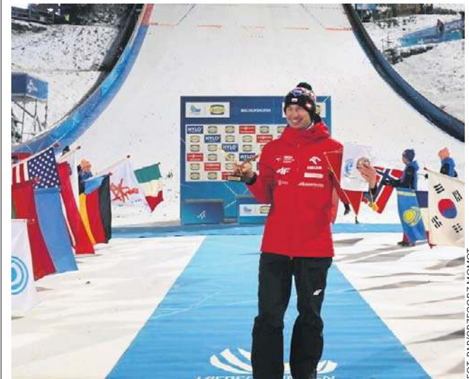
Kamil Stoch trzykrotnie wygrywał Turniej Czterech Skoczni w sezonach 2016/2017, 2017/2018 i 2020/2021

W całej karierze Kamil Stoch zarobił na skoczniach narciarskich 1 971 446 euro, czyli nieco ponad 8 300 000 złotych. Z czynnych zawodników większymi zarobkami może pochwalić się tylko Austriak Stefan Kraft - 2 368 729 euro. ©