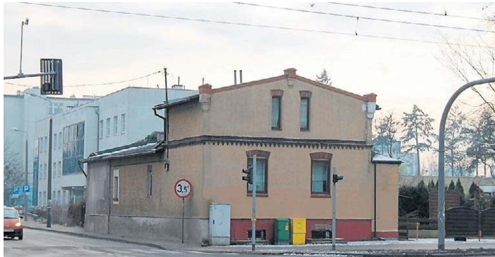
Budynek fabryki Herzfelda i Lissnera na rogu Kościuszki i Batorego, zburzony w 2019 roku

Redaktorzy „Gazety Toruńskiej” utyskiwali, że nie będzie on miał znaczenia dla nauki, ponieważ obywatele Cesarstwa Niemieckiego byli spisywani