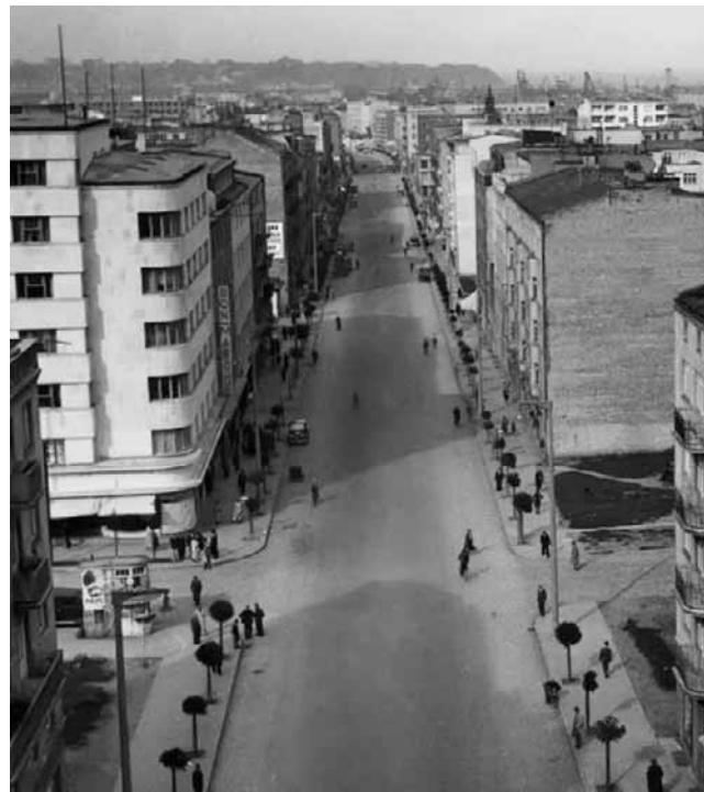
Gdynia tuż przed wojną. Ul. Świętojańska widziana z lotu ptaka, w tle stocznia