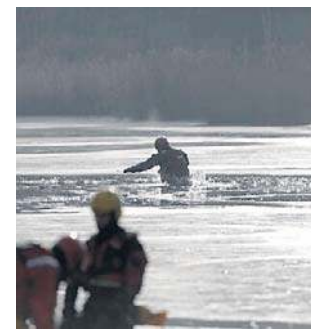
Ratownicy apelują, aby nie ryzykować na lodzie

Wystarczy chwila, by lód zarwał się pod naszym ciężarem. Każda minuta na ratunek ma wówczas znaczenie. Po ok. czterech-pięciu minutach dochodzi do hipotermii, co prowadzi do spowolnienia funkcji życiowych i realnie zagraża życiu. Wówczas liczy się szybka reakcja. Należy jak najszybciej wezwać służby ratunkowe. Czy