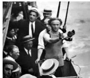
Houdini podczas jednego ze swych ekwilibrystycznych pokazów, kiedy to uwalniał się od kajdanek pod wodą