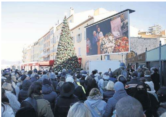
Pogrzeb francuskiej aktorki Brigitte Bardot można było śledzić na ekranach ustawionych w Saint-Tropez

Brigitte Bardot, jedna z najbardziej znanych aktorek francuskich, zmarła w niedzielę w wieku 91 lat. Zagrała łącznie w 56 filmach i zaśpiewała ponad 80 piosenek. W latach 70. zakończyła karierę filmową i poświęciła się działalności na rzecz ochrony zwierząt. PAP