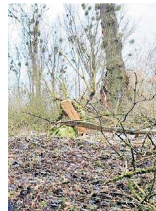
Miejsce wycinki drzew

batę dla barbarzyńskiej dewastacji drzewostanu na chronionym, w formie Obszaru Natura 2000, terenie Kępy Bazarowej, w otulinie rezerwatu przyrody - czytamy w nim między innymi. - to akt wandalizmu, jakiego w Toruniu już dawno nie doświadczyliśmy. Ogromu strat dopełnia fakt, że wycięto drzewa zdrowe, a pozostawiono starsze, zamierające, porażone przez jemiolo i suche to pole kanadyjskie, co sugeruje że sprawcy chcieli wykazać swą tężyznę fizyczną i wypróbować „sprzęt” (prawdopodobnie siekiery i/lub machety) na zdrowych okazach. ©