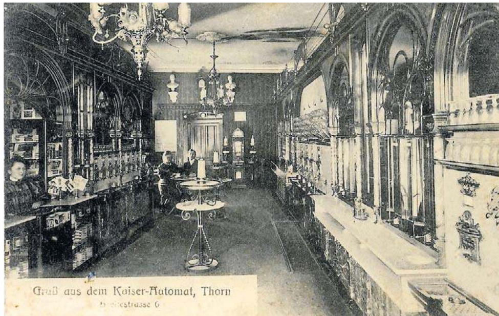
Wnętrze toruńskiej restauracji Kaiser Automat przy Szerokiej 6

O tym jak wyglądał toruński lokal sieci Kaiser Automat, my możemy się dowiedzieć dzięki pocztówce, którą w swoich zbiorach posiada Piotr Kozurno. ©©