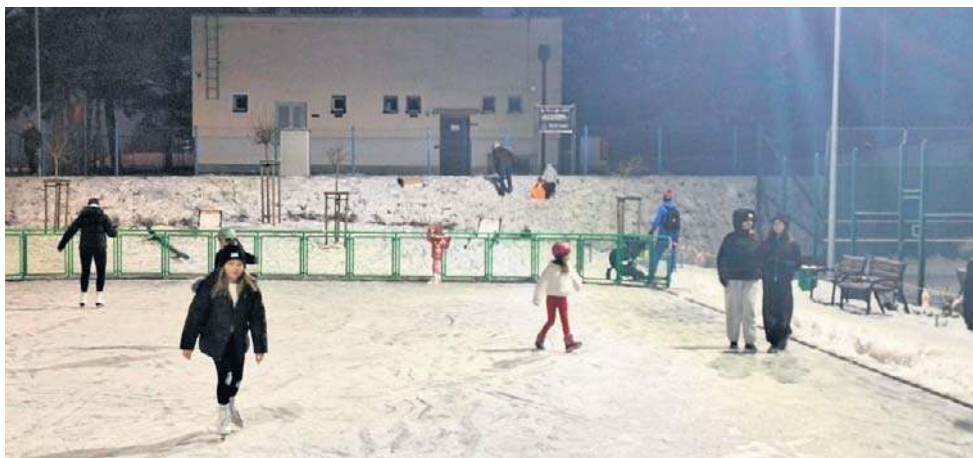
Sezonowe, osiedlowe, naturalne lodowisko u zbiegu ulic Włocławskiej i Zdrojowej w Czerniewicach

Torunianie z Czerniewic oczywiście zadbał o infrastrukturę także wokół boiska, która pomaga w funkcjonowaniu osiedlowego, sezonowego, naturalnego lodowiska. Jest tu hydrant i kilka ławek. Na nich można usiąść i zamienić buty na łyżwy.