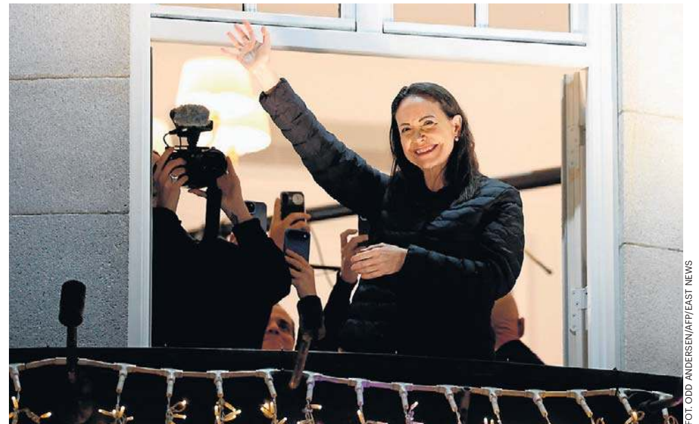
Maria Corina Machado otrzymała w 2025 roku Pokojową Nagrodę Nobla. W grudniu przybyła do Oslo i pozdrowiała swoich zwolenników

Po wyborach z 2024 r. władze ogłosiły zwycięstwo Maduro, ale wiele krajów, w tym USA i państwa UE, nie uznało tych wyników.