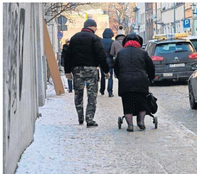
Tak wyglądały toruńskie chodniki 6 stycznia i 7 stycznia 2026 roku rano

Długa i uczęszczana codziennie przez torunian ulica Przy Kaszowniku też generalnie jest w dobrym stanie. Wiadac, że świeżo została posypana. Zasp śniegu też nigdzie nie zauważyliśmy. Podobnie było przy ul. Jagiellońskiej i Grudziądzkiej - dojeżdżając do przystanków, sklepów, insty-