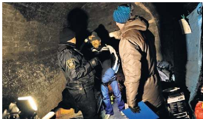
Służby odwiedzają osoby, które nie mają schronienia