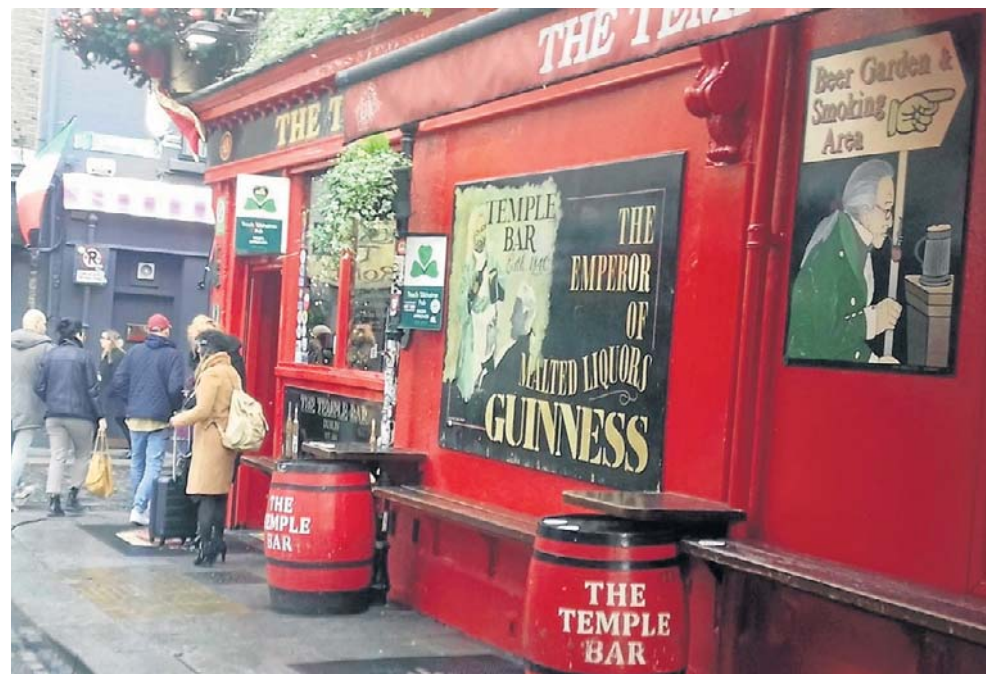
Polacy wyjechali do Irlandii głównie po 2004 r., po wejściu Polski do UE, tworząc tam największą mniejszość narodową