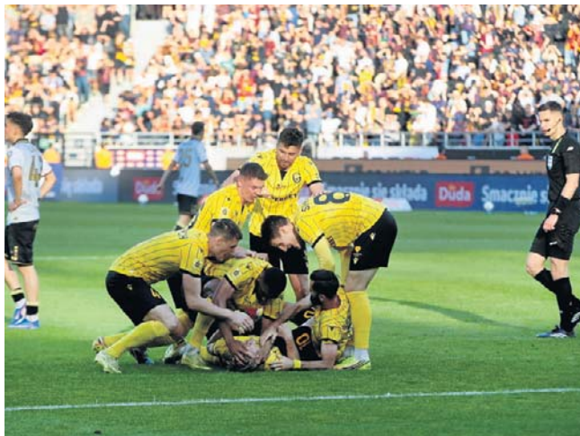
Radość piłkarzy GKS Katowice w Szczecinie była w pełni uzasadniona. Po 25 latach klub wraca do Europy