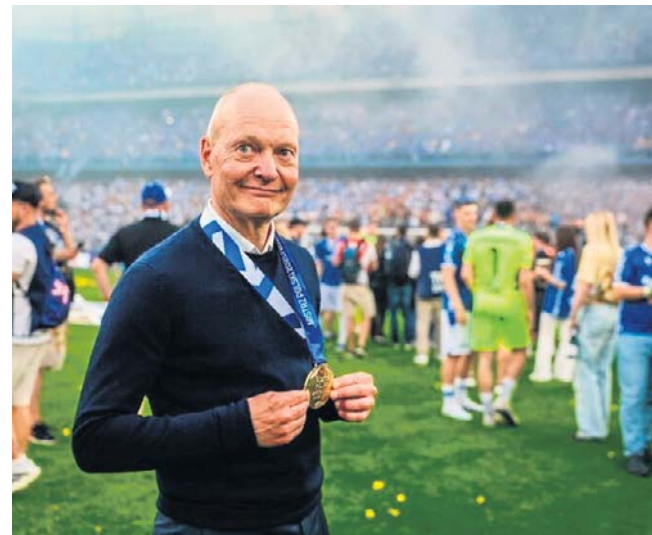
Niels Frederiksen świętował z Lechem Poznań drugi tytuł mistrza Polski

ostatniego słowa. Jest ekonomistą, potrafi doskonale obliczyć ryzyko, korzyści i ewentualne straty. Więc skoro postawił jeszcze raz na Lecha Poznań, to trudno nie ekscytować się tym, co dalej za jego może nastąpić. ©©