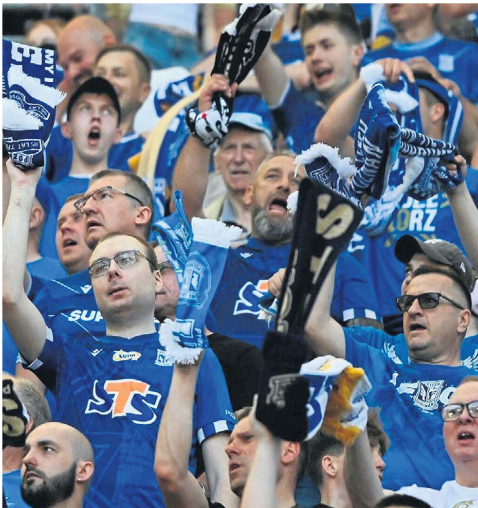
Mistrzostwo Kolejorza na Enea Stadionie świętował komplet 41 552 widzów