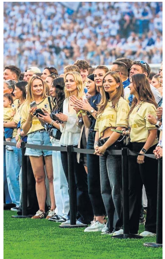
To ta piękniejsza twarz mistrzów Polski