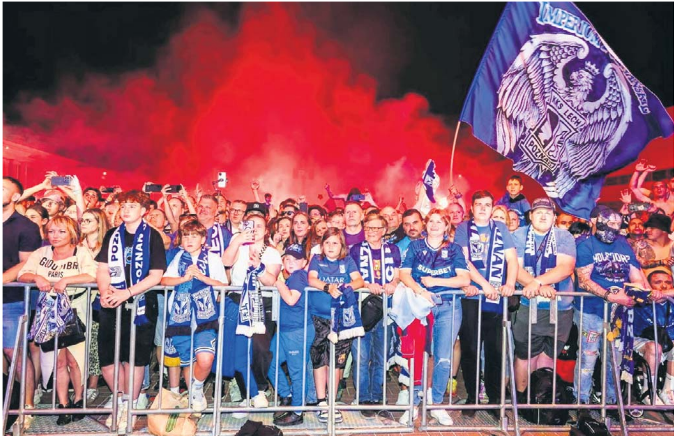
Na placu Marka na mistrzów Polski czekało ponad 20 tysięcy kibiców. Atmosfera była niesamowita

Przez całą drogę - aż do samego wjazdu od strony ulicy Śniadeckich - autokarowi z piłkarzami oraz sztabem szkoleniowym Lecha towarzyszyło około 15-20 tysięcy kibiców. Gdy mistrzowie w końcu dotarli na miejsce, na specjalnie przygotowanej scenie zameldowali się wszyscy autorzy tego sukcesu. Były wspólne śpiewy, słynne „Ishak on fire” oraz przyśpiewka dla Aliego. Sportowy Poznań zakończył wielką fetę już po świcie.