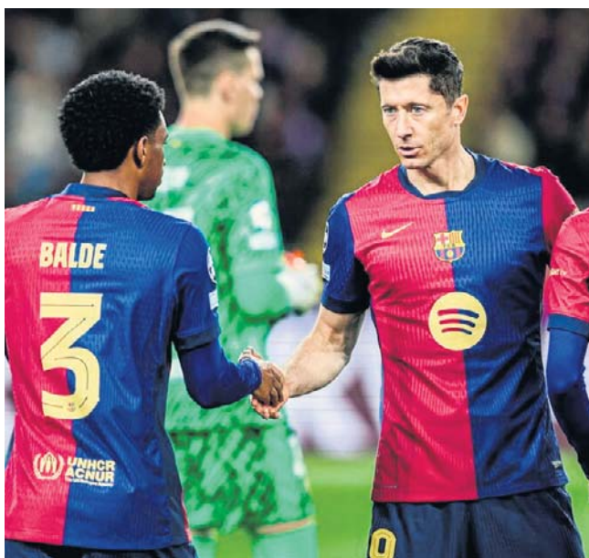
- Świetny piłkarz pożegnał się z ligą hiszpańską tak jak chciał, czyli strzelając ostatniego gola - napisał „Sport”

Zupełnie inaczej ostatnią kolejkę ligowych rozgrywek będzie wspominał Zieliński. Inter Mediolan zremisowała w „polskim” meczu 3:3 z FC Bologną, której bramkarzem jest Łukasz Skorupski.