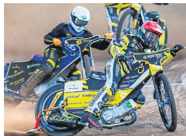
Żuźlowcy PSŻ pokazali, że trudne początki sezonu mają już ze sobą. Skorpiony wskoczyły na fotel wicelidera