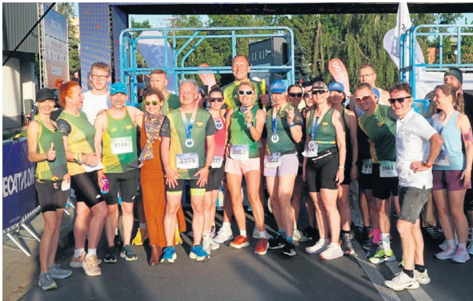
W Tarnowie Podgórnym na każdym kroku czuć atmosferę wielkiego sportowego święta

- Nie ukrywam, że moim pierwszym nastawieniem była walka o miejsce top 3 i nowy rekord życiowy, który zazwyczaj robię właśnie o tej porze roku. Koniec maja to u mnie przeważnie szczyt formy, niestety życie pisze własne scenariusze i choroba na początku maja zmieniła moje plany na to, by ten bieg ukończyć z uśmiechem na twarzy, nie myśląc o czasie i rywalizacji. Nastawiam się w tym momencie na walkę na ostatniej prostej w ramach Setki STIHL, która według mnie jest super zachętą, by zdecydowanie przyspieszyć na finiszu - mówiła