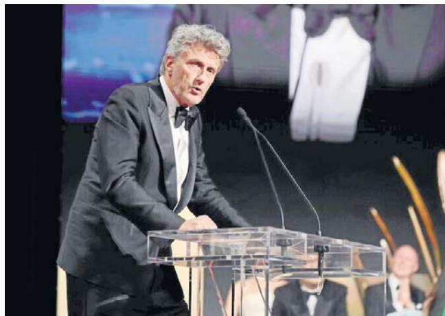
Paweł Pawlikowski otrzymał nagrodę dla najlepszego reżysera (ex aequo z Javierem Calvo i Javierem Ambrossim)

Żyjemy w świecie, w którym coraz więcej osób jest głęboko przekonanych, że stoją po właściwej stronie. To jest absolutnie przerażające. Kino musi się temu opierać, pokazywać, że sprawy nie są proste, czarno-białe. Właśnie dlatego nakręciliśmy ten film – mówił Pawlikowski, dziękując wszystkim, którzy przyczynili się do powstania obrazu.