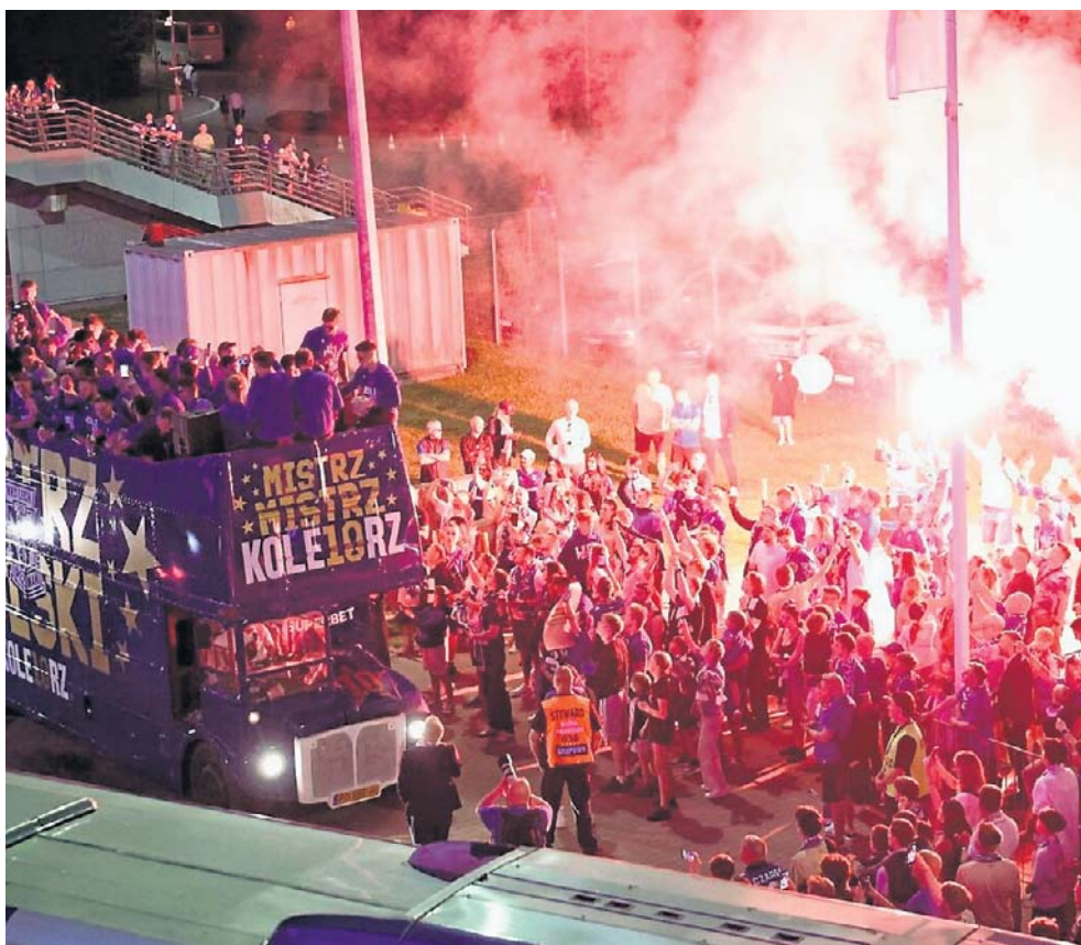
Na MTP Lechici pojechali otwartym autobusem