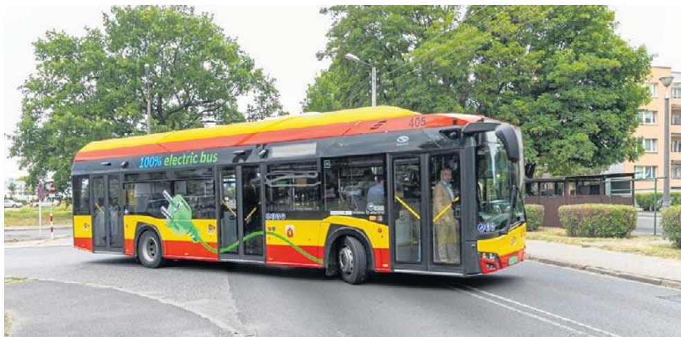
Autobusy elektryczne będą w mieście na czas, ale gotowa nie będzie jeszcze infrastruktura do ich obsługi

Na sesji przed rokiem, w lutym 2025 r., Rada Miasta podjęła decyzję o dokapitalizowaniu spółki kwotą ok. 12 mln zł z budżetu miasta na zakup elektryków, doceniając w ten sposób skuteczne ubieganie się o środki zewnętrzne. Łączny koszt inwestycji to ponad 69 mln zł. Podpisana w lipcu 2025 r. umowa obejmuje zakup 11 autobusów, w tym 7 przegubowych oraz 4