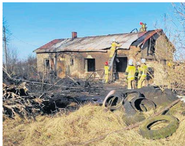
Spaleniu uległy opony. Ogień przeniósł się z nich na budynek mieszkalny

W działaniach gaśniczych udział brało łącznie 8 zastępów