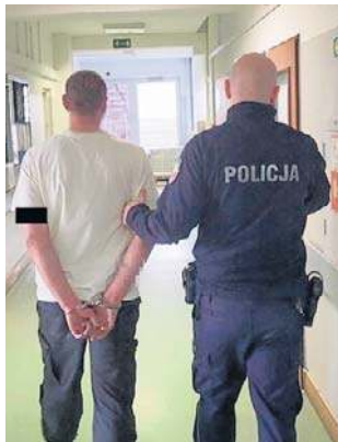
Kierowca zatrzymany do kontroli, trafił za kratki

Użycie narkotesteru potwierdziło przypuszczenia mundurowych - w organizmie 41-latka znajdowała się amfetamina. Podczas przeszukania policjanci znaleźli w kieszeni jego spodni woreczek z białym proszkiem, który również okazał się amfetaminą - informuje