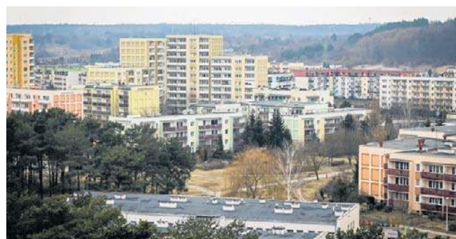
Sypialnia Bydgoszczy, jak utarło się nazywać Fordon, faktycznie kulturalnie zasnęła?