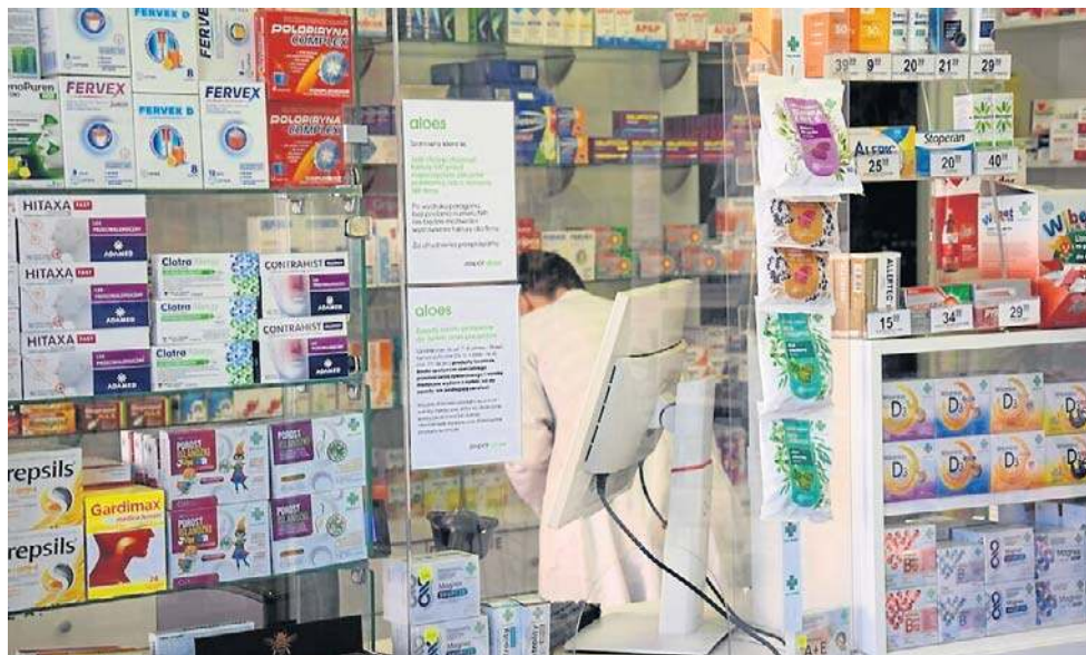
Sezon grypy i infekcji jeszcze się nie skończył, a w aptekach można się mocno zdziwić patrząc na paragon. Takie wizyty mocno odchudzają portfele

„Żona się przeziębila, więc poszła do apteki kupić Gripex i Rutinoscorbin. Powiedzieli mi, czy to jest normalne, żeby płacić prawie stówę za dwa pod-