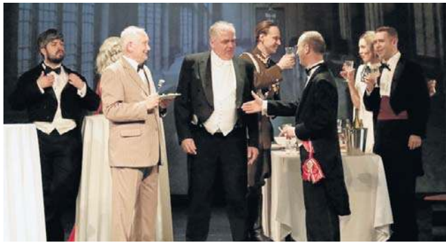
Pierwszym spektaklem festiwalu była „Kariera Nikodema Dyzmy” teatru z Koszalina