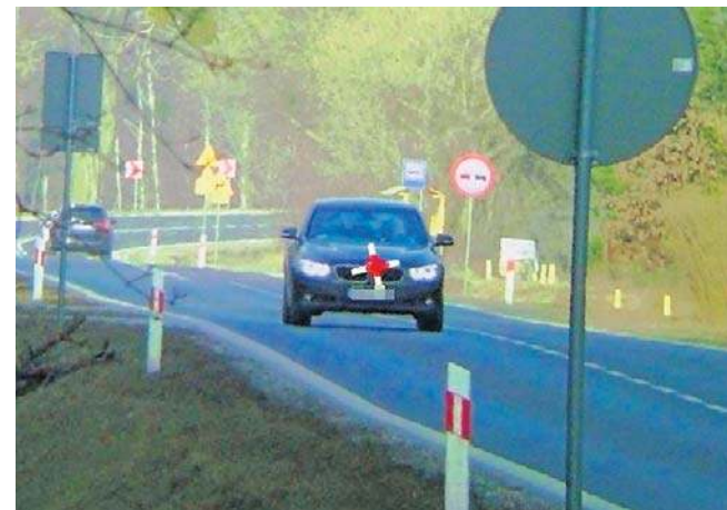
W Nowym Dąbiu pod Łabiszynom na „50” jechała 111 kilometrów na godz. Kierująca BMW straciła prawo jazdy

Kobieta została także ukarana mandatem karnym w wysokości 2000 zł, a na jej konto trafiło 14 punktów karnych.