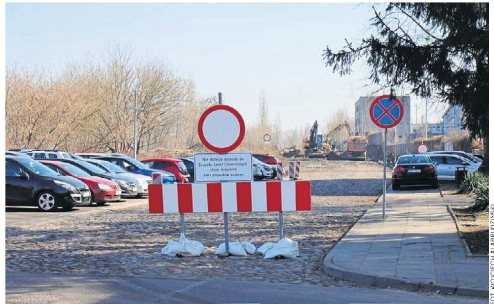
Trwają roboty ziemne związane z przedłużeniem ulicy aż do ulicy Barskiej

Prezydent Włocławka podkreśla, że inwestycja ubogaci tę część miasta i otworzy kolejne tereny inwestycje. Przypomnijmy, że na zadanie miasto pozyskało dofinansowanie. Inwestycja w stu procentach będzie finansowana z środków zewnętrznych. „W ciągu najbliższych miesięcy powstanie tutaj zupełnie nowa przestrzeń dla mieszkańców i mieszkańców