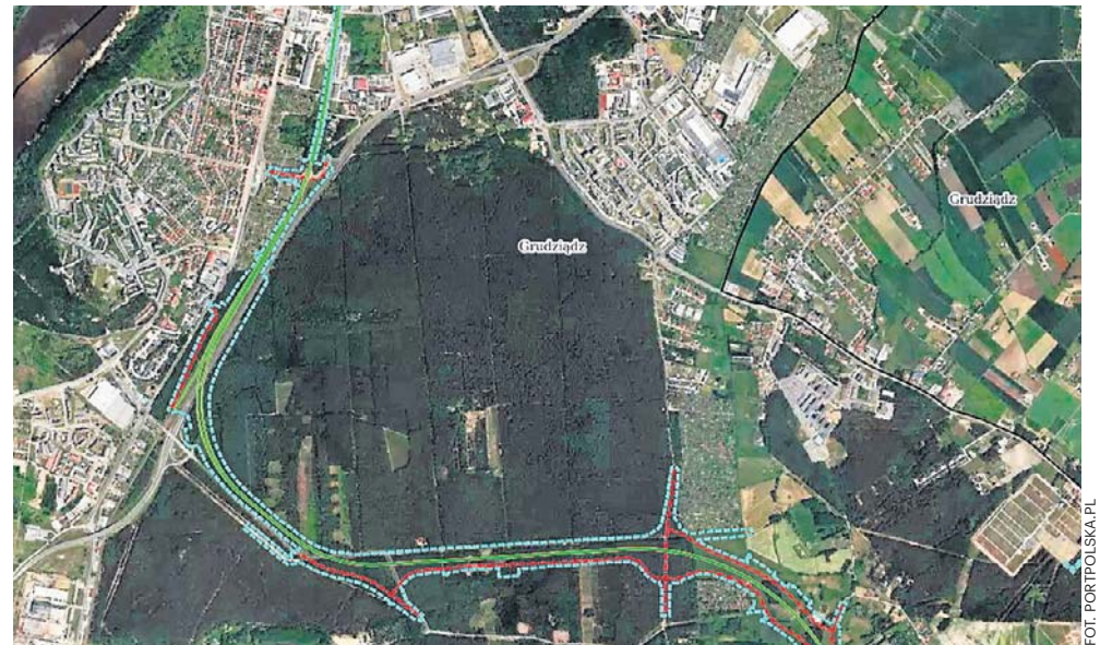
Wariant przebiegu szybkiej kolei przez Las Rudnicki zaznaczony jest zielonym kolorem

W tym wariantcie szlak kolejowy między dworcem PKP w Grudziądzu a przystankiem Rządź wiódłby częściowo