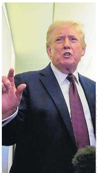
Donald Trump na pokładzie Air Force One

- Żądam, aby te kraje przybyły i chroniły swoje terytorium, bo to jest ich terytorium. To jest miejsce, z którego czerpią energię. I powinny przybyć i pomóc nam je chronić. Można by argumentować, że może w ogóle nie powinniśmy tam być, ponieważ jej nie potrzebujemy. Mamy dużo ropy naftowej - mówił prezydent USA. - Ale robimy to. Robimy to pra-