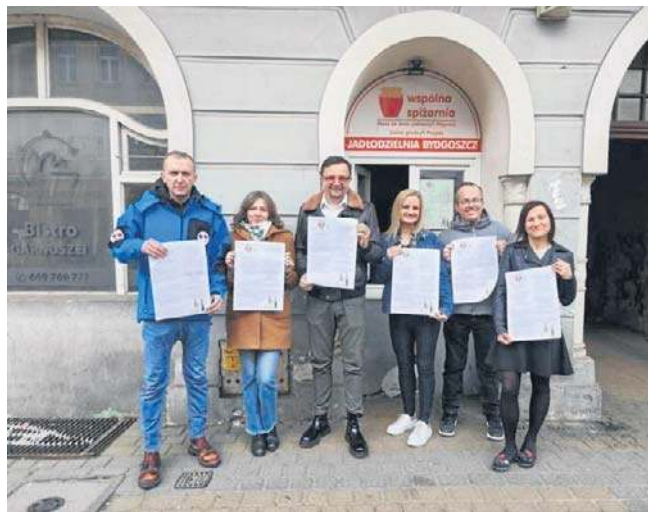
Akcja „Ciepło serca w słoiku” odbędzie się już po raz 21. Organizatorzy serdecznie zachęcają do udziału

Organizatorzy prowadzą też zbiórkę finansową. Za te pieniądze kupią bilety do kina dla podopiecznych domu dziecka i rodzinnych domów dziecka z Bydgoszczy i okolic. Zrobili to po raz pierwszy przy okazji grudniowej odsłony akcji w 2025 roku. Dzieci były zachwycone, więc i tym razem sprawią im taką niespodziankę. ©©