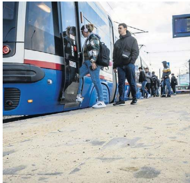
Na przystankach, chodnikach i ścieżkach rowerowych zalega sporo piachu po zimie. Zostanie zutyliizowany

„Jesteśmy ciekawi kiedy włodarze posprzątają, piach, szkła, kamienie i resztki po zimie z chodników. Czy to aby będzie gdzieś pod koniec maja, jak zawsze? W gminach już dawno czysto” - to jeden z takich wpisów w internecie. Ten konkretnie pojawił się pod postem na facebookowym fanpage'u Zarządu Dróg Miejskich