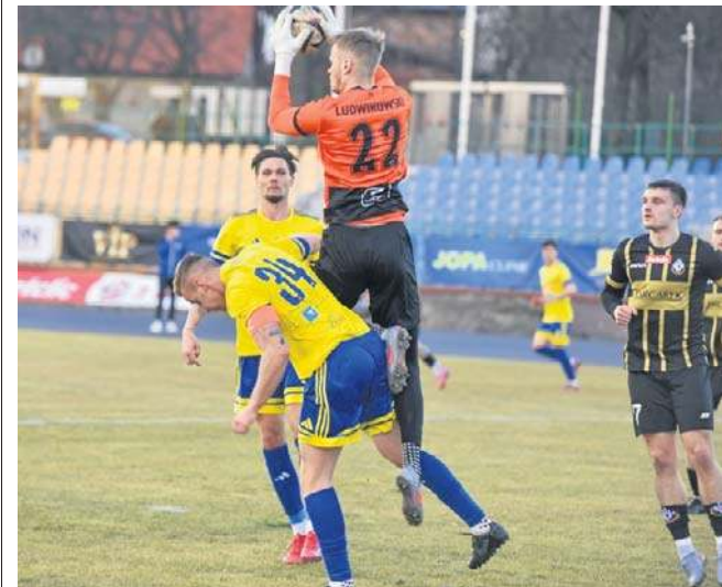
Żółto-niebiescy w dobrych humorach przystąpią do zaległego spotkania z Błękitnymi

Toruński klub poinformował, że osoby, które miały karnet na mecze jesienne wchodzą na to spotkanie za darmo. ©©