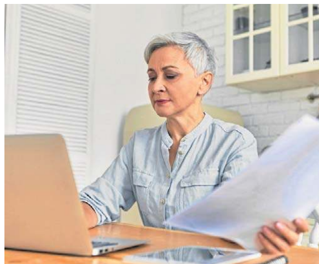
Aby otrzymać „trzynastkę”, nie trzeba składać żadnego wniosku. ZUS przyzna ją uprawnionym automatycznie

Jak co roku, ZUS wypłaci „trzynastki” wraz ze świadczeniem za kwiecień. Przysługuje w wysokości najniższej emerytury, która w tym roku wynosi 1978,49 zł brutto. Nie zależy od dochodu. - Trzynasta eme-