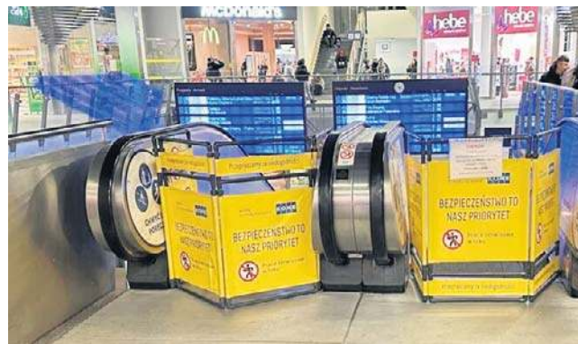
Ruchome schody na dworcu PKP Bydgoszcz Główna nie działają od czerwca 2025 roku