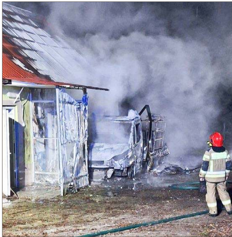
Pożar wybuchł około godziny 22:15.

- Właściciel wycenił wstępnie straty na ok. 100 tysięcy złotych i jednocześnie wykluczył, by do wybuchu pożaru przyczyniły się osoby trzecie - dodaje rzecznik dębickiej policji.