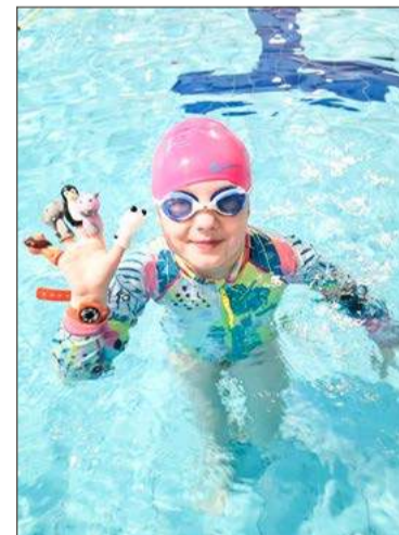
Zajęcia na basenie będą tańsze.

Dyrektor GOSiR Krzysztof Lipczyński informuje, że podczas ferii na dzieci i młodzież czekać tu będzie wiele atrakcji. W programie zaplanowano: gry i zabawy w wodzie, zabawy z piłką wodną, szukanie skarbów na dnie basenu, zabawy grupowe z wykorzystaniem piłek plażowych, rzut do