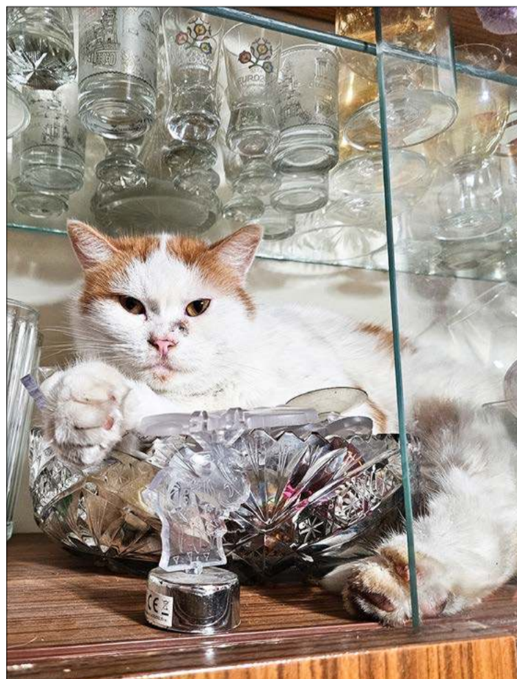
A na półce u babci taki mieszka gość.