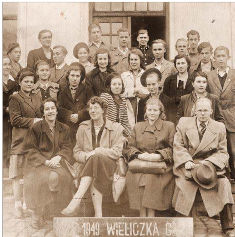
Jedno ze zdjęć z archiwum Marcina Kiwiora dostępne na jego stronie.

- W zasadzie to na to spotkanie mamy zarezerwowane dwie sale. Wszystko zależy od tego ile osób okaże się zainteresowanych