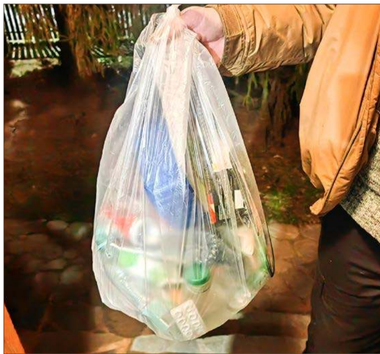
Samodzielna gospodarka odpadami to większa kontrola nad procesem ich selekcji.

Było to konieczne, by spółka mogła przejąć zadania firmy Dezako, która teraz zajmuje się odbiorem śmieci od mieszkańców. Stanie się to również w połowie roku i władze nie kryją, że obawiają się początkowych potknięć.