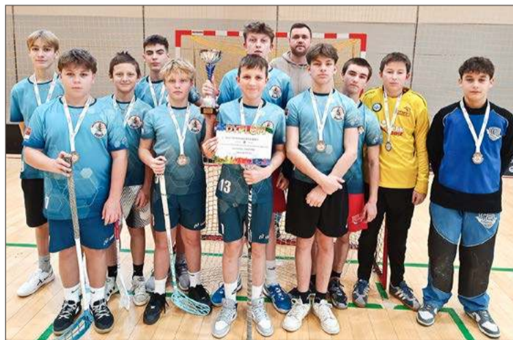
Wicemistrzostwo Podkarpacia ponownie zdobyli zawodnicy z Dębicy.

Strzelili ich trzynastu i dzięki temu obronili zdobyci przed rokiem