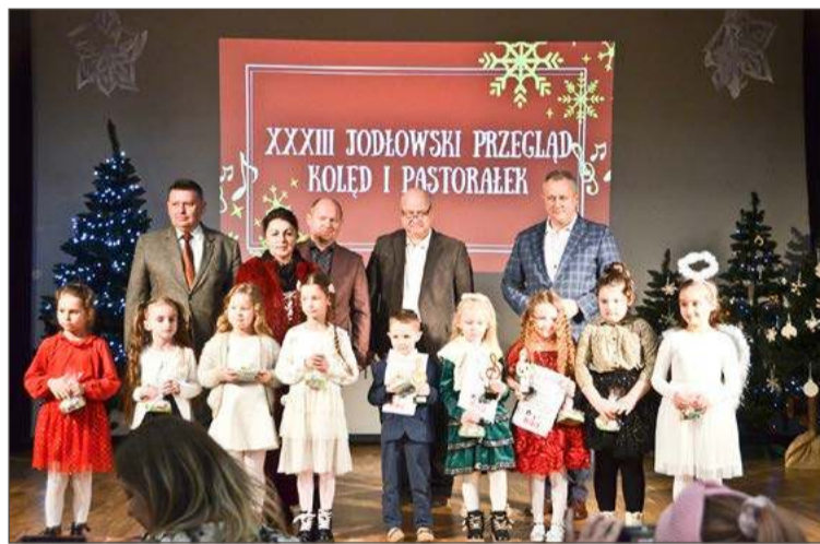
Uczestnicy konkursu w kategorii przedszkolaków.