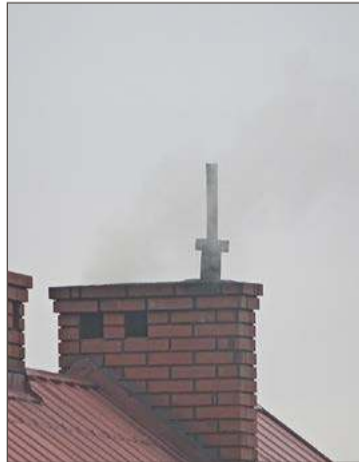
Taki dym z komina może oznaczać, że w domu jest stary piec.