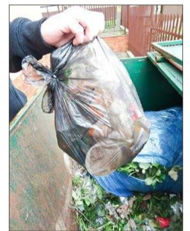
Co dalej z cenami za śmieci? Decyzja zapadnie niebawem.

Włodarz podkreśla, że nie chciałby tej nadwyżki - mówiąc potocznie - przejeść. Chciałby ją odpowiednio wykorzystać, choćby na unowocześnienie wspomnianego wcześniej PSZOK przy ul. Drogowców. Drugim pomysłem, jest