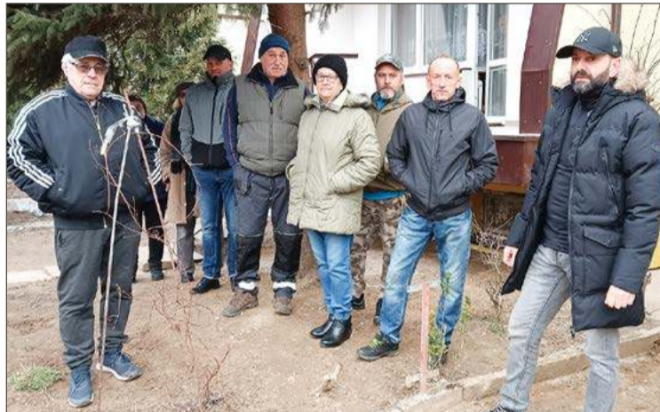
Mieszkańcy zapowiadają, że sprawy nie odpuszczą i dopilnują, żeby wszystkie usterki zostały naprawione przez wykonawcę.

Krzywo zamontowane rynny, hydroizolacja, pod którą dostaje się woda, a do tego wszystkiego wszechdobyłski bałagan.