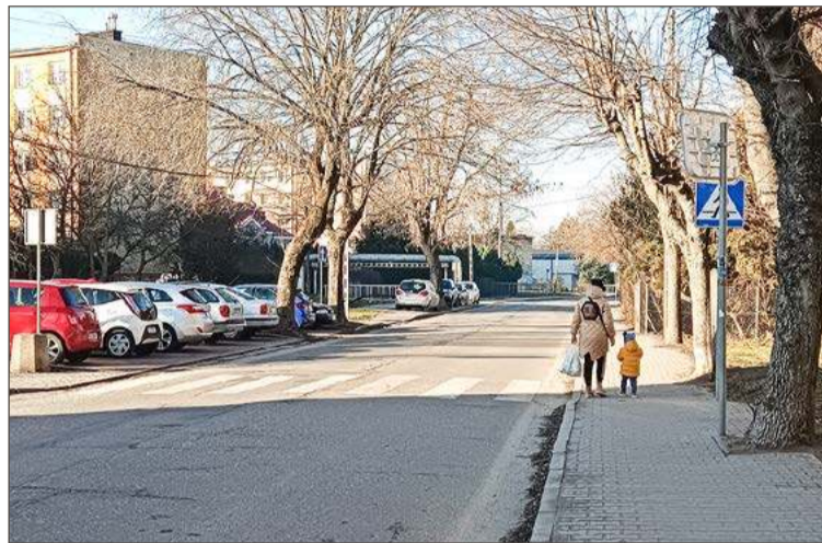
Czy progi poprawiłyby bezpieczeństwo na Konarskiego?

- Odnosząc się do wniosku o podjęcie działań zmierzających do wyeliminowania rajdów samochodowych na ul. Konarskiego informuję, że rozpatrzona zostanie możliwość wprowadzenia dodatkowych urządzeń bezpieczeństwa ruchu drogowego - brzmi odpowiedź na wniosek.