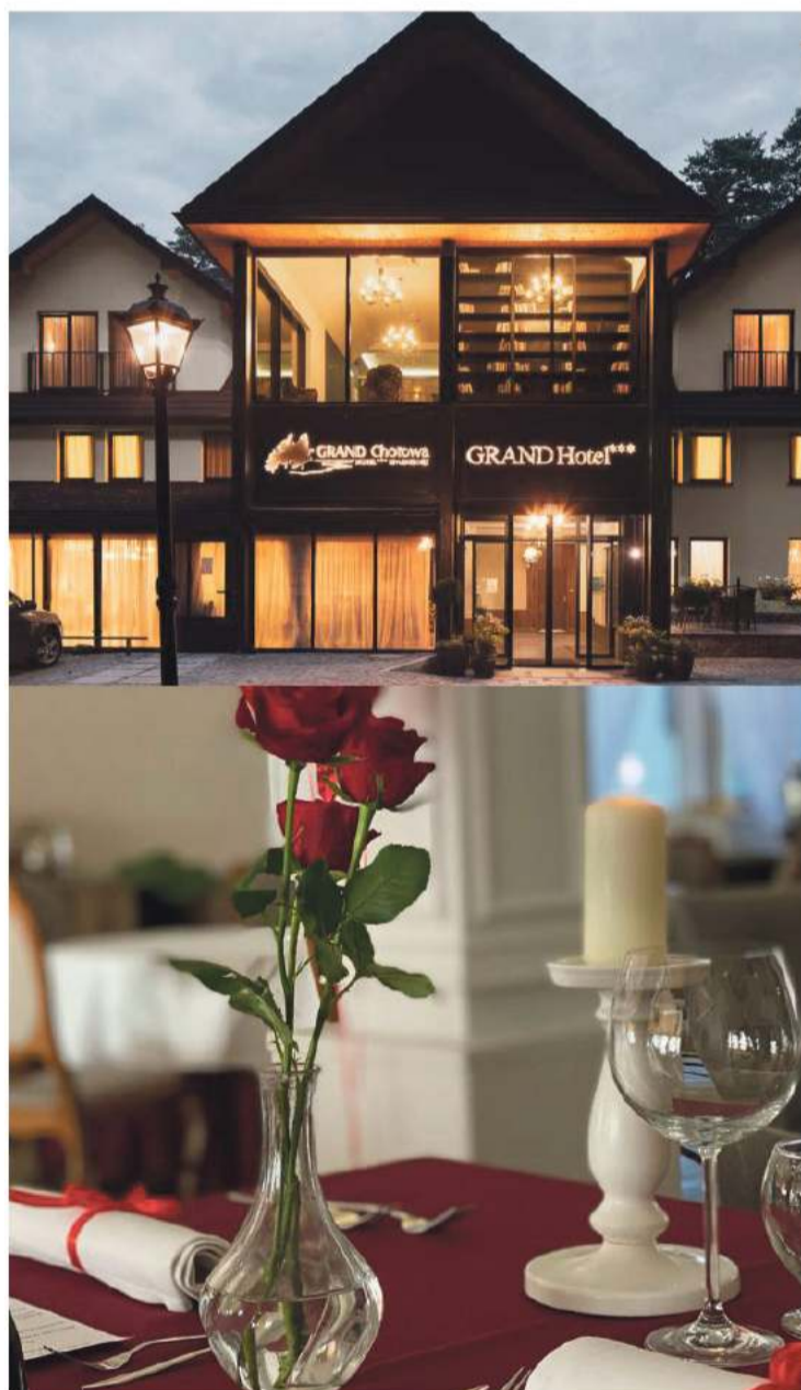
Ogłoszenie własne wydawcy

• Ferma Drobiu Żmuda w Zdziarcu 119 posiada w sprzedaży: koguty – kokoszki różnokolorowe 12 – tygodniowe 15 zł/szt. Przy zakupie powyżej 100 szt. dowóz gratis. W sprzedaży: duże jaja kremowe, wiejskie – 0,70 zł/szt. i pasza. Zapraszamy od poniedziałku do soboty w godz. 8.00-16.00. Tel. 602 817 064, 14 681 13 53.