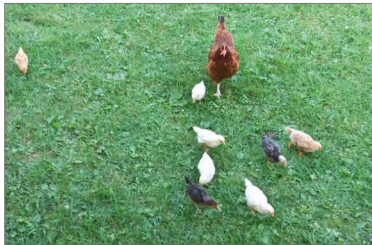
Na czas zagrożenia chorobą ptactwo nie może korzystać z wybiegów.