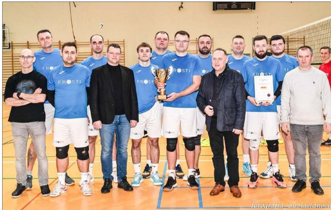
Mistrzowska ekipa Frosti Dębica z organizatorami ligi i władzami gminy Pilzno.

Ostatni etap rozpoczął się od meczu o siódme miejsce, w którym OSP Słotowa wygrała z Brzostek Team 3:0 (25-22, 25-23, 25-19). O piątą pozycję rywalizowały Drużyna Pierścienia i OSiR Brzostek, lepsza była ta pierwsza wygrywając 3:1 (25-23, 22-25, 28-26, 25-21). Brąz po najbardziej emocjonującym meczu tego wieczoru trafił do Jana Nierdzewnego po zwycięstwie nad Sokołem Dobrków 3:2 (25-20, 21-25, 25-21, 21-25, 15-7).