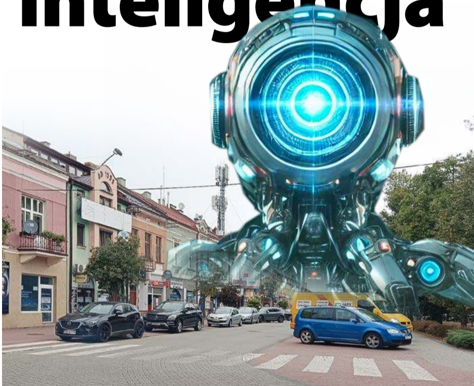
Zdjęcie ilustracyjne zrobione przy współpracy z AI.

Sanki można już schować do piwnicy. Idzie wiosna