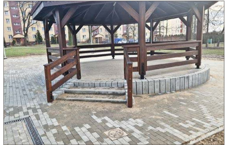
Pod wiatę nie da się wjechać samodzielnie na wózek.