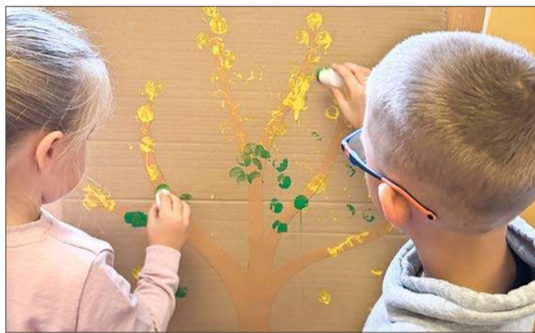
Przedstawiciele z Mysłowskiego mogą kontynuować naukę tam lub na ul. Szkolnej.

- Ale z pewnością poprawi się komfort i jakość pobytu najmłod-