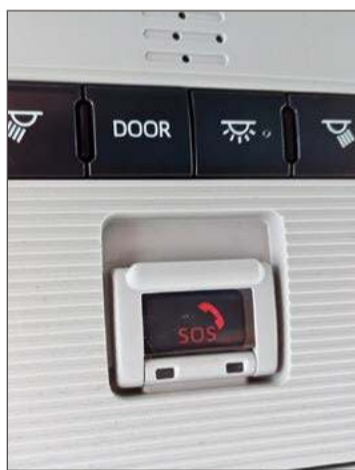
Taki przycisk jest w każdym nowszym aucie.

W ostatni czwartek strażacy otrzymali wysłane za pomocą systemu eCall powiadomienie o wypadku z udziałem samochodu ciężarowego. Miało do niego