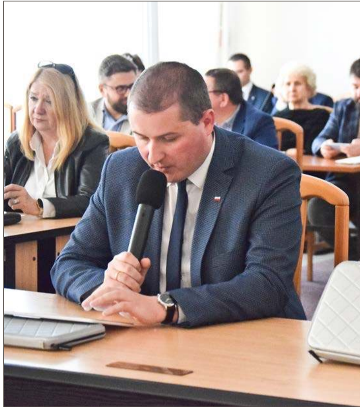
Uchwałę podjęli radni w poprzedniej kadencji.