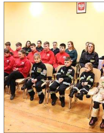
W akcję włączyła się również MDP.

Domowe testy bezpieczeństwa pożarowego są przeprowadzane w ramach programu Czujka dymu pod każdą strzechą, który realizowany jest przez Zarząd Główny Związku Ochotniczych Straży Po-