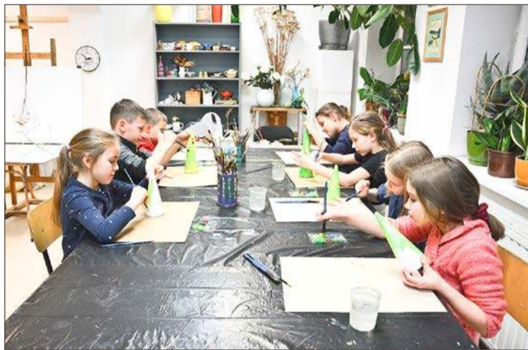
Zajęcia odbywać się będą w Galerii Miejskiego Ośrodka Kultury.

Nazajutrz w środę od 10:00 do 13:00 zaplanowano zajęcia plastyczne. Będą w nich mogły uczestniczyć dzieci w wieku 10-12 lat. W czasie spotkania poznają podstawy tworzenia makram, a hasło zajęć to Makramowe ramki. Koszt uczestnictwa 30 zł.