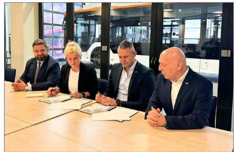
Umowa podpisana, a autobusy przyjadą do nas w przyszłym roku.