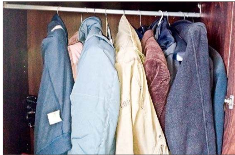
Ubrania, w których już nie chodzisz, możesz odwieźć na pszok.