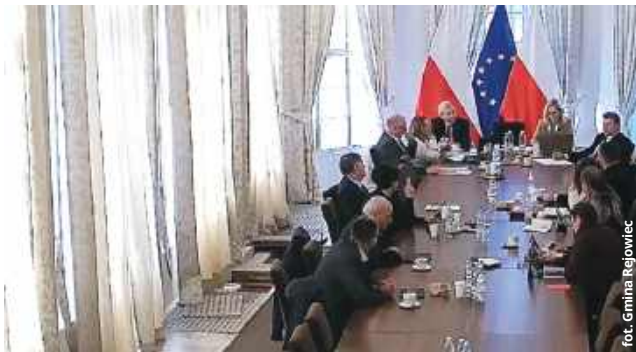
Radni podczas ostatniej sesji debatowali o drogach powiatowych

Stan techniczny dróg powiatowych to w gminie Rejowiec temat bardzo drażliwy. Samorząd od wielu lat zabiega o to, aby zarząd powiatu pochylił się nad niektórymi odcinkami i zadbał, jeśli nie o gruntowną przebudowę, to chociażby o doraźny remont. Władze gminy nie mogą też zrozumieć, dlaczego wóldar powiatu zezwala na to, aby poruszały się po nich transportujące materiały budowlane lub buraki TIR-y. W czasie ostatniej sesji rady miejskiej okazało się również, że powodów, jakie kryją się za napiętymi relacjami obu samorządów, jest więcej.