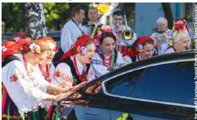
Warto wspólnie zbudować coś pięknego. Zespół Pieśni i Tańca Ziemi Chełmskiej zaprasza panów do współpracy

Ofiaruj coś zespołowi. Zostaniesz obdarowany z nawiązką Zespół to nie tylko ekipa osób,