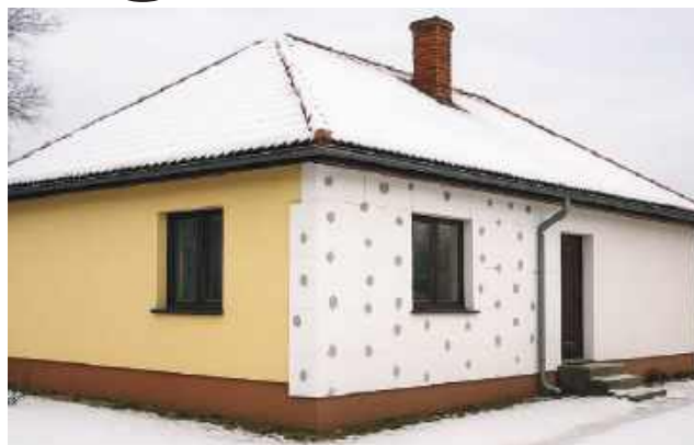
Wygienowane przez Chata Opt

Zanim przystąpimy do jakiegokolwiek prac modernizacyjnych, kluczowe jest wykonanie audytu energetycznego. Jest to pierwszy i najważniejszy krok, ponieważ pozwala on precyzyjnie ustalić, które i w jakich ilościach ciepło ucieka z budynku. Działanie bez audytu jest jak leczenie bez diagnozy – może być nieskuteczne i kosztowne. Audyt wskaże optymalną kolejność działań termomodernizacyjnych, które zagwarantują największą efektywność inwestycji. Ponadto dokumentacja ta jest często wymagana do uzyskania dofinansowania z programów rządowych.