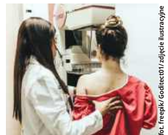
fol. freepik/Go4dget01/zdjęcie ilustracyjne

♦ Środa, 3 grudnia, w godz. 9:00-17:00 - Chełm, ul. Sybir-