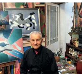
Od pistoletu do pedzla / 24