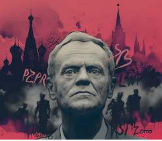
Postkomunistyczne zombie wraca / 4