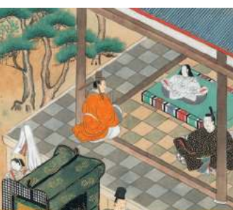
Ksiaze Promienisty / 66