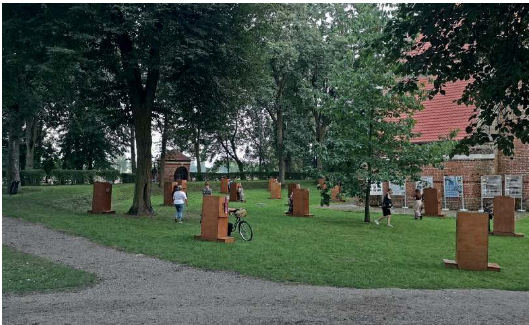
Spowiedź na kodeńskich łąkach. Niezwykły obrazek sierpniowego odpustu u ojców oblatów.

Synoptycy obiecują, że dziś słupki rtęci znowu przekroczą 30 stopni Celsjusza. Prowadząca po leniwej równinie droga co rusz zaprasza nas do zielonych lasów. Spomiędzy liściastych gałęzi drzew raz po raz widać przeciskające się uparcie promienie słoneczne. Nie wszystkim się udaje. Dzięki temu w lesie czuć kojący chłód. Odpocznienie. Nie na długo jednak. Kawałek za prawosławnym cmentarzem w Zaborowie las się kończy. Perspektywa naraz się rozszerza. Przed nami widać już zielonkawą kościelną wieżę z połyskującym w słońcu złotym krzyżem. To Kodeń. Będziemy tam za trzy minuty. A nie, przepraszam. Spoglądam na nawigację. Wyznaczona trasa jest w tej chwili cała na czerwono. Tuż przed miejscowością czeka nas 10-minutowy korek. To jest ten jedyny dzień w roku, gdy nawet ta podlaska wieś musi doświadczyć tego, czym jest powolna jazda i stanie na zderzaku poprzedzającego nas auta.