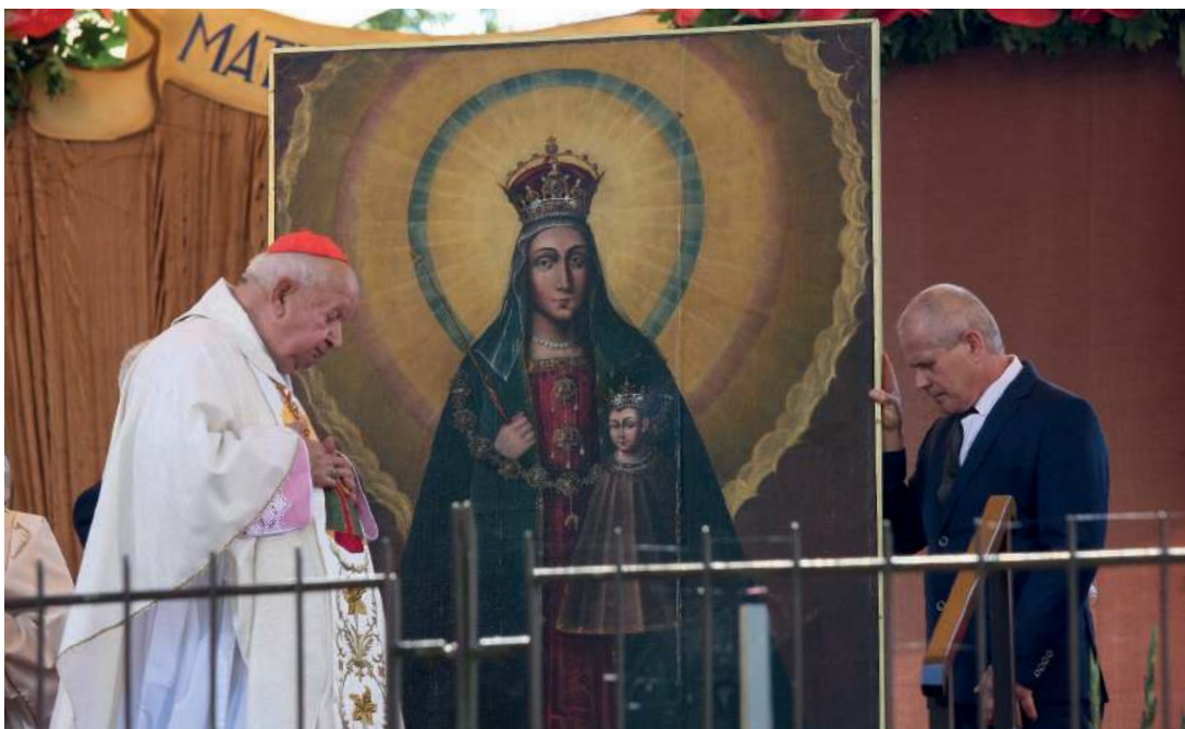
Tuż przed koronacją.

świętyni. Kościół ma stanąć na rynku miasta, nieopodal dotychczasowego drewnianego kościółka parafialnego pw. św. Anny. Budowa, owszem, rozpoczyna się, jednakowoż sam jej sponsor zaczyna chorować. Dolegliwości u Sapiehy stają się z czasem na tyle poważne, że książe zaczyna odczuwać paraliż. Siłą rzeczy budowa świątyni zostaje przerwana, sam zaś zainteresowany udaje się za namową żony na pielgrzymkę do Watykanu. Będzie tam prosić o łaskę odzyskania zdrowia.