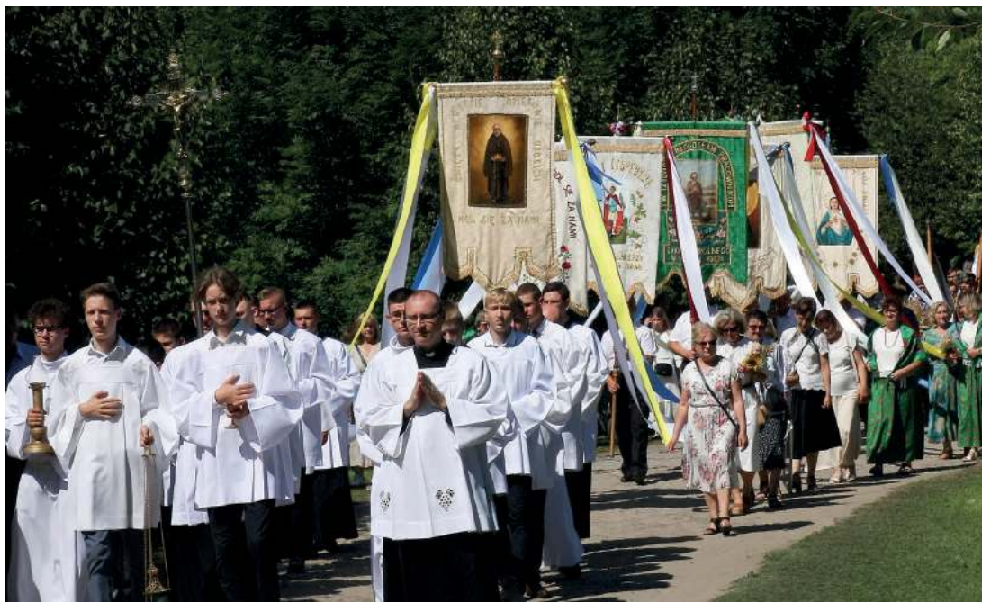
Procesji podążającej z bazyliki św. Anny ulicą Jana Sapiehy w kierunku Kalwarii Kodeńskiej przyglądają się tysiące wiernych.

mieszczenia. Wybija okna w ścianie prezbiterium, a nad kaplicą boczną, w której miał się znaleźć obraz Matki Bożej Kodeńskiej, projektuje balkon. W ten sposób po zakończeniu budowy będzie mógł przynajmniej przysłuchiwać się modlitwom zanoszonym w świątyni, nie łamiąc jednocześnie papieskiego zakazu.