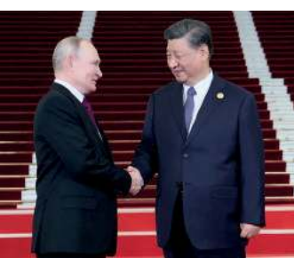
Proniemieckie rzady w Polsce dobre dla Moskwy i Pekinu / 84