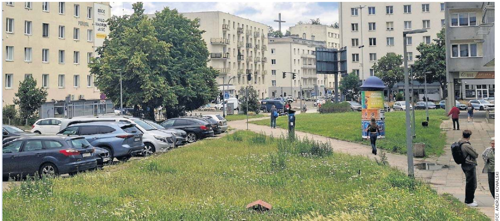
Patronem tego placu miałyby być Ignacy Daszyński. Postulują o to gdyńscy działacze Nowej Lewicy