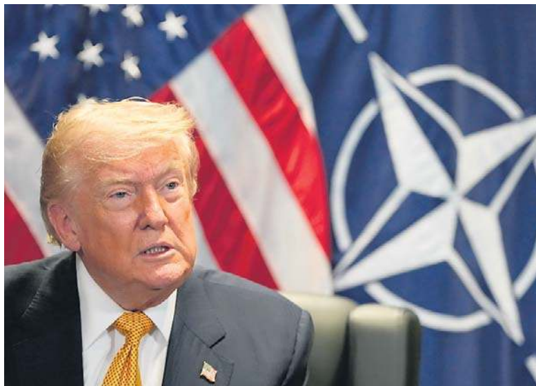
Trump, przemawiając przed szczytem NATO, powiedział, że myśli, iż wstępne porozumienie pokojowe z Iranem przestało obowiązywać

Amerykańskie siły uderzyły nocą z wtorku na środę w irańskie systemy obrony powietrznej, sieci dowodzenia i kontroli, przybrzeżne stacje radarowe, zdolności w zakresie pocisków przeciwokrętowych, a także w ponad 60 małych łodzi należących do Korpusu Strażników Rewolucji Islamskiej (IRGC), znajdujących się w cieśninie i w jej pobliżu – poinformowano w komunikacie Dowództwa Centralne USA (CENTCOM).