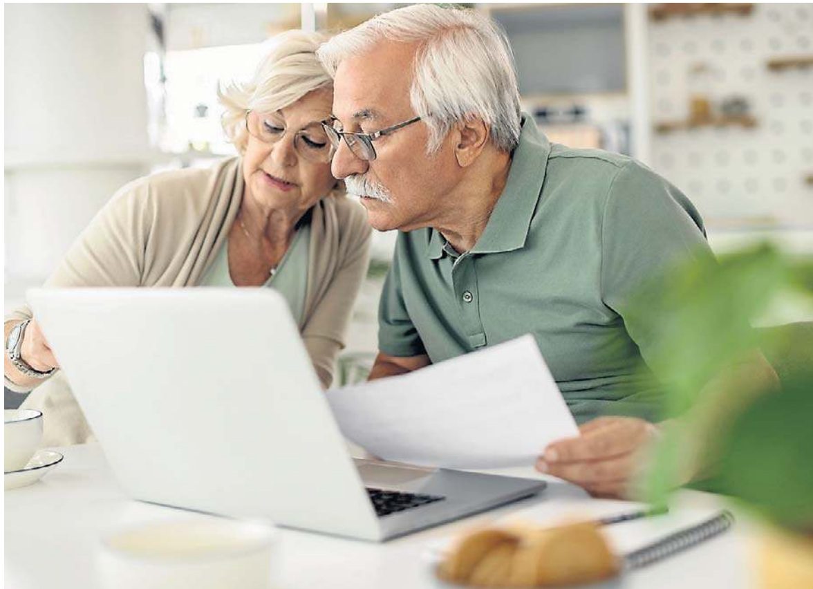
Przyszli emeryci powinni z rozwagą zaplanować moment zakończenia aktywności zawodowej. Mogą wiele zyskać

Osoby, które osiągnęły już wiek emerytalny i składają wniosek o świadczenie w późniejszym cza-