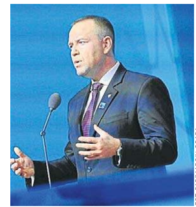
Prezydent Karol Nawrocki na szczycie NATO

Polska wydaje blisko 5 procent PKB na obronność, co czyni ją „modelowym sojusznikiem” w ramach NATO. Nawrocki podkreślił również znaczenie budowy relacji transatlantyckich, które są kluczowe dla bezpieczeństwa Europy.