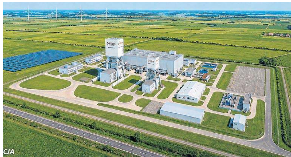
Tak może wyglądać kopalnia polihalitu w województwie pomorskim

Realizacja przedsięwzięcia może potrwać ponad dekadę. Przygotowanie dokumentacji i uzyskanie niezbęd-