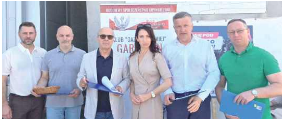
Mieszkańcy powiatu chętnie składali podpisy popierające akcję

Na ulicach polskich miast oraz w mediach społecznościowych trwa obywatelska inicjatywa Prawa i Sprawiedliwości pod hasłem „Stop Nielegalnej Migracji”. Celem akcji jest zebranie co najmniej 500 000 podpisów pod wnioskiem o przeprowadzenie ogólnokrajowego referendum z pytaniem: „Czy jesteś za odrzu-