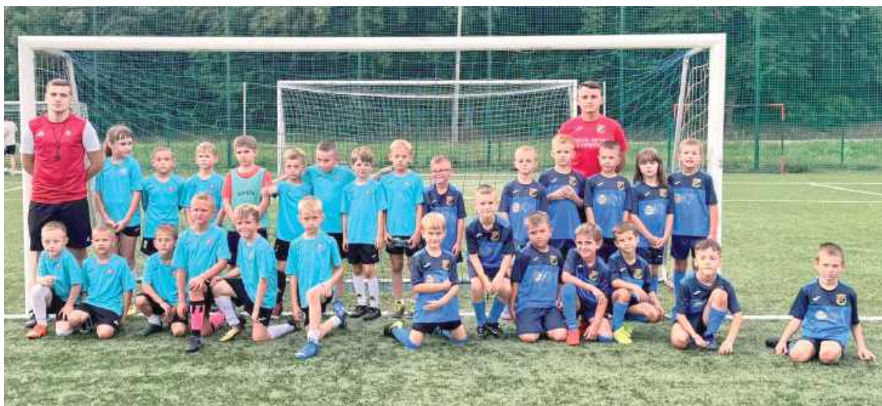
Zespoły Mazurków Gończyce i Wilgi Garwolin po raz pierwszy w tym sezonie zmierzyły się ze sobą w grze kontrolnej

Seniorzy już wystartowali, przyszła także pora na najmłodszych. Roczники 2018 Mazurków Gończyce i Wilgi Garwolin w ostatni piątek zagrały ze sobą sparing.