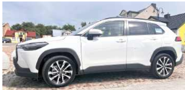
Nowe hybrydowe auto zakupione przez gminę Żelechów

Zakup hybrydowego auta to część większego projektu realizo-