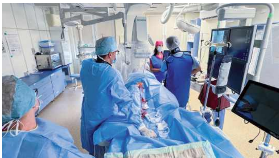
W Garwolińskim Szpitalu po raz pierwszy wykonano przeznaczyniowy (nieoperacyjny) zabieg zamknięcia ubytku przegrody międzyprzedsionkowej serca

Z radością informujemy, że w Garwolińskim Szpitalu po raz pierwszy wykonano przeznaczyniowy (nieoperacyjny) zabieg zamknięcia ubytku przegrody międzyprzedsionkowej serca (ASD). To nowoczesna i małoinwazyjna metoda leczenia wrodzonych wad serca, dotychczas dostępna głównie w wyspecjalizowanych ośrodkach kardiologicznych - poinformowały władze SP ZOZ w Garwolinie.