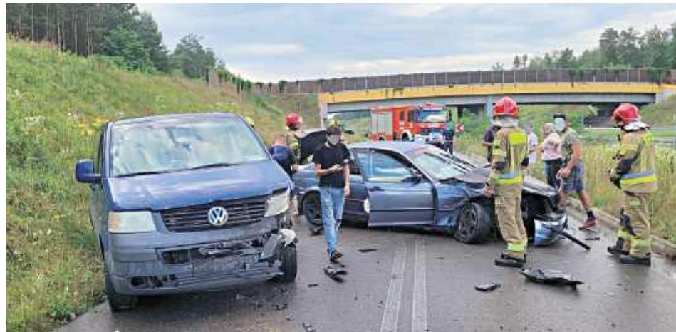
ok Kawalki rozbitych aut były porzucane po jezdni

Na sprawcę kolizji policjanci nałożyli mandat.