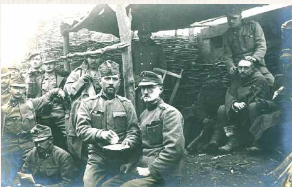
Polacy w armii austro-węgierskiej w okresie I Wojny Światowej. Wojna lat 1914-1918 nazywana była wojną pozycyjną - żołnierze walczyli w okopach miesiącami, cierpiąc choroby i głód