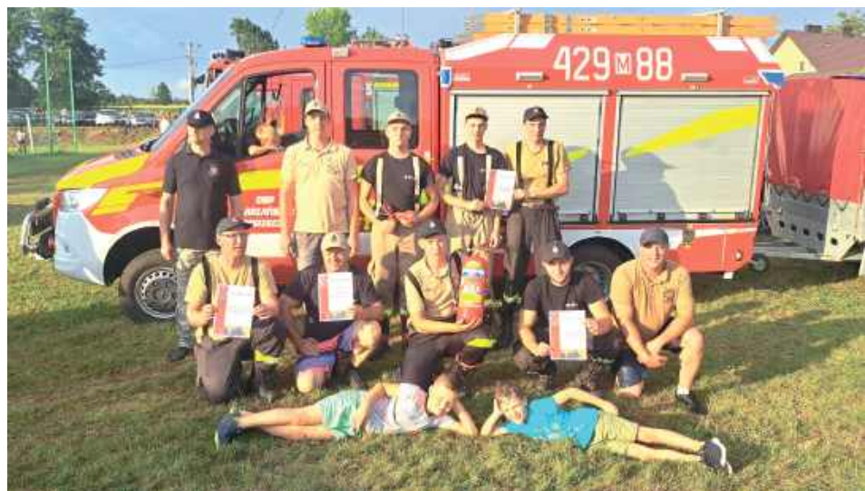
Zwycięska drużyna z OSP Mariańskie Porzeczce

Strażacy z jednostki OSP Mariańskie Porzeczce zajęli pierwsze miejsce w ogólnej klasyfikacji zawodów sportowo-pożarniczych, które odbyły się 20 lipca w Starym Miastkowie. Okazali