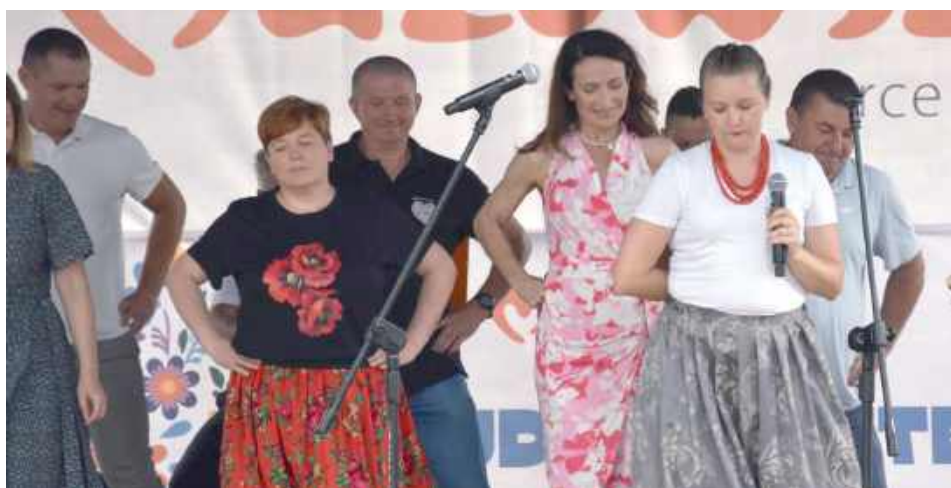
Na scenie trwała nauka tańca ludowego, w której udział wzięła m.in. starosta powiatu garwolińskiego Iwona Kurowska