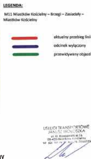
M11 Miastków Kościelny - Brzezi - Zasiadały - Miastków Kościelny

Rusza rozbiórka istniejącego i budowa nowego mostu na rzece Wildze. Powiat Garwoliński uzyskał na ten cel blisko 2 mln zł dofinansowania z rezerwy subwencji