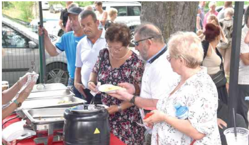
W czasie przerwy w występach dla mieszkańców i gości przygotowane zostały lokalne kulinarne specjalności