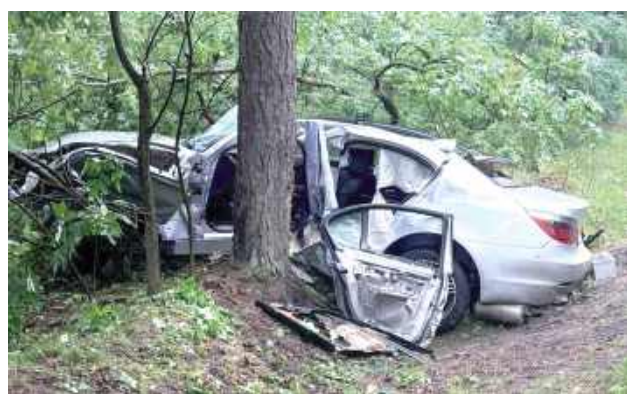
Widać, że siła uderzenia musiała być bardzo duża

Do groźnego wypadku doszło w sobotę, 19 lipca na drodze krajowej nr 76 w miejscowości Borowie. Strażacy musieli wyciągać zakleszczoną w aucie kierowcę.