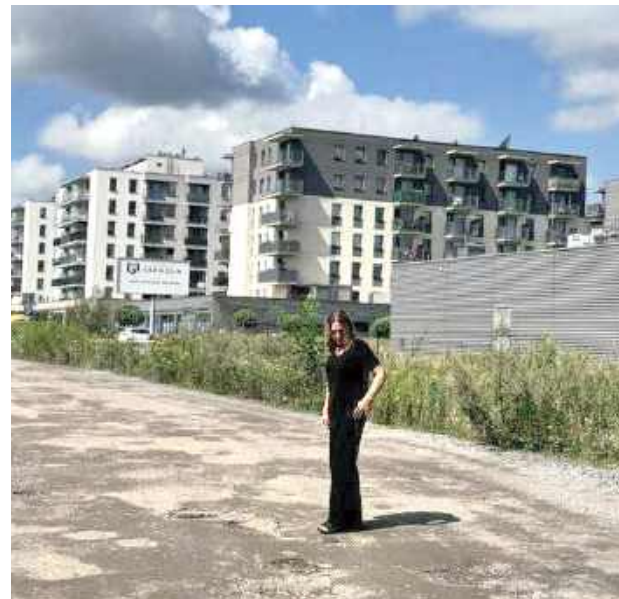
Po latach prac nad uregulowaniem własności gruntów, pozyskaniem funduszy i przygotowaniem projektów, kończymy z błotem i dziurami na 474 m ulicy

„Po latach prac kończymy z błotem i dziurami!”