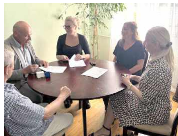
Umowa podpisana, ruszają prace

W poniedziałek, 21 lipca w Urzędzie Miasta w Garwolinie podpisano umowę na budowę ulicy Zamojskiej. Blisko pół kilometra traktu powstanie do końca października.