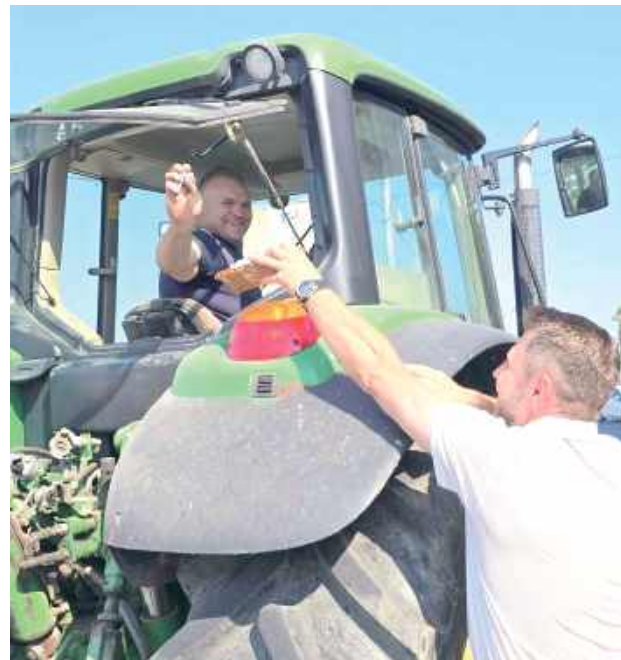
Zbrano blisko 1300 podpisów poparcia pod wnioskiem o referendum dotyczącym przymusowego przyjmowania nielegalnych imigrantów

Wśród zbierających podpisy znalazł się także Jan Pospieszalski, znany polski muzyk, dziennikarz i prawnik publicysta.