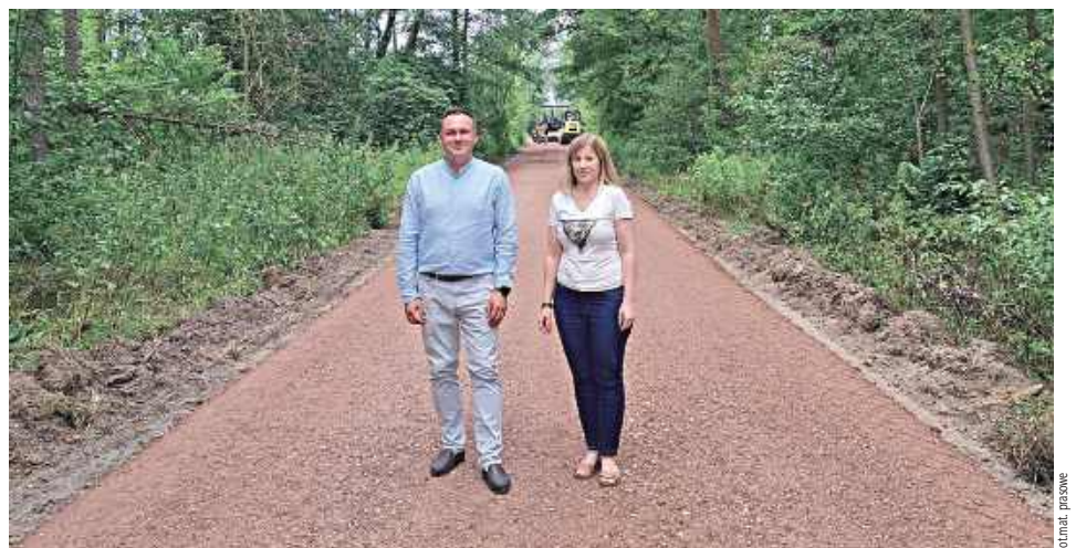
Trwają prace na drodze dojazdowej do gruntów rolnych w miejscowościach Przewóz - Antoniówka Świerżowska

Urząd Miasta i Gminy Maciejowice poinformował, że rozpoczęły się prace w ramach „Przebudowy drogi dojazdowej do gruntów rolnych w miejscowościach Przewóz - Antoniówka Świerżowska”.