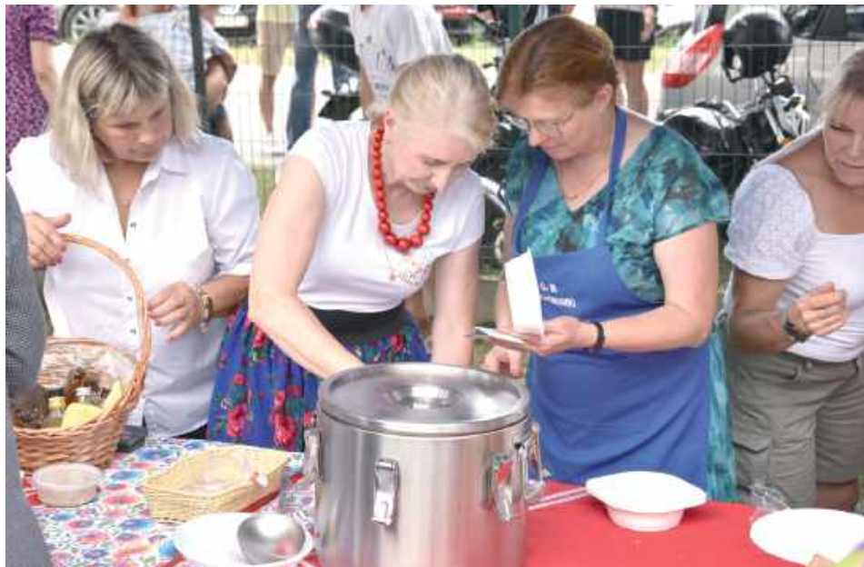
Pyszne domowe specjalności serwowały panie z Koła Gospodyń Wiejskich Strychowianki

W minioną niedzielę w Strychu koło Maciejowic odbyła się prawdziwa uczta dla wielbicieli folkowego grania! Urzeczeni, Wólkowianki, Czerwona Jarzębina i Kapela Rokicińskich wystąpili podczas festynu „Na ludową nutę”.