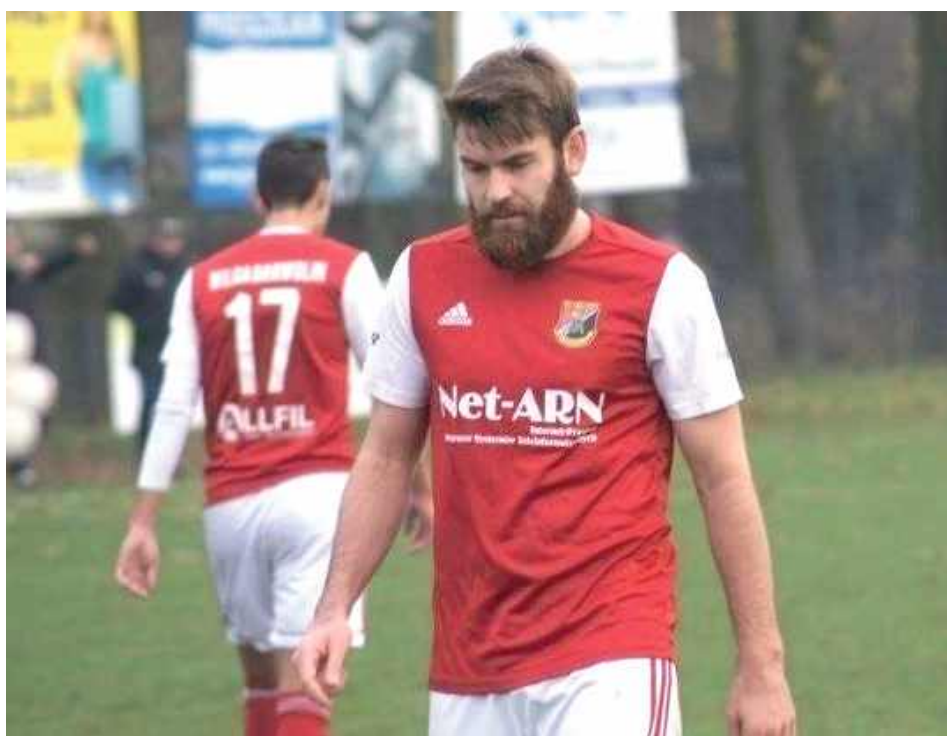
Wilga Garwolin zmierzy się z Mazurem Karczew na inaugurację czwartoligowych rozgrywek. Czego mogą się spodziewać?