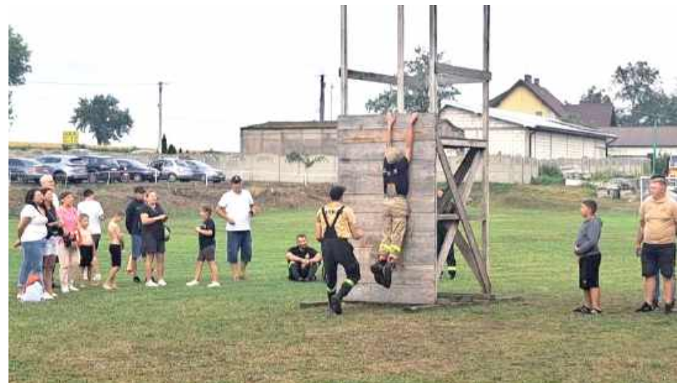
Rywalizacja była zacięta!

we, rota oraz przeciąganie liny. Dzięki zaangażowaniu, determinacji i doskonałej współpracy całej drużyny udało się osiągnąć najwyższy rezultat. Zwycęstwo to jest dla nas ogromnym