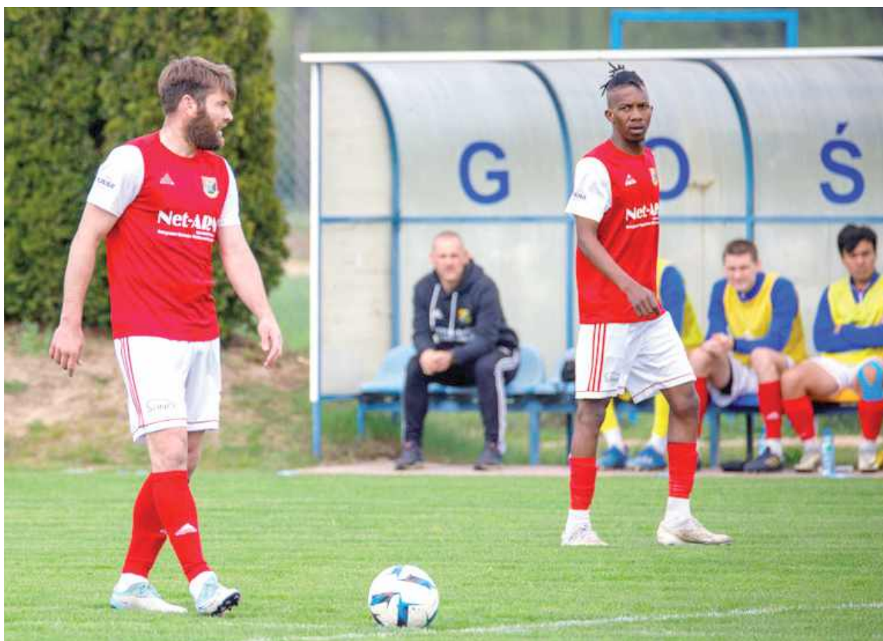
Zespół Wilgi w ostatnich trzech meczach sparingowych odniósł trzy bardzo pewne zwycięstwa