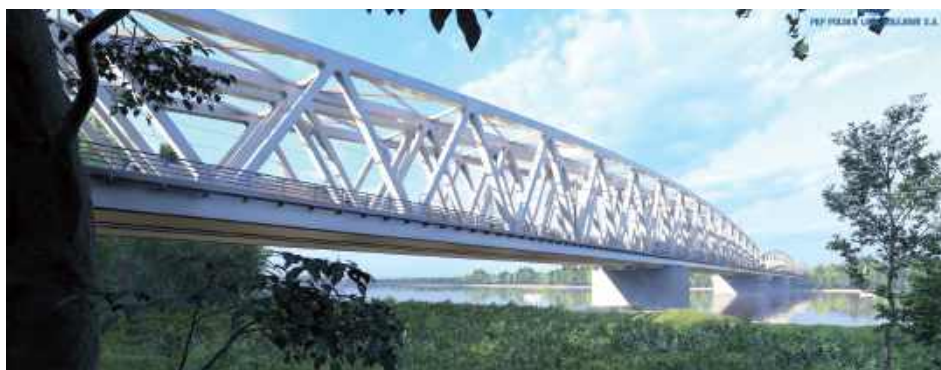
Wizualizacja mostu na Wiśle w Górze Kalwarii, linia kolejowa nr 12

1 576 367 401,73 zł brutto - tyle przeznaczono na inwestycję