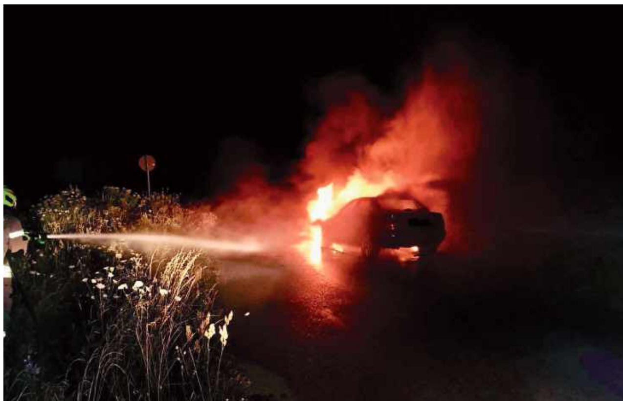
W pojeździe odnaleziono zwęglone zwłoki osoby, której tożsamość jest ustalana

Niewyobrażalna tragedia. W nocy z soboty na niedzielę w Grabniaku (gmina Sobolew) doszło do pożaru samochodu osobowego.