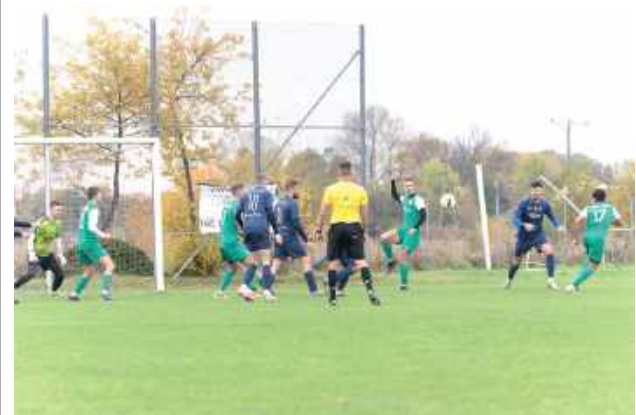
Zespoły Orła Unin i Hutnika Huta Czechy poszukują wzmocnień. Więcej informacji w artykule

Orzeł Unin i Hutnik Huta Czechy ogłosili nabory uzupełniające do drużyn seniorskich i nie tylko.