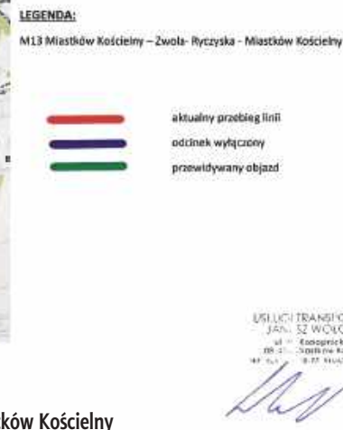
M13 Miastków Kościelny - Zwola - Ryczyska - Miastków Kościelny

czyska - Gózek wraz z dojazdami” (Miastków Kościelny, ul. Szkolna, most nr JN1 1001836). W związku z tym wójt gminy Miastków Kościelny informuje, że zostaje zmie-