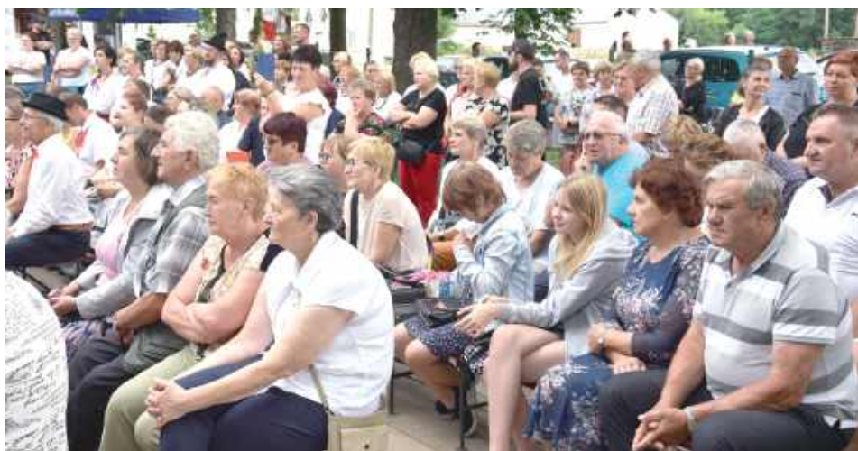
Na festynie pojawiły się całe rodziny z bliższej i dalszej okolicy, świętujące razem letni weekend w folkowym stylu