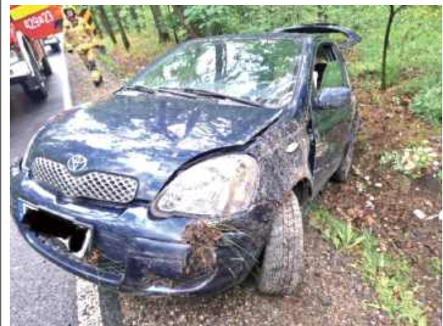
Kierująca Toyotą nie dostosowała prędkości do panujących warunków na drodze

W sobotę, 19 lipca na drodze krajowej nr 76 pod Borowiem doszło do dwóch wypadków z udziałem aut osobowych.