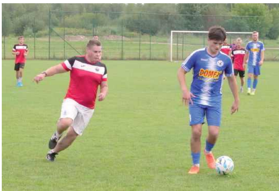
Pojedynek Sępa z Orłem obfitował w bramki i ciekawe zagrania. Ostatecznie zakończyło się remisem 3:3

Spotkanie Orła Parysów z Sępem Żelechów zapowiadało się zdecydowanie najciekawiej z całego planu weekendowego na sparingi drużyn z powiatu garwolińskiego. Pierwsi do końca byli zaangażowani w walkę o awans od ligi okręgowej, z kolei Sęp, choć przytrafiały im się słabsze mecze, potrafił niejednokrotnie napsuć krwi tym najsilniejszym w siedleckiej klasie okręgowej. Dodając do tego, że obie drużyny grają w myśl powiedzenia, że nieważne ile bramek stracić, grunt to strzelić jedną więcej od rywala zgromadzeni kibice mogli liczyć na ciekawe widowisko. Świetnie rozpoczęło się dla „Paryżan”. Pierwsza połowa należała zdecydowanie do nich, co przypieczętowali