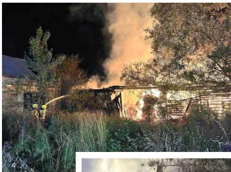
Ogień pojawił się w budynku po północy

Do pomocy zaangażowana została ładowarka teleskopowa druha z OSP Sokół