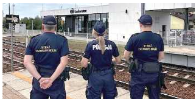
W ramach akcji prowadzone są działania profilaktyczne

W ostatnim czasie wspólne patrole można było spotkać w Łaskarzewie, a podobne działania realizowane są także w Piławie i Trojanowie. Policja i Straż Ochrony Kolei współdziałają nie tylko w zakresie interwencji i prewencji, ale również edukacji - przypominają podróżnym o zasadach bezpiecznego zachowania oraz reagują na niepokojące sytuacje.