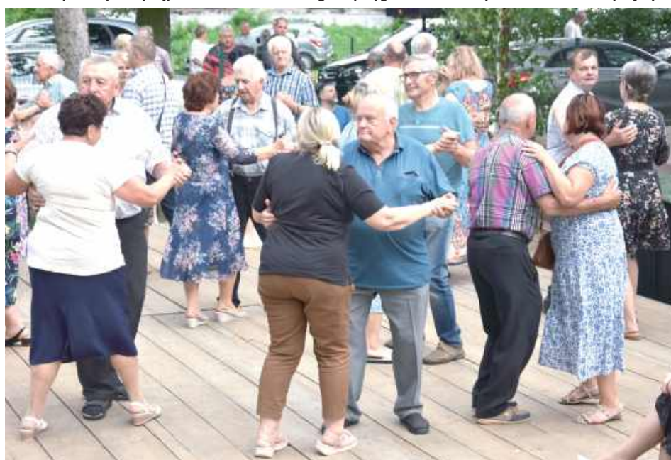
Zabawa była przednia, a ci odważniejsi mogli pokazać swoje umiejętności taneczne na specjalnie przygotowanej scenie