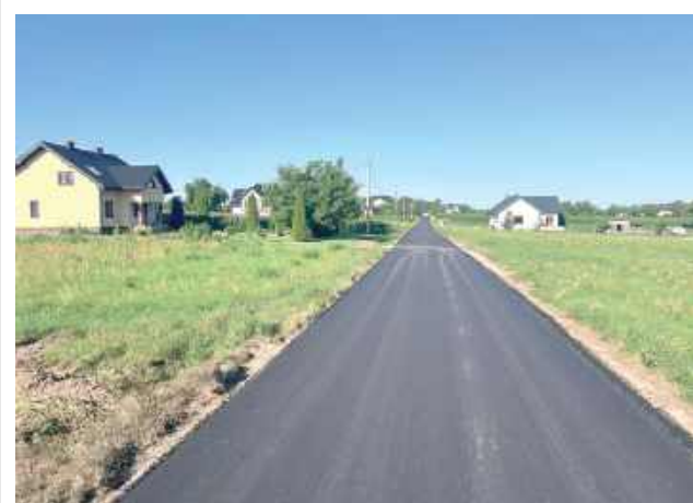
Na terenie gminy Sobolew powstają kolejne odcinki dróg