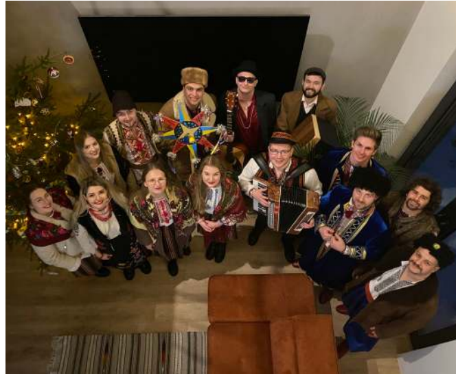
Колядники з Гданська

Колядники Перемишля також опублікували на фейсбуці свій підсумок сезону колядування. У місті над Сяном кілька гуртів заспівали різдвяні колядки, щоб підтримати українських захисників на фронті.