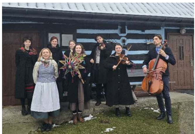
Гурт «Крайка» під час колядування