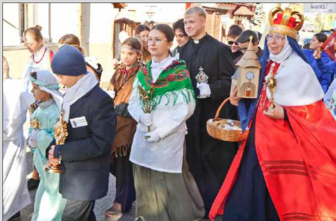
Ulicami Dębicy przemaszerowali po raz kolejny uczestnicy Pochodu Świętych. Dzieci i dorośli przebrani za świętych patronów i niosący ich relikwie przeszli w sobotę 25 października z kościoła św. Jadwigi do klasztoru na ul. Krakowskiej. Wśród tych, których zaprezentowali byli święci w każdym wieku, od Carlo Acutisa, który zmarł w wieku 15 lat, po Jana Pawła II, który miał lat 85. Wydarzenie to w zamysłu organizatorów ma stanowić przeciwwagę dla coraz popularniejszego w Polsce Halloween.