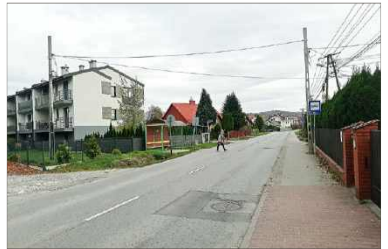
Obecnie piesi przechodzą przez ulicę w dowolnym miejscu.

Według burmistrza potrzeby mieszkańców są większe