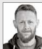
krol@ol.com.pl tel. 14 670 27 87