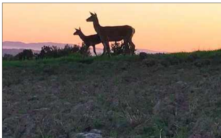
Patrzeć w tę samą stronę.