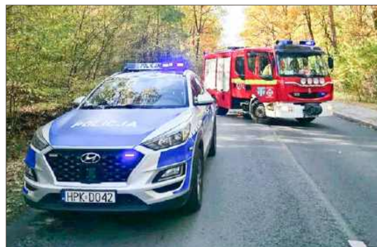
Rowerzysta nie zasygnalizował manewru.