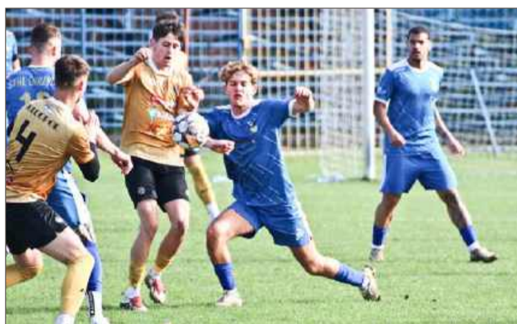
Igloopol (jasnobrązowe koszulki) wywalczył trzy punkty w Gorzycach.