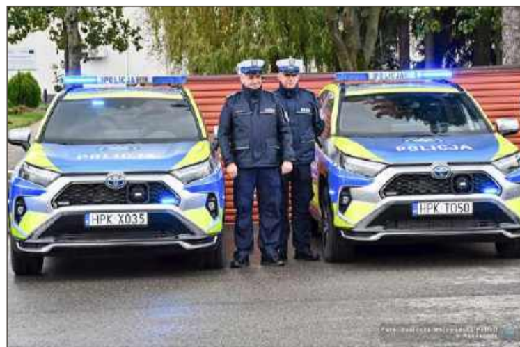
Takimi autami pochwaliła się Komenda Wojewódzka.

Nie ukrywa, że taki samochód naszym funkcjonariuszom bardzo się przyda, szczególnie w akcjach,