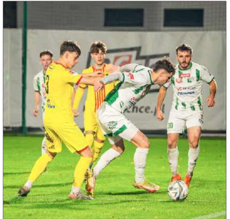
Wisłoka (biało-zielone stroje) nie dowiozła prowadzenia do końca meczu.