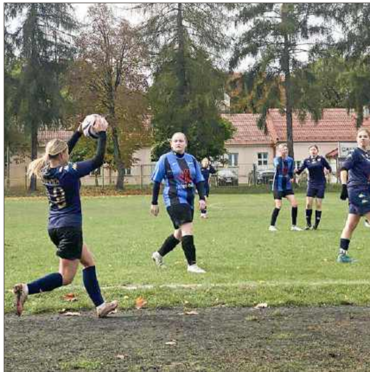
Dębiczanki (granatowe koszulki) przed rundą wiosenną są w bardzo korzystnej sytuacji.

łęga, Łojek, Gołąb (65 Nykiel), Jeż (70 Madej), Wielgos (70 Piróg), Dzik (50 Matyjewicz), Golec (80 Krysiak), Bielatowicz (80 Goc-Kuczyńska), Korus.