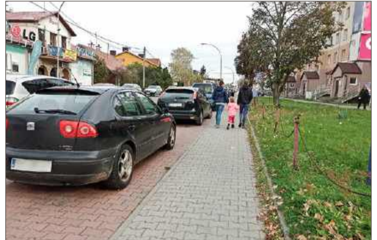
To chyba najwęższy odcinek na trasie przejazdu autora filmu.

Na kolejny brak przejazdu rowerowego zwraca uwagę na skrzyżowaniu Rzeszowskiej z Bojanowskiego, gdzie nie po raz pierwszy musi przeprowadzić swój jednoślad przez przejście.