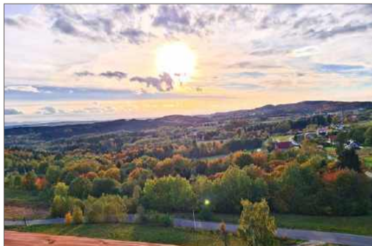
Przy dobrych warunkach pogodowych dostrzeżemy z niej Tatry.

To m.in. tam trafiła informacja o tym, że wieża - choć jeszcze nie została oficjalnie otwarta - jest już dostępna dla turystów. W ramach pierwszego etapu powstała 31-metrowa atrakcja turystyczna z platformą widokową na wysokości 26 metrów. Tuż obok znalazła się wie-