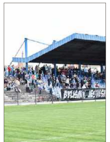
Stadion aż prosi się o remont.

Co konkretnie mogłoby zostać zrobione na miejskim obiekcie? Podstawa trybuny pozostałaby bez zmian, natychmiastowego remontu wymaga jej nawierzchnia. Do tego