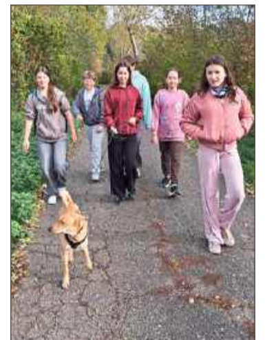
Młodzież zabrała psy na spacer.

I wyrazili nadzieję, że wkrótce ponownie spotkają się z młodymi