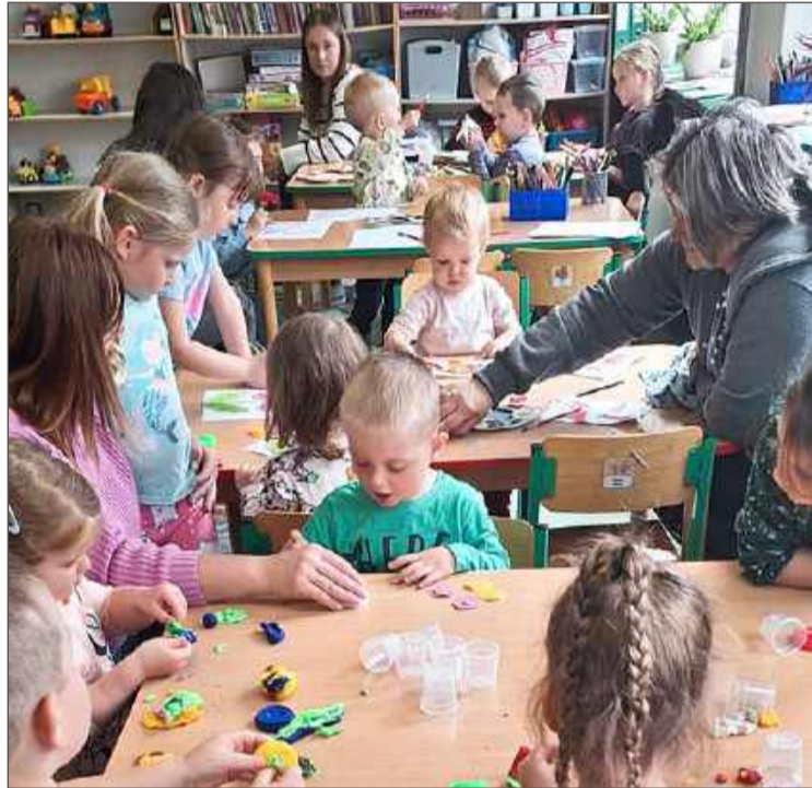
Przedszkolaki wkrótce przeniosą się do nowego budynku.