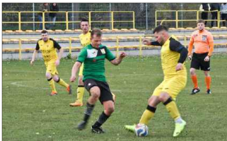
Czarnovia (zielone koszulki) pokonała u siebie Wiewiórkę.