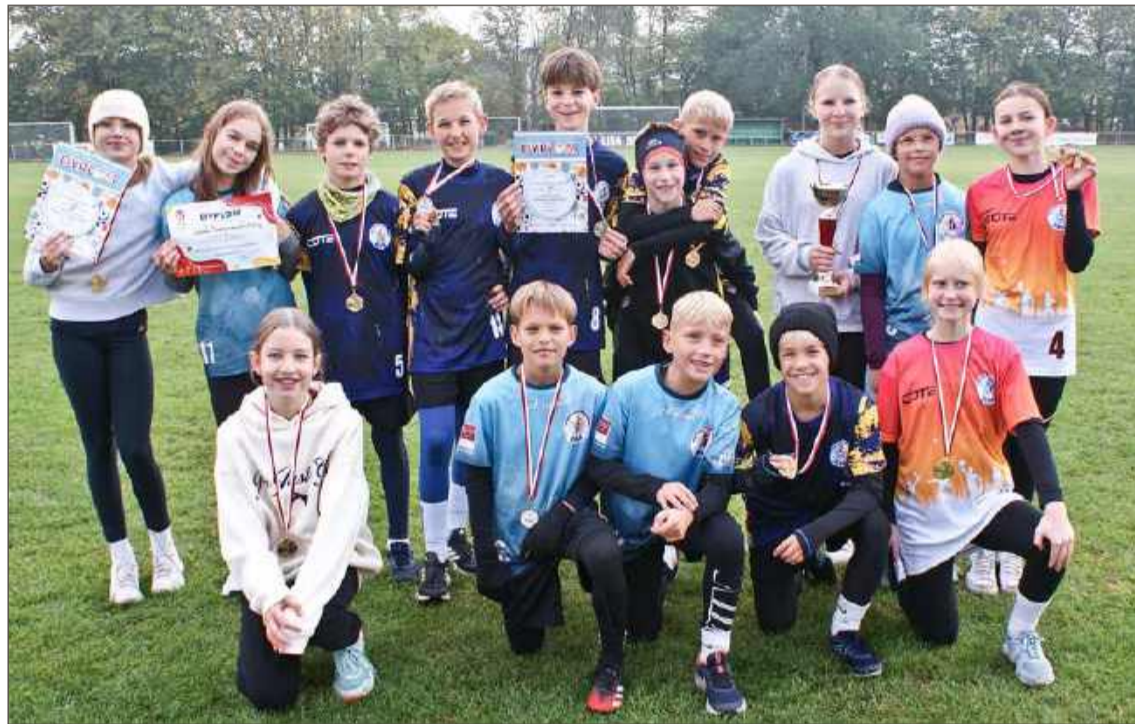
W Igrzyskach Dzieci tak jak przed trzema laty najlepsze były sztafety Piątki.