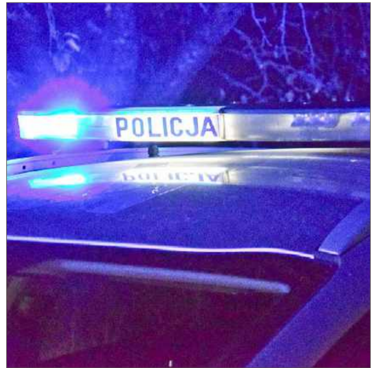
Włamywacze przyszli nocą.