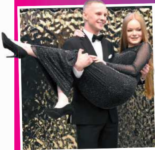
Swoją bal studniówkowy uczniowie „Ekonomika” świętowali w radzińskiej sali „Restoria”