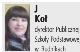
J. Koł dyrektor Publicznej Szkoły Podstawowej w Rudnikach