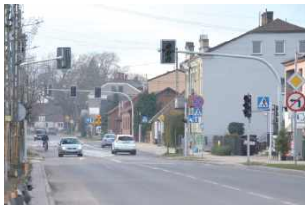
System świateł powstał na skrzyżowaniu ulic Lubelskiej, Partyzantów i Narutowicza

Długo wyczekiwana zmiana w organizacji ruchu staje się faktem. 12 lutego, około godz. 10, na dwóch kluczowych skrzyżowaniach w mieście zostały uruchomione nowe sygnalizatory.