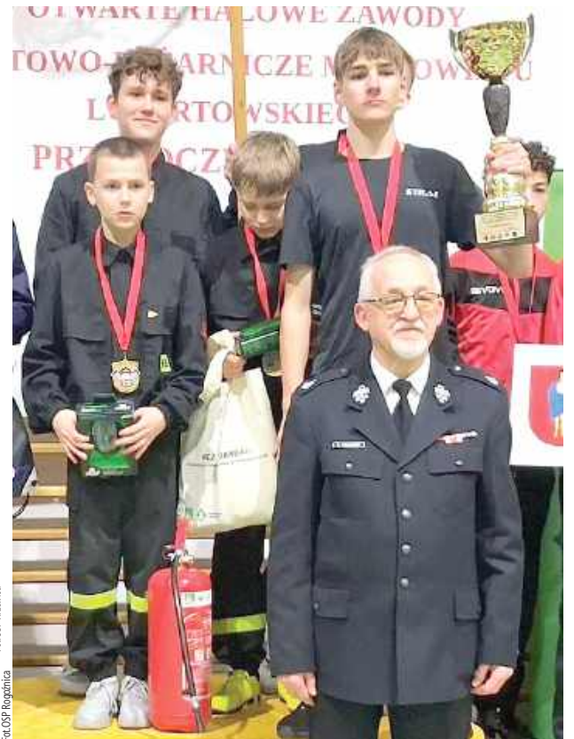
Wśród chłopców triumfowali młodzi druhowie z Rogoźnicy

Na podium w kategorii dziewcząt stanęła również MDP Żabce, zdobywając III miejsce w klasyfikacji OPEN. To duże osiągnięcie, szczególnie w tak