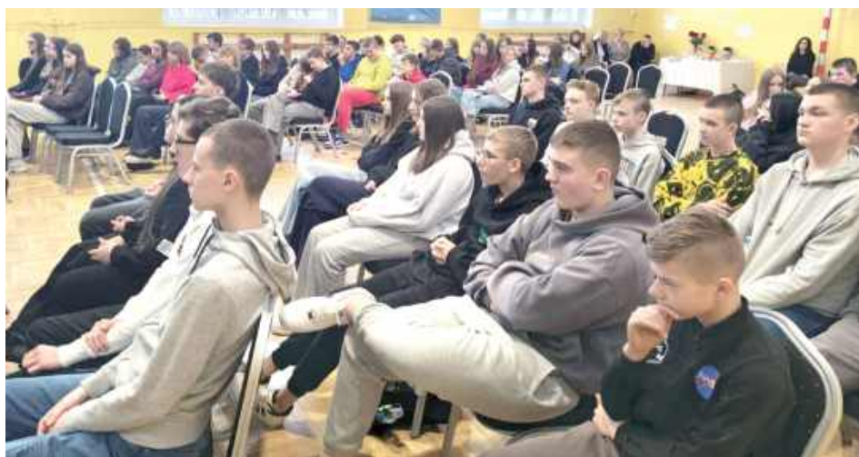
W spotkaniu brali udział uczniowie z gminy Międzyrzec Podlaski

Stres związany z egzaminem ósmoklasisty jest nieodłącznym elementem kończenia szkoły podstawowej. Jednak uczniowie z gminy Międzyrzec Podlaski udowadniają, że najlepszym sposobem na nerwy jest wiedza i współpraca.