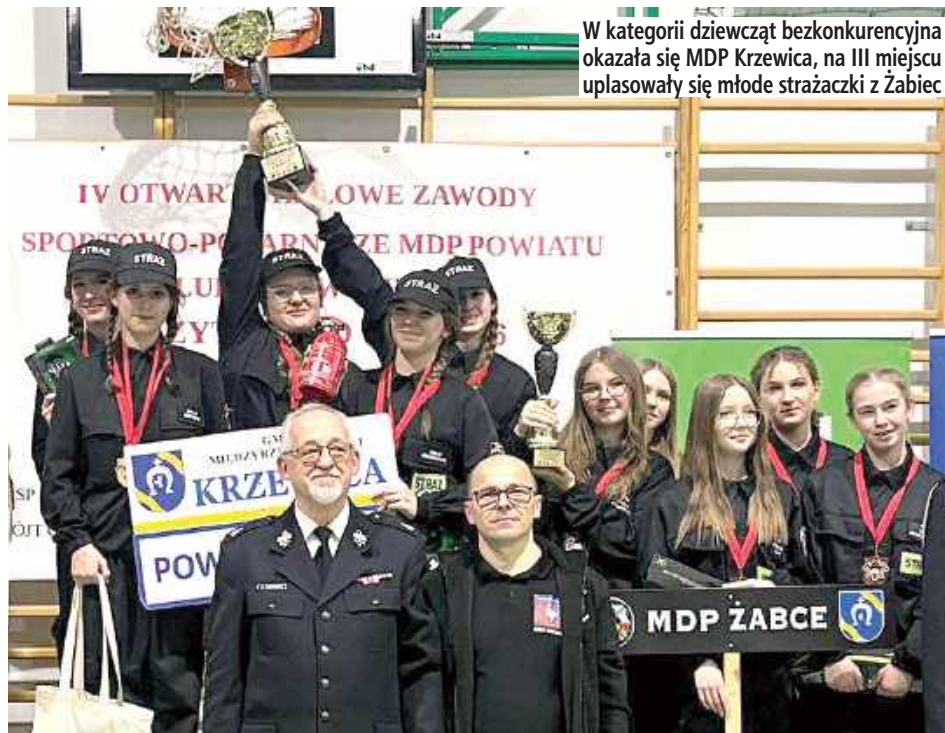
W kategorii dziewcząt bezkonkurencyjna okazała się MDP Krzewica, na III miejscu uplasowały się młode strażaczki z Żabiec

W kategorii dziewcząt bezkonkurencyjna okazała się MDP Krzewica, która wywalczyła