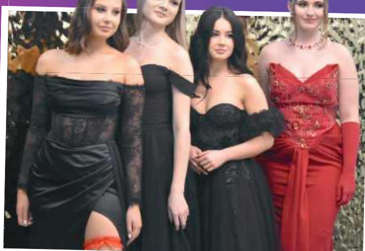
To była noc pełna elegancji, wzruszeń i doskonałej zabawy

Maturzyści z Zespołu Szkół Ekonomicznych w Międzyrzeczu Podlaskim udowodnili, że piątek trzynastego może być najszczęśliwszym dniem w roku!