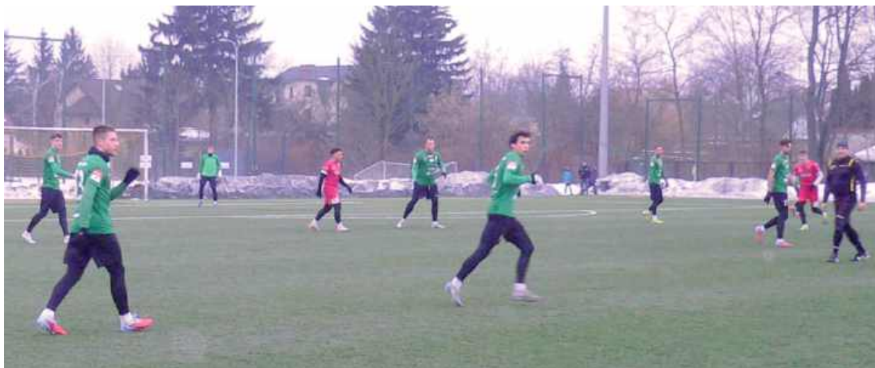
Zespół Podlasia zaliczył bezbramkowy remis z liderem IV ligi