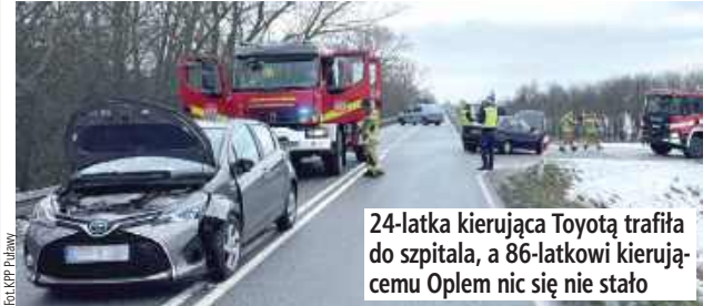
24-latka kierująca Toyotą trafiła do szpitala, a 86-latkowi kierującemu Oplem nic się nie stało

Nieustąpienie pierwszeństwa przejazdu było przyczyną kolizji, do jakiej doszło dziś rano na drodze wojewódzkiej 801 między Puławami a Dęblinem. Do szpitala trafiła młoda kobieta.