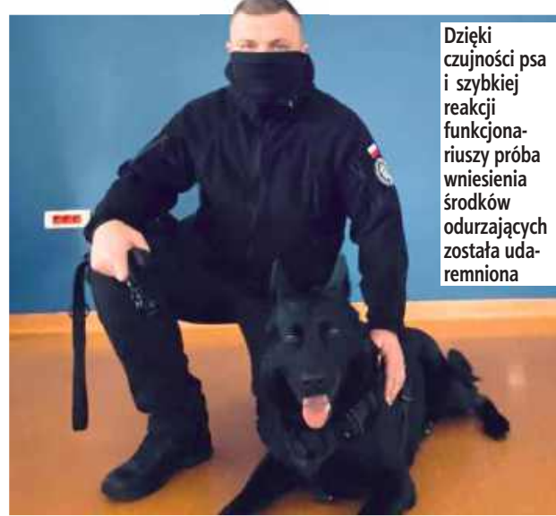
Dzięki czujności psa i szybkiej reakcji funkcjonariuszy próba wniesienia środków odurzających została udaremniowana

Po sygnale od zwierzęcia funkcjonariusze przeprowadzili