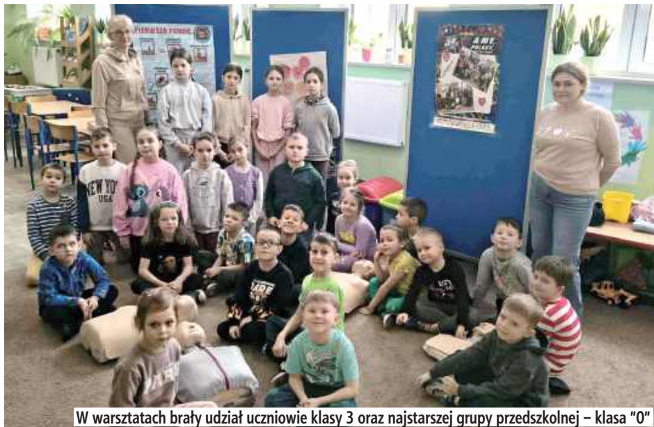
W warsztatach brały udział uczniowie klasy 3 oraz najstarszej grupy przedszkolnej – klasa „0”

Starsze dzieci zaprezentowały młodszym kolegom i koleżankom wiedzę oraz umie-