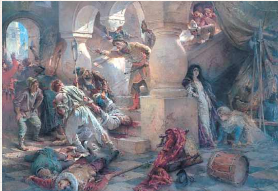
Śmierć Łędymitra. Obraz Konstantina Makovskiego

bystrzejszy z nich, Jerzy Mniszech zdiagnozował sytuację, było już za późno. Opozycja nie próżnowała. Na jej czele stał Wasyl Szujski, jeden z najsprawniejszych polityków kraju. Początkowo wspierał Samozwańca, potem popadł z nim w konflikt i został skazany na karę śmierci. Wyrok zamieniono na wygnanie, a nawet po chwili i to odwołano. Szujski wrócił do Moskwy i natychmiast stworzył, umiejętnie grając na kilku - politycznej, społecznej, religijnej - bałajkach spisek. 27 maja nad ranem bunt eksplodował. Dobrze przygotowane grupy wdarły się do carskich komnat. Na temat okoliczności zabójstwa Dymitra mamy kilka relacji, nie ulega wątpliwości, że od początku jego los był przesadzony. Marynie udaje się wymknąć: niewysoka, bez szat, biżuterii, makijażu, wyzbyta carskiego majestatu, wymknęła się nierozpoznana między damami dworu, ponoć ukrywając się pod suknią najtejszej z nich. Potem zaboboni