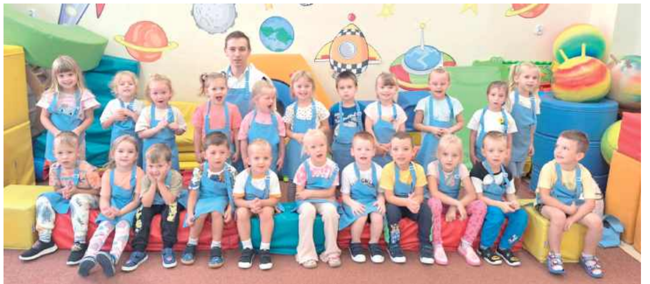
Maluchy w fartuszkach przygotowywały słodkie smakołyki