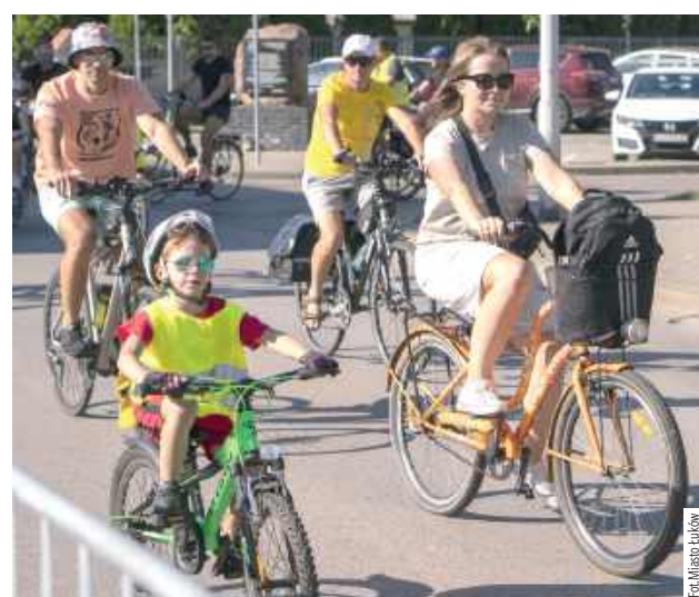
Najmłodszy uczestnicy dzielnie sobie radzili na 16 km trasie