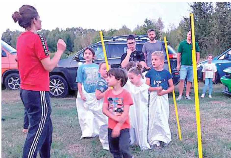
Organizatorzy przygotowali konkurencje, w których można było zdobyć nagrody

Spotkanie było okazją nie tylko do integracji mieszkań-