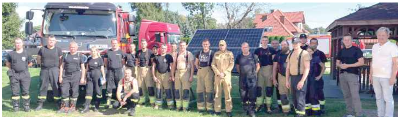
Strażacy uczyli się jak prawidłowo postępować podczas zdarzeń z instalacjami fotowoltaicznymi