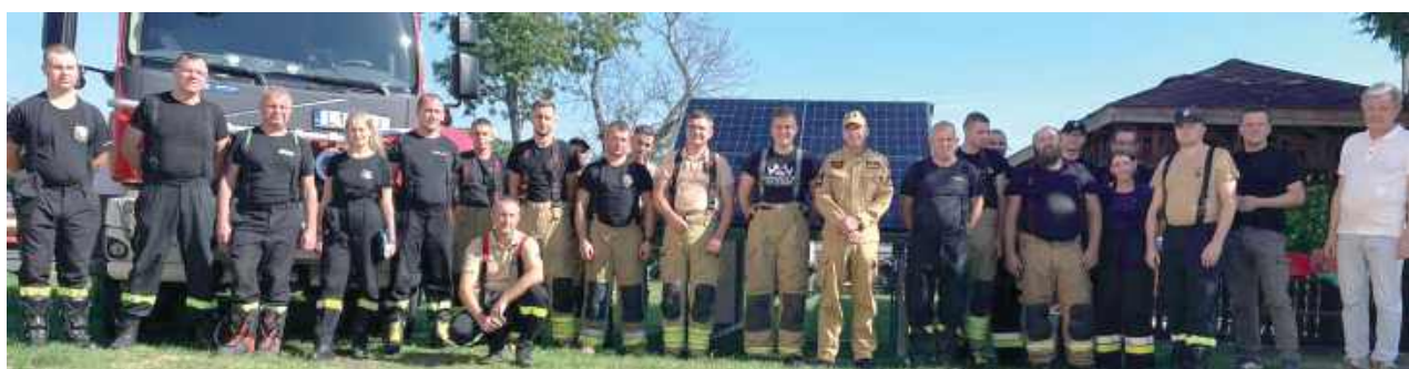
Omówione zostały zagrożenia związane z instalacją fotowoltaiczną, a do praktycznych ćwiczeń służył trener instalacji pv