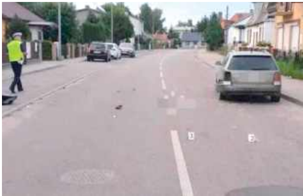
Dramat rozegrał się w czerwcu 2024 roku

Młody mężczyzna odpowiadał m.in. za udostępnienie motocykla pijanemu kierowcy, który zginął. Sąd umorzył sprawę w tym zakresie, uznając, że nie można przypisać oskarżonemu spowodowania wypadku ze skutkiem śmiertelnym.