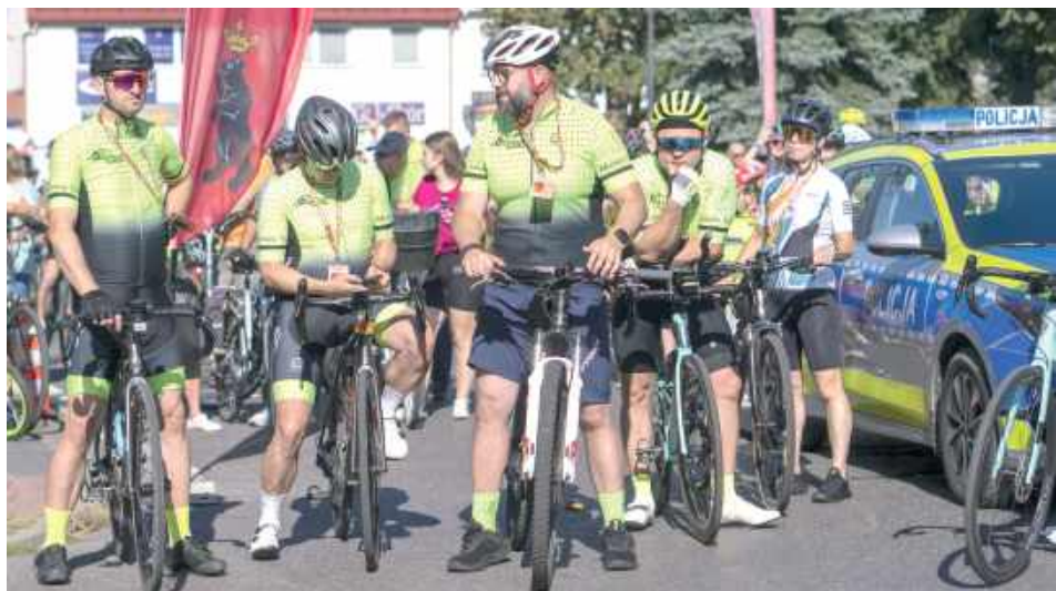
Peleton był prowadzony przez policjantów z Komendy Powiatowej Policji w Łukowie i członków stowarzyszenia Rowerowy Łuków