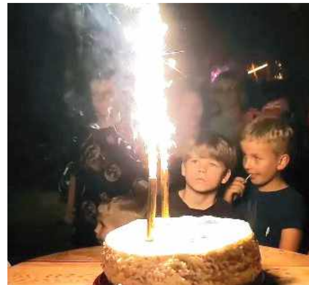
Spotkanie było okazją do uczczenia pierwszych urodzin Miodowego Zakątka

fajne warsztaty na Dzień Kobiet. Liczymy że kolejny rok będzie równie udany” - podsu-