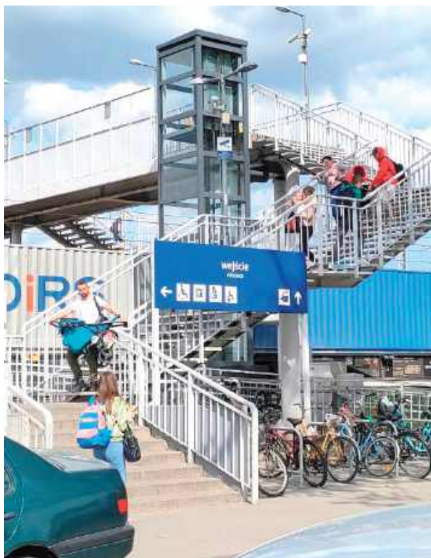
- Dostępność dworca to nie luksus, to konieczność dla seniorów, osób z niepełnosprawnościami i rodzin z dziećmi - podkreślają radni Razem Ponad Podziałami

- Dlatego jako Klub Radnych Razem Ponad Podziałami, złożyliśmy interpelację o modernizację kładki i wymianę podnośników na windy osobowe. Bo dostępność dworca to nie luksus, to konieczność dla seniorów, osób z niepełnosprawnościami i rodzin z dziećmi. Przypominamy: teren dworca i kładki jest własnością PKP, nie miasta. Naszą rolą jest nagłaśnianie problemu oraz kierowanie oficjalnych wystąpień i właśnie to robimy - podkreślają.