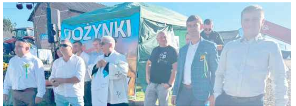
Dożynki bez błogosławieństwa to nie są prawdziwe dożynki

polskiej wsi to puste frazesy, tak naprawdę to festiwal elit i pogardy dla ludzi pracy. Naszym zamysłem było zorganizowanie święta rolników - prawdziwych rolników, gdzie będziemy mogli pochwalić się efektami naszej ciężkiej pracy i uhonorować tych z nas, którzy na to zasłużyli - podkreślają organizatorzy.