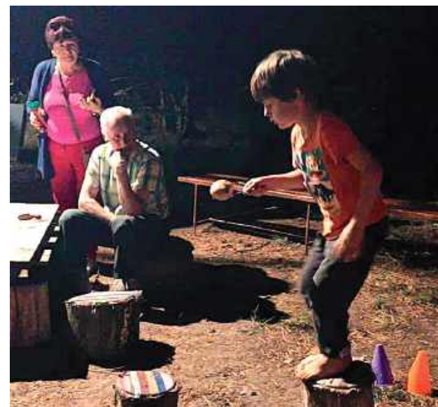
Starsi i młodszy wspólnie bawili się przy ognisku