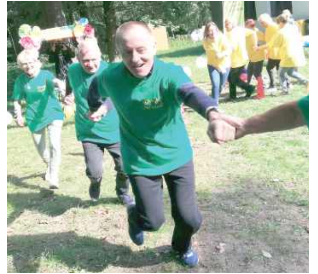
Konkurencje sportowe dostarczyły mnóstwo śmiechu