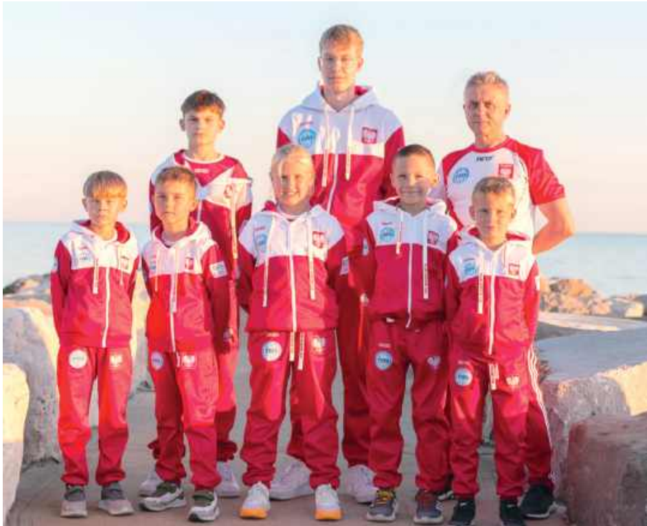
W mistrzostwach Europy uczestniczyło siedmioro reprezentantów KSW Łuków rywalizujących w kategoriach juniorów, kadetów oraz dzieci