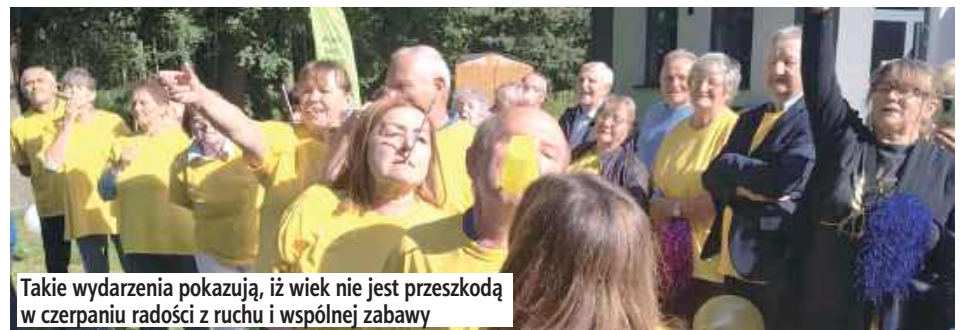
Takie wydarzenia pokazują, iż wiek nie jest przeszkodą w czerpaniu radości z ruchu i wspólnej zabawy