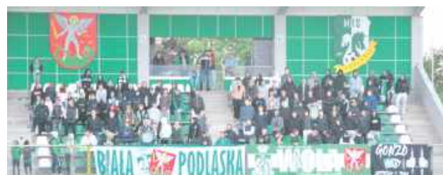
Piłkarze Podlasia mają na koncie cztery porażki. Wszystkie ponieśli przed własną publicznością