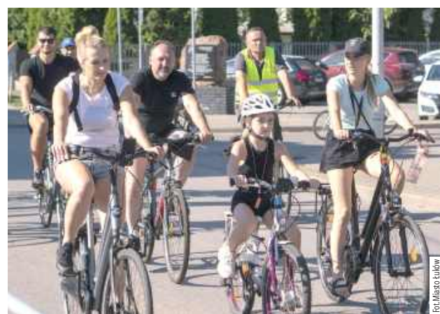
Bezpieczny Peleton to wydarzenie, które co roku gromadzi całe rodziny i promuje aktywny styl życia