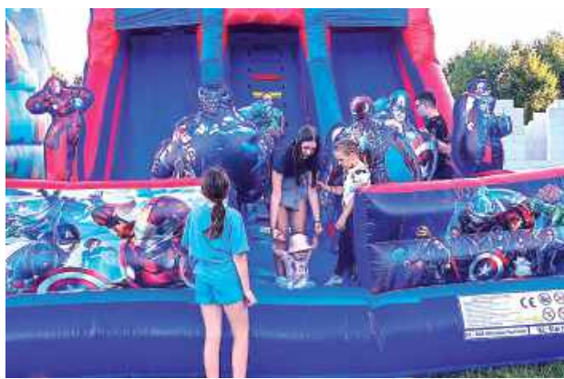
Nie zabrakło dmuchańców z firmy El-Mir

„Troszkę się przez ten rok wydarzyło, zrobiliśmy imprezy dla dzieci, dla dorosłych również, ogniska integracyjne dla mieszkańców Ławek, wzięliśmy udział w pierwszych jarmarkach, robiliśmy kiermasze ciast, sprzątaaliśmy naszą wieś, było również topienie Marzanny. Wzięliśmy udział w kongresie kół, pojechaliśmy na pierwsze wspólne wycieczki, zrobiliśmy