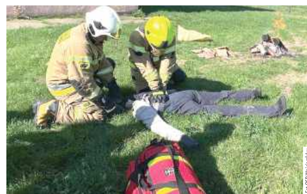
Była to też okazja do ćwiczeń z pierwszej pomocy

GMINA WOJCIESZKÓW W Wojcieszkwie odbyły się warsztaty poświęcone działaniom podczas zdarzeń z instalacjami fotowoltaicznymi. Szkolenie teoretyczne i praktyczne poprowadzili funkcjonariusze Państwowej Straży Pożarnej, a udział wzięły jednostki OSP z Wojcieszkowa, Burca, Świderek, Wólki Domaszewskiej i Adamowa.