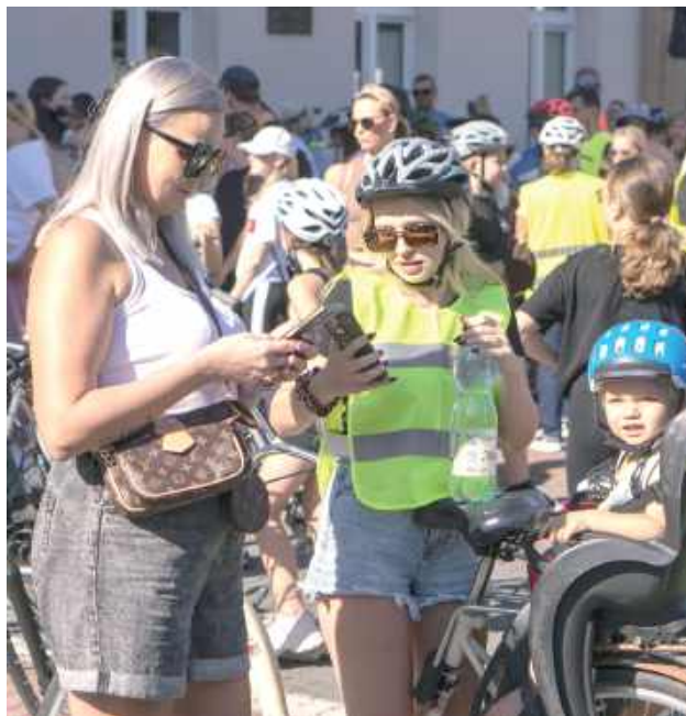
Najmłodszy ruszyli w trasę w rowerowych fotelikach

Partnerami wydarzenia byli: Stowarzyszenie Rowerowy Łuków, Komenda Powiatowa Policji w Łukowie, Nadleśnictwo Łuków, Centrum Usług Społecznych, Ośrodek Sportu i Rekreacji, Łu-