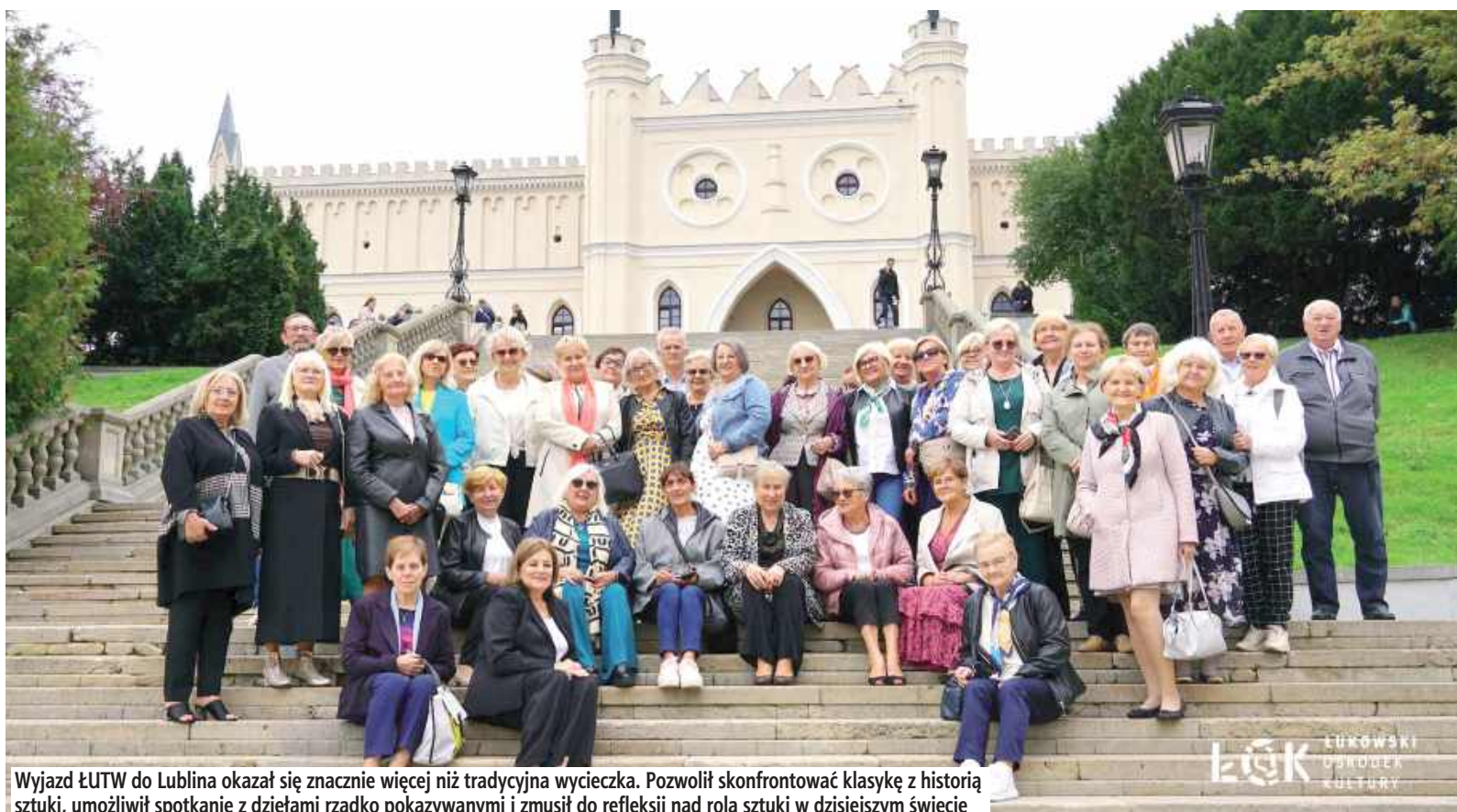
Wyjazd ŁUTW do Lublina okazał się znacznie więcej niż tradycyjna wycieczka. Pozwolił skonfrontować klasykę z historią sztuki, umożliwił spotkanie z dziełami rzadko pokazywanymi i zmusił do refleksji nad rolą sztuki w dzisiejszym świecie