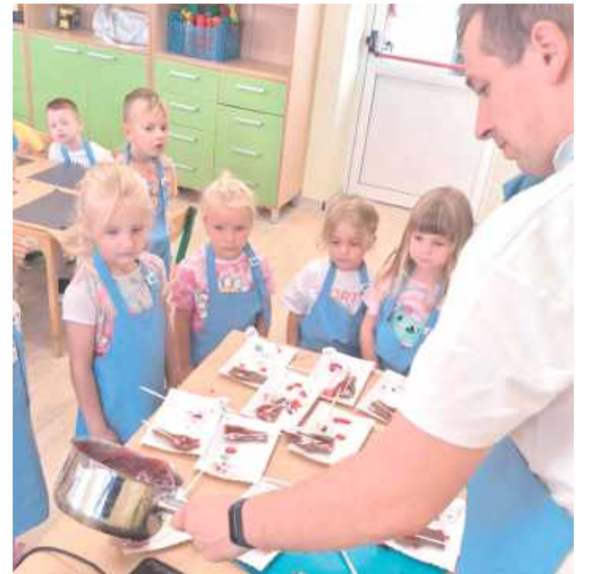
Bazą lizaków był zdrowy od cukru izomalt