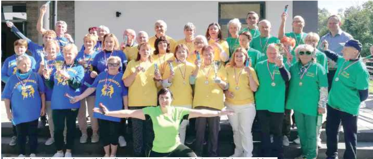
Najlepsi okazali się gospodarze – Klub z Klimek „Teraz pora na seniora”, którzy zajęli pierwsze miejsce. Drugie miejsce zdobył Klub z Gołębek „To jest nasz czas”, a trzecie – Klub z Ryżek „Druga młodość”