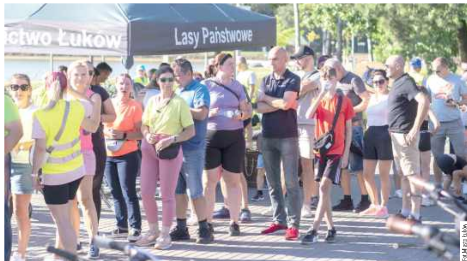
Po raz pierwszy do Bezpiecznego Peletonu włączyło się Nadleśnictwo Łuków, które przygotowało stoisko, gdzie można było własnoręcznie wykonać pamiątkowy drewniany medal

Łukowianie wzięli udział w czternastej edycji Bezpiecznego Peletonu. Rajd ulicami Łukowa odbył się w sobotę, 20 września.