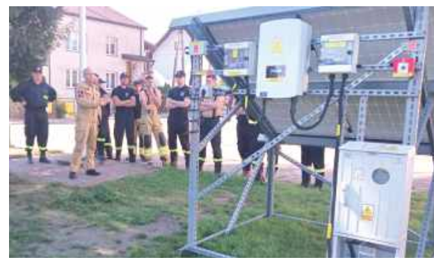
Do ćwiczeń wykorzystano specjalny trener instalacji fotowoltaiki