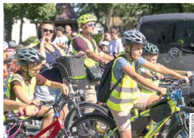
Tegoroczna rekordowa frekwencja pokazuje, że mieszkańcy chętnie wybierają rower jako sposób spędzania wolnego czasu