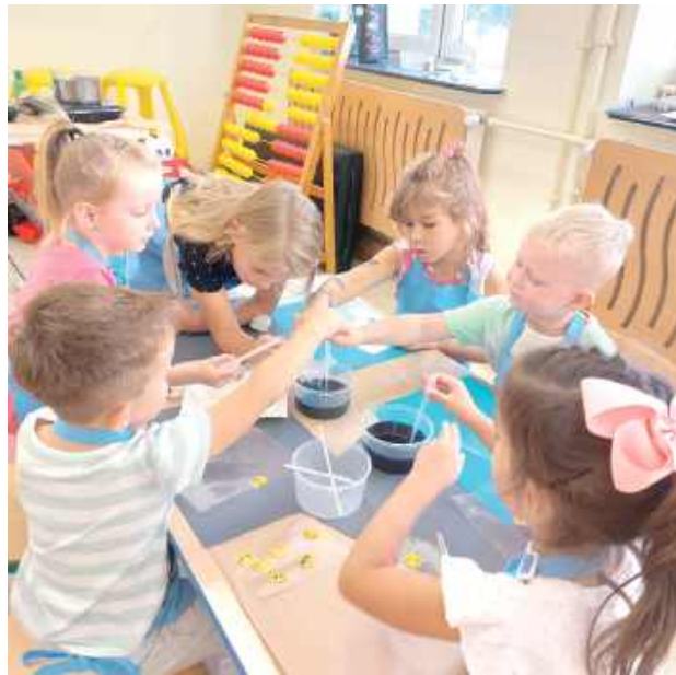
Każde dziecko wybrało smak, kolor lizaka i ozdobiło go liofilizowanymi owocami