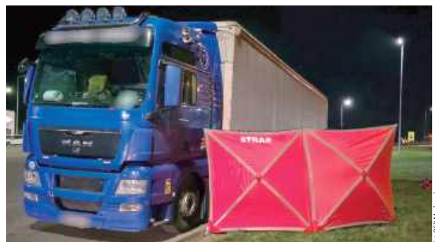
Na terenie MOP Markuszów mężczyzna został przygnieciony przez samochód ciężarowy podczas wymiany koła

Dramat rozegrał się w sobotę, 27 września około godziny 19. Strażacy zostali zadysponowani na trasę S17. Na terenie MOP Mar-