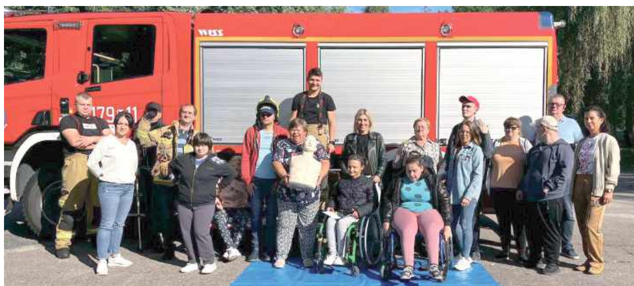
Cenna współpraca owocuje - uczestnicy zajęć, dzięki wsparciu strażaków, poznali podstawowe zasady np. ewakuacji

W Środowiskowym Domu Samopomocy w Anielinie 18 września strażacy z jednostki OSP KSRG Krzywda przeprowadzili próbę ewakuacji zakończoną praktycznymi zajęciami z zakresu pierwszej pomocy.