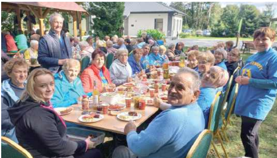
Po konkurencjach sportowych był czas na wspólny posiłek i regenerację sił