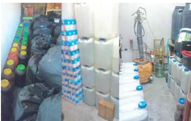
Policjanci łącznie zabezpieczyli niemal 1400 litrów gotowego alkoholu i ponad 800 litrów „zacieru”

Aparaturę do produkcji alkoholu oraz łącznie niemal 1400 litrów gotowego trunku, a także ponad 800 litrów „zacieru” zabezpieczyli radzyńscy kryminalni na terenie gospodarstwa w gminie Czemierniki. Policjanci zatrzymali na miejscu 42-latkę.