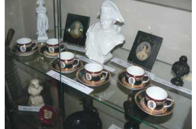
Serwis kawowy z podobizną Napoleona

NASIELSK. Wystawa o Napoleonie w 220. rocznicę pobytu cesarza w mieście.