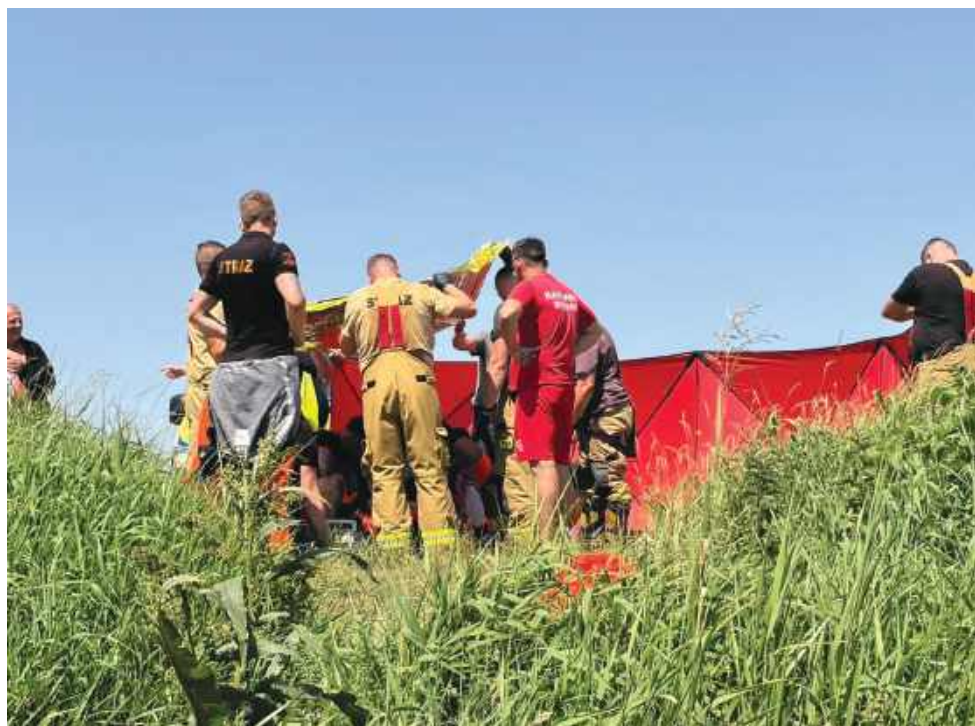
Zdjęcie - WOPR z Pułtusk