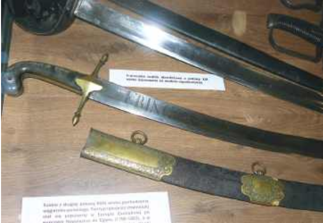
Na obrazie Jerzego Kossaka - Napoleon na Mazowszu