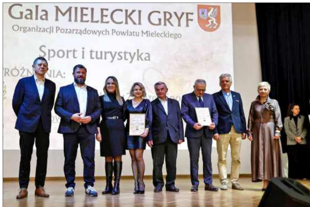
Gala była okazją do podziękowania tym, którzy działają z potrzeby serca.