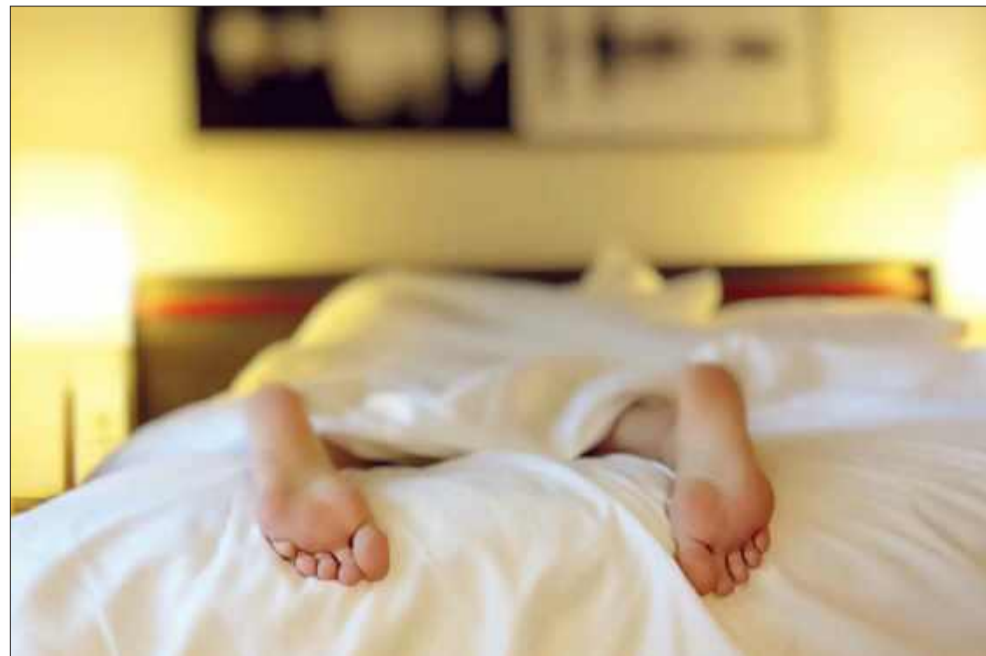
Takiego spanka życzymy.

Odpowiednie nawodnienie organizmu ma znaczenie także dla jakości snu. Woda pomaga utrzymać prawidłowe funkcjonowanie wszystkich procesów w ciele,