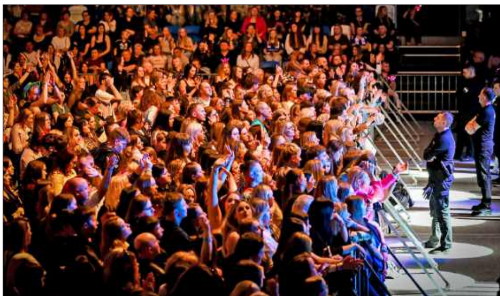
Tłumy przyszły na Dance Hit