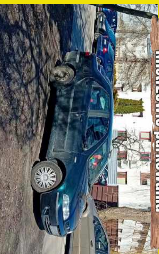
Bliski kontakt z naturą.