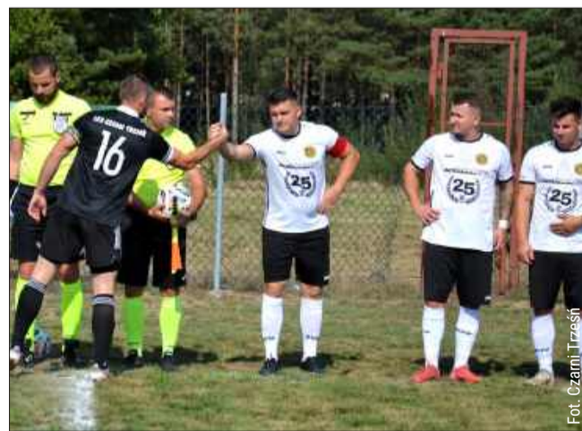
Piłkarze z Dąbrówki Wisłockiej rozegrali pierwsze sparingi.

Hetman Dąbrówka Wisłocka - Rzędzian Rzędzianowice 11:2 lg