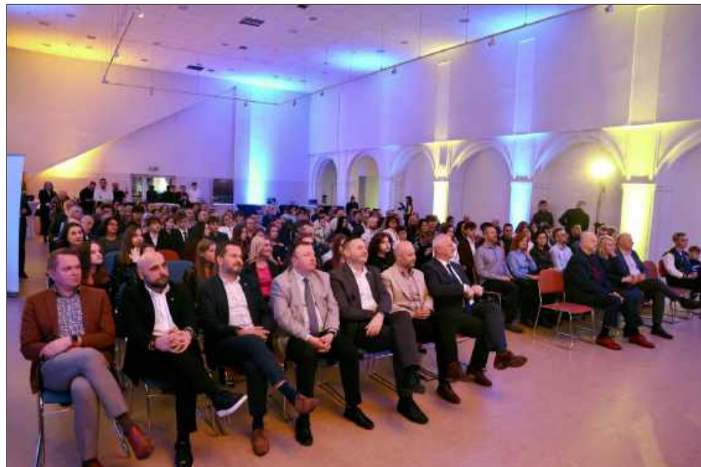
Wielkie święto mieleckiego sportu. Ponad sto nagród dla zawodników i szkoleniowców.