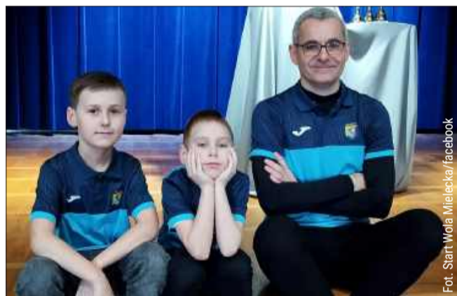
Szachiści z Woli Mieleckiej zaprezentowali się w Cmolasie.