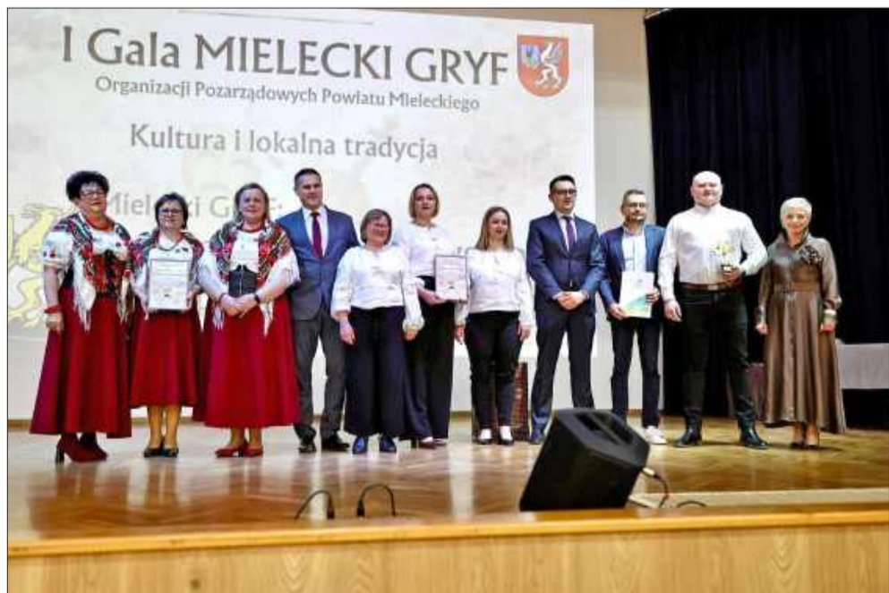
Znasz ich z codziennych działań, teraz odebrali nagrody.