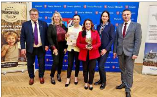
U honorowano tych, którzy na co dzień pomagają bez rozgłosu.

Za nami pierwsza, historyczna Gala „Mielecki Gryf”. Był to wyjątkowy wieczór, który zgromadził na jednej sali przedstawicieli wielu organizacji społecznych działających na terenie powiatu mieleckiego. To ludzie, którzy na co dzień wykonują ogrom pracy - często po cichu, bez rozgłosu i zupełnie bezinteresownie - pomagając innym i dbając o rozwój naszej lokalnej społeczności.