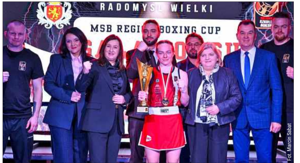
W Radomyślu Wielkim odbyła się gala bokserska.

Pierwszego marca w Radomyślu Wielkim odbył się pierwszy turniej z cyklu „MSB Region Boxing Cup” w ramach Narodowego Dnia Żołnierzy Wyklętych.