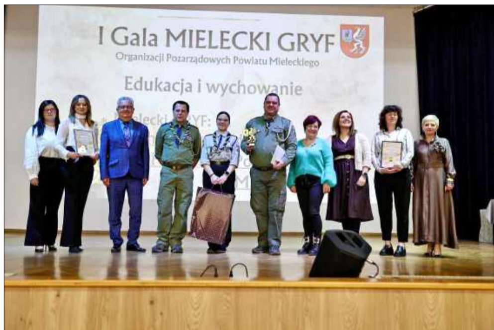
To oni tworzą „armię dobrych serc” w powiecie mieleckim.