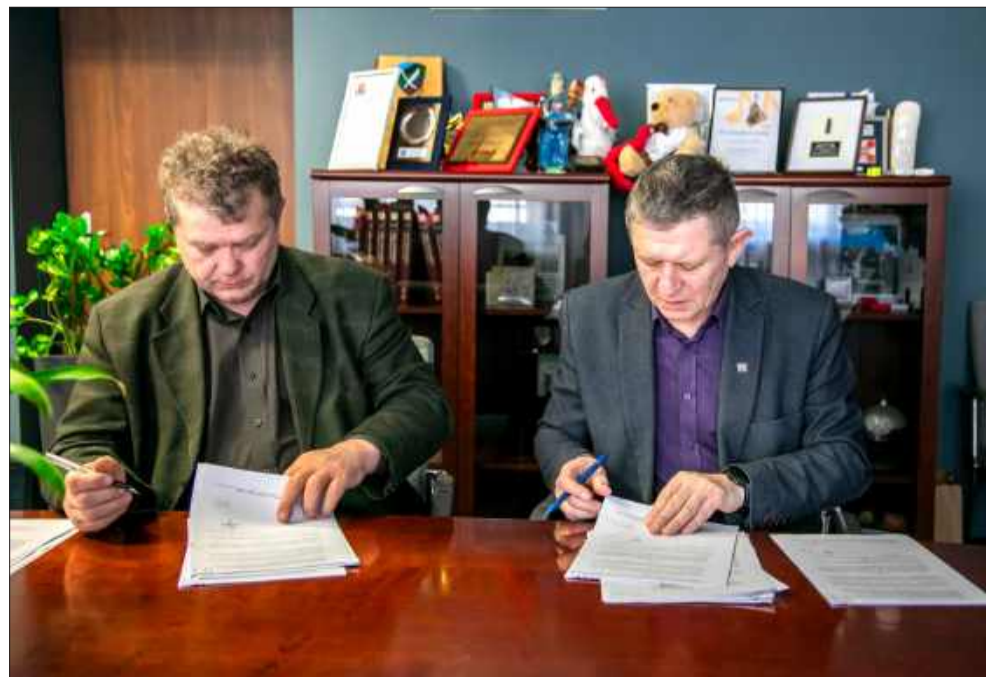
Starosta Kazimierz Gacek i wicestarosta Andrzej Bryła

Władze powiatu podkreślają, że współpraca z organizacjami pozarządowymi ma duże znaczenie dla rozwoju lokalnej społeczności. Dzięki ich inicjatywom mieszkańcy mogą korzystać z licznych projektów edukacyjnych, sportowych i społecznych. gj