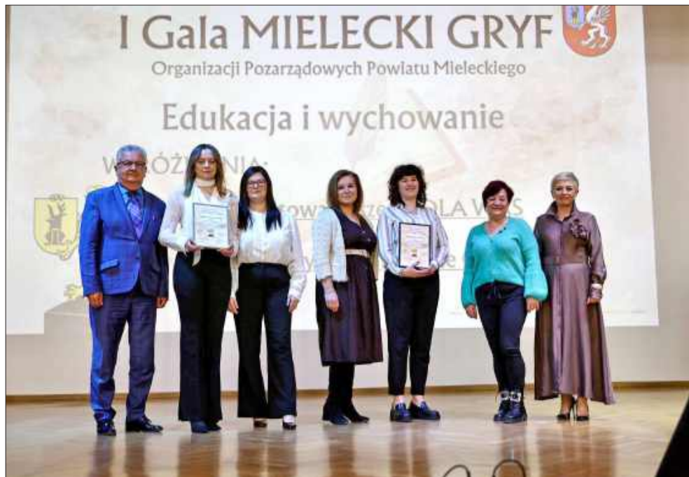
Laureaci pierwszej edycji Mieleckiego Gryfa.

Do pierwszej edycji gali zgłoszono aż 17 inicjatyw i organizacji. Każda z nich to inna historia, inne działania i inny sposób pomagania, ale wszystkie łączy jeden wspólny cel - troska o drugiego człowieka oraz o nasze wspólne miejsce na ziemi. Wiele z tych działań odbywa się na co dzień po cichu, bez rozgłosu i często całkowicie bezinteresownie. Tym bardziej ważne było, aby tego wieczoru docenić ich pracę i zaangażowanie.