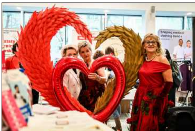
Wspólne zdjęcia - obowiązkowo!