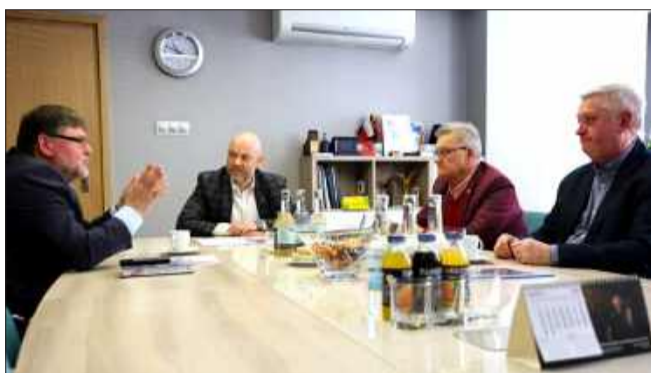
Samorząd i pasjonaci wspólnie o historii mieleckiego lotnictwa.