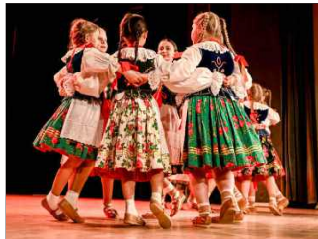
Najmłodszy Rzeszowiacy też się pokazali

Gościnnie podczas koncertu wystąpili również młodzi artyści z Dziecięcy Zespół Tańca „Ziemia Mielecka”, którzy zaprezentowali energetyczne układy taneczne, pokazując, że tradycja ludowa jest przekazywana kolejnym pokoleniom. Na scenie pojawili się także absolwenci chóru ZPiT „Rzeszowiacy”, którzy wzbogacili koncert o wyjątkowe wykonania wokalne.