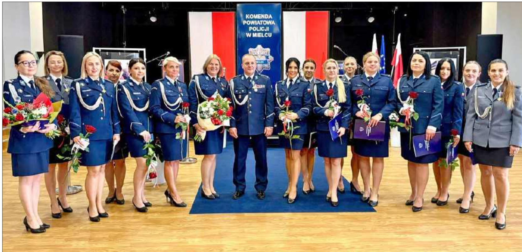
To one dbają o nasze bezpieczeństwo w Mielcu.