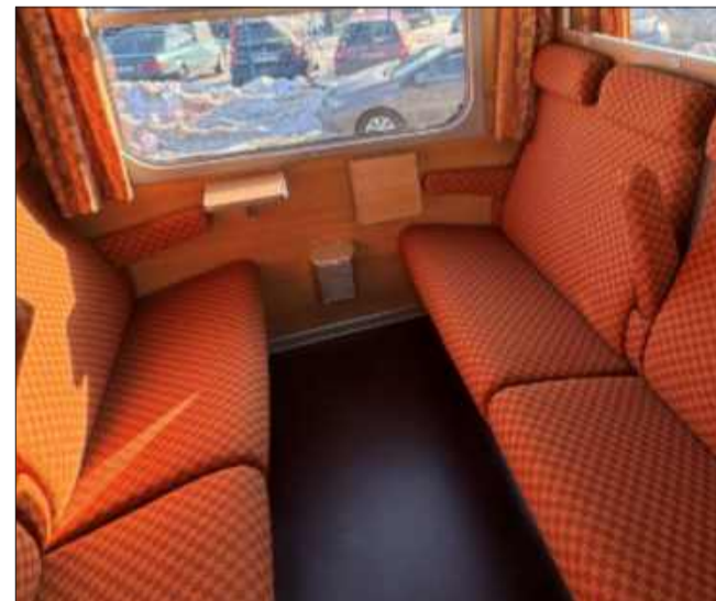
PKP Intercity zaprasza w sentymentalną podróż do lat 80.