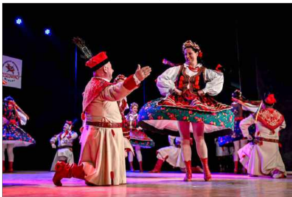
Kwiatowe stroje były obowiązkiem na ten dzień