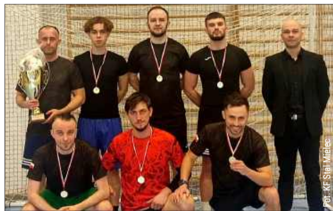
Drużyna ze Smoczki okazała się najlepsza w tej edycji Mieleckiej Ligi Futsal.