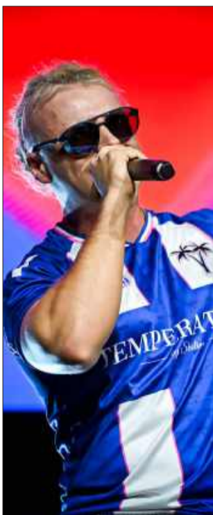
Skolim gwiazdą wieczoru

Specjalnie przygotowana oprawa świetlna, dynamiczna scenografia oraz atmosfera wspólnego świętowania sprawiły, że koncert był prawdziwym muzycznym widowiskiem. JB