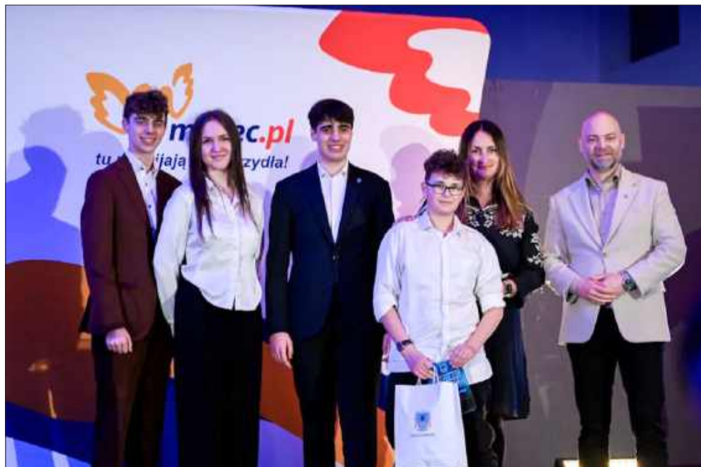
Prezydent Mielca rozdaje nagrody sportowe. Na liście wielkie nazwiska i przyszłe gwiazdy.