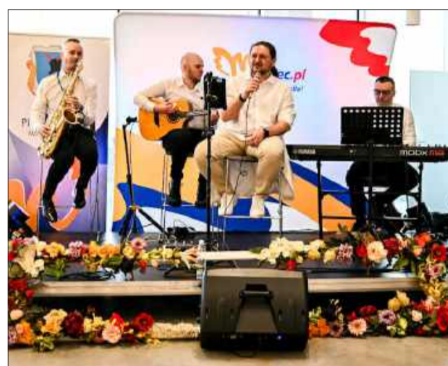
Była również muzyka na żywo