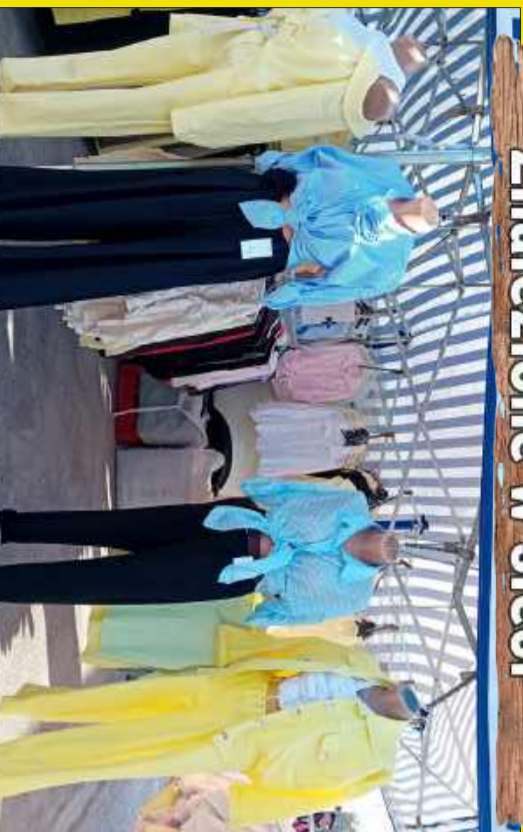
Na mieleckim bazarze widać już wiosnę.