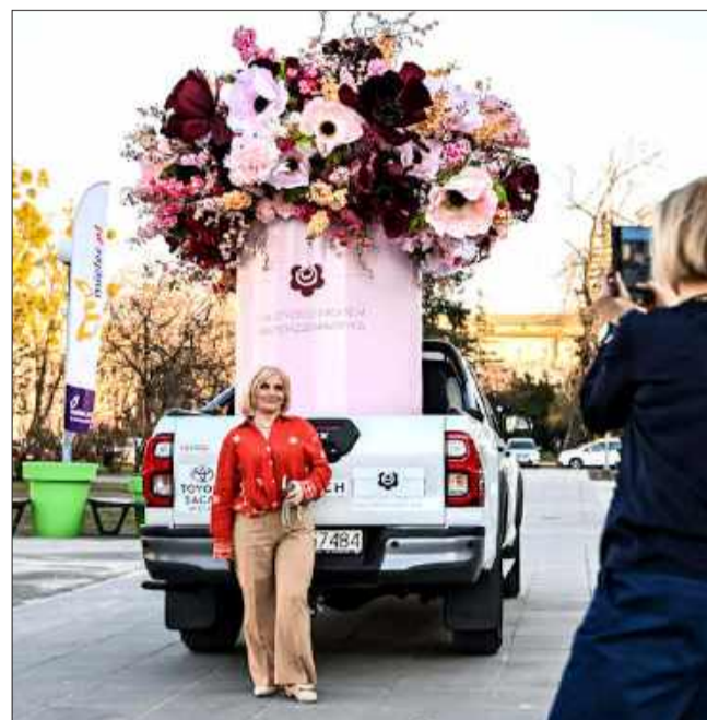
Wielki bukiet hitem na Strefie Kobiet