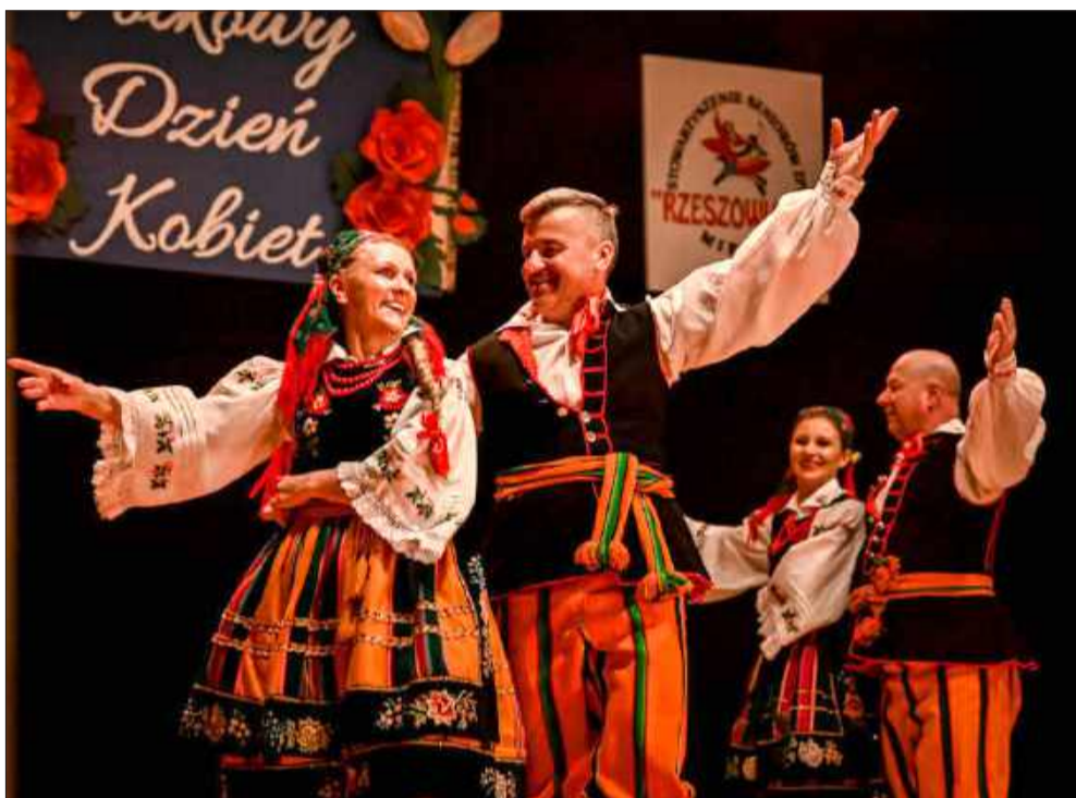
Publiczność mogła podziwiać barwne stroje ludowe.