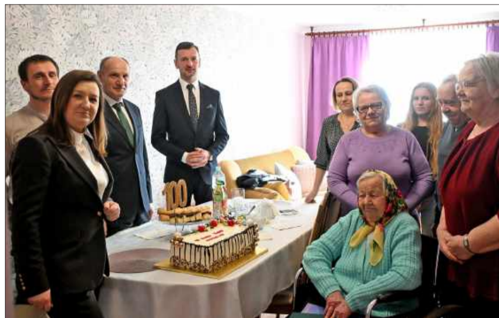
W gronie najbliższych.