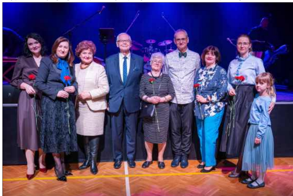
Piosenki i humor na Dzień Kobiet. Tak świętowano w Radomyślu Wielkim.

Wydarzenie było otwarte dla wszystkich mieszkańców, a wstęp na koncert był bezpłatny. Organizacja spotkania sprawiła, że panie mogły wyjść z sali z poczuciem bycia docenionymi, niosąc ze sobą dawkę dobrego humoru. MW