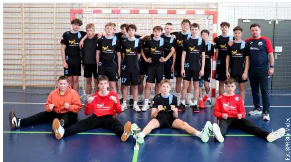
Mielczanie walczyli dzielnie, ale nie dostali się do kolejnej fazy Mistrzostw.

KSS Iskra Kielce – SPR Grunwald Ruda Śląska 24:36 (13:17)