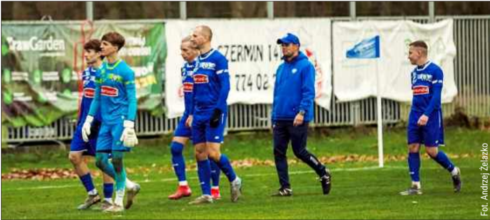
Piłkarze z Czermina przygotowują się do rundy rewanżowej

Sześć meczów kontrolnych przed nadchodzącą kampanią w rundzie rewanżowej w dębickiej okręgówce rozegrali już piłkarze z Czermina.