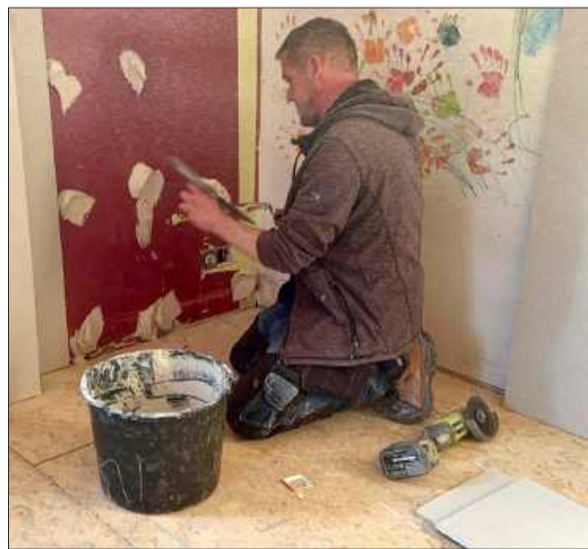
Fachowcy mieli pełne ręce roboty.