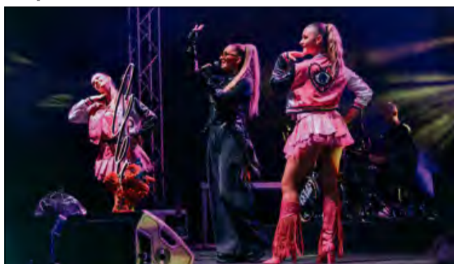
Wszyscy czekali na koncert Cleo.