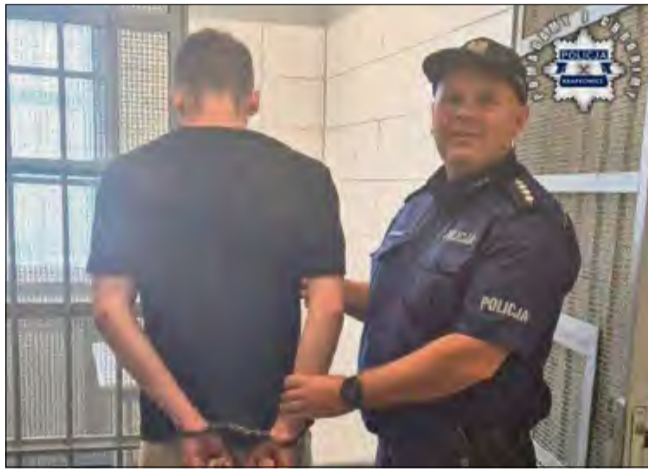
22-latek został zatrzymany i osadzony w policyjnym areszcie.