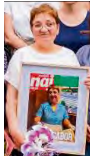
Dziękowali za 20 lat zaangażowania i życzyli samych słonecznych chwil w nowym rozdziale życia.