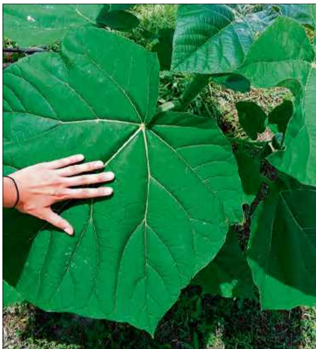
Drzewa tlenowe chociaż obiecujące mogą stanowić zagrożenie dla rodzimej fauny i flory

Odmian Roślin (CPVO) oraz certyfikaty jakości i licencję handlową.