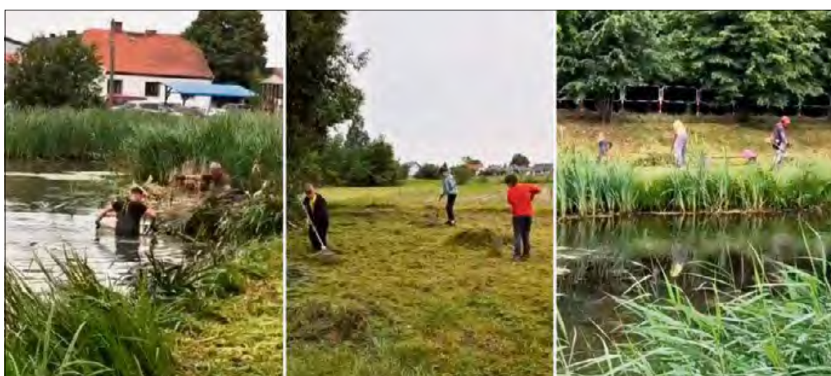
Akcja pokazała, jak wiele można osiągnąć dzięki współpracy i lokalnemu zaangażowaniu.

Dzięki zaangażowaniu uczestników udało się znacząco poprawić stan otoczenia zbiornika wodnego. Worki wypełnione śmieciami, porządkowanie brzegów i wyciąganie odpadów z wody – to tylko część działań podjętych podczas ekologicznej inicjatywy.