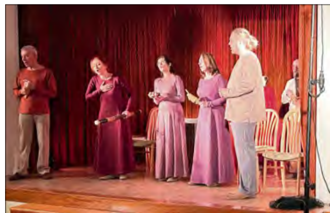
Ponad setka gości obejrzała religijny spektakl.

Po części artystycznej odbyła się część kulinarna.