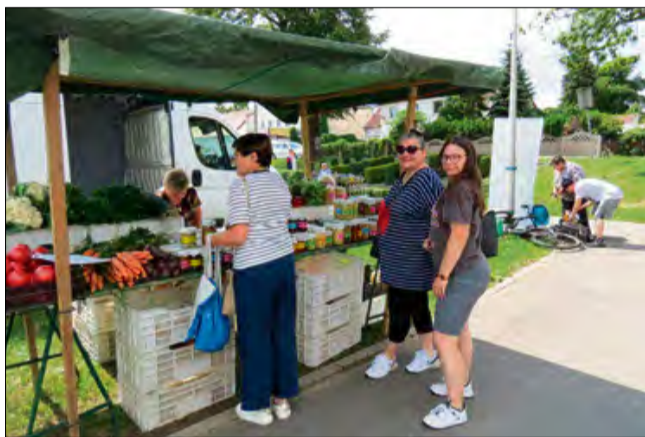
Regionalny bazar przyciąga nie tylko mieszkańców Krapkowic, ale także okolicznych miejscowości.

Podczas wizyty na porozmawiać z wieloma bazaru udało nam się osobami, które chętnie