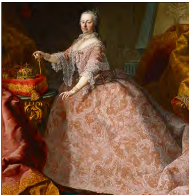
Królowa Maria Teresa była ostatnim władcą Czech panującym nad terenami dzisiejszego powiatu krapkowickiego. Tutaj przedstawiona została w wieku 35 lat. Autorem obrazu jest Martin van Meytens.

Ostatecznie w 1742 roku Śląsk, w tym cały teren dzisiejszego powiatu krapkowickiego, wszedł w granice Królestwa Prus. Tutaj jednak mamy ostateczny dowód, że nie przeszedł on z rąk austriackich, a został wyłączony z granic królestwa Czech. Wystarczy po prostu rzucić okiem na tekst porozumienia pokojowego, zawartego pomiędzy Fryderykiem a Marią Teresą we Wrocławiu.