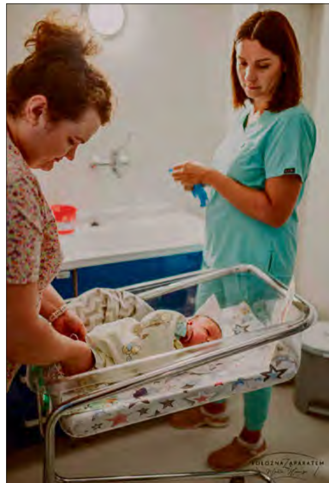
Porody odbywają się w przyjaznej, rodzinnej atmosferze.

Oddział położniczy przeszedł gruntowny remont, dzięki czemu stał się jeszcze bardziej przytulny i komfortowy. Pacjentki mogą liczyć nie tylko na opiekę położnych i lekarzy, ale także na wsparcie fizjoterapeutki, dietetyczki i psychologa,