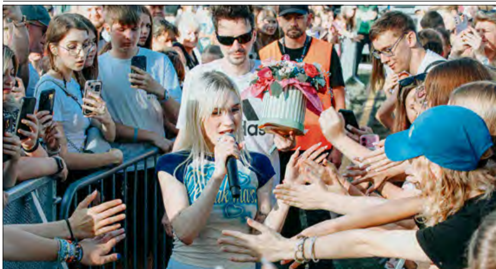
Bryska wystąpiła w sobotę 19 lipca.

W Gogolinie odbyła się trzecia edycja „Lata na MAXXa” organizowanego przez stację radiową RMF. Mieszkańcy miasta, okolicznych wiosek i całego regionu przez dwa dni bawili się na stadionie miejskim w rytm najgorętszych hitów.