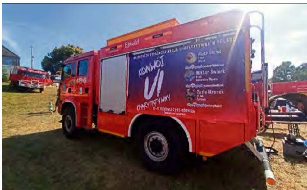
Strażacy liczą, że podczas 6. edycji uda się pobić zeszłoroczny rekord.

Już 15 sierpnia odbędzie się 6. edycja charytatywnego konwoju strażackiego, organizowanego przez OSP Kórnicę. To będzie wyjątkowe wydarzenie, bo w tym roku akcja wesprze aż troje dzieci.