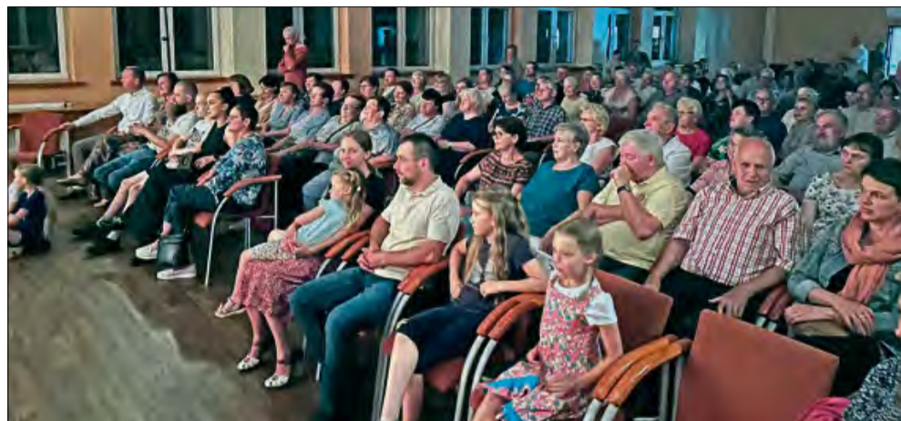
Wydarzenie zostało zorganizowane dzięki środkom pozyskanym z Fundacji Aktywni w Regionie.

W centrum konferencyjnym w Górażdżach wystawiono przedstawienie pod tytułem „Poranek” w wykonaniu aktorów „Teatru A” z Gliwic. Wydarzenie zostało zorganizowane w ramach obchodów odpustu parafialnego ku czci błogostawionego Czesława, a także uświetniło 40-lecie utworzenia parafii.