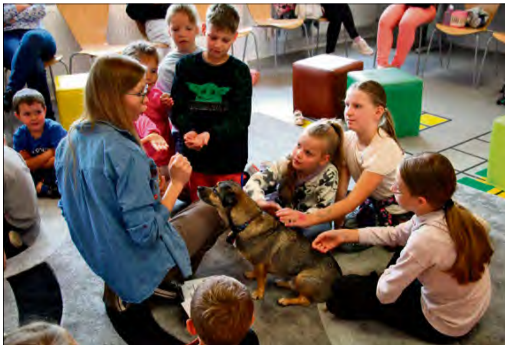
Warsztaty plenerowe z czworonożnym bohaterem serii książek dla dzieci „Przygody Psa Precla” odbyły się 12 lipca.