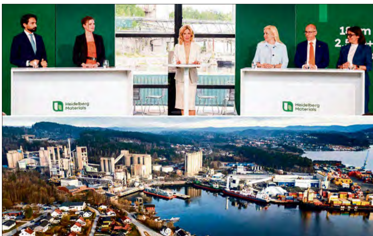
Projekt jest częścią norweskiej inicjatywy Longship – pierwszego tego typu projektu w Europie na skalę przemysłową w zakresie wychwytywania, transportu i składowania dwutlenku węgla.

Nowa instalacja CCS będzie wychwytywać ok. 400 000 ton