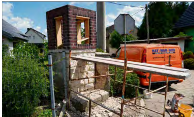
Na razie trwają zaawansowane prace budowlane.

Trwają prace związane z remontem kapliczki znajdującej się u zbiegu ulic świętego Jacka i błogostawionego Czesława w Kamieniu Śląskim. Ważny dla lokalnej społeczności zabytek odzyska swój dawny blask.