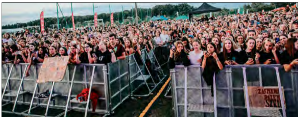
Tłumy gości bawili się w Gogolinie.