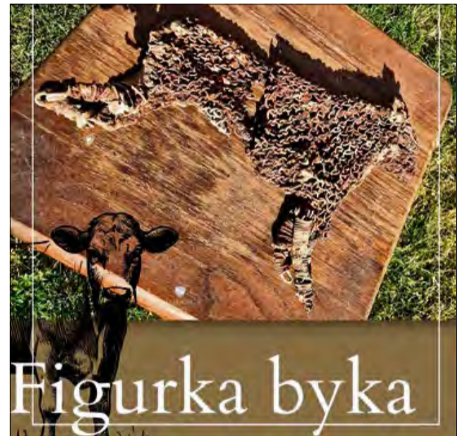
Figurka byka Drobne znaleziska potrafią opowiedzieć najciekawsze historie.