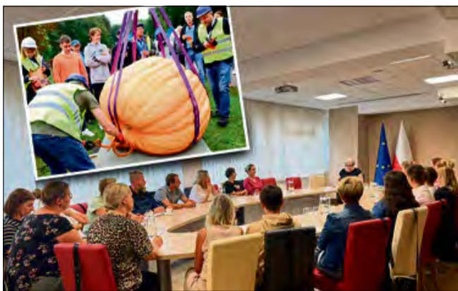
Organizatorzy przygotowują wiele atrakcji na tegoroczne święto dyni.

Jedna z najbardziej rozpoznawalnych imprez w powiecie krapkowickim powraca! 27 września odbędzie się 11. edycja Festiwalu Dyni, który z roku na rok przyciąga coraz więcej miłośników tego pomarańczowego warzywa. Wydarzenie, znane jako Bania Fest, na stałe wpisało się w kalendarz lokalnych atrakcji i cieszy się popularnością nie tylko w regionie, ale także wśród gości z różnych części Polski.