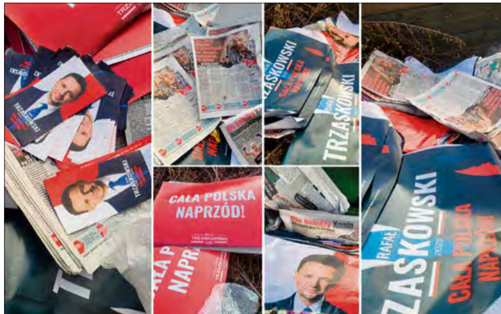
Pełno materiałów wyborczych wylądowało w śmietniku parafialnym.