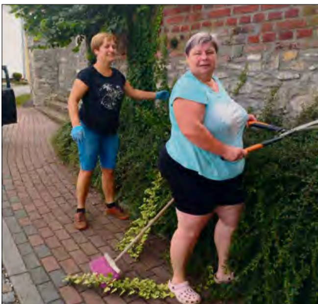
Pracowicie spędzony dzień.

Nie trzeba wielkich słów, by opisać wielkie rzeczy. Czasem to zwykła miotła, para roboczych rękawiczek i sąsiedzka rozmowa między grabieniem a przesadzaniem krzewów pokazują, jak wielką siłę mają wspólnota i codzienna troska o miejsce, w którym się żyje. Pielęgnacja przestrzeni wokół nas to nie tylko estetyka – to także forma cichej troski, odpowiedzialności i szacunku wobec przeszłości, natury i siebie nawzajem.