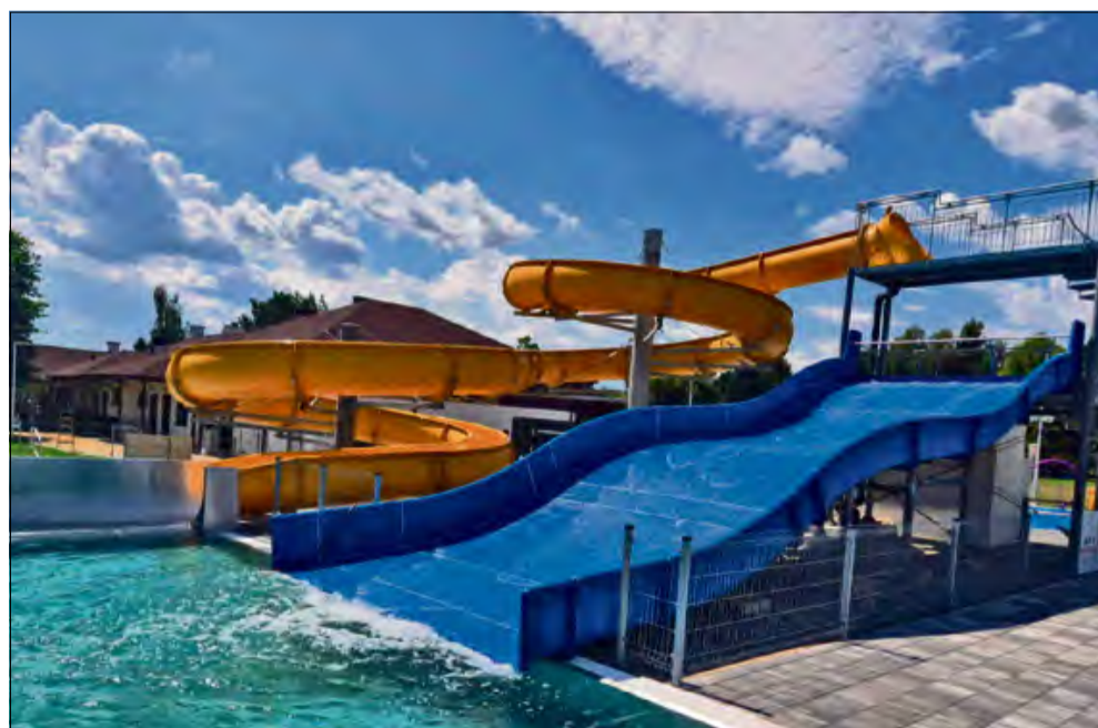
Atrakcje na gogolińskim basenie wyglądają fantastycznie.

W przyszłym miesiącu planowane jest otwarcie gogolińskiego basenu letniego. Na to wydarzenie czeka wielu mieszkańców zarówno gminy, jak i całego regionu.