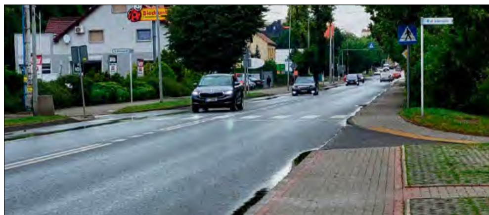
Długość nowej ścieżki pieszo-rowerowej wyniesie 742 metry.