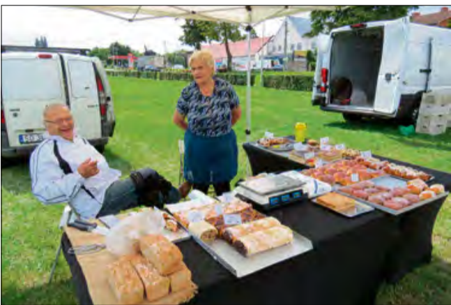
Takie inicjatywy to doskonała okazja, by cieszyć się smakami, które często trudno znaleźć w dużych sklepach.

W czwartek, 17 czerwca, plac Eichendorffa w Krapkowicach znów zamienił się w prawdziwe królestwo smaków, gdzie lokalni producenci zaprezentowali swoje najlepsze wyroby. Na straganach nie brakowało świeżych warzyw, aromatycznych wędlin, wybornych serów, słodkich wypieków oraz różnorodnych przetworów. To już druga edycja tego wydarzenia, które przyciąga nie tylko mieszkańców Krapkowic, ale także okolicznych miejscowości.