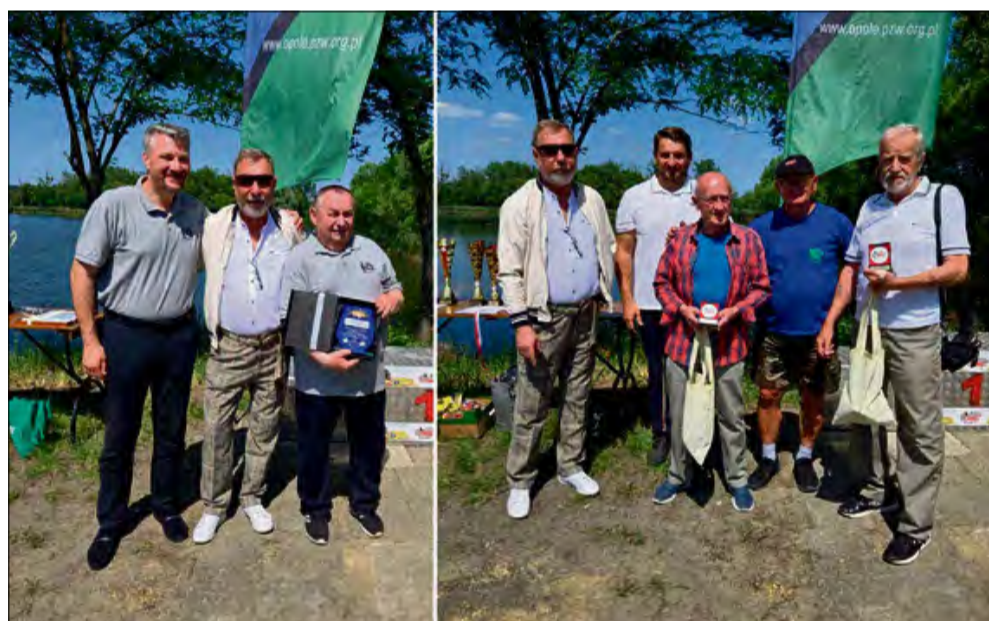
Jubileusz stał się okazją do wręczenia pamiątkowych medali i listów gratulacyjnych.

4 czerwca na stacji wędkarskiej Koła PZW Otmęt nad Krapkowickim „Goldem” odbyły się uroczyste obchody 50-lecia istnienia koła. Wydarzenie połączyło rywalizację sportową, wspomnienia oraz podziękowania dla osób zaangażowanych w rozwój wędkarstwa w regionie.