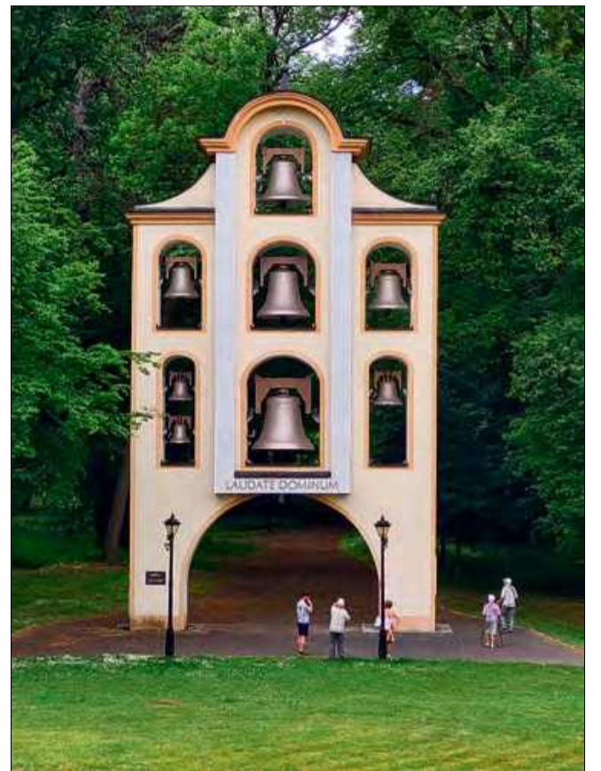
Brama Dzwonów wpisuje się harmonijnie w sanktuarijny krajobraz.

Brama Dzwonów pełni więc rolę pomostu – dosłownie i symbolicznie – między przeszłością a teraźniejszością, między Niemcami a Polską. Dźwięk dzwonów to nie tylko liturgiczne wezwanie, ale też delikatna, dźwięczna modlitwa o zrozumienie i jedność.