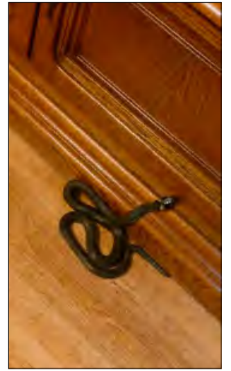
To był tylko zaskroniec...

Strażacy z OSP Gogolin wyjechali do nietypowej akcji. Ich zadaniem było zabranie węża, który znajdował się w domu.