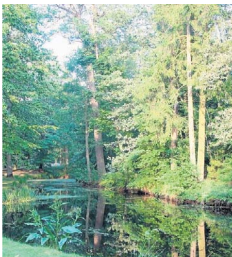
Rezerwat przyrody Wydymacz

Zabawne nazwy miejsc i atrakcji w Polsce to nie tylko humorystyczna ciekawostka – każda nazwa ma przecież swoją historię i etymologię. Z nazw takich jak U Poloka, Dupina czy Wysranki można się pośmiać, ale warto też poznać ich pochodzenie i wyjaśnienie. Z dziwaczными czasem nazwami wiążą się fascynujące opowieści, miejscowe legendy lub ślady dawnych gwar