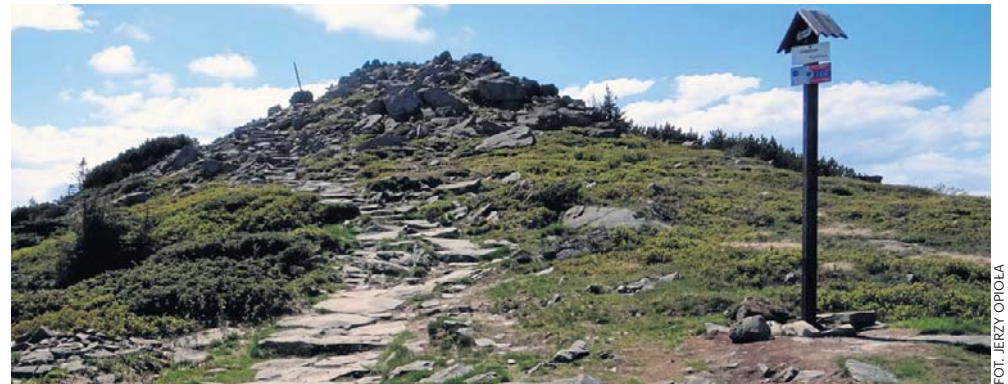
Gówniak w Beskidzie Żywieckim