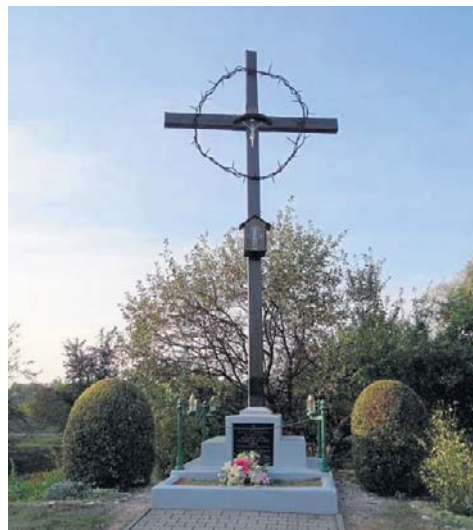
Hujowa Górka w Krakowie