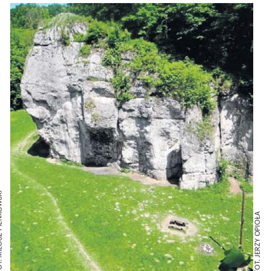
Dupa Słonia w Łazach