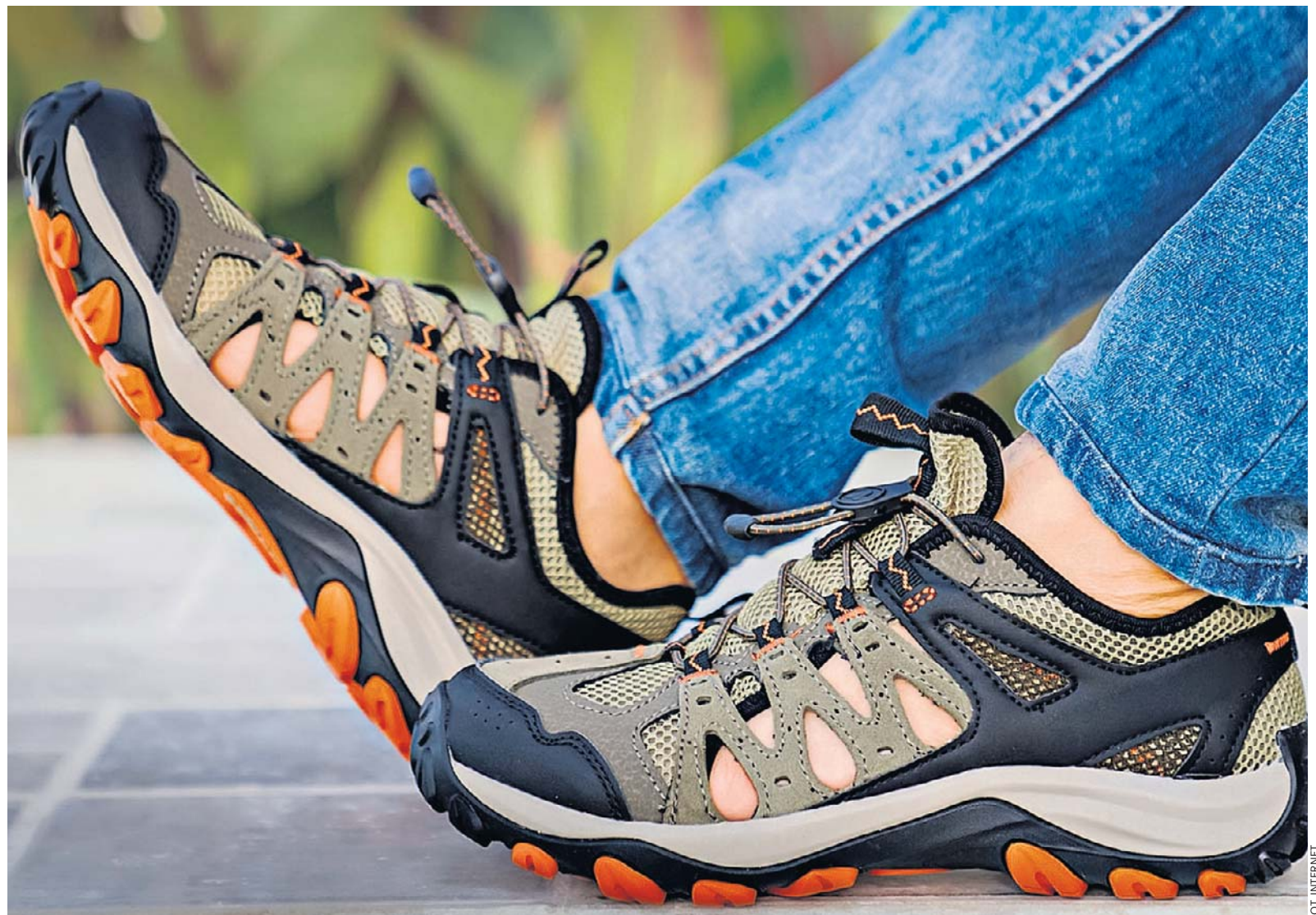
Sandały męskie sportowe będą pasować do bardziej casualowych oraz sportowych stylizacji. Są tworzone w większej barwie kolorystycznej. Świetnie sprawdzą się podczas spacerów oraz aktywnego spędzania czasu

Jeżeli będziesz mieć więcej par butów i będziesz korzystać z nich na zmianę, zachowasz ich świeżość oraz ładny wygląd na dłużej.