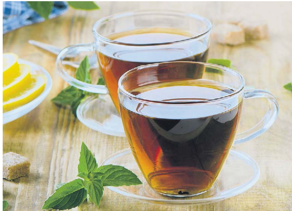
Przeprowadzone badania potwierdzają, że regularne picie herbaty przynosi wiele korzyści dla naszego zdrowia

Warto jednak pamiętać, że nie należy przesadzać z dawką ilością tego naparu. Zbyt duże ilości czarnej herbaty spożywane każdego dnia (powyżej 900 ml) mogą bowiem powodować rozdrażnienie, niepokój,