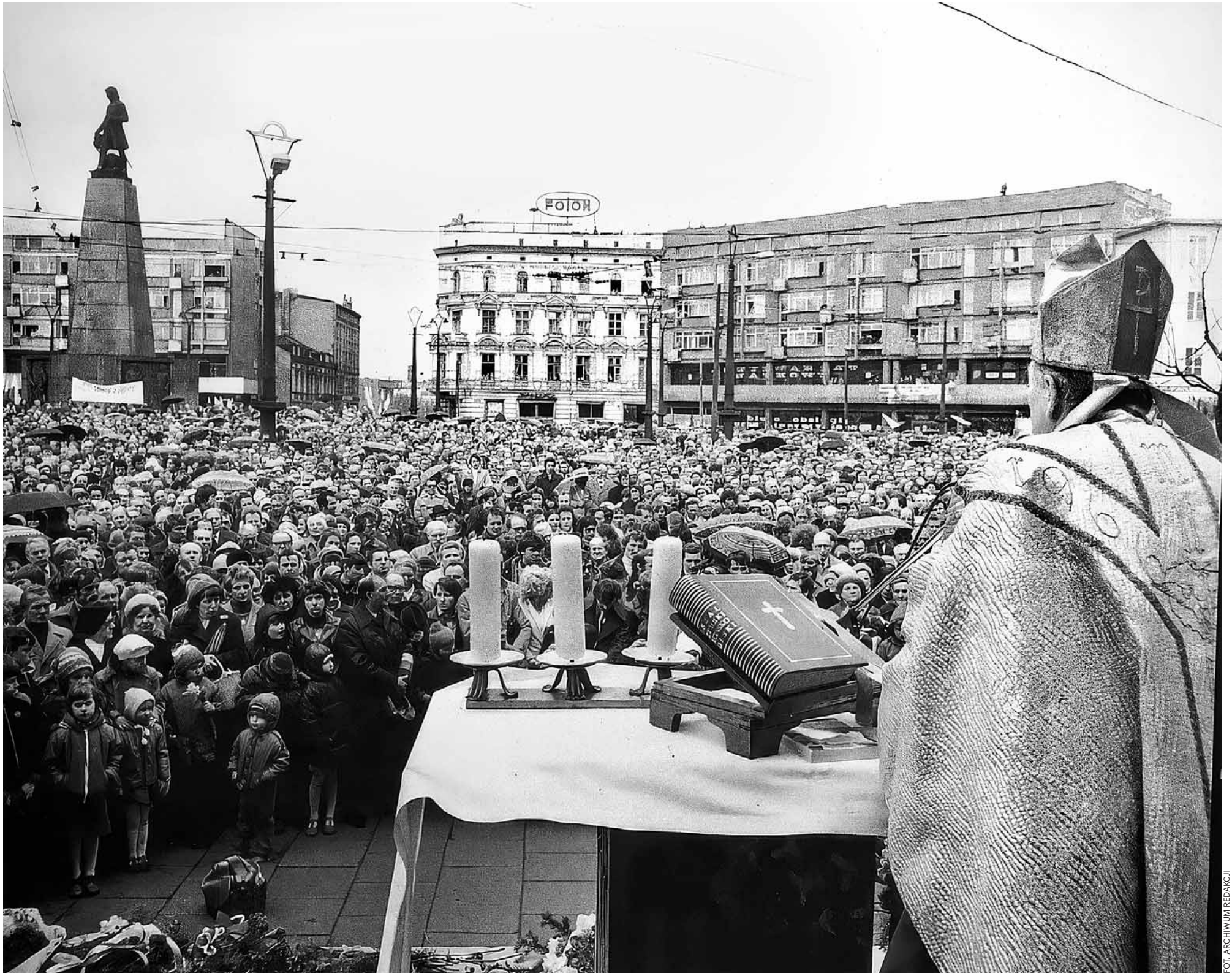
Msza odprawiana na placu Wolności w Łodzi, w którym tłumnie brali udział strajkujący

Po strajku na spokój z pewnością nie mogli liczyć organizatorzy akcji protestacyjnej. Bezpieka zidentyfikowała te osoby i poddała je kontroli operacyjnej. Robotnicy ci musieli się też liczyć z tym, że przy najmniejszej niesubordynacji w przyszłości zostaną zwolnieni z pracy.