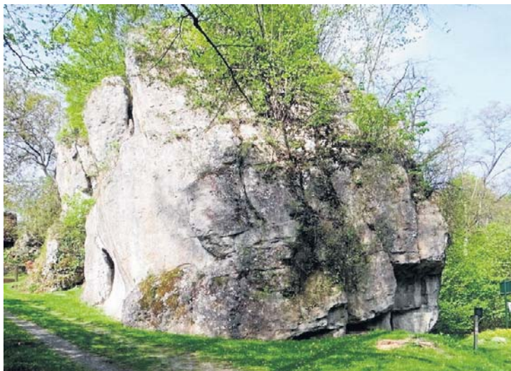
Ponad Gnoj Turnia w Kobylanach

Pod Ostrowem Wielkopolskim, w dolinie Baryczy, blisko wsi Antonin, rozciąga się malowniczy rezerwat przyrody o wdzięcznej nazwie Wydymacz. Bierze ją od miejscowego stawu. Językoznawcy ustalili, że to jeden z wielu stawów w Polsce, które obecnie lub kiedyś nosiły to miano. Wydymacz oznaczał dawniej jeden z przyrządów do regulowania biegu wód. W rezerwacie Wydymacz oglądać można piękne podmokłe łąki jesionowo-