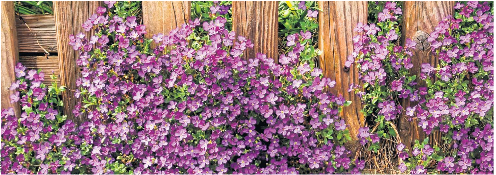
Kwitnie na biało, różowo, fioletowo. Nadaje się na skalniaki, ale też zwykłe rabaty i ich obwódki