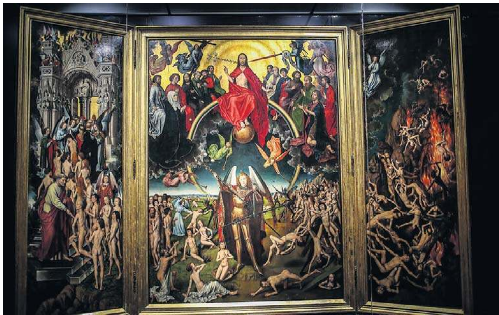
„Sąd Ostateczny” zniknął z wystawy w 2025 r. i przechodzi szczegółowe badania i zabiegi konserwatorskie

Przypomnijmy: „Sąd Ostateczny” Hansa Memlinga to tryptyk tzw. ołtarzowy, namalowany na desce między 1467 a 1471 r. Obraz miał popłynąć do Florencji, ale podczas rejsu zrabowali go korsarze pod dowództwem gdańskiego kapra Pawła Beneke