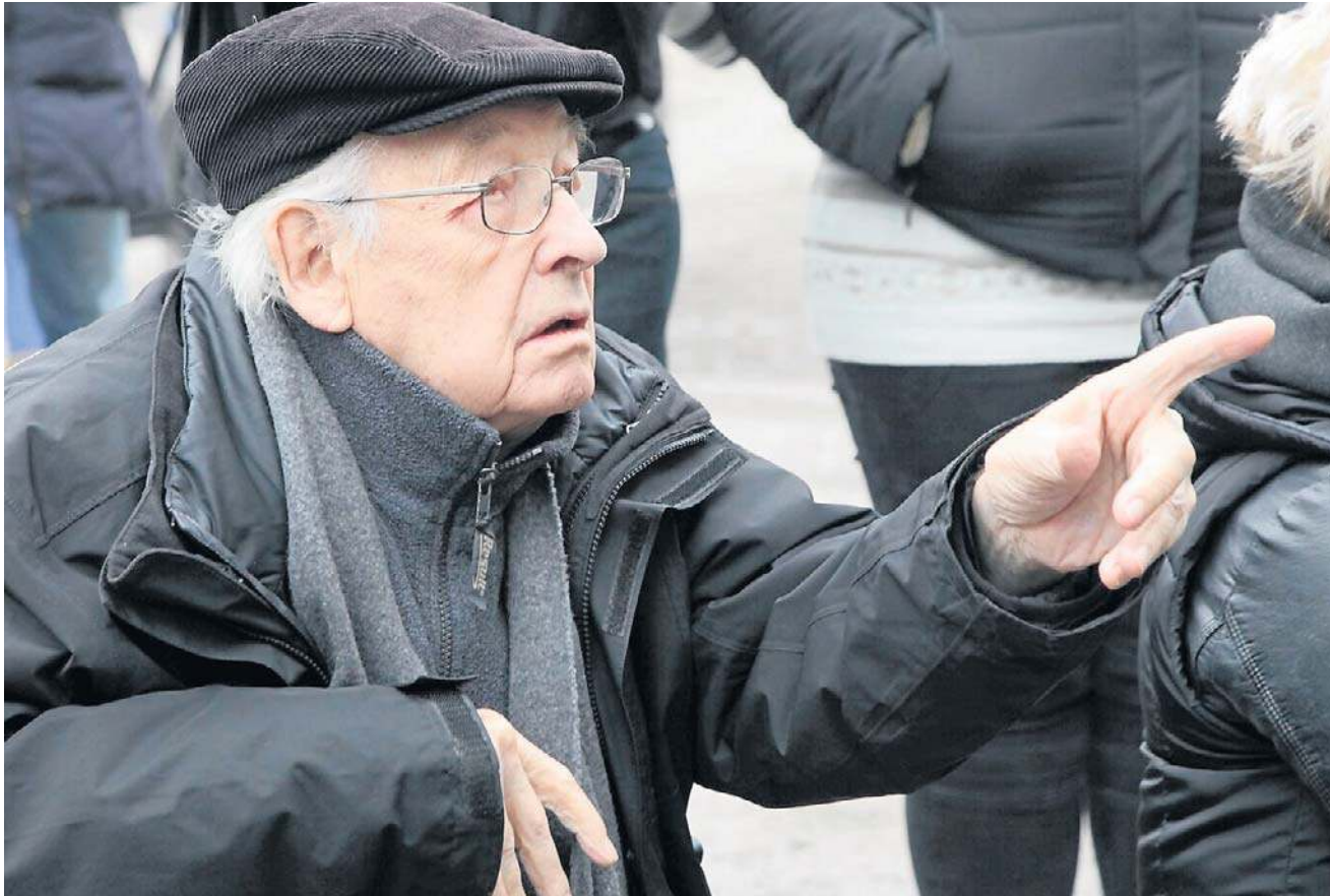
Andrzej Wajda za Łodzią nie przepadał, ale zmienił swój stosunek do niej po nakręceniu „Ziemi obiecanej”