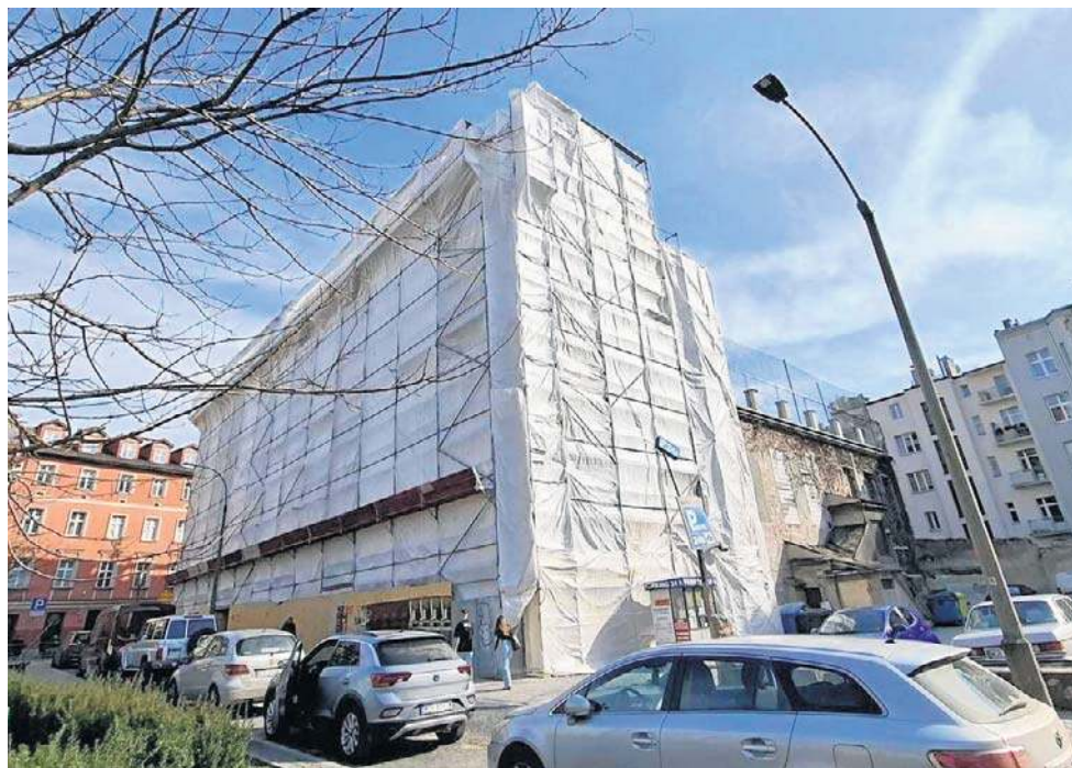
Gmach, w którym działa szkoła i przedszkole, jest szczelnie „zawinięty” w plandeki

Odwiedziliśmy to miejsce, teraz „opakowane” w białe plan-