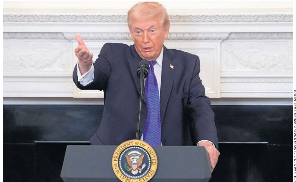
Donald Trump mówi, że USA mogą zaatakować ponownie wyspę Chark dla zabawy. Jednocześnie podważył autorytet nowego najwyższego przywódcy Iranu

Podkreślił jednak, że celowo wojska oszczędziły irańską infrastrukturę przesyłową, aby uniknąć wieloletniej odbudowy.