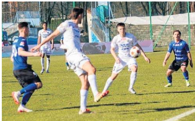
Piłkarze Hutnika wiosną u siebie wygrali oba spotkania

Zwycięski gol padł w kuriozalnych okolicznościach. Bramkarz Konrad Forenc tak wyrzucił piłkę, że spadła na nogę Kac-