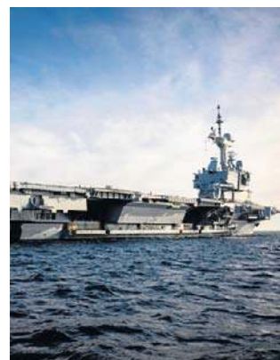
Francuski lotniskowiec Charles de Gaulle

Wcześniej Włochy, Francja i Grecja wysłały swoje okręty