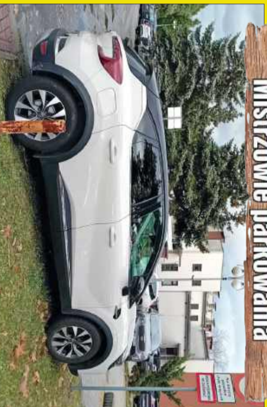
„Doga pożarowa, nie zastawiać”... Więc zastawił tylko troszeczkę!