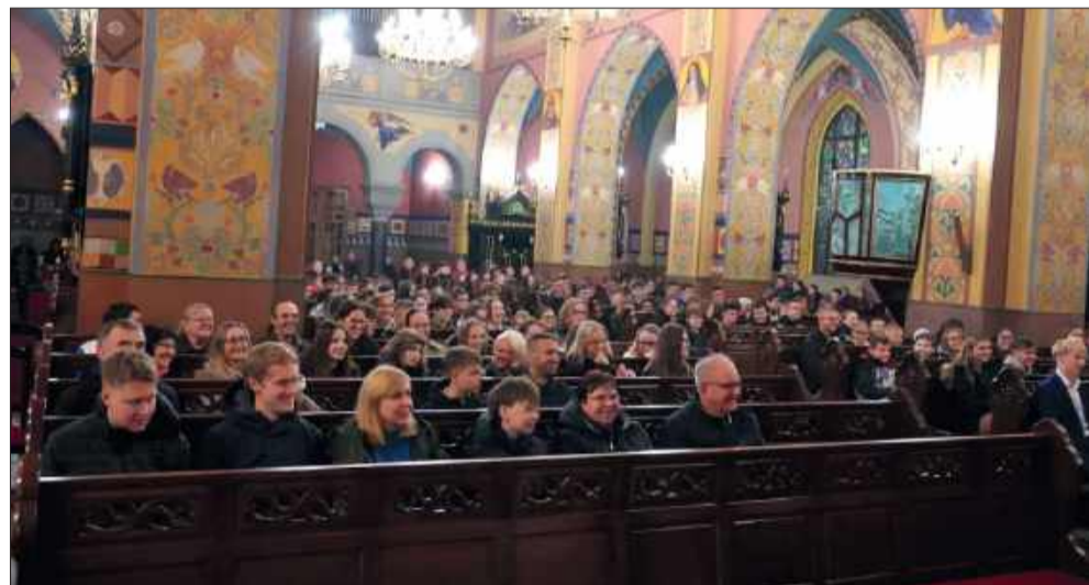
Kościół wypełniony młodymi – wspólna „Noc Świętych”.