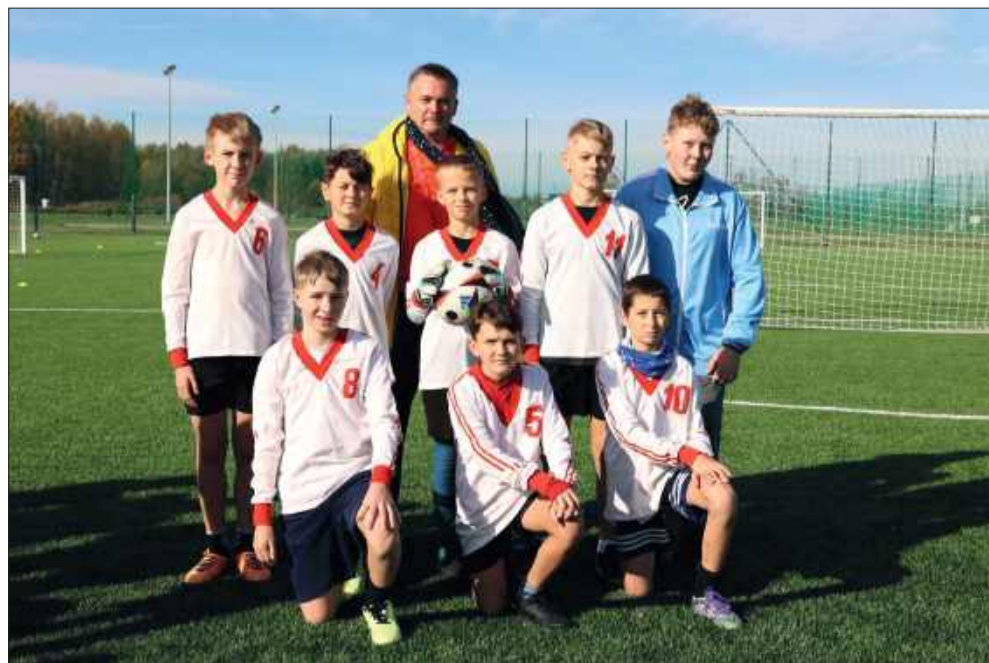
Zawodnicy walczyli do ostatniego gwizdka.