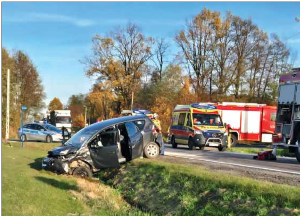
W wypadku uszkodzone zostały cztery osoby.