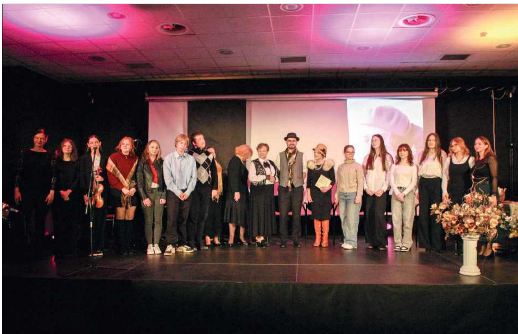
Teatr w Mielcu ma się znakomicie.