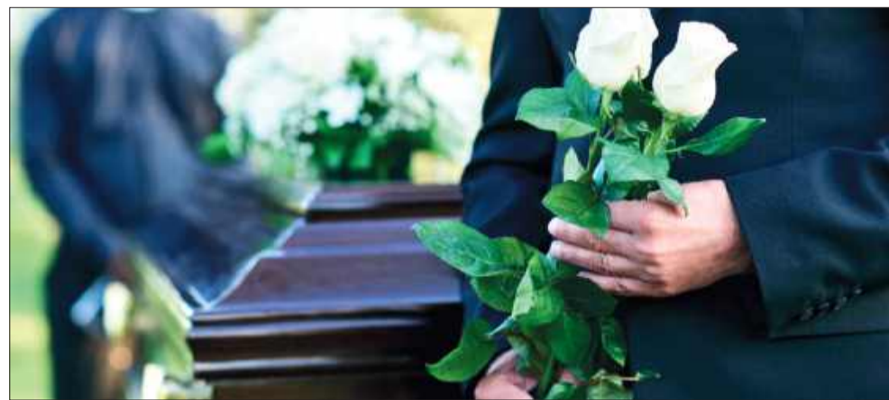
Na złożenie wniosku o wypłatę zasiłku pogrzebowego jest 12 miesięcy od dnia śmierci osoby, po której przysługuje zasiłek.

Ponad 17,5 tysiąca zasiłków pogrzebowych wypłacił Zakład Ubezpieczeń Społecznych w ubiegłym roku na Podkarpaciu. W bieżącym roku, do końca września, takich świadczeń przyznano już 13,3 tysiąca. Zasiłek pogrzebowy to nic innego jak zwrot poniesionych kosztów pogrzebu – pomoc finansowa dla osób, które zorganizowały pochówek.