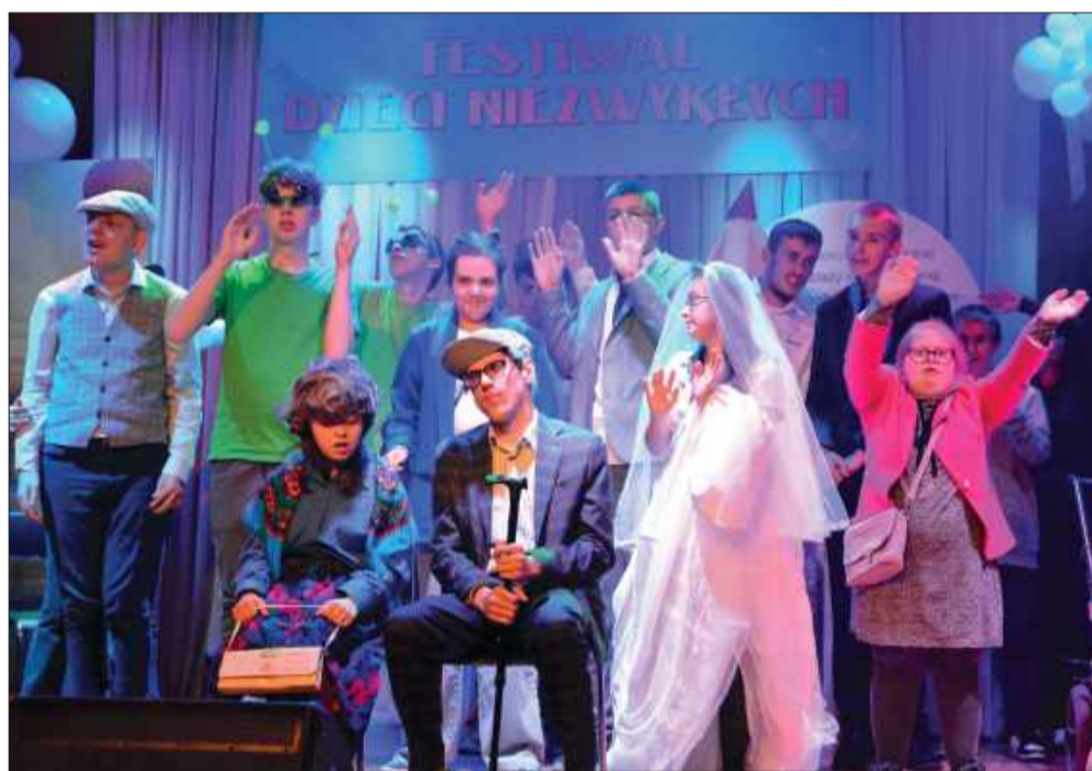
Scena w Chorzelowie rozświetlona talentem i pasją.

Dla organizatorów i partnerów wydarzenia każdy występujący był zwycięzcą – bo to