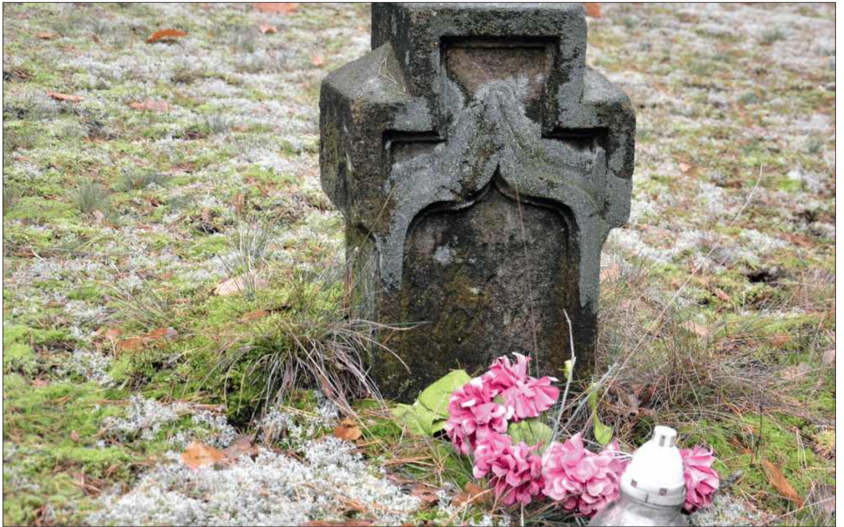
Cmentarz w Sarnowie.

Tuszyna–Białą Bór – cmentarz wojenny nr 500 (I wojna światowa) – Największa nekropolia z I wojny światowej na terenie powiatu mieleckiego założona przez Austriaków po bitwie pod Tuszyną (maj 1915). Już jesienią 1915 zaczęto zakładać tu cmentarz, według tradycji na miejscu starszej mogiły (z czasów „potopu” szwedzkiego) W 1916 r. ekshumowano i przeniesiono na to miejsce ciała poległych z okolicznych pochówków (m.in. z Przecławia i Wylowa). W 1917 r. cmentarz zaprojektował austriacki artysta Karl Perl. W czasie II wojny światowej miejsce uległo dewastacji (m.in. miejscowa ludność wybierała z niego piasek), jednak w 1941 r. okupacyjne wojsko niemieckie prowizorycznie je odnowiło. Po latach zaniedbań cmentarz został od 2005 r. objęty opieką społeczną – z inicjatywy lokalnej młodzieży i pasjonatów historii rozpoczęto jego rewitalizację. W 2006 r. odtworzono ogrodzenie, bramę, ustawiono drewniany krzyż centralny i krzyże nagrobne w formach katolickiej