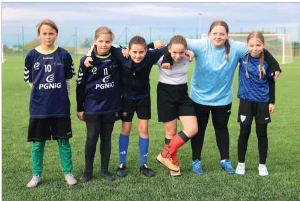
Tak gra młodzież z gminy Tuszów Narodowy!