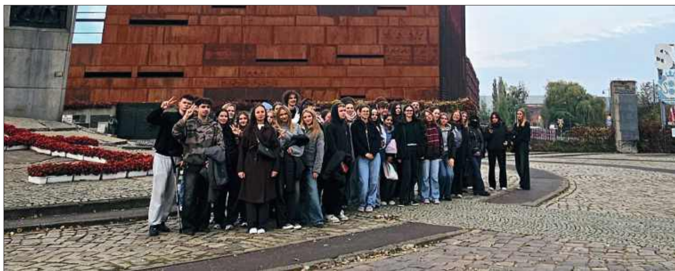
Młodzież z Mielca uda się do Niemiec w przyszłym roku.