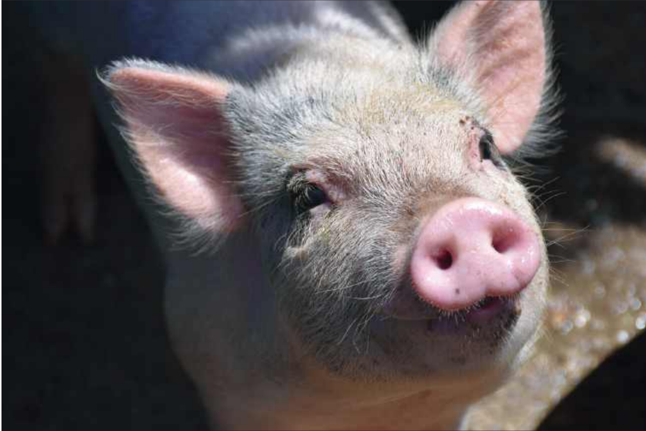
Cały powiat mielecki w strefie niebieskiej ASF.

Powiatowy Lekarz Weterynarii w Mielcu poinformował, że od 28 października 2025 roku wchodzi w życie nowe przepisy unijne dotyczące zwalczania afrykańskiego pomoru świń (ASF). Zgodnie z Rozporządzeniem, cały powiat mielecki został objęty obszarem ograniczeń I – tzw. strefą niebieską.