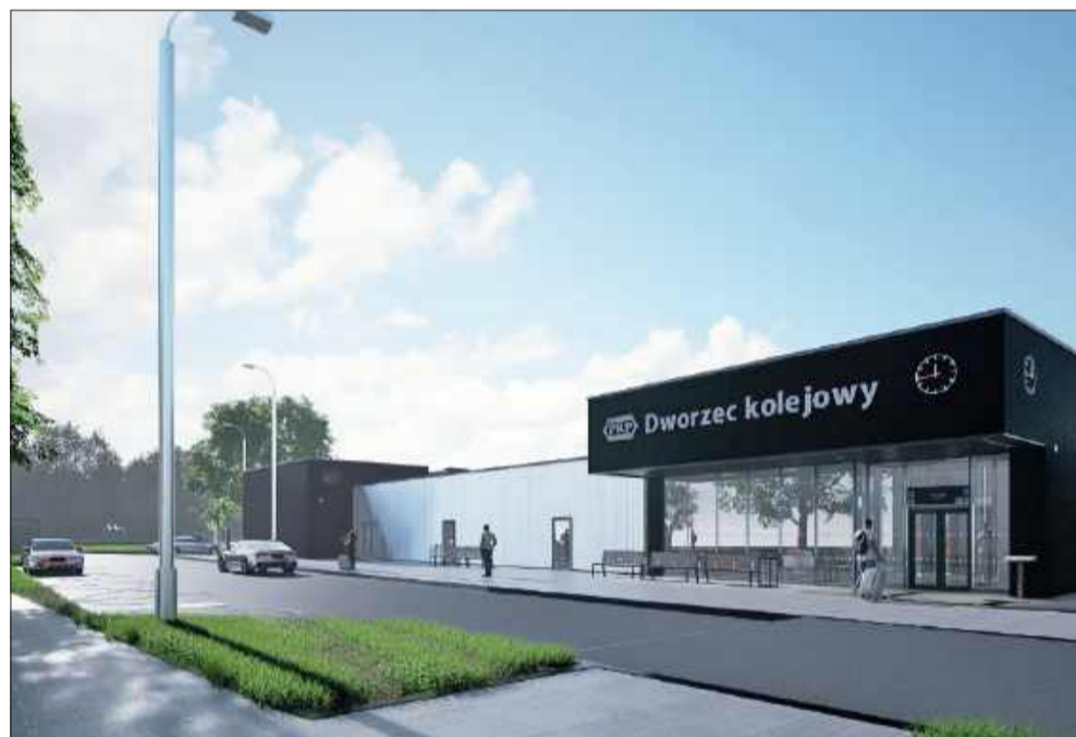
Tak będzie wyglądał nowy dworzec.