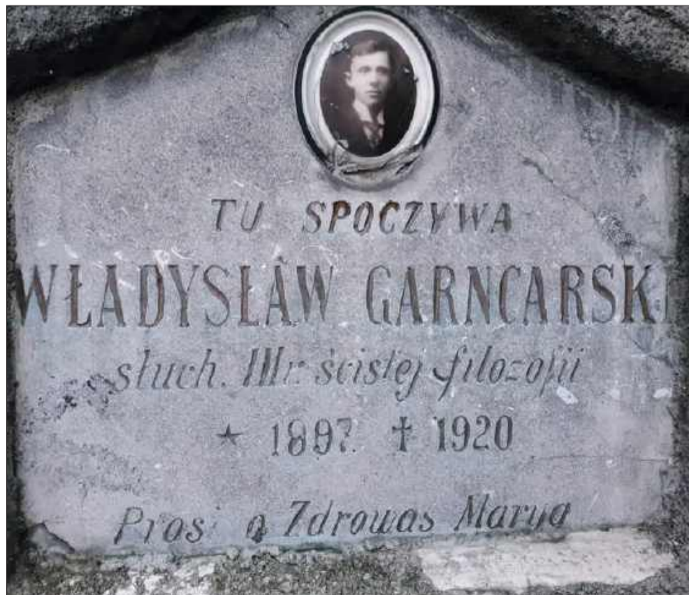
Spacer po tej części nekropolii to podróż w czasie.