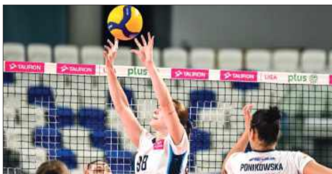
Powrót do Stali Mielec.