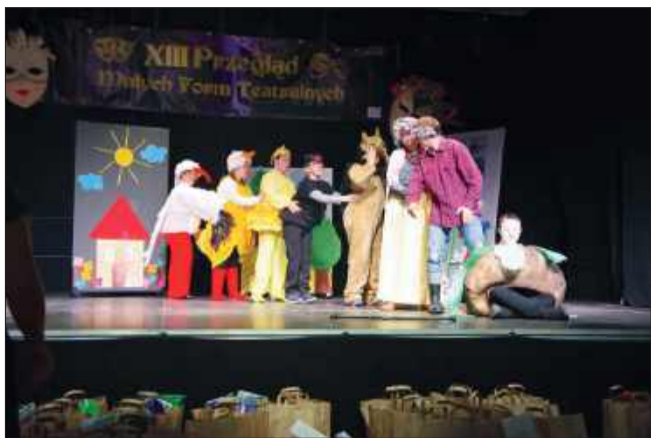
XIII Przegląd Teatralny dzieci i młodzieży ze szkół specjalnych.

W Radomyślu Wielkim odbył się XIII Przegląd Małych Form Teatralnych dla dzieci i młodzieży ze szkół i ośrodków specjalnych województwa podkarpackiego. To wyjątkowe wydarzenie, które co roku przyciąga młodych artystów i ich opiekunów, ponownie udowodniło, że teatr nie zna barier.