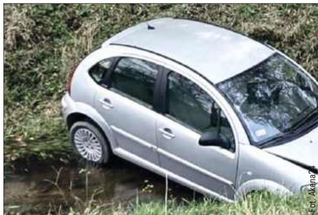
Przyczyną zdarzenia był niezaciągnięty hamulec ręczny.

W niedzielny poranek, 2 listopada, w Rzochowie doszło do nietypowego incydentu drogowego, który na szczęście zakończył się bez poszkodowanych. Około godziny 8:00 rano osobowy samochód zaparkowany pod miejscowym kościołem samoczynnie stoczył się ze wzniesienia i wpadł do pobliskiego kanału.