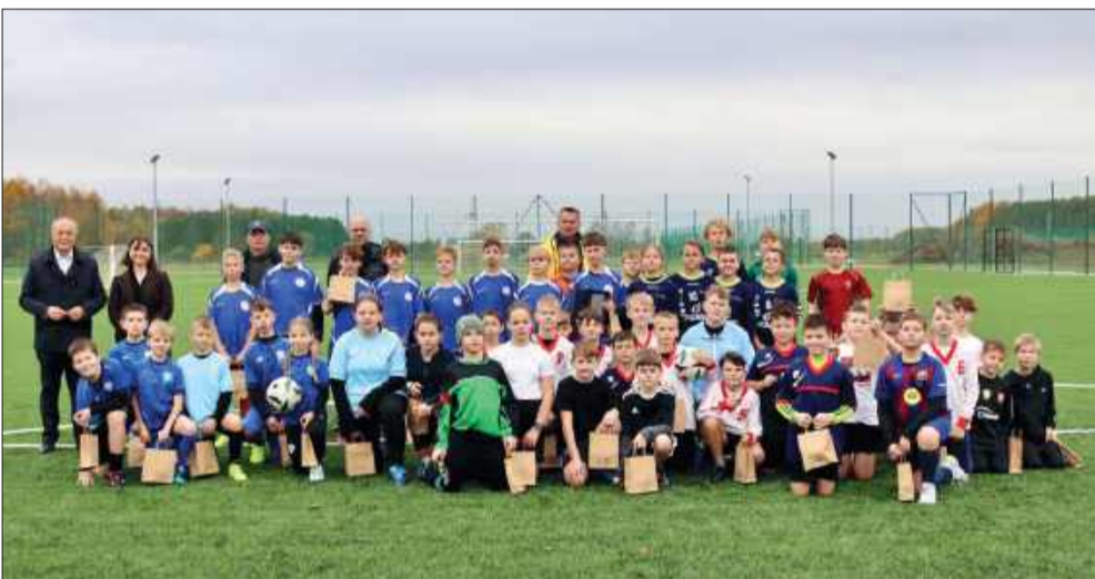
Piłkarskie emocje w CTT

Turniej Szkół Podstawowych o Puchar Centrum Treningowego Tuszów Narodowy wyłonił zwycięzcę. Po emocjonujących rozgrywkach puchar trafił do drużyny z Zespołu Szkół w Maliniu. Zawody odbyły się na nowoczesnych obiektach CTT, które stały się miejscem promocji sportu wśród dzieci i młodzieży z gminy.