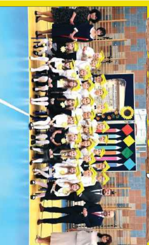
W mieleckich szkołach w październiku pierwszoklasiści zostali pasowani na uczniów!