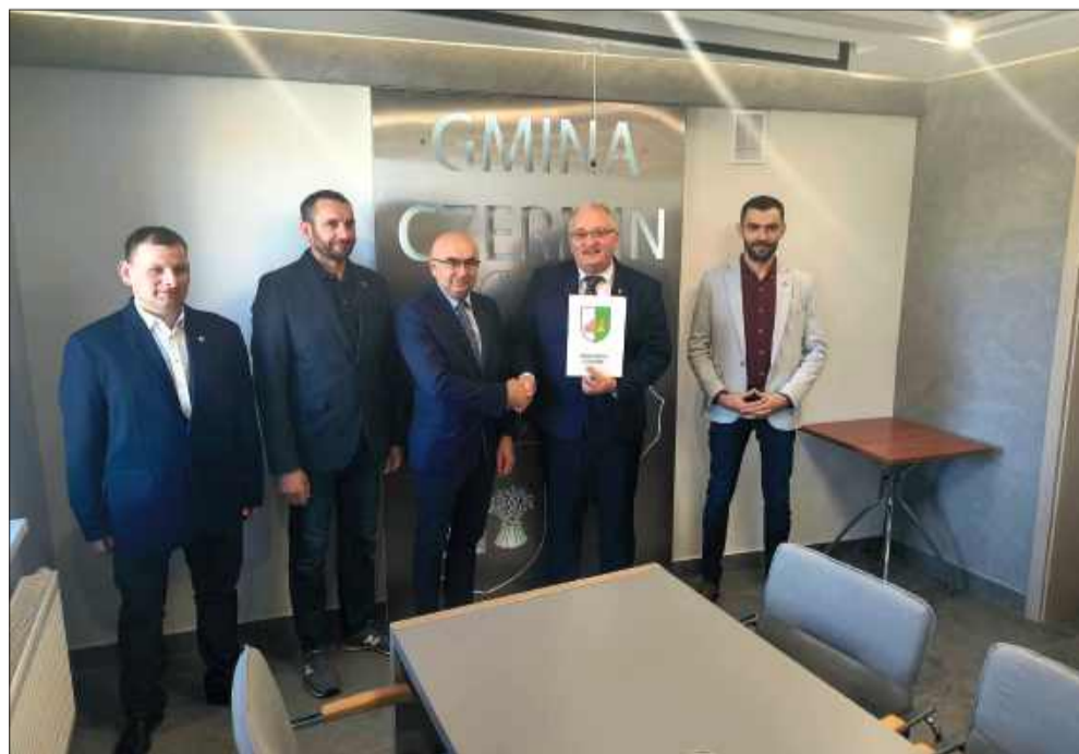
W gminie Czermin powstanie budynek sportowo-kulturalny.