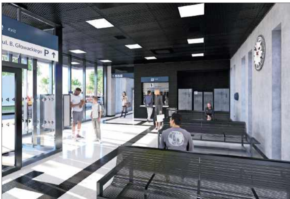
Wnętrze ma być wygodne, estetyczne i funkcjonalne.