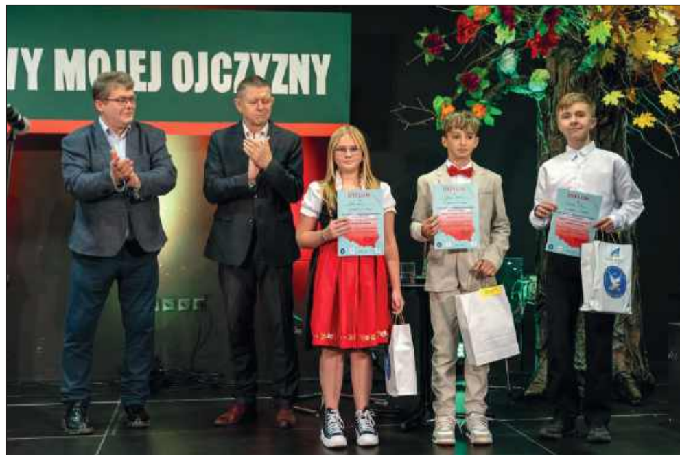
Wydarzenie pełni ważną rolę wychowawczą i edukacyjną.