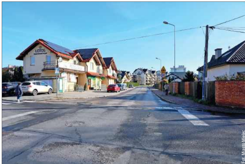
Ul. Zygmuntowska obecnie.