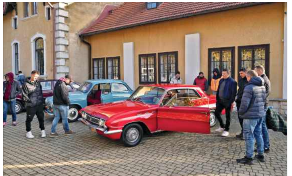
W Mielcu nie brakuje amatorów starych samochodów.