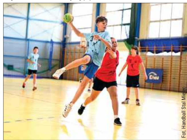
Młodzi zawodnicy zostawili serca na boisku.

Organizatorem cyklu jest Regionalna Liga Młodzieżowa przy wsparciu Elektrowni Enea Połaniec. JB