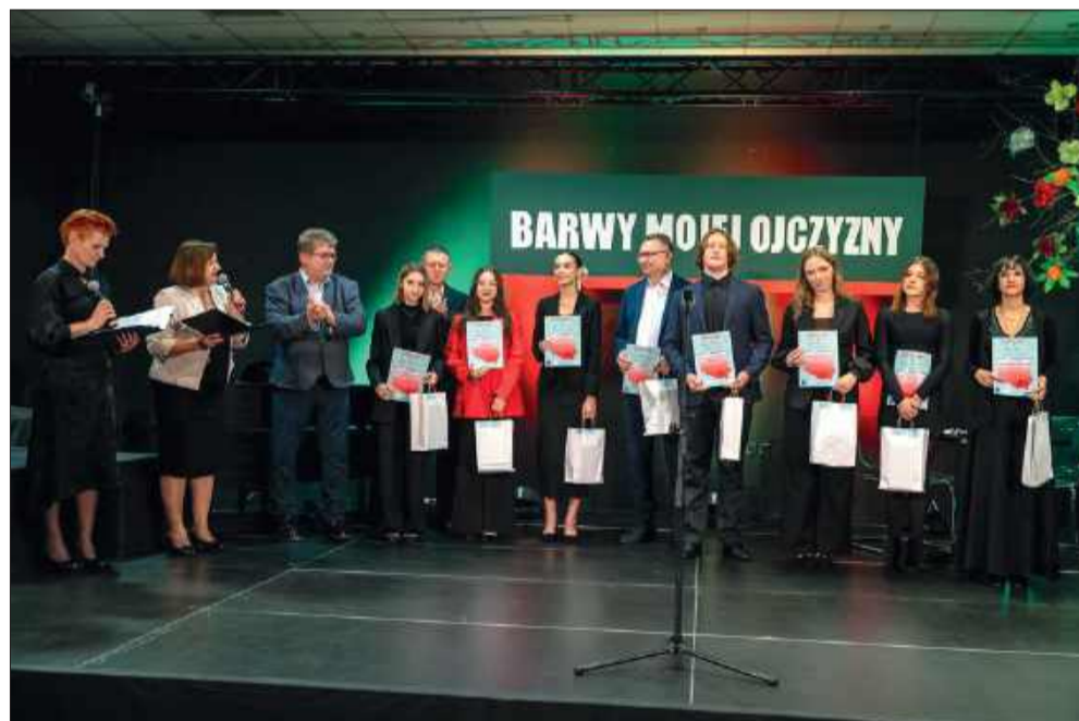
W tegorocznej edycji na scenie zaprezentowali się uczniowie szkół podstawowych i ponadpodstawowych rywalizujący w dwóch kategoriach: recytacji i śpiewu.