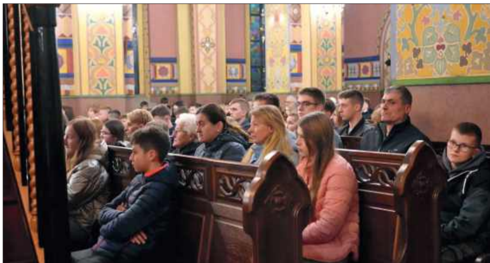
Świętowanie inaczej – z wiarą, muzyką i radością.