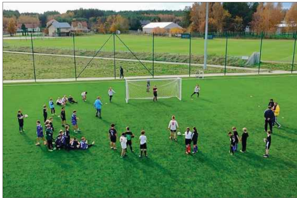
Nowoczesne boiska robią piorunujące wrażenie.