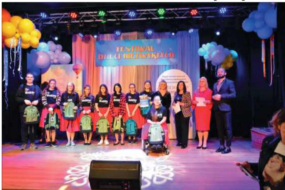
Pamiątkowe dyplomy i nagrody – każdy uczestnik został doceniony.

Chorzelów przez dwa dni tętnił sztuką i emocjami. W dniach 23–24 października 2025 roku Samorządowy Ośrodek Kultury i Sportu w Chorzelowie stał się przestrzenią pełną uśmiechu, odwagi i twórczego wyrazu. Wszystko za sprawą „Festiwalu Dzieci Niezwykłych” – Przeglądu Twórczości Artystycznej Dzieci i Młodzieży Niepełnosprawnej Województwa Podkarpackiego.