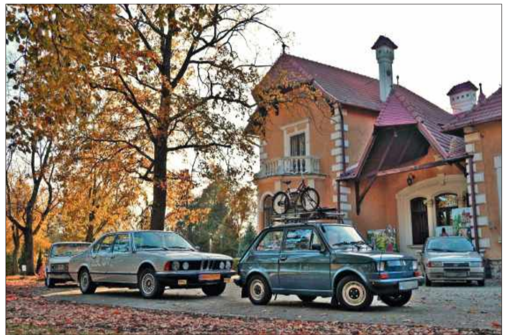
19 klasyków zjechało pod Dworek Oborskich.