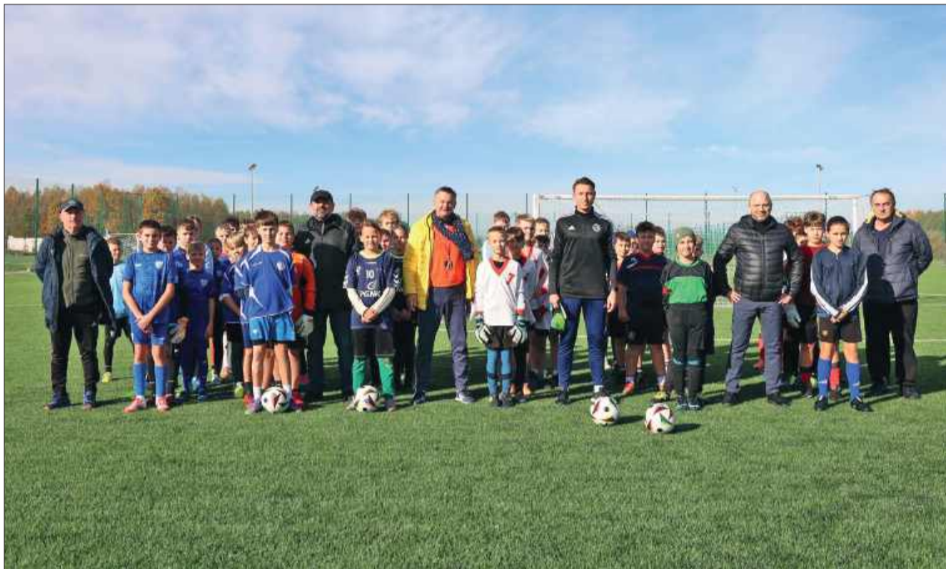
Wszyscy wygrani – młodzi zawodnicy z Jaślan, Borek i Tuszowa zagrali fair i z sercem.