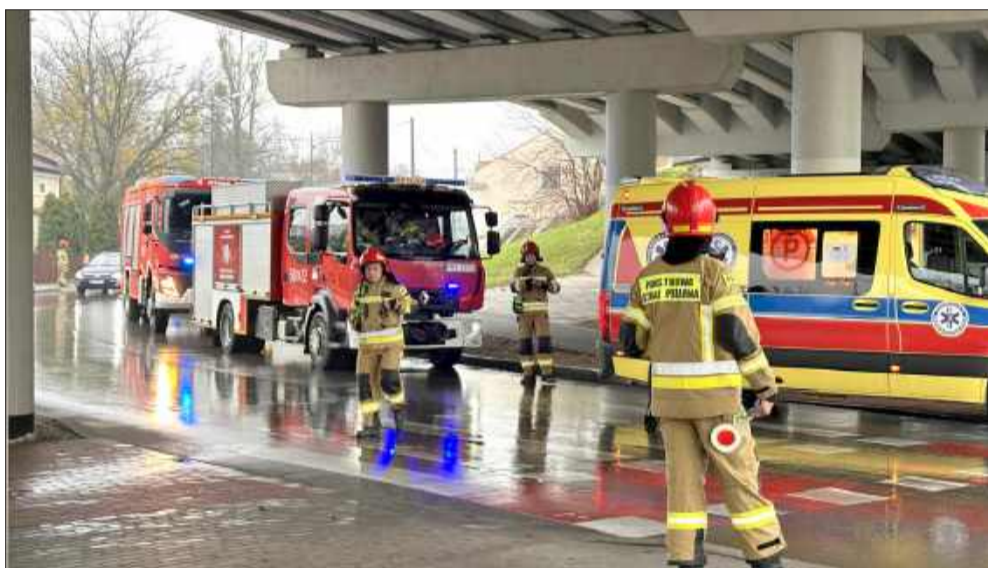
To kolejny wypadek, do którego doszło w powiecie mieleckim w ostatnim czasie.

Ruch pod wiaduktem był częściowo utrudniony. Służby prosiły kierowców o zachowanie ostrożności i korzystanie z objazdów. jb