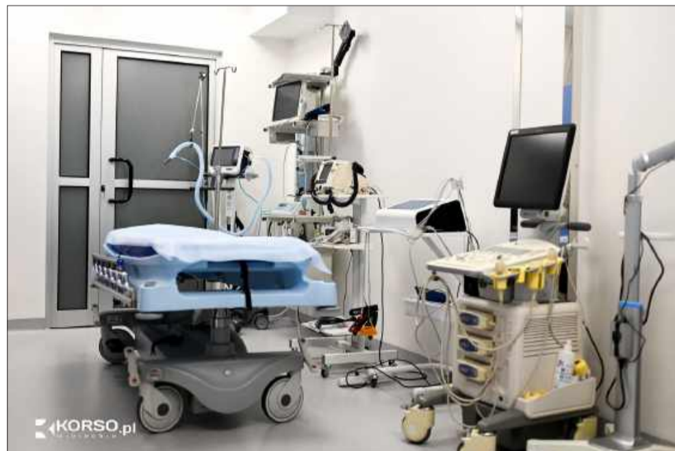
Nowe kardiomonitory i aparaty do resuscytacji – sprzęt, który ratuje życie.