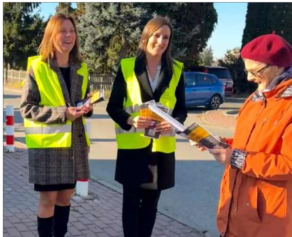
„Odblaskowa szkoła” w Chorzeliowie przypomina: bezpieczeństwo zaczyna się od widoczności.

W Szkole Podstawowej w Chorzeliowie trwa intensywna kampania promująca bezpieczeństwo na drodze. W ramach ogólnopolskiego konkursu „Odblaskowa szkoła”, uczniowie, nauczyciele oraz dyrekcja placówki połączyli siły, by zwrócić uwagę mieszkańców na znaczenie widoczności po zmroku.