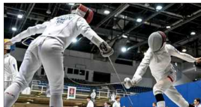
Czteruosobowa reprezentacja klubu PTG Sokół 1893 Mielec wystąpiła w Budapeszcie.

Czteruosobowa reprezentacja klubu PTG Sokół 1893 Mielec wystąpiła w barwach kadry narodowej podczas Pucharu Europy Kadetów w szpadzie, który odbył się w Budapeszcie pomiędzy 8-9 listopada. W zawodach wzięło udział niemal 900 zawodników i zawodniczek z całego świata.