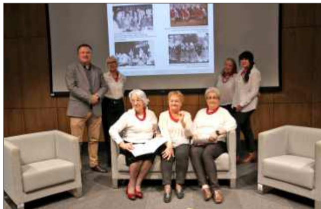
Grupa nieformalna Rzeszowiacy 1960-1975

W Miejskiej Bibliotece Publicznej w Mielcu odbył się 13 listopada premierowy pokaz filmu „Koloryt Rzeszowiaków”, który przyciągnął zarówno dawnych członków Zespołu Pieśni i Tańca Rzeszowiacy, jak i mieszkańców ciekawych opowieści o lokalnej historii. Produkcja pozwala zajrzeć za kuliszy działalności zespołu w latach 60. i 70., a pełne ciepła wspomnienia bohaterów tworzą niezwykle obraz tamtego czasu.