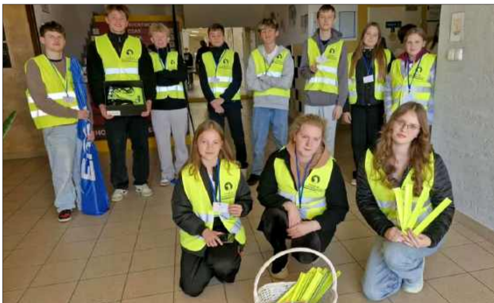
„Bądź widoczny – noś odblaski!” – uczniowie z Borowej promują bezpieczeństwo na drodze.