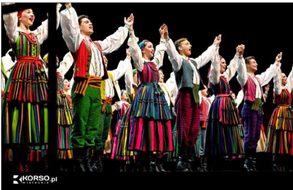
Zespół Pieśni i Tańca „Mazowsze” na scenie w Mielcu - w pełnym, 160-osobowym składzie.