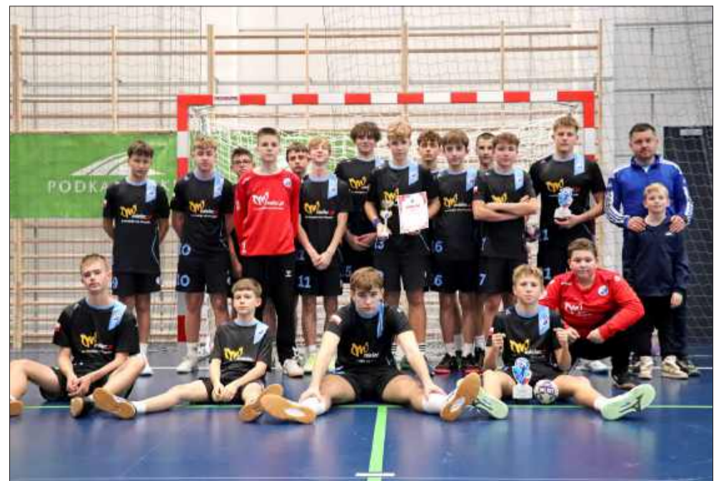
VII Niepodległościowy Turniej Piłki Ręcznej za nami. Sportowe emocje i walka do ostatniego gwizdka.