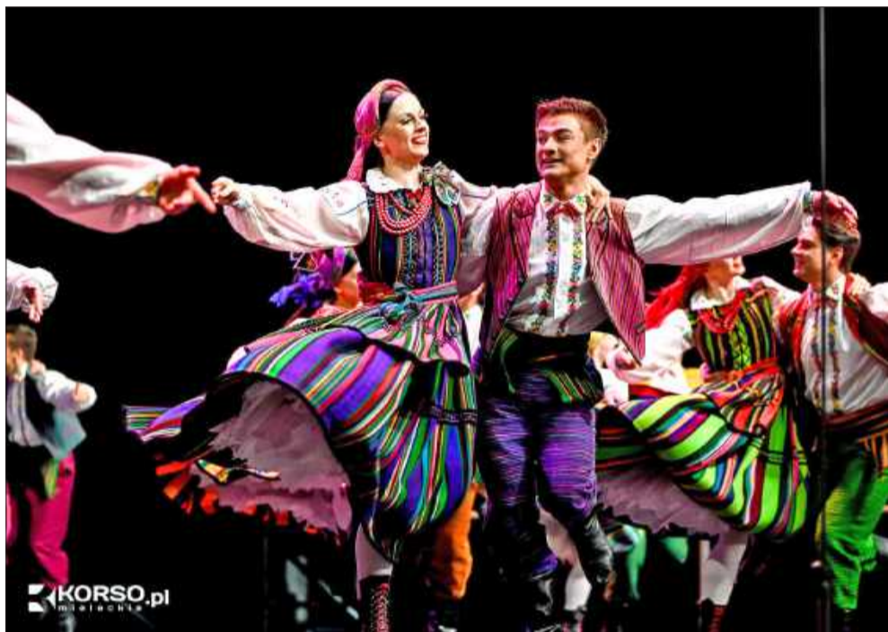
Kolorowe stroje ludowe - nieodłączny element magii koncertów „Mazowsza”.