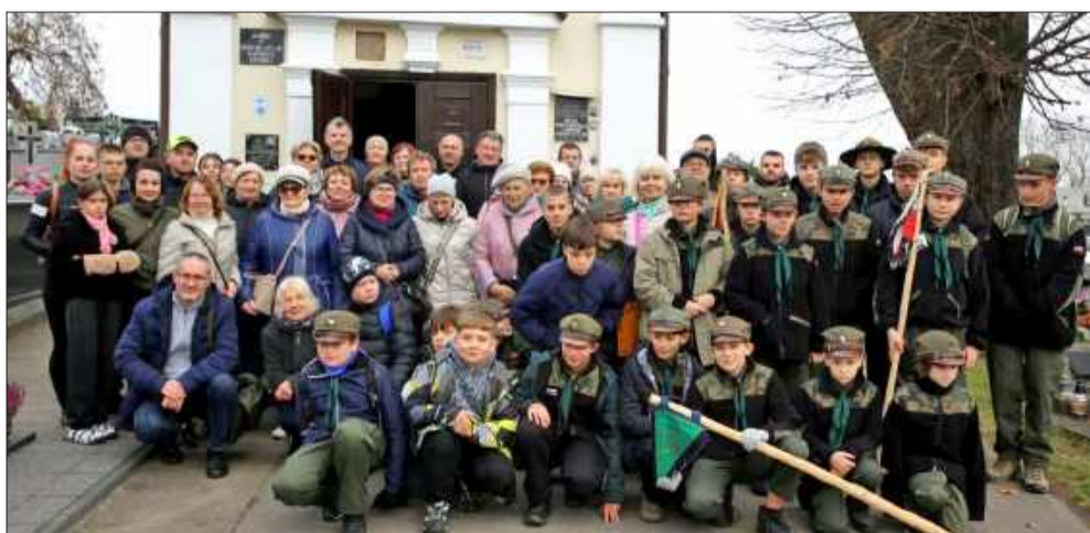
Odwiedzili groby tych, którzy walczyli za wolność.

To wydarzenie pokazało, że pamięć o lokalnych bohaterach wciąż jest żywa. Mielczanie kolejny raz udowodnili, że potrafią pielęgnować tradycję i oddać hołd tym, którzy swoją postawą zapisali się w historii miasta i kraju. MW