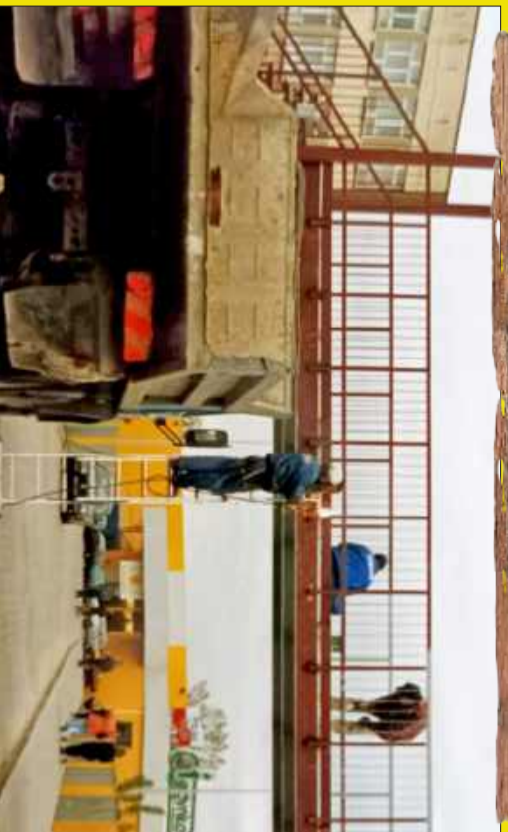
Czar dawnych sklepów...!