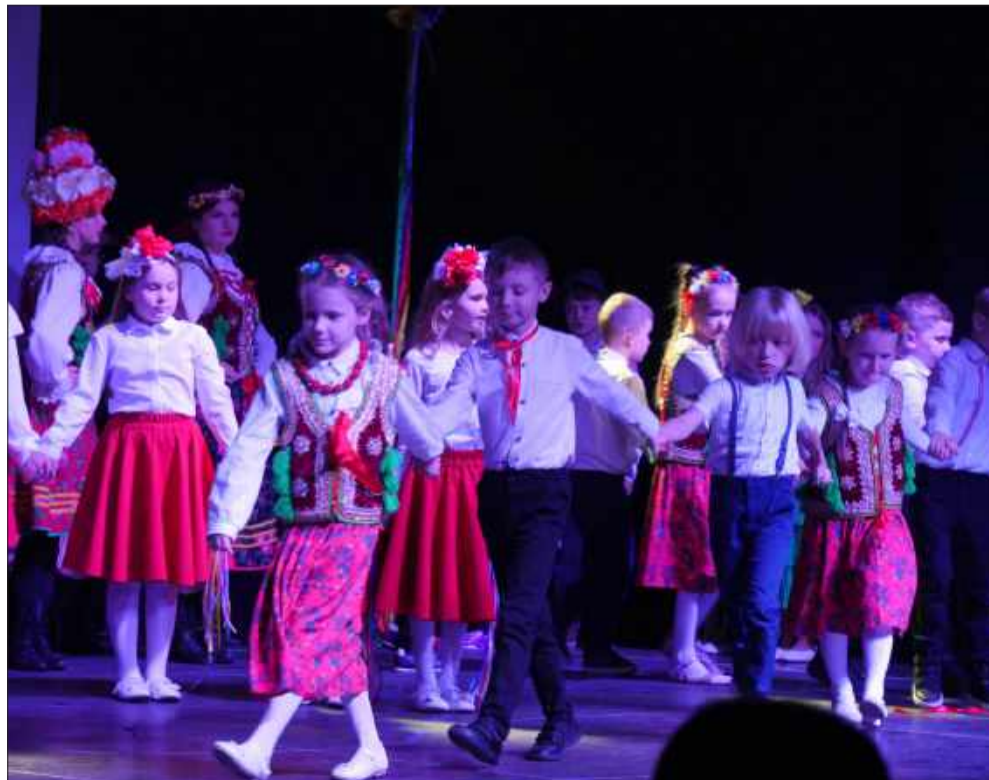
Najmłodszy żywiolowo zaprezentowali taniec ludowy.