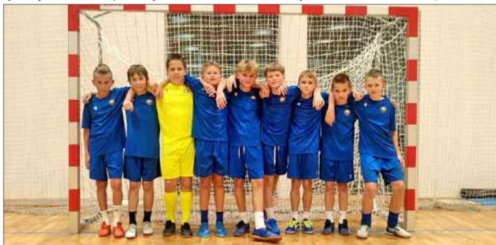
Młodzi zawodnicy SMS Stal Mielec udanie rozpoczęli zimowy sezon halowy.