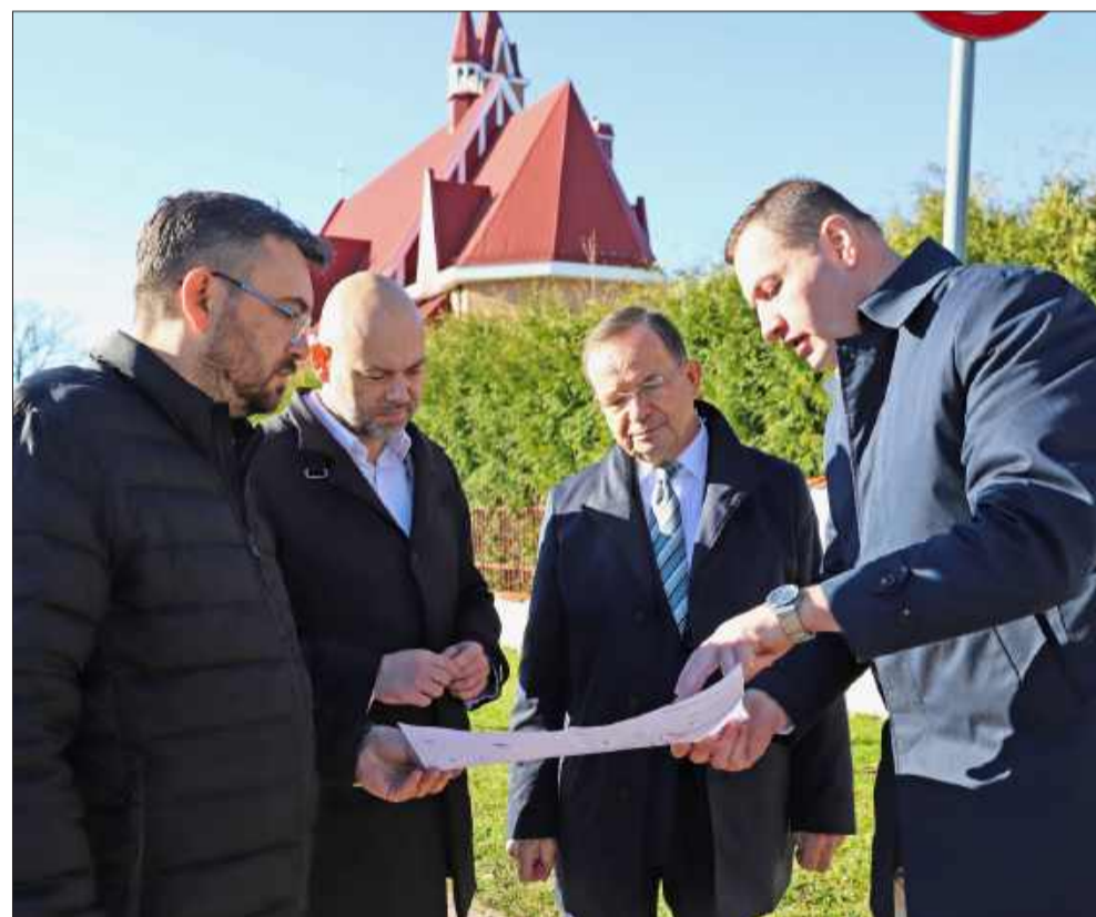
W Rzochowie wkrótce ma być bezpieczniej.

Na mieleckim Osiedlu Rzochów wkrótce rozpoczną się prace związane z budową dwóch nowych chodników oraz przejścia dla pieszych na drodze wojewódzkiej nr 985. To kolejny etap działań mających na celu zwiększenie bezpieczeństwa i wygody mieszkańców tej części miasta.