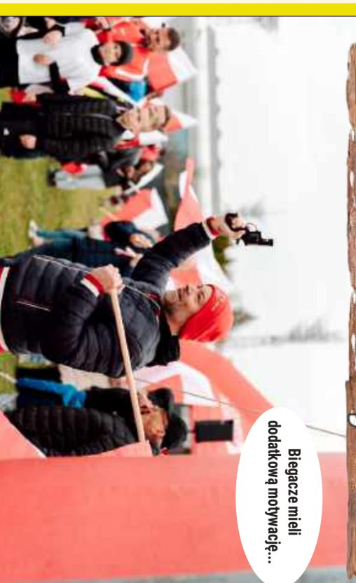
Biegacze mieli dodatkową motywację...