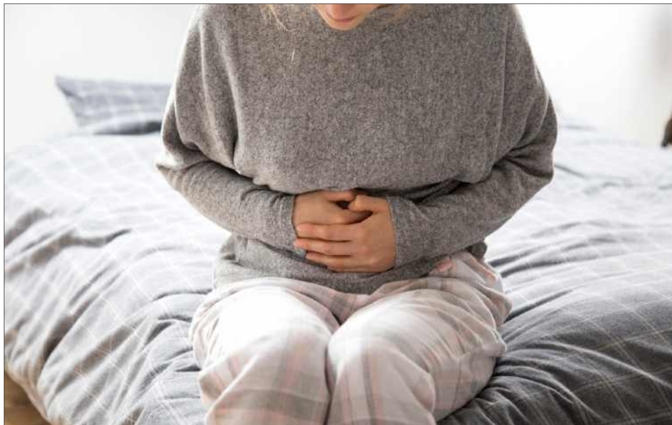
Pamiętajmy, że zdrowe jelita to klucz do zdrowia całego organizmu.

Ruch ma ogromne znaczenie dla zdrowia jelit. Regularne ćwiczenia pomagają w utrzymaniu prawidłowej perystaltyki jelit, czyli rytmicznych ruchów, które odpowiadają za przesuwanie treści pokarmowej przez jelita. Ćwiczenia takie jak chodzenie, bieganie, pływanie czy joga poprawiają przepływ krwi w jelitach, co wspomaga trawienie i zapobiega zaparciom. Regularny wysiłek fizyczny to także skuteczny sposób na zmniejszenie wzdęć i bólu brzucha.