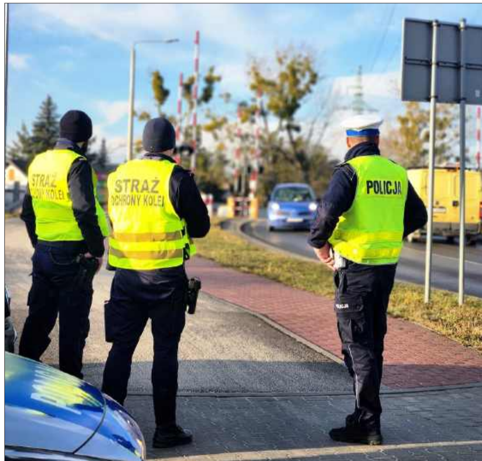
Mieleccy funkcjonariusze na torach.

Mieleccy policjanci po raz kolejny pojawili się na przejazdach kolejowych i w rejonie torowisk, by wspólnie ze Strażą Ochrony Kolei prowadzić działania w ramach akcji „Stop Brawurze”.