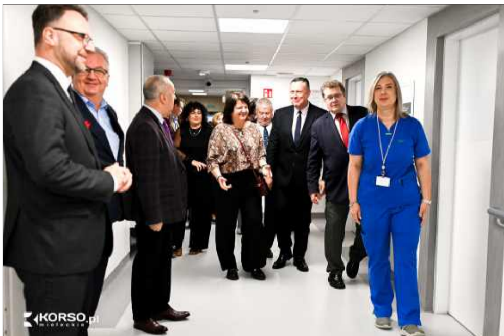
Nowoczesne sale obserwacyjne i zabiegowe zwiększają bezpieczeństwo pacjentów.