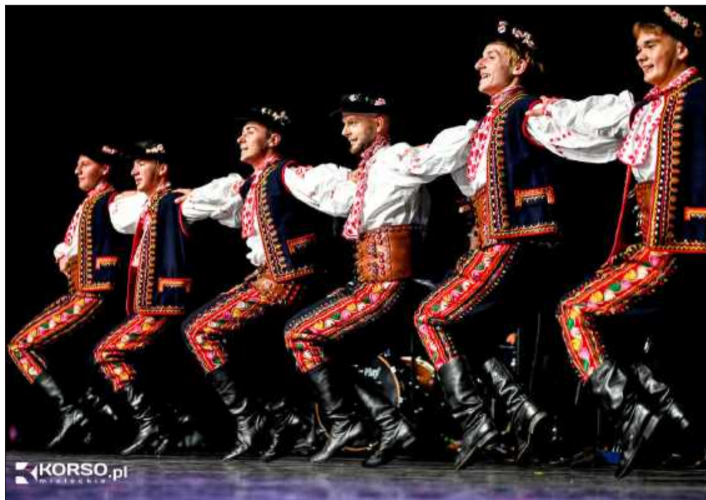
Tak wygląda polski folklor w mistrzowskim wydaniu.