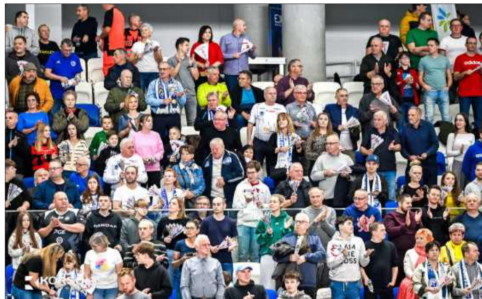
Kibice wspierają swoich zawodników, licznie pojawiając się na trybunach.