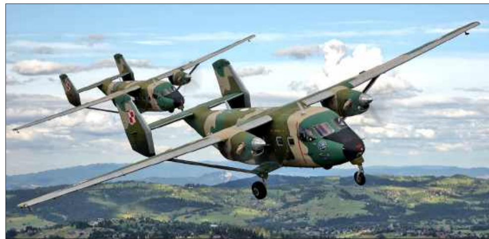
40 lat „Akcji Serce”. Cztery dekady współpracy wojska i medycyny w służbie życia.

W tym roku obchodzimy wyjątkowy jubileusz – czterdziestolecie „Akcji Serce”, dzięki której polskie siły powietrzne i medyczne łączą swoje siły, by ratować ludzkie życie. Misje transportu medycznego organów do przeszczepów są obecnie wykonywane między innymi przez wyprodukowane w PZL Mielec samoloty M28 Bryza oraz śmigłowce Black Hawk.