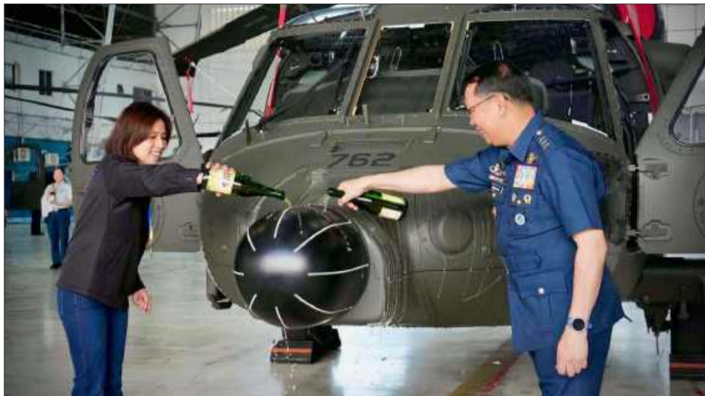
Dostawa Black Hawków to element wieloletniej współpracy PZL-u z Filipinami.

Filipińskie Siły Powietrzne (PAF) odebrały pięć kolejnych śmigłowców S-70i Black Hawk wyprodukowanych w PZL Mielec. Oficjalna uroczystość przyjęcia maszyn odbyła się 14 listopada 2025 roku w bazie Colonel Jesus Villamor Air Base w Pasay City.