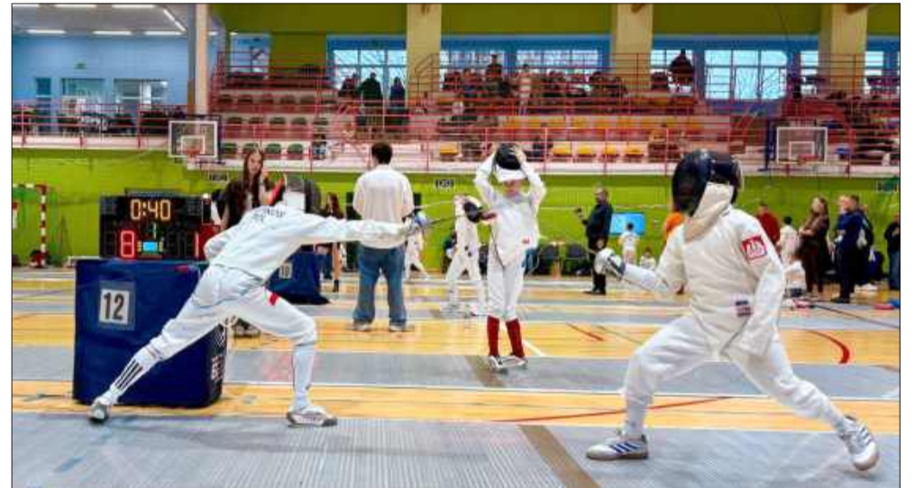
Wspólne siły pozwoliły szermierzom z Mielca, Krosna i Wadowic osiągnąć świetne wyniki w Warszawie.