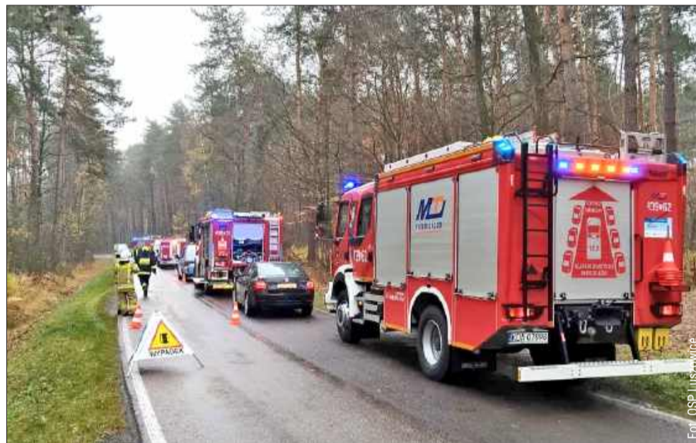
Dwa auta zderzyły się na granicy powiatów.

W niedzielny poranek (9.11) służby ratunkowe zostały zadysponowane do zdarzenia drogowego na trasie Dąbrowa Tarnowska – Radomyśl Wielki, na granicy powiatów dąbrowskiego i mieleckiego.