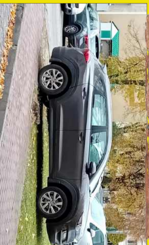
Chodnik i trawnik - dwa w jednym!