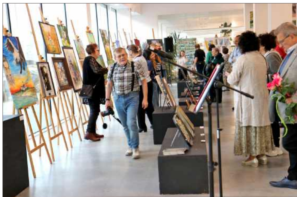
Wystawa pełna była ciekawych dzieł mieleckich twórców.