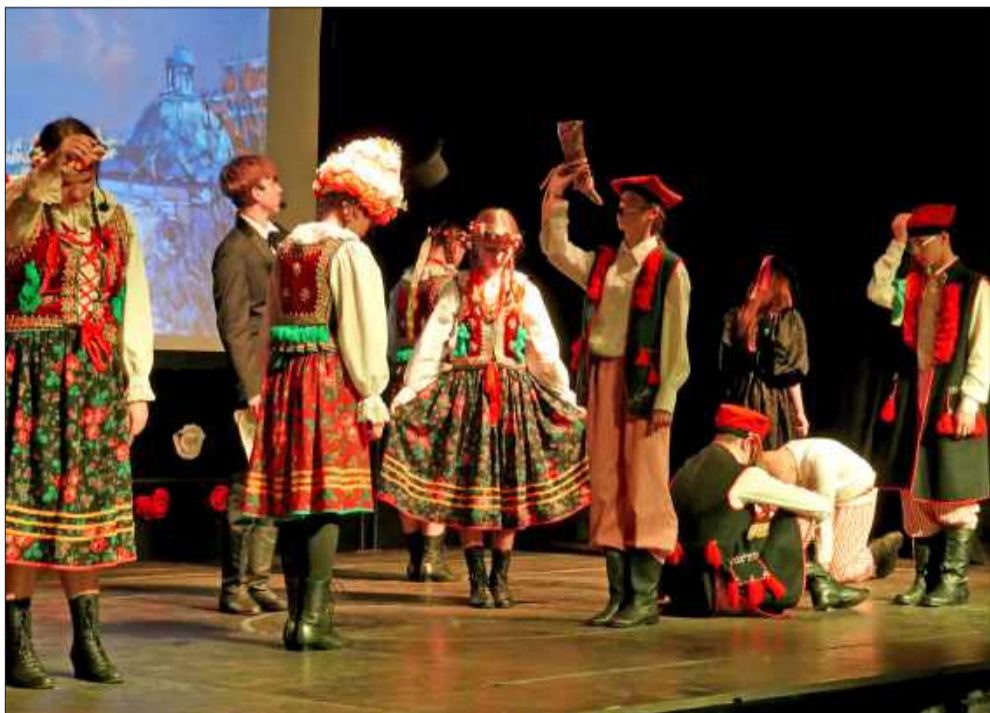
„Wesele w Bronowicach” to nie tylko udana teatralna inscenizacja, ale także żywa lekcja patriotyzmu.