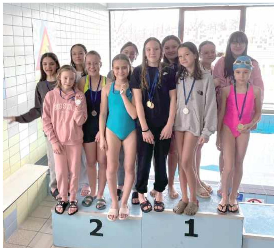
Reprezentanci powiatu garwolińskiego spisali się świetnie na zawodach w Mińsku Mazowieckim przywożąc aż 49 medali!

Młodzi adepci pływania kolejny raz udowodnili jak silny w tym sporcie jest powiat garwoliński. Z zawodów rejonowych w Mińsku Mazowieckim przywieźli aż 49 medali!