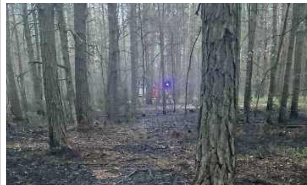
W poniedziałek, 14 kwietnia 2025 roku, tuż po godzinie 17:30, w Starym Pilczynie wybuchł pożar lasu

W poniedziałek, 14 kwietnia 2025 roku, tuż po godzinie 17:30, w Starym Pilczynie (powiat garwoliński) wybuchł pożar lasu, który wymagał natychmiastowej interwencji służb ratowniczych. Do akcji gaśniczej skierowano jednostki Ochotniczych Straży Pożarnych ze Starego Pilczyna, Melanowa oraz KSRG Łaskarzew, a także zastępy Państwowej Straży Pożarnej z Garwolina.