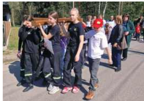
Droga Krzyżowa ulicami Woli Władysławowskiej przeszła 13 kwietnia. Krzyż nieśli rodzice, dziadkowie i dzieci (Parafia pw. Wniebowstąpienia Najświętszej Maryi Panny w Wildze)