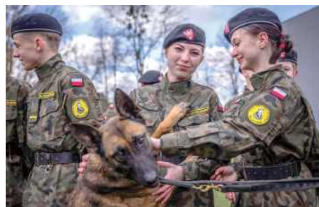
Pokaz tresury psów służbowych, które wraz z przewodnikami przyjechały z Zakładu Kynologii Policyjnej w Sułkowicach był wyjątkową atrakcją