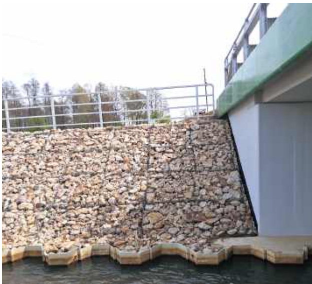
Prace rozpoczęto 15 kwietnia 2024 r., a zakończono zgodnie z planem 10 kwietnia 2025 r.

- To niezwykle osiągnięcie jest dowodem na skuteczność działań powiatu garwolińskiego w rozwoju lokalnej infrastruktury - cieszą się władze powiatu.