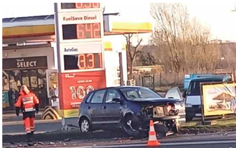
Do zdarzenia doszło w sobotę, 12 kwietnia, na ulicy Trakt Lwowski w Garwolinie