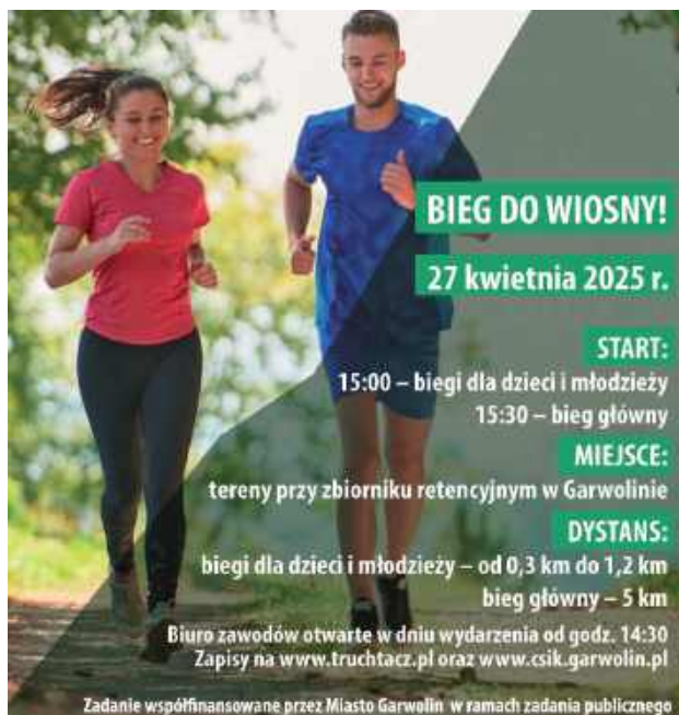
Udział we wszystkich biegach Grand Prix Ziemi Garwolińskiej pozwoli na złożenie czterech medali w jedną całość

Pierwszy w cyklu „Bieg do wiosny” odbędzie się w niedzielę 27 kwietnia na terenach przy zbiorniku retencyjnym w Garwolinie. Biegi dla dzieci rozpoczną się o godzinie 15. Dorośli wystartują o godzinie 15.30. Kolejne zawody odbędą się 11 maja, 7 września