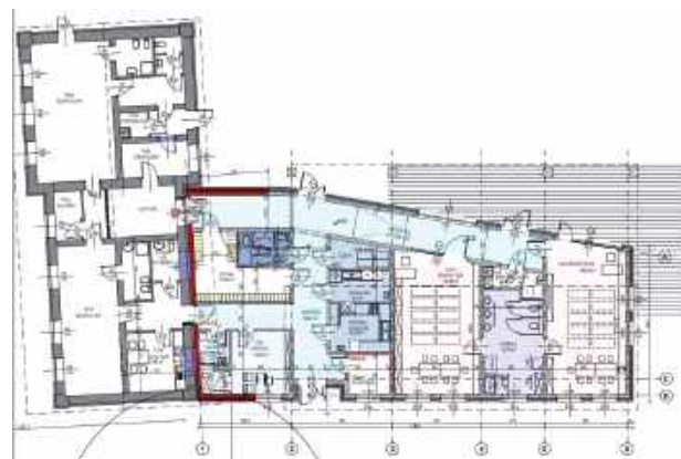
Całkowita wartość zadania wynosi 1 587 918,80 zł, z czego aż 1 415 188,80 zł pochodzi ze środków Unii Europejskiej

Całkowita wartość zadania wynosi 1 587 918,80 zł, z czego aż 1 415 188,80 zł pochodzi ze