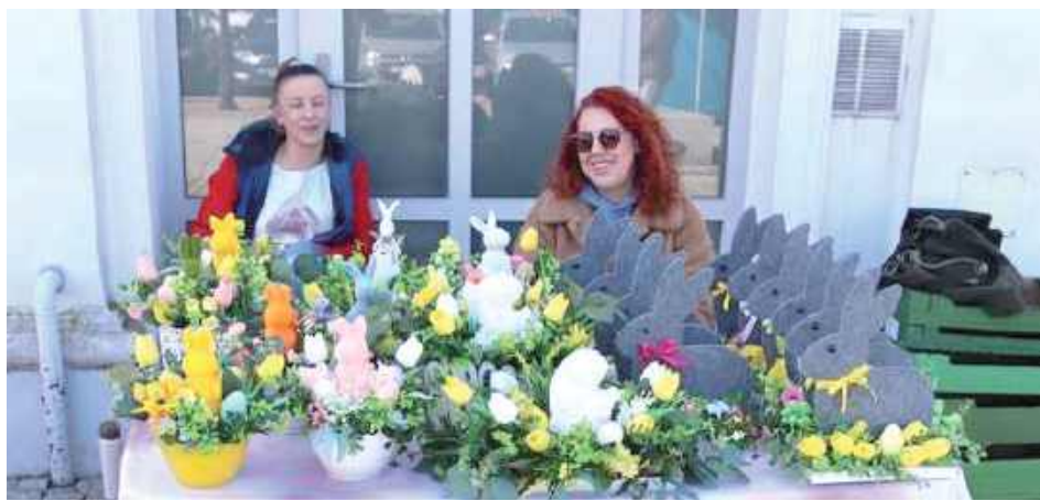
Okoliczni mieszkańcy mieli okazję nabyć własnoręcznie wykonane stroiki, palmy, pisanki i inne dzieła sztuki rękodzielniczej oraz wielkanocne wypieki