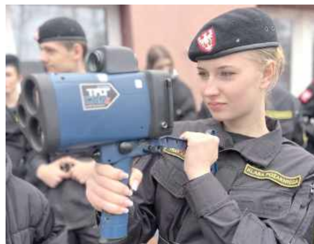
Grupa 50 uczniów miała możliwość poznania szkoły oraz sposobu szkolenia policjantów