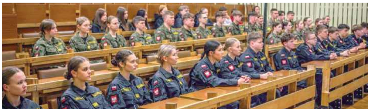
Uczniowie Liceum Ogólnokształcącego im. Joachima Lelewela w Żelechowie wraz z opiekunami odwiedzili Centrum Szkolenia Policji w Legionowie

Uczniowie Liceum Ogólnokształcącego im. Joachima Lelewela w Żelechowie wraz z opiekunami odwiedzili Centrum Szkolenia Policji w Legionowie. Grupa 50 uczniów miała możliwość poznania naszej szkoły oraz sposobu szkolenia policjantów.