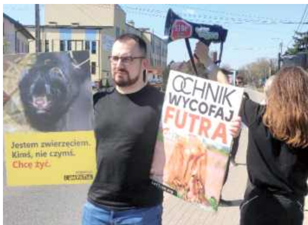
Obrońcy praw zwierząt obrali sobie za cel firmę Ochnik

Protestujący w Garwolinie, to niezależni wegańscy aktywiści