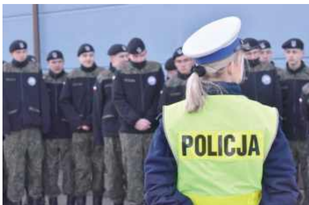
Dzień otwarty Komendy Powiatowej Policji w Garwolinie odbył się 7 kwietnia