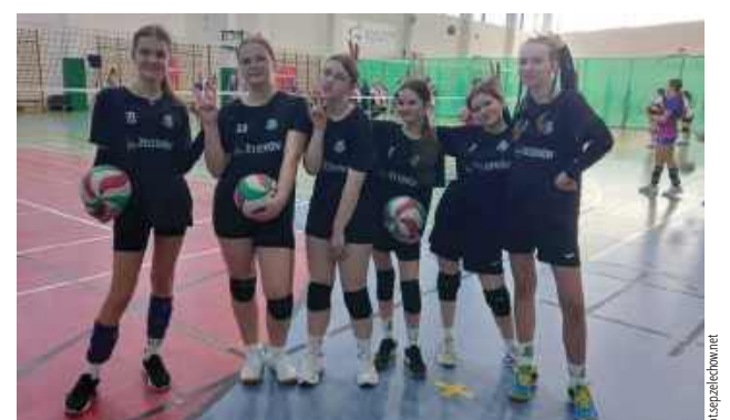
Drugi zespół Sępa w „trójkach” awansował do piątej ligi