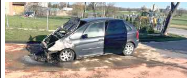
Policjanci ustalili, że podczas jazdy zapalił się pojazd marki citroen

W niedzielne popołudnie, 14 kwietnia, w miejscowości Dudki w gminie Trojanów, podczas jazdy zapaliło się auto osobowe.