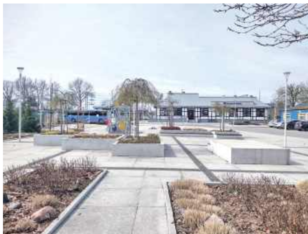
Prace budowlane II etapu polegają będą m.in. na wykonaniu nawierzchni utwardzonych

Głównym celem zadania jest zagospodarowanie terenu publicznego będącego kontynuacją zagospodarowania terenu przed Dworcem PKP w Pilawie (dz. nr.ew. 1289/166 - I etap realiza-