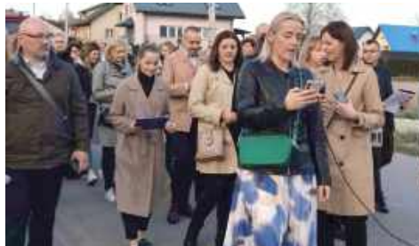
Droga Krzyżowa w Sulbinach odbyła się 13 kwietnia. Oprawę muzyczną przygotowała schola Świętego Jana Pawła II (Parafia pw. Świętego Jana Pawła II w Sulbinach)