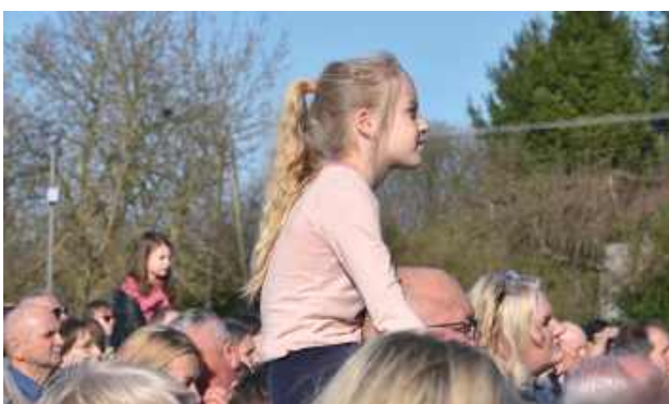
W Misterium brały udział osoby w przekroju od przedszkolaków do emerytów