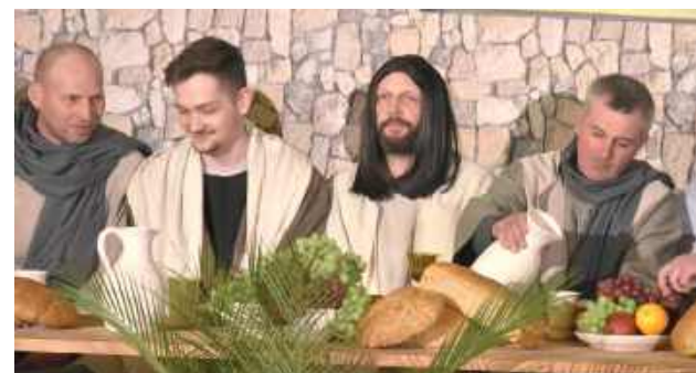
Popołudniowa część Misterium Męki Pańskiej rozpoczęła się od ostatniej wieczerzy o godzinie 15:00 w kościele parafialnym