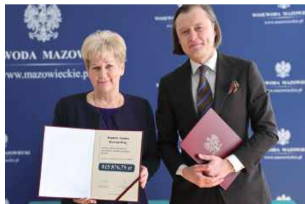
Burmistrz Albina Łubian podpisała umowę na kwotę blisko 816 tys. zł na remont drogi gminnej ul. Miodowej nr 131045W w miejscowości Pilawa

Uroczyste podpisanie umów odbyło się w Urzędzie Miasta Garwolina