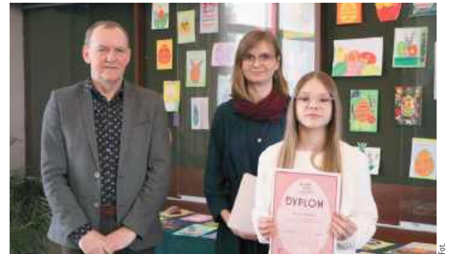
Laureaci konkursu otrzymali nagrody pieniężne oraz zaproszenia do Kina Wilga i na Pływalnię Miejską Garwolanka

Laureaci konkursu otrzymali nagrody pieniężne oraz zaproszenia do Kina Wilga i na Pływalnię Miejską Garwolanka. Centrum Sportu i Kultury gratuluje zwycięzcom oraz dziękuje nauczycielom i rodzicom za zaangażowanie.