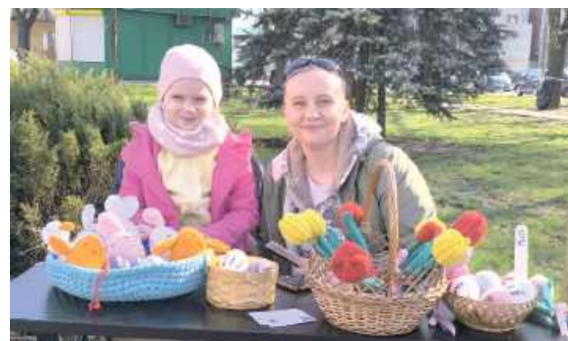
Wśród propozycji nie zabrakło rękodzieła – ozdób świątecznych, palm, stroików oraz dekoracji wielkanocnych wykonanych przez lokalnych twórców