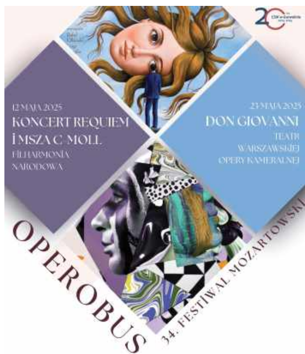
Szczegółowe informacje oraz zapisy w sekretariacie Centrum Sportu i Kultury w Garwolinie

Requiem Wolfganga Amadeusza Mozarta tradycyjnie w ścisły sposób wiąże się z biografią kompozytora. Oto Msza żałobna, którą twórca pisze na własny pogrzeb! W wyścigu z czasem – i ze śmiercią! – kompozytor przegrywa, pozostawiając dzieło nieukończone. Jego pierwszej redakcji podejmuje się uczeń