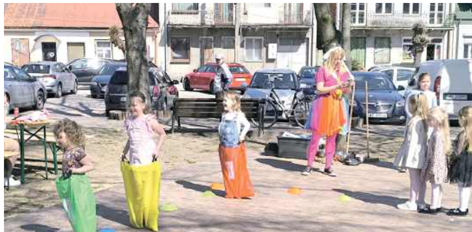
Dla najmłodszych przygotowano specjalną strefę animacji prowadzoną przez Dom Pracy Twórczej Bajka

W niedzielę, 13 kwietnia, na Rynku Dużym w Łaskarzewie odbył się Jarmark Wielkanocny. Wydarzenie zgromadziło wielu mieszkańców i odwiedzających, oferując szeroki wybór potraw, wypieków oraz wyrobów rękodzielniczych.