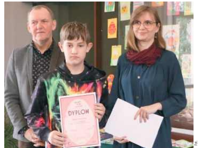
Przy ocenie prac liczy się nie tylko estetyka i pomysłowość, ale także użycie właściwych materiałów oraz samodzielność