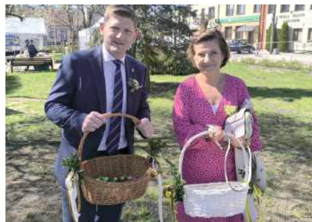
Wydarzenie zgromadziło wielu mieszkańców i odwiedzających, oferując szeroki wybór potraw, wypieków oraz wyrobów rękodzielniczych