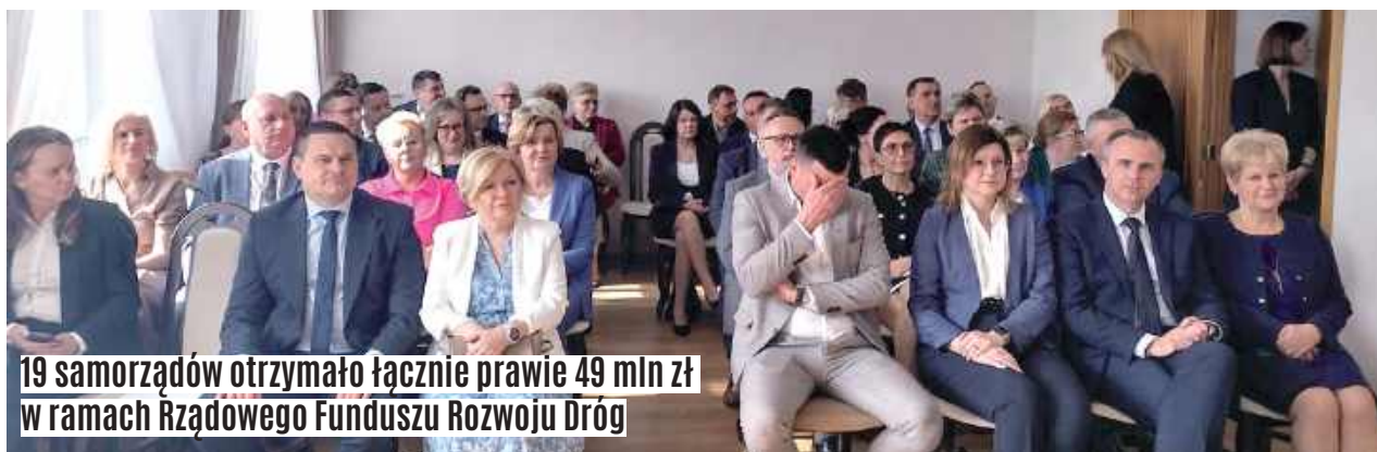
19 samorządów otrzymało łącznie prawie 49 mln zł w ramach Rządowego Funduszu Rozwoju Dróg