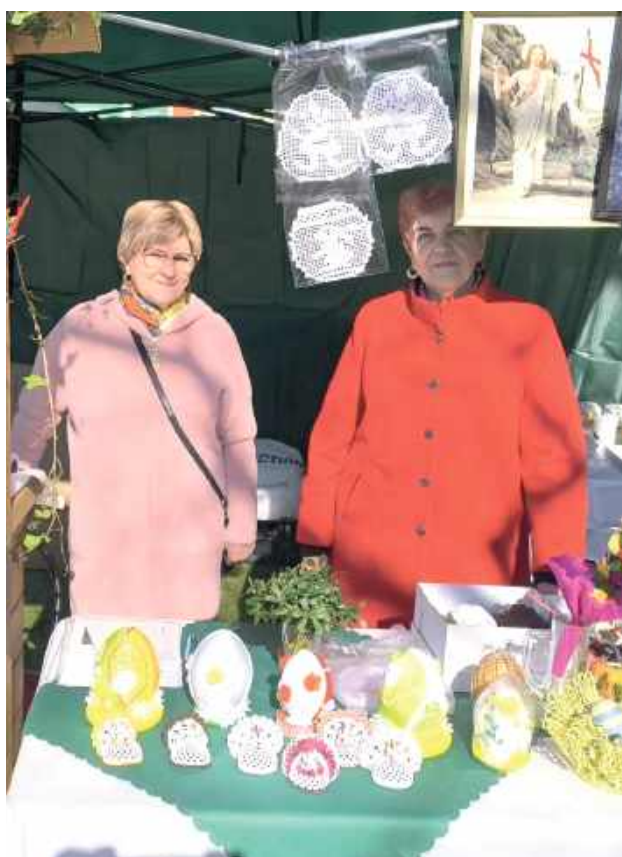
Wśród propozycji nie zabrakło również rękodzieła – ozdób świątecznych, palm, stroików oraz dekoracji wielkanocnych wykonanych przez lokalnych twórców

Jarmark Wielkanocny był okazją do przedświątecznych zakupów, wspólnego spędzenia czasu, integracji mieszkańców oraz pielęgnowania lokalnych tradycji wielkanocnych.