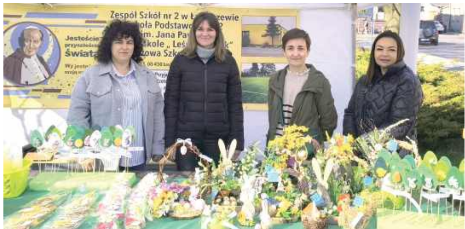
Jarmark Wielkanocny był okazją do przedświątecznych zakupów, wspólnego spędzenia czasu i integracji mieszkańców