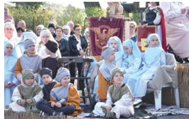
W Misterium uczestniczyły m.in. dzieci z Przedszkola „Mały Miś” w Kozicach oraz uczniowie ze szkoły w Kaleniu Drugim