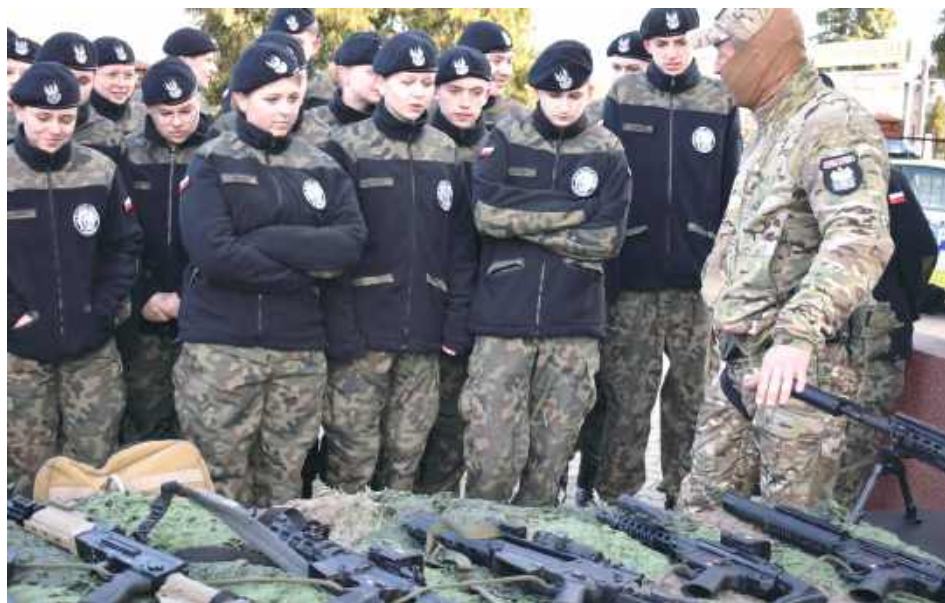
Uczniowie z lokalnych szkół mieli okazję z bliska przyjrzeć się pracy funkcjonariuszy różnych pionów – od kontrterrorystów, przez prewencję, po policyjnych techników kryminalistyki

Emocje, ciekawostki, widowiskowe pokazy i solidna dawka policyjnej wiedzy – tak wyglądał dzień otwarty Komendy Powiatowej Policji w Garwolinie, który odbył się 7 kwietnia. Uczniowie z lokalnych szkół mieli okazję z bliska przyjrzeć