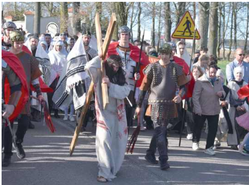
Jezus dźwigający krzyż na Golgotę. Miejsce ukrzyżowania usytuowano na świątynnym wzgórzu