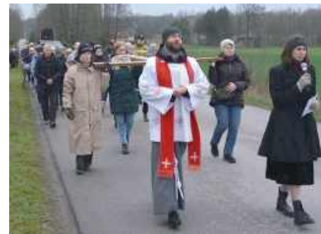
Droga Krzyżowa ulicami Miętne wyszła z kościoła parafialnego pw. Podwyższenia Krzyża Świętego w Miętne 11 kwietnia (Parafia Podwyższenia Krzyża Świętego w Miętne)