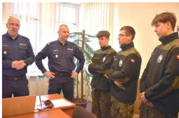
Policjanci z pasją opowiadali o swojej służbie, podkreślając, że to zawód, który często pozwala połączyć zainteresowania z pracą