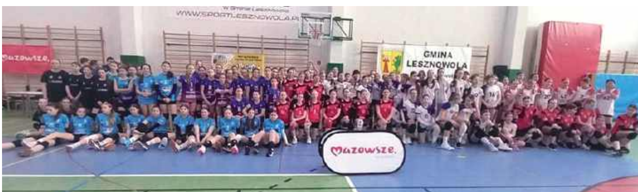
Turniej w Mysiadle zgromadził wiele zespołów, zawodniczki Sępa wystawiły jeden zespół w „czwórkach” i dwa w „trójkach”

Zawodniczki Sępa Żelechów rywalizowały na Mistrzostwach Mazowsza w Mysiadle w kategoriach „trójek” i „czwórek”. Jak im poszło?