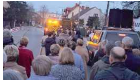
Wierni z parafii pw. Przemienienia Pańskiego w Garwolinie wyruszyli na Drogę Krzyżową ulicami naszego powiatowego miasta 13 kwietnia o godzinie 19