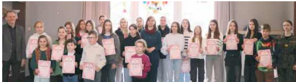
Wielkanocny konkurs plastyczny to okazja nie tylko do wzmoczonej kreatywności, rozwijania plastycznych umiejętności, ale także do sięgania po tradycję

Uczniowie szkół z całego powiatu wzięli udział w jubileuszowym XXV Wielkanocnym Konkursie Plastycznym. Jury oceniało prace w czterech kategoriach: kartki, wydmuszki, pająki i mazurki. Znamy już tegorocznych laureatów!