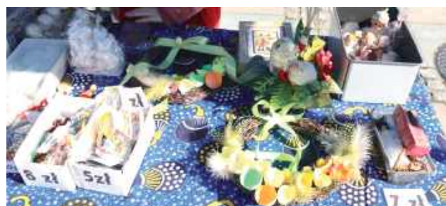
Stoiska prezentowały się pięknie