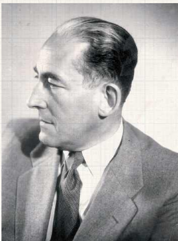
Jan Brzechwa zaliczany jest do grona najpopularniejszych polskich autorów bajek i wierszy dla najmłodszych i nieco starszych. W jednym ze swoich utworów ukazał Żelechów jako miasto słynące z dziadków do orzechów

Poeta pisał teksty satyryczne, piosenki i skecze. W 1926 roku światło dzienne ujrzał jego tom poezji „Oblicza zmyślone”. W roku 1938 ukazał się pierwszy tomik wierszy Brzechwy dla dzieci pt. „Tańcowała igła z nitką”. Zawierał on utwory znane i lubiane przez całe pokolenia polskich dzieci, takie jak: „Na straganie”, „Pomidor” czy „Żuraw i czapla”. W 1939 roku poeta wydał tom wierszy dla miłośników pt. „Kaczka Dziwaczka”.