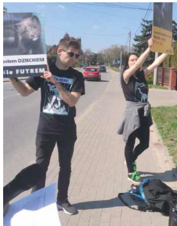
W poniedziałek, 14 kwietnia, odbył się kolejny protest aktywistów działających na rzecz ochrony praw zwierząt