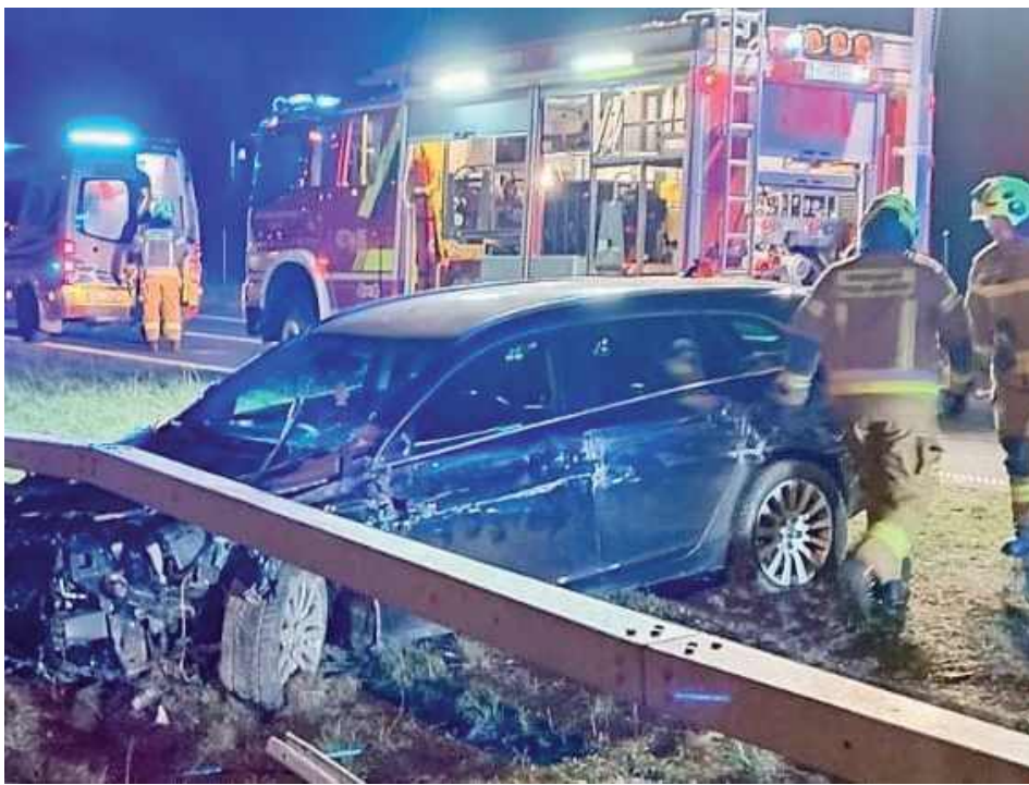
Do wypadku doszło w Woli Koryckiej Górnej, na pasie w kierunku Warszawy