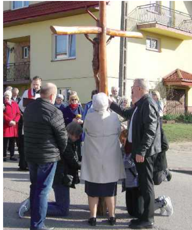
Droga Krzyżowa ulicami Żelechowa przeszła 13 kwietnia. Na modlitwie zgromadzili się młodzi i starsi (Parafia pw. Zwiastowania Najświętszej Maryi Panny w Żelechowie)