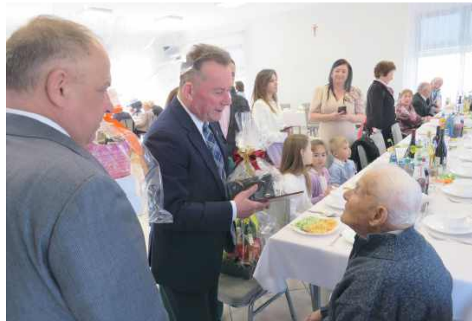
Od 1990 roku jest na emeryturze. Jego hobby to czytanie prasy i książek

Wójt złożył Jubilatowi najserdeczniejsze życzenia oraz wręczył list gratulacyjny i upo-