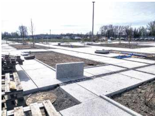
Teren przed dworcem PKP w Pilawie

Trwa rewitalizacja terenu przy dworcu PKP w Pilawie. Czego mogą się spodziewać mieszkańcy na rewitalizowanym placu miejskim?