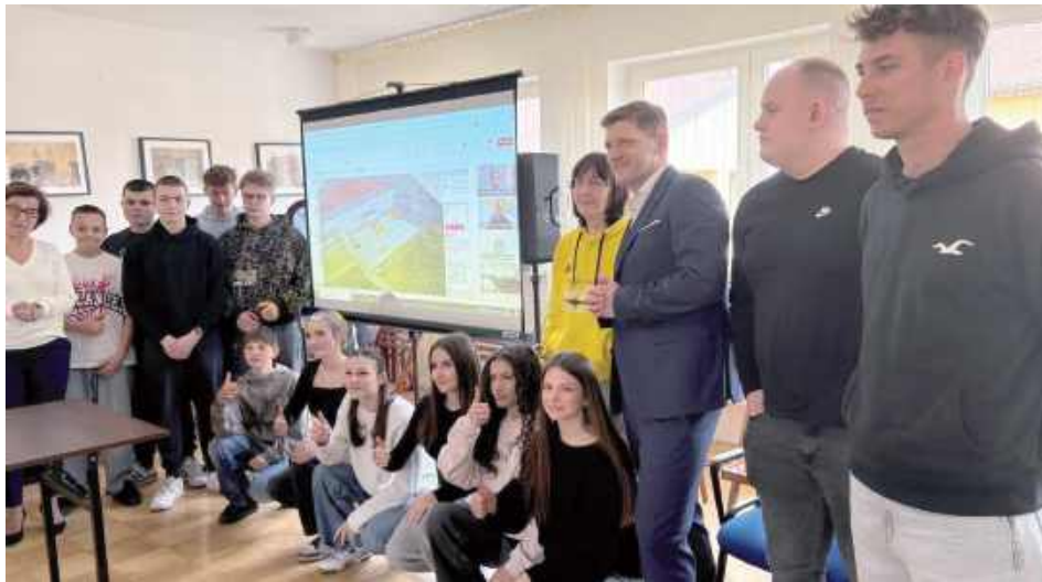
Projektowana lokalizacja skateparku została przewidziana w bezpośrednim sąsiedztwie nowo powstającej hali sportowej

skateparku stanowi przestrzeń płyty o wymiarach 27x15 mb. Jest to forma klasycznego skateparku czyli rozpęd-nawrotka