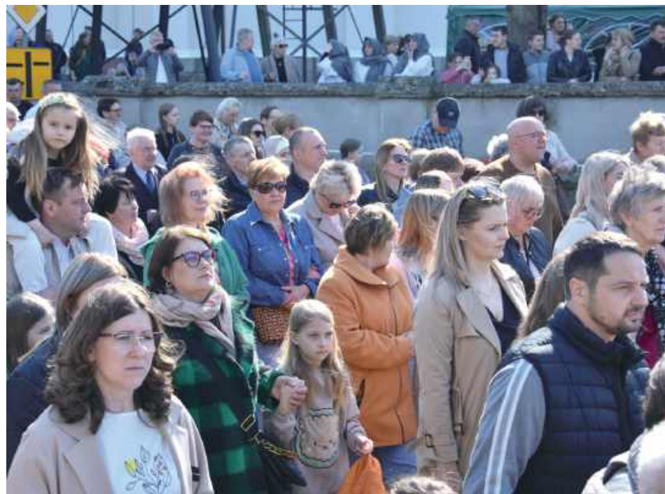
Wydarzenie zgromadziło tłumy osób. Byli wśród nich parafianie i przybyli goście nawet z odległych miejscowości

W Niedzielę Palmową w Korytnicy Łaskarzewskiej po raz czwarty zostało wystawione Misterium Męki Pańskiej. Wydarzenie zorganizowane przez parafię Świętego Bartłomieja Apostoła oraz Parafialne Muzeum Ziemi Trojanowskiej zgromadziło około 250 uczestników, w tym blisko 160 aktorów-amatorów, którzy z zaangażowaniem odtworzyli ostatnie dni życia Jezusa Chrystusa.