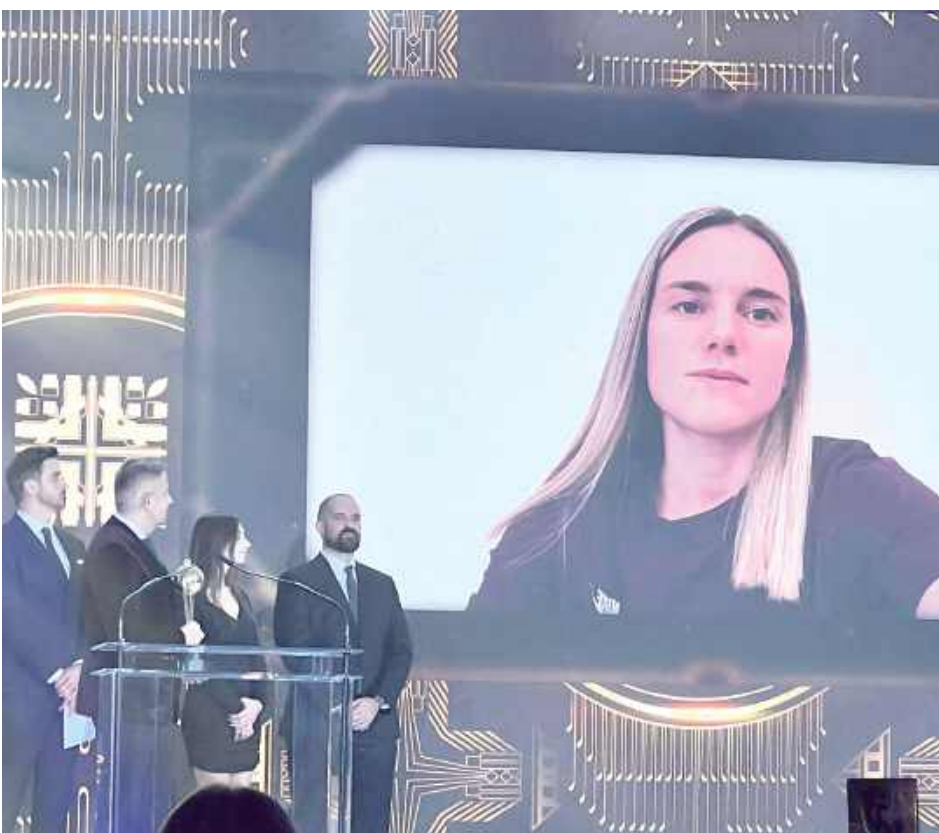
Zawodniczka w nagraniu do uczestników gali