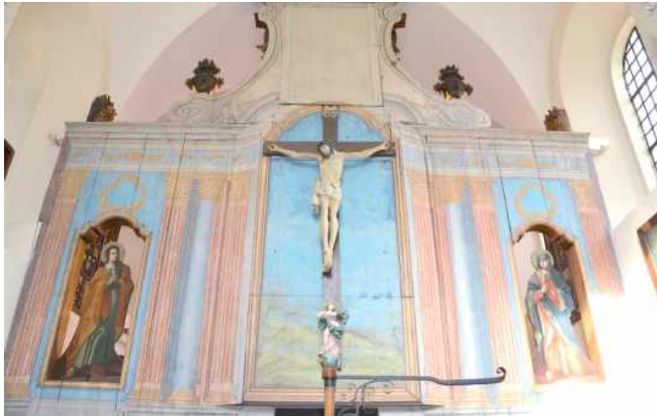
Widok odwrocia ołtarza głównego od strony chóru zakonnego po zakończeniu prac konserwatorskich przy bocznych obrazach

- Dolne partie zostały zalane wodą z nieszczelnego dachu, płótno było podarte i pofalowane, a warstwa malarska silnie osłabiona