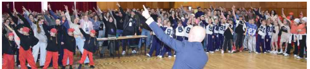
W drugiej edycji wydarzenia udział wzięło blisko 700 uczestników z całego województwa lubelskiego

Na scenie dominowały emocje – od skupienia najmłod-