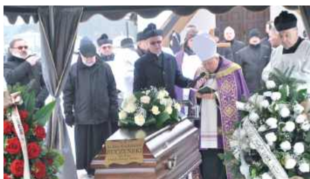
Po nabożeństwie ciało zmarłego kapłana spoczęło - zgodnie z jego wolą - na cmentarzu parafialnym wśród wiernych, którym przez lata służył

Zapisał się w pamięci parafian jako kapłan spokojny, sumienny i oddany wiernym, towarzyszący mieszkańcom w najważniejszych momen-