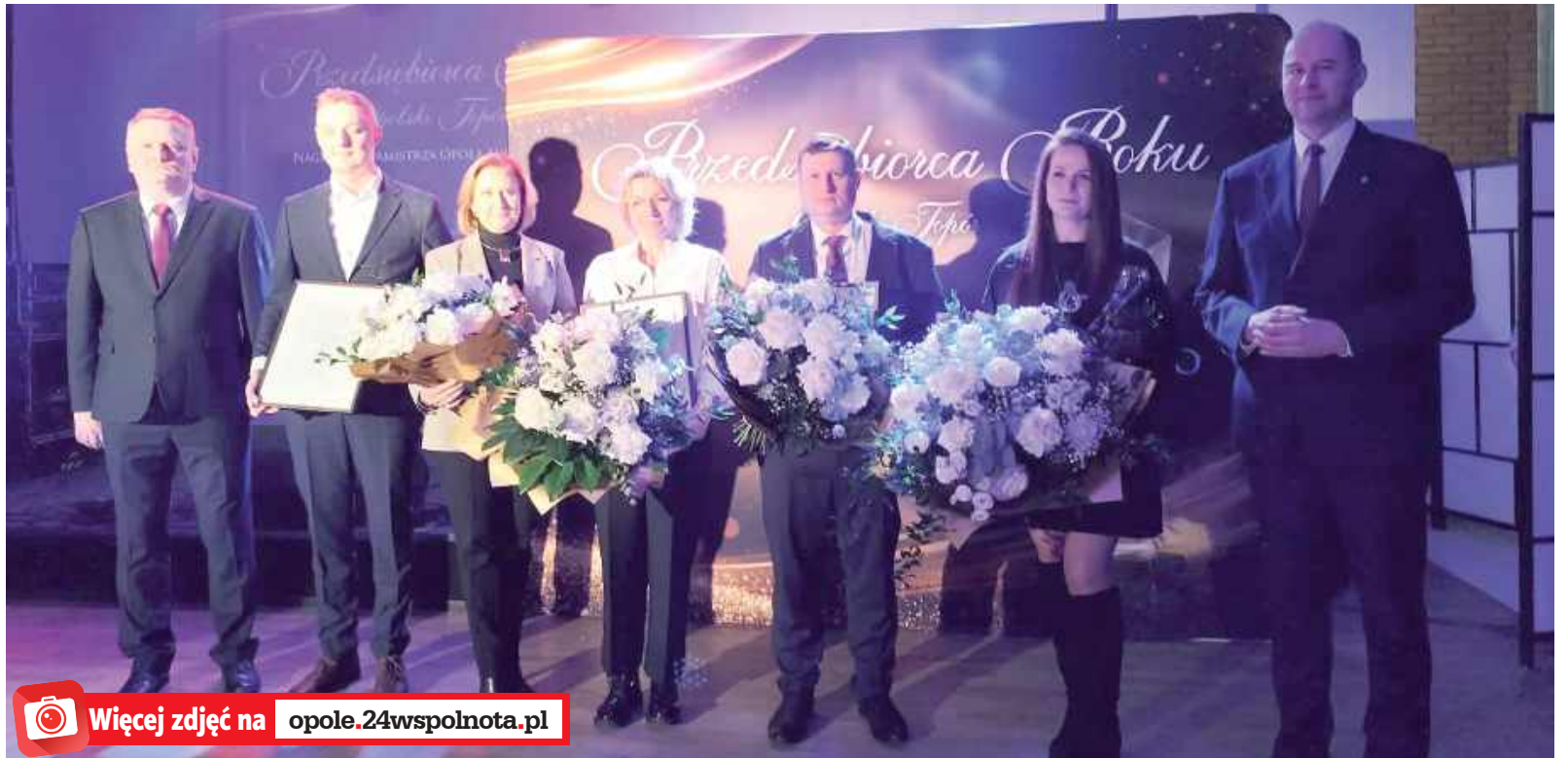
Nagroda przyznawana jest od 2009 roku i przez lata trafiła do wielu znanych firm działających w gminie. Jak podkreślali organizatorzy, jej ideą pozostaje docenienie tych, którzy łączą sukces gospodarczy z troską o dobro wspólne

- Historycznie patrząc, Opole Lubelskie jako miasto już istniejące ponad 600 lat temu, w XV wieku, na pewno mogło się poszczycić tym, że było tym głównym szlakiem handlowym i kupieckim. I tak naprawdę na tych korzeniach, na tych podwalinach to miasto, ta nasza społeczność lokalna wyrosła. Kontynuujemy tę spuściznę naszych przodków i chcemy podkreślić, że stąd się wywodzimy, że tu mamy wspaniałych przedsiębiorców i wspaniałych rzemieślników. W Opolu Lubelskim powstała pierwsza szkoła rzemieślnicza w Polsce, więc to też jest nasze zobowiązanie, to jest nasza historia i nasza duma. Ja jestem kontynuatorem tego dzieła, które zostało zapoczątkowane w 2009 roku i myślę, że to jest dobry kierunek, aby zaznaczyć waszą wagę i wasz roz-