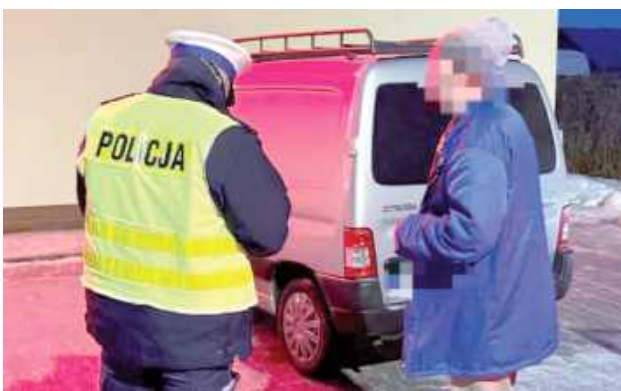
Nietrzeźwy kierowca stanowi zagrożenie dla wszystkich uczestników ruchu drogowego

Podczas całodiennej akcji funkcjonariusze sprawdzili stan trzeźwości ponad 1100 kierow-