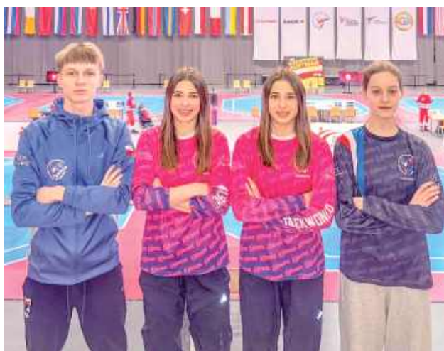
W Austrii wzięli udział przedstawiciele ULKS-u Andros Puławy, którzy pokazali się z bardzo dobrej strony na międzynarodowej arenie

W dniach 6 - 8 lutego w Austrii odbył się prestiżowy turniej Austrian Open 2026, zaliczany do cyklu Pucharu Świata w taekwondo olimpijskim rangi G-1. W zawodach wzięli udział przedstawiciele ULKS-u Andros Puławy, którzy pokazali się z bardzo dobrej strony na międzynarodowej arenie.