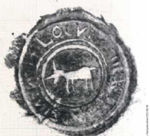
Pieczęć Radzyna z XVIII wieku