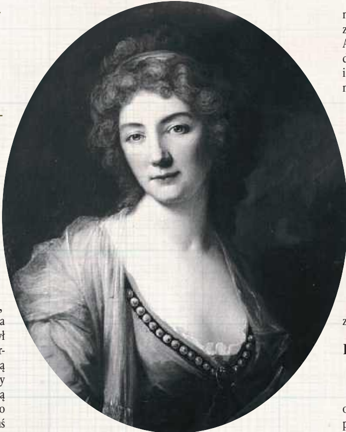
Portret Maryni Czartoryskiej (Marii Wirtemberskiej) pędzla Lampiego

Józef II-gi, będąc w Lwowie, parokrotnie rzekł publicznie do