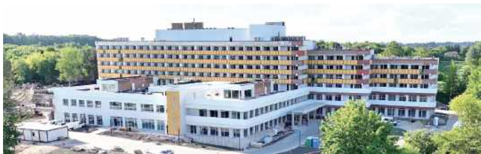
Przez lata obiekt przy ul. Spółdzielczej w Nałęczowie niszczał i straszyl swoim wyglądem. w 2028 r kupiła je grupa Arche i przebudowała na największy na Lubelszczyźnie hotel, który otwarto dla gości w połowie 2024 r.