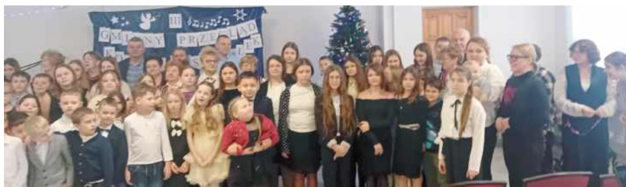
Na scenie zaprezentowało się ponad 90 wykonawców - dzieci, młodzież i dorośli z terenu gminy Wilków

W piątek, 30 stycznia w Świetlicy Wiejskiej w Rogowie odbył się III Gminny Przegląd Koled i Pastorałek. Była to druga edycja wydarzenia organizowana właśnie w tej miejscowości. Na scenie zaprezentowało