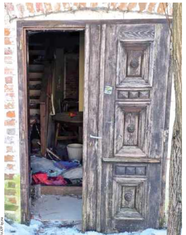
Ze względu na panujące warunki atmosferyczne mężczyzna został przewieziony do łęczyńskiej komendy

- W budynku bez okien i drzwi odnaleźli 19-latkę. Okazało się, że jest w kryzysie bezdomności. Przebywanie w takim miejscu stanowiło dla niego realne zagrożenie dla życia i zdrowia. Ze względu na panujące warunki atmosferyczne mężczyzna został przewieziony do łęczyńskiej komendy. Policjan-