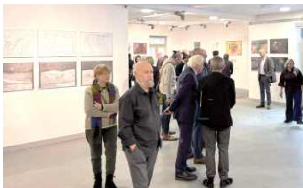
Wystawa będzie dostępna do 8 marca