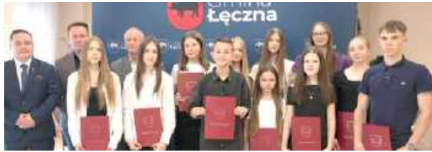
Wśród tegorocznych laureatów znaleźli się przedstawiciele sportów walki, piłki nożnej oraz badmintona