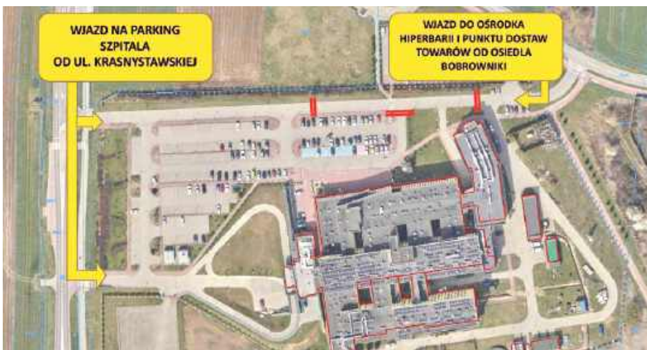
Schemat organizacji ruchu na najbliższe cztery tygodnie

Teren wokół szpitala powiatowego zmienia się w plac budowy, co wymusi poważne utrudnienia komunikacyjne dla pacjentów oraz odwiedzających. W związku z trwającymi oraz nowo rozpoczynającymi się inwestycjami, od poniedziałku 29 czerwca wprowadzona zostanie tymczasowa organizacja ruchu. Kierowcy muszą przygotować się na zamknięcie dotychczasowego wjazdu na główny parking od strony Osiedla Bobrowniki oraz zmianę dróg dojazdowych do poszczególnych obiektów medycznych. Nowe wytyczne będą obowiązywały przez cztery tygodnie, do 27 lipca. Od przyszłego tygodnia dostać się na miejsca postojowe będzie można wyłącznie od strony ulicy Krasnystawskiej. Z kolei dojazd do ośrodka hiperbarii oraz punktu dostaw towarów będzie wydzi-