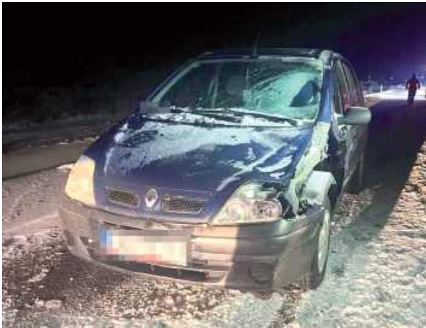
Do tragicznego wypadku doszło 8 stycznia. Zginął 52-letni mężczyzna

Do tragedii doszło 8 stycznia w pobliżu Niedźwiady. - Kierujący samochodem osobowym marki Volkswagen, podczas jazdy źle się poczuł, zatrzymał pojazd i wyszedł na jezdnię. W tym samym momencie został potrącony przez nadjeżdżający z naprzeciwka samochód marki Renault, którym kierował 48-letni mężczyzna - informuje podkomisarz Jagoda Maj z KPP w Lubartowie.