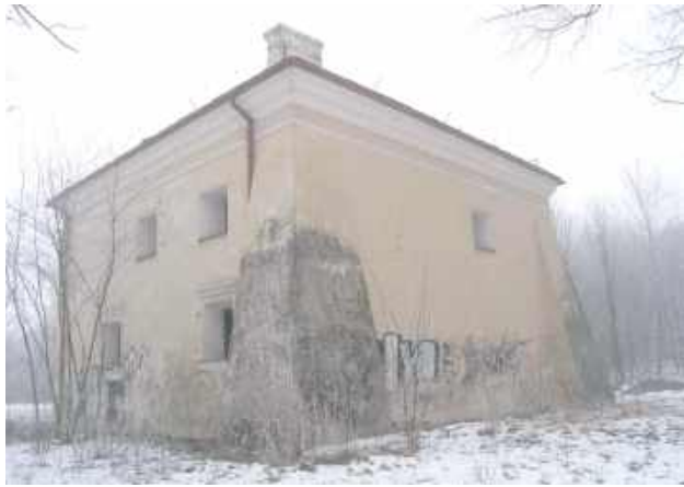
Lamus na początku drogi wiele lat temu

W Zawieprzycach w gminie Spiczyn sfinalizowano kompleksowe prace remontowe i adaptacyjne przy budynku dawnego lamusa, stanowiącego istotny element miejscowego zespołu pałacowo-parkowego. Obiekt, wpisany do rejestru zabytków województwa lubelskiego, pomyślnie przeszedł procedurę odbioru konserwatorskiego. Przeprowadzone działania miały na celu nie tylko zabezpieczenie konstrukcji, ale przede wszystkim przywrócenie historycznej estetyki elewacji i wnętrza przy maksymalnym poszanowaniu oryginalnej substancji architektonicznej.