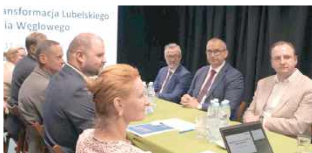
Samorządowcy i eksperci szukają alternatyw dla Bogdanki

Transformacja energetyczna regionów górniczych to jeden z najbardziej skomplikowanych procesów społeczno-gospodarczych, przed jakimi stają współczesne samorządy. Nagłe wygaszanie przemysłu ciężkiego bez wcześnie-