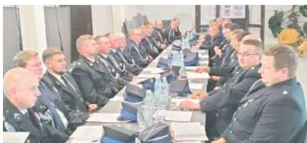
Prezydium Zarządu Gminnego Związku Ochotniczych Straży

W Spiczynie zorganizowano Zjazd Gminny Ochotniczych Straży Pożarnych. Głównym punktem obrad było podsumowanie dotychczasowej działalności oraz wybór nowych władz, które będą kierować strukturami pożarniczymi w najbliższych latach.