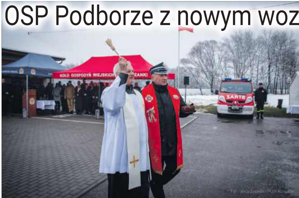
Poświęcenie nowego samochodu.