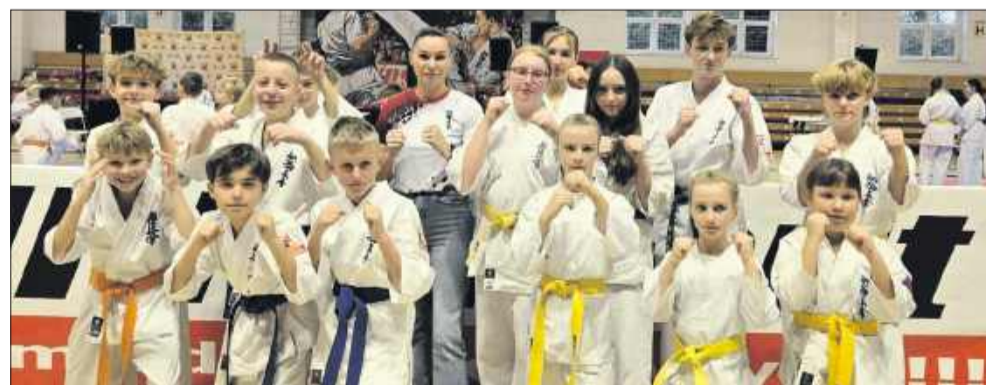
Mielecka drużyna z imponującym dorobkiem 11 medali.

W Łąncucie odbył się turniej o nazwie „Łącut Open”, w którym wystartowało 327 zawodników z 29 klubów z całej Polski. Reprezentanci mieleckiego klubu Kyokushin Karate zdobyli na zawodach łącznie 11 medali, w tym 1 złoty, 2 srebrne i 8 brązowych.