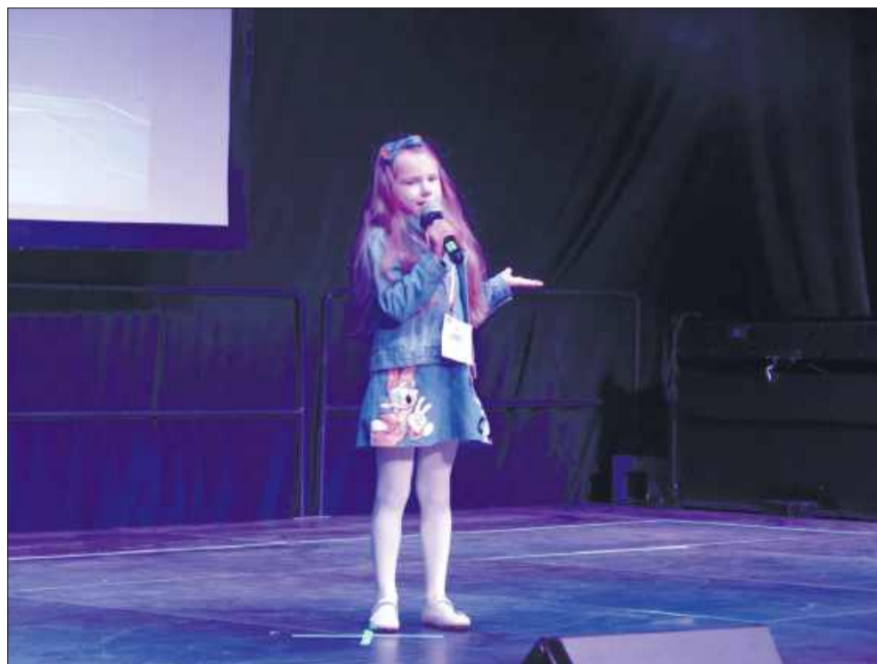
Uczestnicy czuli się jak prawdziwe gwiazdy – o to właśnie chodziło.