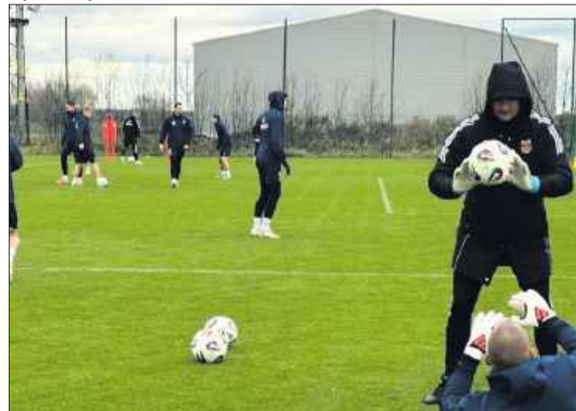
Boisko w Tuszowie stało się miejscem przygotowań wielu znanych klubów.

Lublin. W ostatnich dniach swoje treningi w Tuszowie Narodowym odbyła również Ekstraklasa