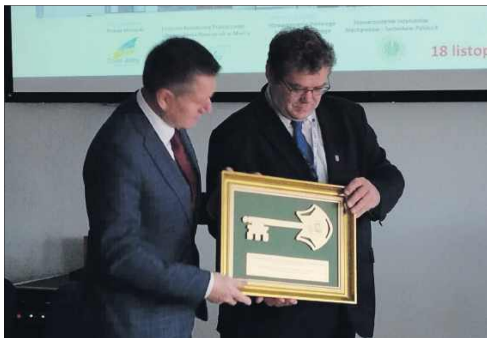
Symboliczne przekazanie klucza do nowego BCU