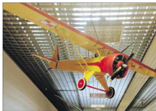
Mielec stawia na kompetencje lotnicze.

Osoba dorosła w wieku 24-64 lata, która jest aktywna zawodowo w branży lotniczej i chce podnieść swoje kwalifikacje, pracuje w innym zawodzie, ale planuje przekwalifikowanie na przemysł lotniczy, lub jest bez pracy i pragnie zdobyć nowe umiejętności w tej dziedzinie, może skorzystać z oferowanych możliwości rozwoju zawodowego w przemyśle lotniczym.