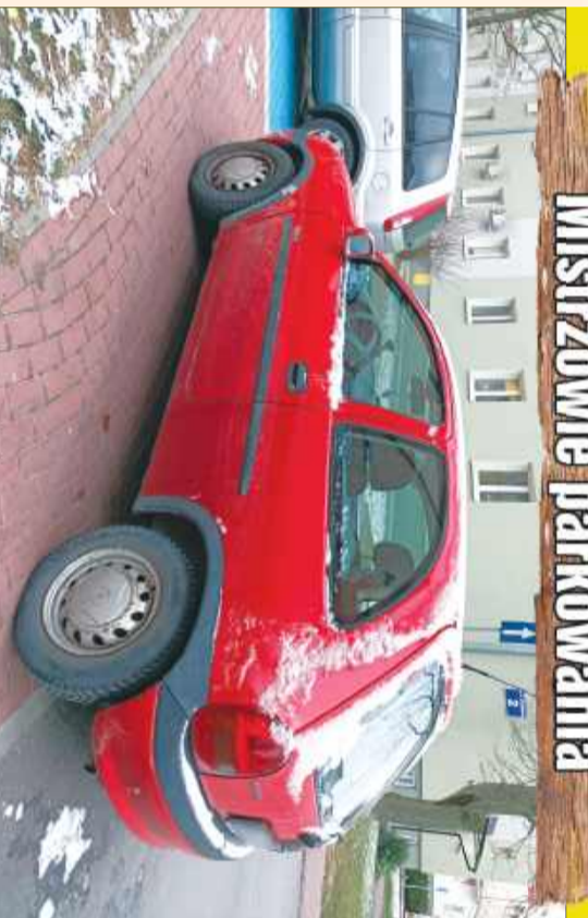
Mistrz parkowania w swoim żywiole.