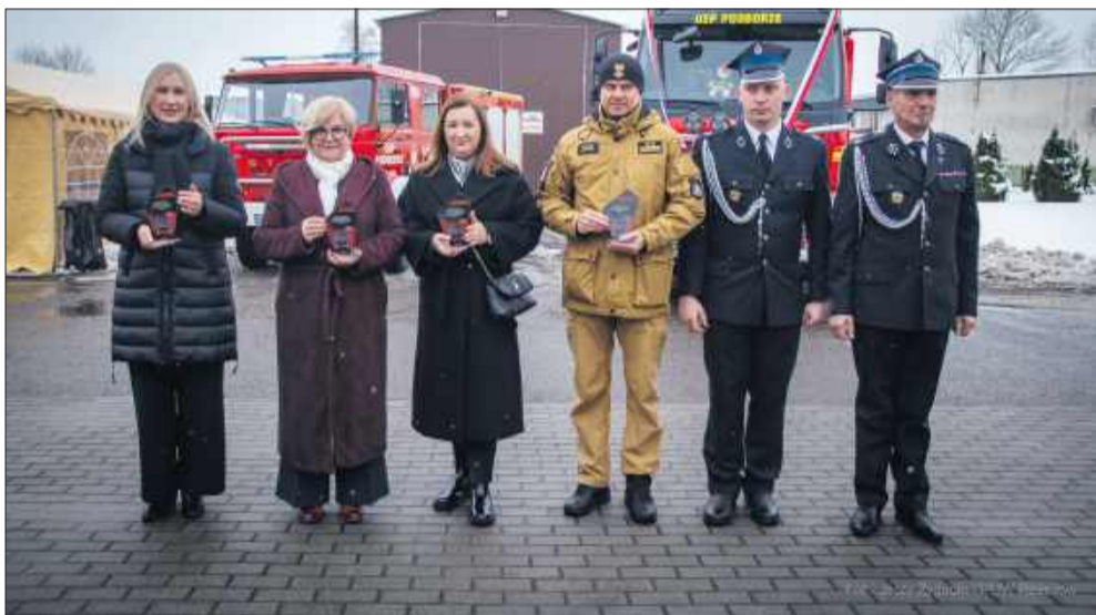
Strażacy, samorządowcy i goście podczas przekazania nowego auta.

Do Ochotniczej Straży Pożarnej w Podborzu trafił nowoczesny, średni samochód ratowniczo-gaśniczy. To ważny dzień dla jednostki, która dzięki nowemu pojazdowi znacząco zwiększy swoje możliwości podczas akcji ratowniczych i zabezpieczania terenu gminy.