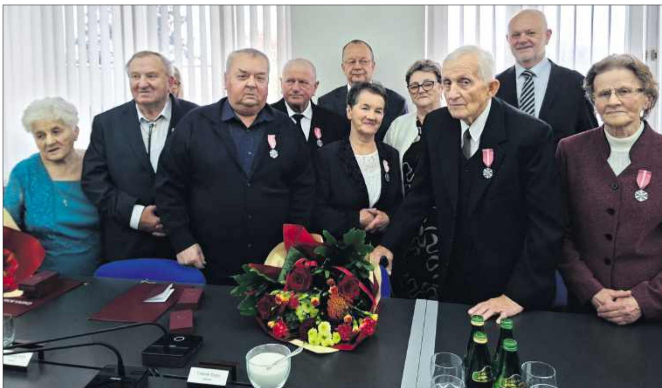
Święto długoletnich małżeństw. Wójt wręczył medale parom z gminy Borowa.