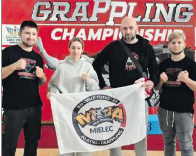
Dwa złote i trzy brązowe medale mieleckiej ekipy.

garii i Rosji. Klub Iron Dragon MMA oraz kadre PFCJJ reprezentowało trzech sportowców, startujących w formułach Gi i No Gi. Zawodnicy łącznie zdobyli pięć medali.