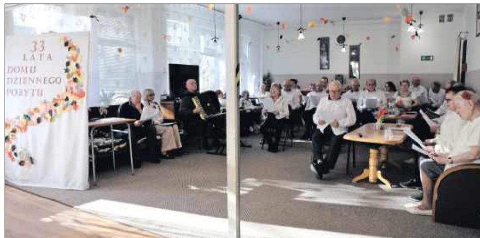
Obchody 33-lecia DDP

Za codzienną atmosferą życzliwości stoi zespół pracowników, którzy wykonują swoją misję bez rozgłosu, lecz z ogromnym zaangażowaniem. Ich wsparcie, rozmowa i uważność na potrzeby seniorów tworzą fundament