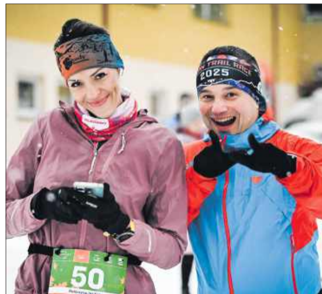
Piękna pogoda i piękne uśmiechy

Mimo zimowej aury biegacze nie mieli powodów do narzekania. Delikatny mróz i lekko ośnieżone leśne ścieżki stworzyły wyjątkowy, niemal bajko-