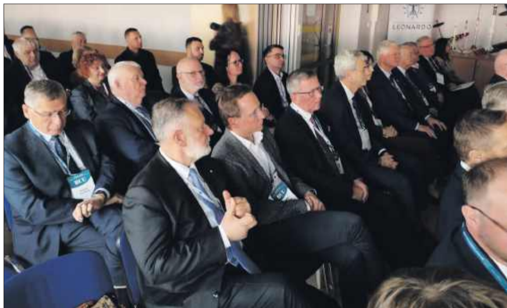
Goście podczas otwarcia Branżowego Centrum Umiejętności.

- Kurs wytwarzania kompozytowych elementów konstrukcji samolotu (16 h)