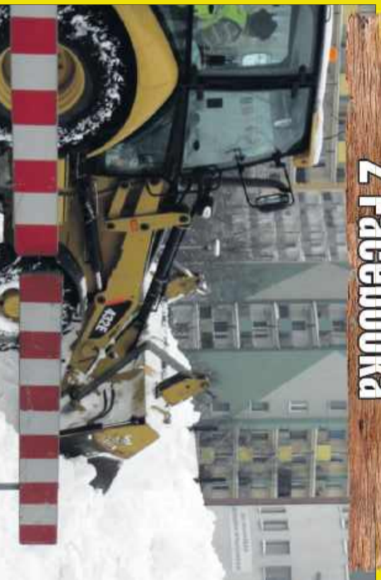
Tak kiedyś wyglądały w Mielcu zimy... Czy to się jeszcze powtórzy?