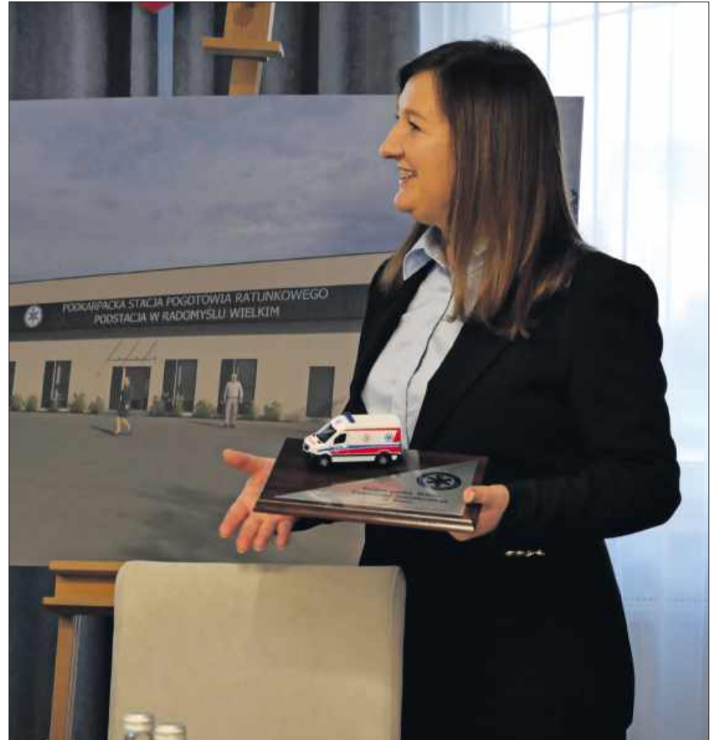
Symboliczny model karetki wręczony burmistrz Radomyśla Wielkiego.

„To przedsięwzięcie bezcenne, bo dotyczy zdrowia i życia ludzi. Cieszę się, że ratownicy będą mieli lepsze warunki, a mieszkańcy – szybszą pomoc. Dziękuję poprzednim władzom, radnym gminnym i powiatowym za wsparcie” – mówiła.