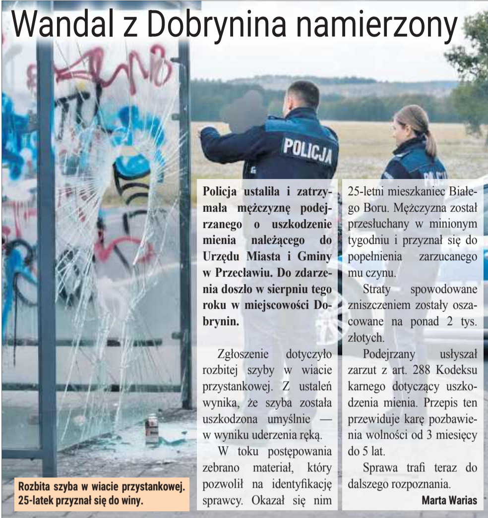
Rozbita szyba w wiacie przystankowej. 25-latek przyznał się do winy.

Policja ustaliła i zatrzymała mężczyznę podejrzanego o uszkodzenie mienia należącego do Urzędu Miasta i Gminy w Przecławiu. Do zdarzenia doszło w sierpniu tego roku w miejscowości Dobrynia.