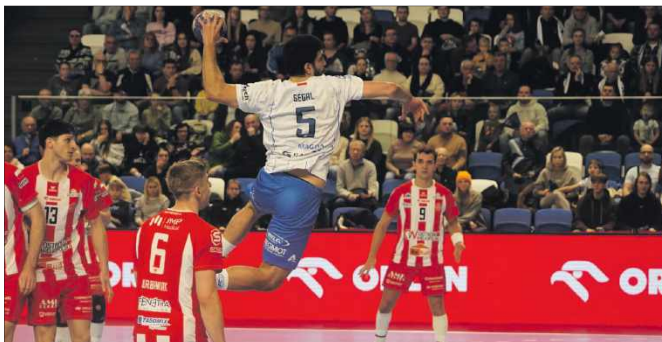
Szczypiorniści Handball Stali Mielec rozegrali tylko jedną dobrą połowę