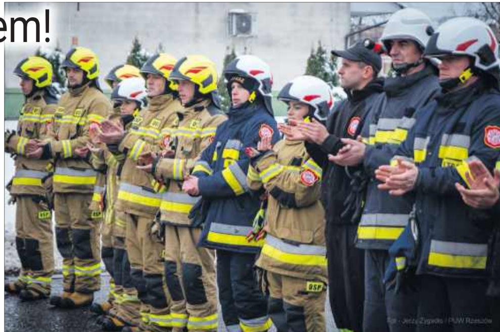
Uroczyste przekazanie pojazdu – mimo zimna frekwencja dopisała.