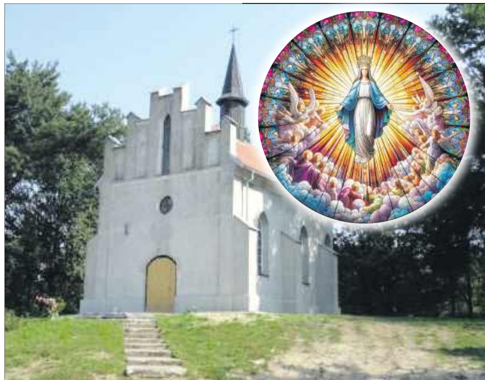
„Kościółek” pod wezwaniem Przemienienia Pańskiego w Radomyślu Wielkim. To równocześnie z jego budową rozwijał się kult Maryi.

„Niektórzy pytają: dlaczego właśnie Matka Boża ma być właśnie patronką gminy Radomyśl Wielki. Kościółek na ulicy Rolnej został zbudowany staraniem, trudem mieszkańców nie tylko Radomyśla, ale okolicznych miejscowości podczas zarazy cholery. Widzimy, że od lat Matka Boża dla społeczności lokalnej miała wielkie znaczenie, że wierni mieszkańcy w chwilach zagrożenia, zarazy