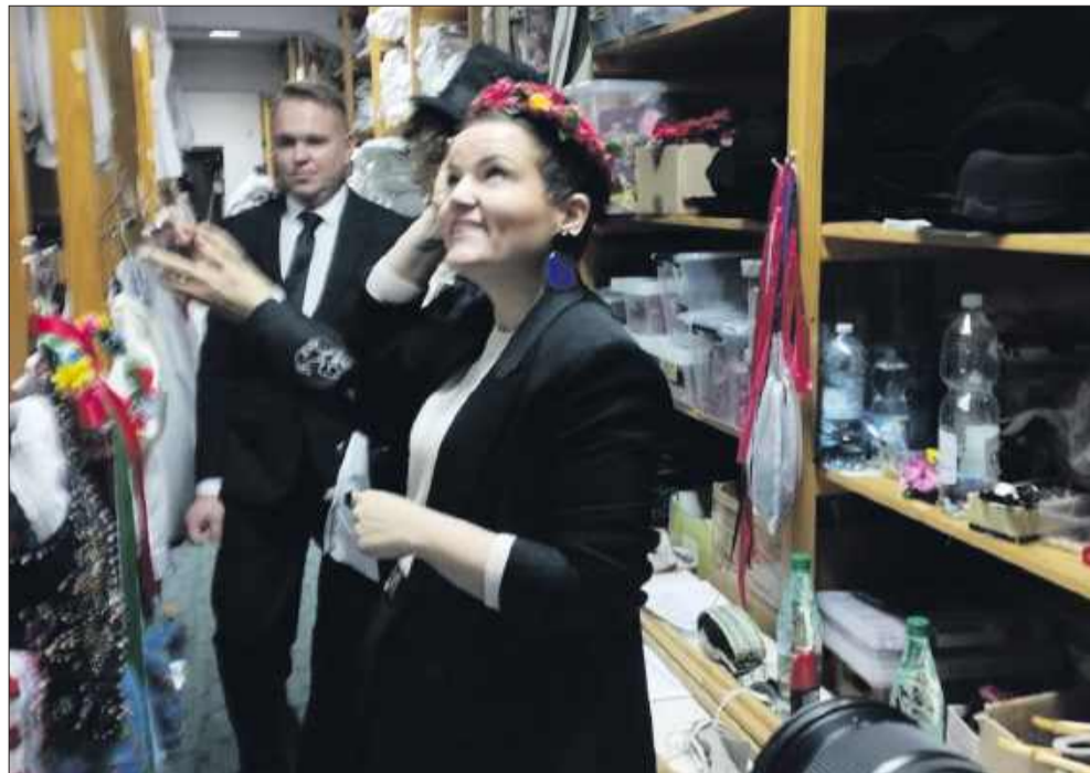
Garderoba SCK zrobiła duże wrażenie na minister – szczególnie stroje ludowe.

Na zakończenie spotkania minister poinformowała, że remont Samorządowego Centrum Kultury potrwa około dwóch lat. Remont obejmie przystosowanie budynku dla potrzeb osób niepełnosprawnych, zostanie wykonana większa ilość toalet, dojdzie do gruntownego remontu podziemia, które zostanie następnie włączone do użytkowania, pojawi się kawiarenka. Zmieni się także kolor elewacji oraz wygląd tylnej ściany budynku. W tym czasie próby oraz występy będą odbywać się w innych lokalizacjach w Mielcu. Wspólna troska o zachowanie kulturalnego dziedzictwa Mielca, jak podkreśliła minister Marta Cienkowska, jest kluczem do przyszłości tego wyjątkowego miejsca. GJ