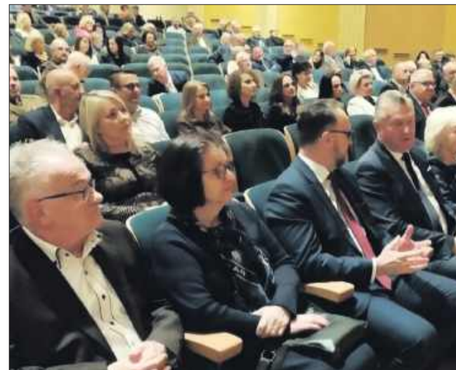
Gala zgromadziła licznych mieszkańców, przedstawicieli instytucji, samorządowców i gości

wał zgromadzonym gościom interesujący rys historyczny Mielca. Wykład przypominał o kluczowych momentach, wydarzeniach i postaciach, które wpłynęły na rozwój miasta na przestrzeni wieków. Była to podróż przez czas, która pozwoliła spojrzeć na Mielec jako na ważny punkt na mapie Podkarpacia, dynamicznie roz-