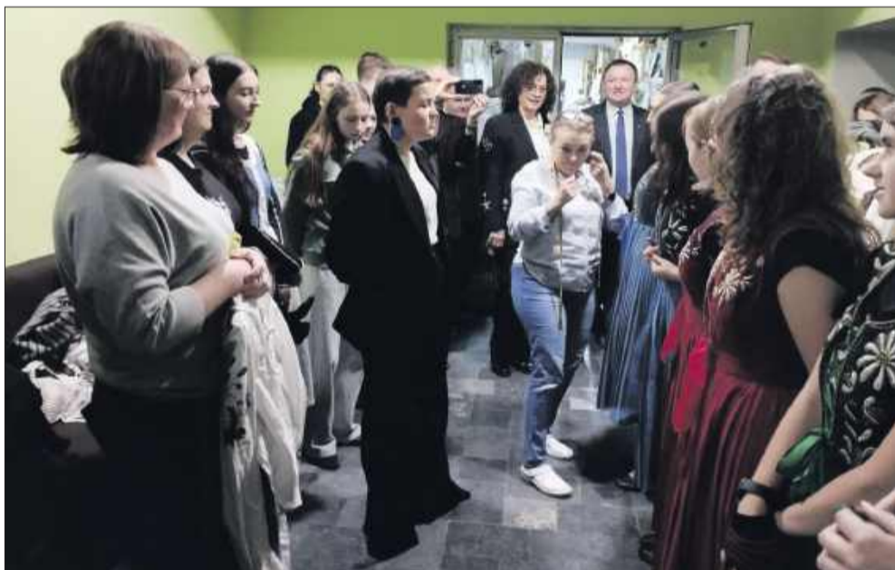
Spotkanie minister z zespołem „Rzeszowiacy” podczas próby.