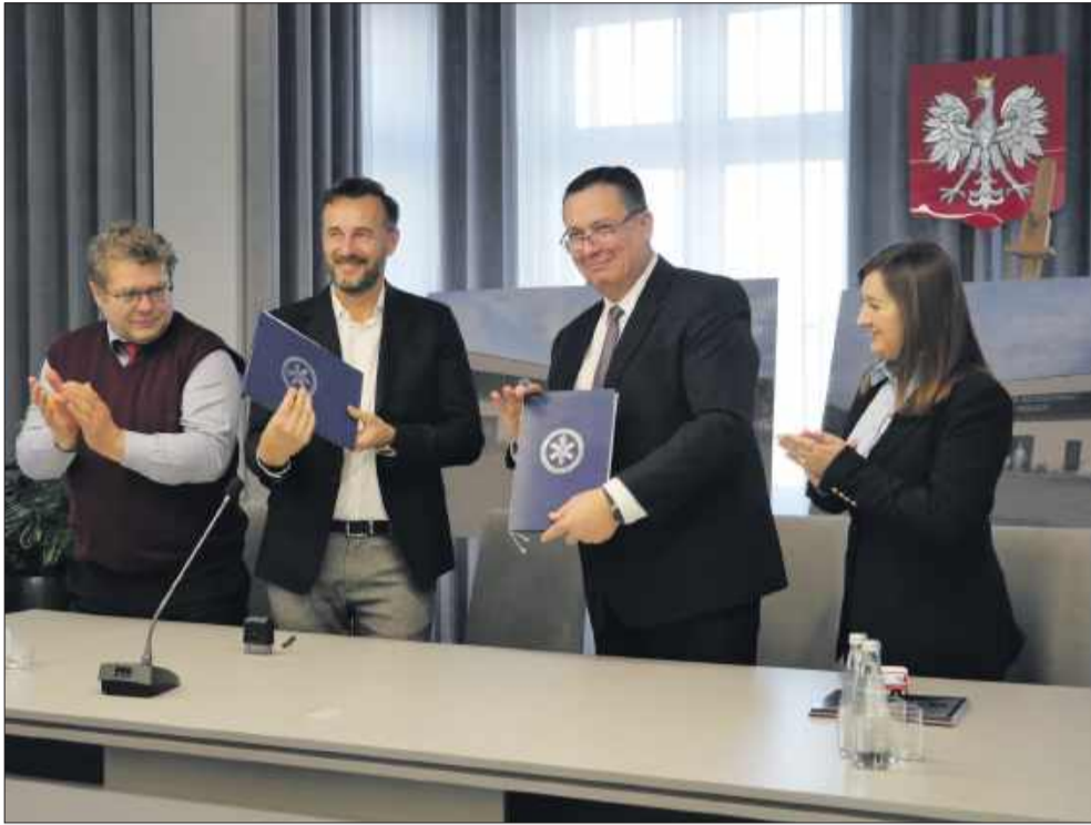
Nowa podstacja ma być gotowa do końca sierpnia 2026 roku.

W czwartek w Urzędzie Miejskim w Radomyślu Wielkim odbyło się oficjalne podpisanie umowy na budowę długo wyczekiwanej nowej siedziby podstacji Podkarpackiej Stacji Pogotowia Ratunkowego. To przełomowy moment zarówno dla gminy, jak i dla całego regionu, bo inwestycja znacząco poprawi bezpieczeństwo mieszkańców i skróci czas dotarcia karet do potrzebujących.