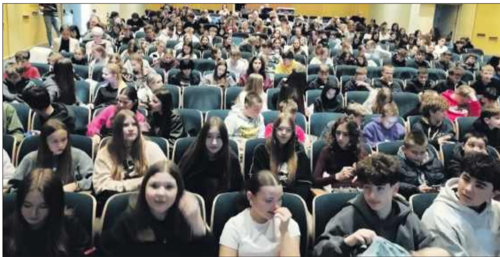
W teście wzięło udział 220 uczniów mieleckich szkół.