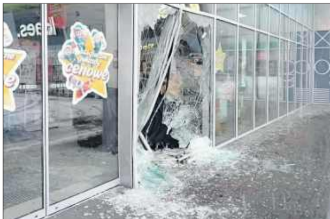
Zdjęcie z miejsca zdarzenia.

Sprawcą okazał się 19-letni mieszkaniec powiatu. Policja ukarała go mandatem karnym za stworzenie zagrożenia dla bezpieczeństwa ruchu drogowego. jb