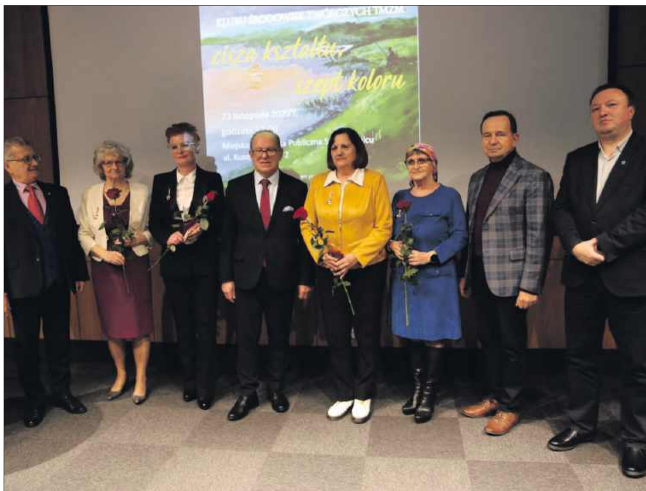
Artystyczne święto w Mielcu. W MBP rozdano odznaki i otwarto wyjątkową wystawę.