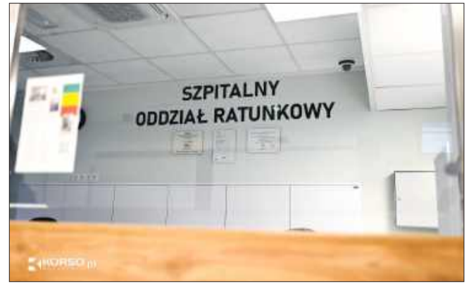
Liczba osób pod wpływem alkoholu przywożonych do mieleckiego szpitala stale rośnie.

Problemem jest również fakt, że wielu nietrzeźwych pacjentów nie wymaga natychmiastowej interwencji medycznej, a je-