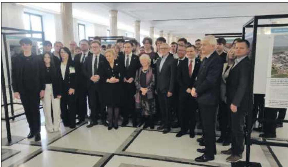
Podczas inauguracji obecna była delegacja młodzieży z Mielca.