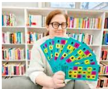
Spis Kulturalnych Treści Ukazał się biblioteczny Spis

Głosowanie w ramach Budżetu Obywatelskiego trwa do 6 lutego 2026 roku. Każdy oddany głos zwiększa szansę na powstanie nowego miejsca przyjaznego czytelnikom.