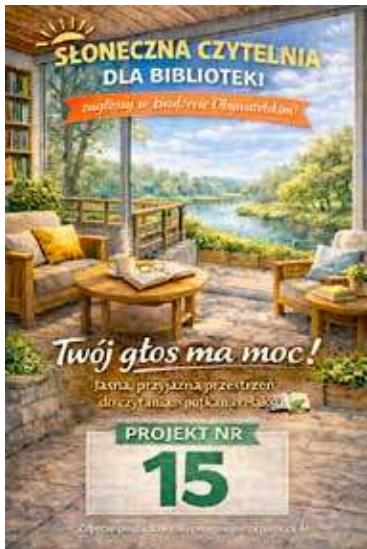
Słoneczna Czytelnia - nr 15 W Budżecie Obywatelskim

Sporo się działo w ostatnich dniach w Miejskiej i Powiatowej Bibliotece Publicznej w Goleniowie. Biblioteka ma swój pomysł do Budżetu Obywatelskiego, a ponadto propozycje spotkań autorskich i soboty z hobby.