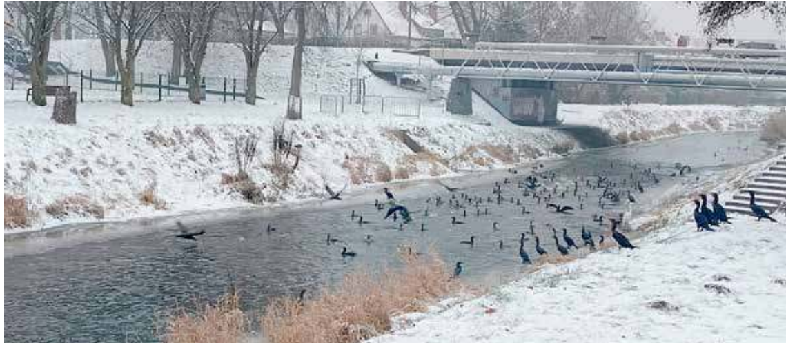
Kormorany nad Iną