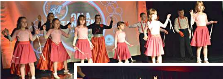
Walc Drewnianych Lalek zatańczyły dwie grupy KTT Chochlik