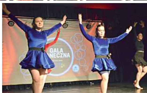
Występ KTT Chochlik