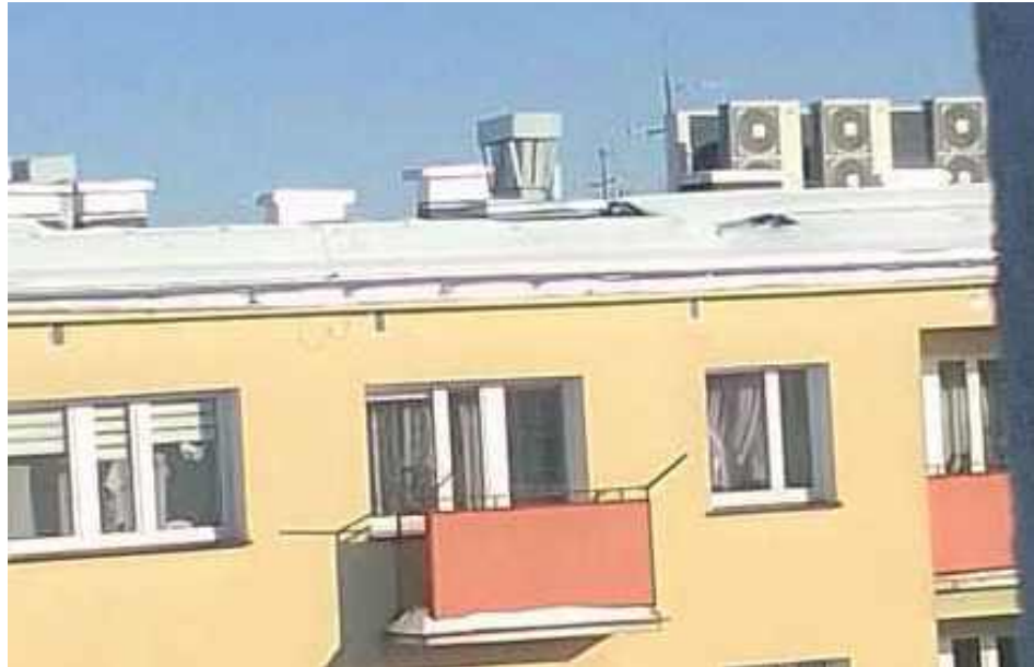
Zaśnieżona fotowoltaika. Zdjęcie z grupy Przejrzystość i Uczciwość - Spółdzielnia Lubartów

dziennikarz-prezes w swojej kanalizacji informacyjnej z pełną powagą tłumaczył, że na dachu zamontowano najnowocześniejszą fotowoltaikę.