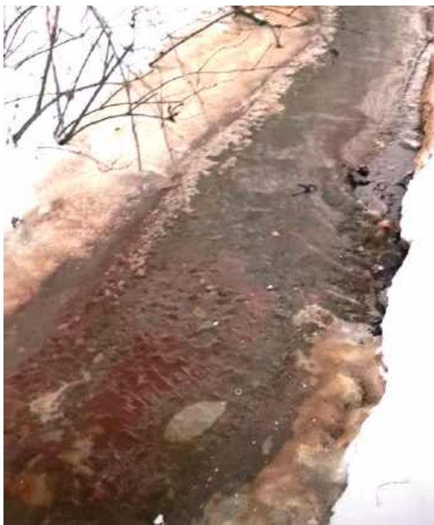
Taki widok zastali kilka dni temu mieszkańcy Końskowoli w rowie melioracyjnym niedaleko zakładów mięsnych

Do incydentu doszło w miniony wtorek 20 stycznia. Mieszkańcy zauważyli, że woda w rowie melioracyjnym ma czerwony kolor. Tym bardziej rzucało się to w oczy, że wokół leży śnieg, co z jego bielą dało silny kontrast. Woda z rowu trafia wprost do lokalnej rzeki Kurówki. Mieszkańcy nauczeni doświadczeniem sprzed kilku lat, natychmiast zaalarmowali władze gminy. W lutym 2018 r. w tym samym rowie także płynęła krwista substancja. Wtedy również interweniowały służby. Na miejscu stawili się m.in. policjanci, którzy szybko skierowali do prokuratury wniosek o wszczęcie śledztwa. Przedstawiciele wówczas zakładów Pini Beef tłumaczyli, że „nagły spadek temperatury spowodował rozszczelnienie układu zabezpieczającego kanalizację, co z kolei sprawiło, że doszło do przesącze-