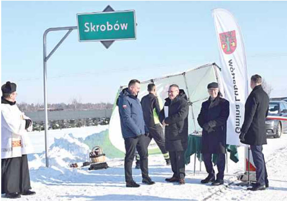
W trakcie uroczystości namiot gminy Lubartów odleciał

Drogę gminną w Skrobowie Kolonii wybudowano za ponad 5,5 mln zł, w tym blisko 2,8 mln zł to dofinansowanie z Rządowego Funduszu Rozwoju Dróg.