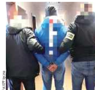
Grozi mu kara do 5 lat pozbawienia wolności

Łęczna: Na trzy miesiące do tymczasowego aresztu trafił 40-latek. Mężczyzna, trzymając w ręku siekiere, groził znajomej pozabawieniem życia. Zabrał jej telefon komórkowy, klucze do samochodu i do pracy oraz dowód osobisty.