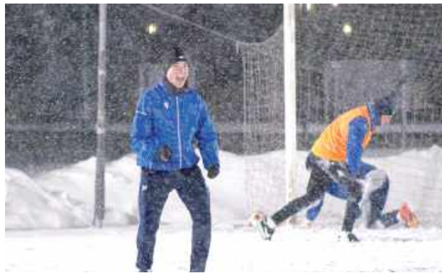
Lewart zaczął granie od wygranej 5:0 z Cisowianką Drzewce

Dwukrotnie do siatki trafił Kamil Zieliński. Ponadto z bramek cieszyli testowani zawodnicy. Wynik otworzył napastnik przymierzany do Lewartu, a wynik ustalił obrońca. Po niespełna