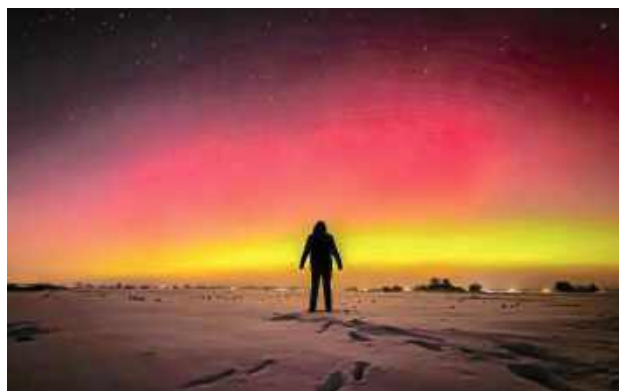
Noc rozbłysła niezwykłymi kolorami.

- Na tle rozświetlonego nieba pojawiły się sylwetki trzech osób, które połączyła wspólna obserwacja zjawiska, gesty radości i symboliczna „piątka” wykonana pod czerwono-zielonym łukiem światła. To były chwile, w których mroz