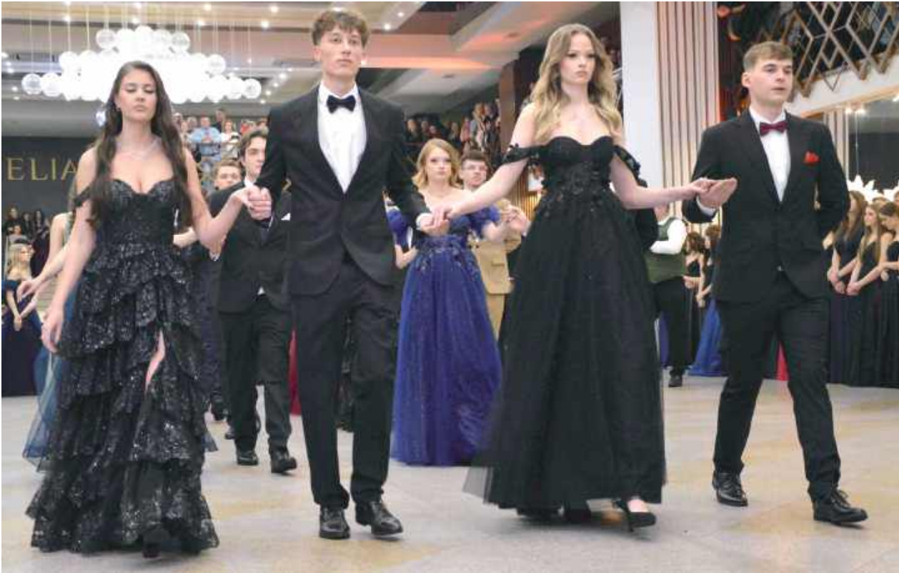
Wyjątkowo dostojnie prezentowała się młodzież podczas tradycyjnego poloneza, który rozpoczął bal

Około 300 uczniów z jednastu klas oraz ich osoby towarzyszące. Tak dużej studniówki w lubartowskim miejskim liceum jeszcze nie było.