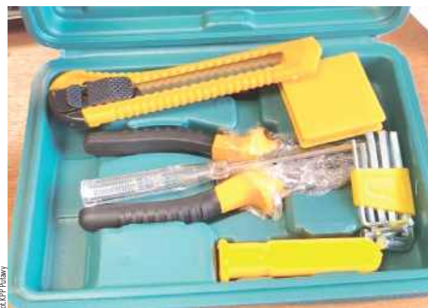
Mieszkaniec gminy Kazimierz dolny przecierał oczy ze zdumienia, gdy otworzył paczkę. Zamiast zamówionej nawigacji był w niej tandetny zestaw majsterkowicza

- Z relacji przedstawionej przez zawiadamiającego wynikało, że znalazł w Internecie