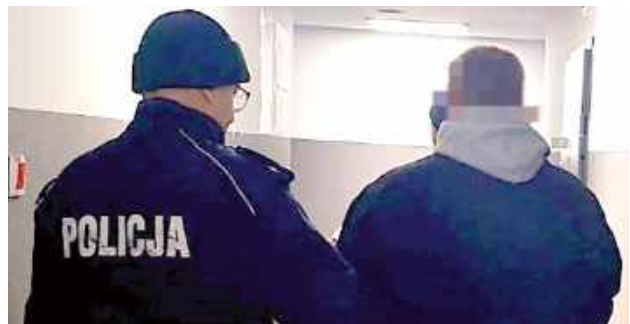
Fot. P. Opole Lubelskie

Śledczy z Opolu, nieustannie prowadząc poszukiwania, ustalili, że poszukiwany może pojawić się na terenie powiatu lubartowskiego - i to tylko na krótko. Mężczyzna miał przyjechać „na weekend”, co stało się kluczowym tropem.