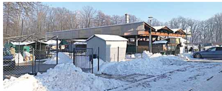
Miasto zaprasza do opracowania dokumentacji rewitalizacji targowiska

jest opracowanie kompleksowej dokumentacji projektowej rewitalizacji targowiska miejskiego w Lubartowie w zakresie m.in.: oceny stanu funkcjonalności, możliwości wykorzystania istniejących obiektów budowlanych na potrzeby targowiska oraz zaprojektowania nowych obiektów, przedstawienia koncepcji programowo-przestrzennej zawierającej nowe rozwiązania funkcjonowania targu przy