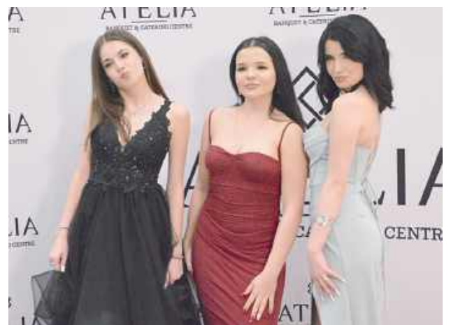
Uczestniczki piątkowej studniówki zaprezentowały się w imponujących kreacjach. Panie postawiły na długie suknie