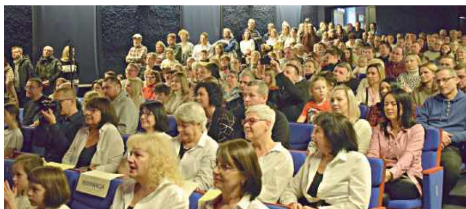
Publiczność wypełniła całą salę widowiskową LOK