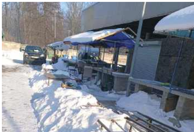
Tak wygląda targ w zimie - puste stragany zasypane śniegiem

Targ zazwyczaj tętni życiem, ale w mroźne dni na miejskim targowisku przy ul. Kościuszki są pustki, stragany w większości są zasypane śniegiem.