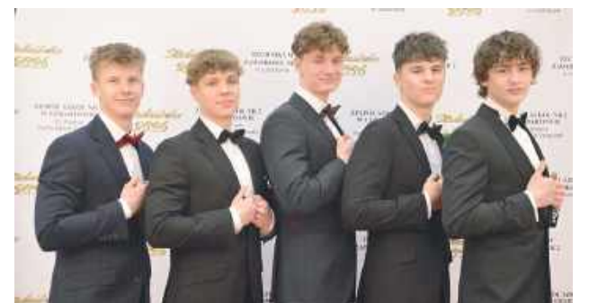
Panowie postawili na klasykę: ciemne garnitury i muchy