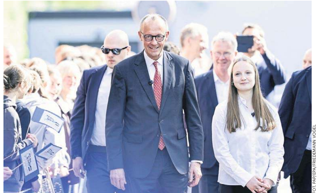
Merz spotkał się z uczniami w Marsbergu. Ostrzegł przed eskalacją na Bliskim Wschodzie i wezwał Unię Europejską do zdecydowanych działań wobec Ukrainy

Za wcześniej na zniesienie sankcji Szefowa Komisji Europejskiej Ursula von der Leyen oce-