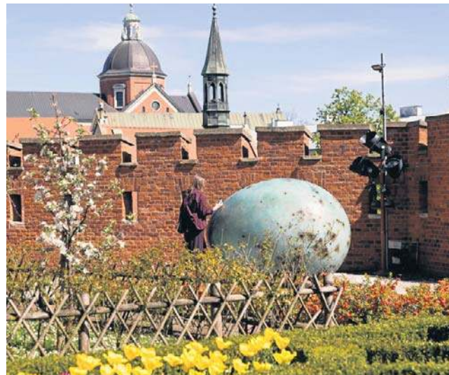
Wystawa Joanny Rajkowskiej zagościła w Ogrodach Królewskich na Wawelu

- Wystawa Joanny Rajkowskiej skłania do myślenia o czasie w sposób wykraczający poza ludzką skalę. Interesuje nas moment, w którym prze-