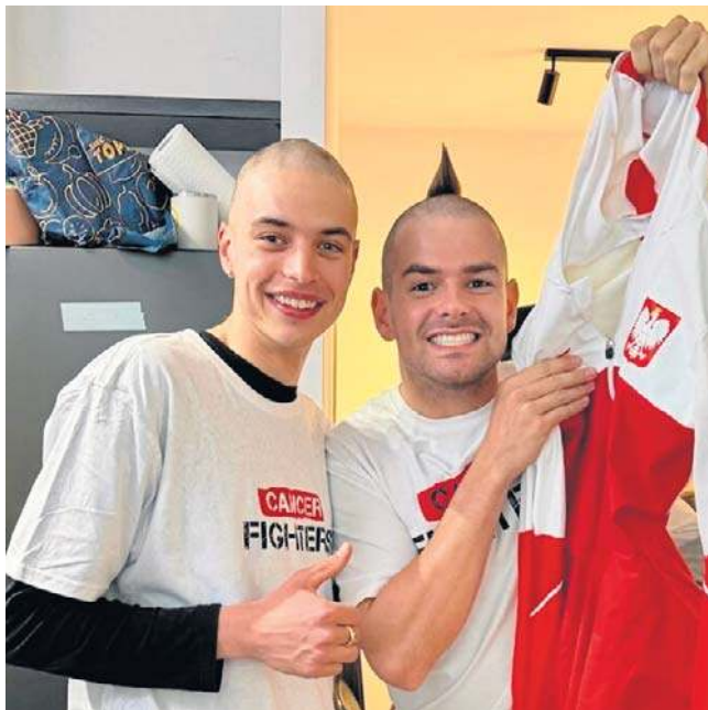
Łyżwiarz szybki i wicemistrz olimpijski Władimir Semirunnij wsparł akcję Łatwogangu - ogolił głowę na tyso i przekazał medal olimpijski na cele charytatywne

W akcję zaangażowały się m.in. osobistości polskiego świata sportu i nie tylko. W transmisji, nadawanej z kawalerki w bloku, udział wzięli m.in. Robert Lewandowski, Iga Świątek, Jan Urban, Wojciech i Marina Szczęśni, Adam Małyśz, Marcin Gortat, Mateusz Ponitka, Piotr Żyła, Wilfredo Leon, Jan Błachowicz i... gwiazda FC Barcelona Lamine Yamal.