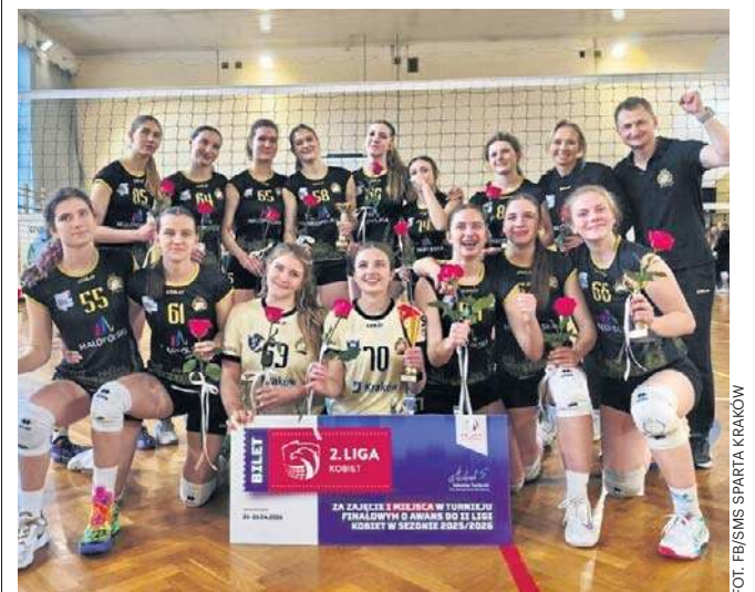
Siatkarki SMS Sparta Kraków wygrały turniej finałowy w Raławówce i wywalczyły awans do II ligi

Przypomnijmy też, że to druga drużyna tego klubu, skupiającego się na pracy z młodzieżą, na szczeblu centralnym. Wcześniej przez dwa lata (2023-2025) grali tam panowie. ©