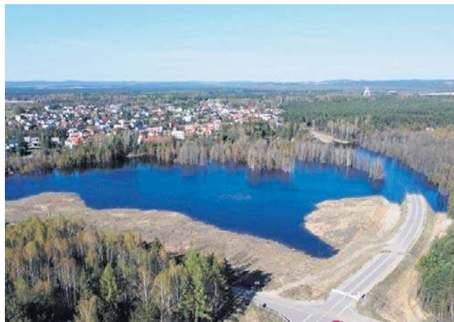
Obwodnica Bolesławia - na nieczynnej drodze wciąż przybywa wody

Wyczekiwana przez mieszkańców obwodnica Bolesławia otwarto pod koniec 2022 roku. Droga warta około 7,5 miliona złotych działała niespełna trzy miesiące. 14 lutego 2023 roku w nasypie drogi powstało zapadlisko i wprowadzono zakaz wstępu na drogę. We wrześniu 2024 zalewisko dotarło do nasypu obwodnicy. W kolejnych miesiącach poziom wody rósł. Żywił pochłaniał drzewa, tabliczki ostrzegające przez szkodami górniczymi oraz drogę i towarzyszącą jej infrastrukturę. ©©