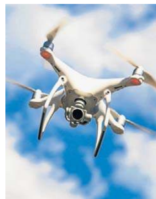
Osoby prywatne nie będą mogły kupić dronów