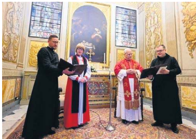
Papież i prymas Kościoła Anglii modlili się razem w kaplicy Urbana VIII w Pałacu Apostolskim

Abp Canterbury powiedziała papieżowi: W dzisiejszym świecie jesteśmy wezwani do życia i głoszenia Ewangelii z nową jasnością. W obliczu nieludzkiej przemocy, głębokich podziałów i gwałtownych przemian społecznych musimy współpracować dla dobra wspólnego, budując zawsze mosty, nigdy mury, pamiętając, że najubożsi spośród nas są najbliżsi sercu Boga. PAP