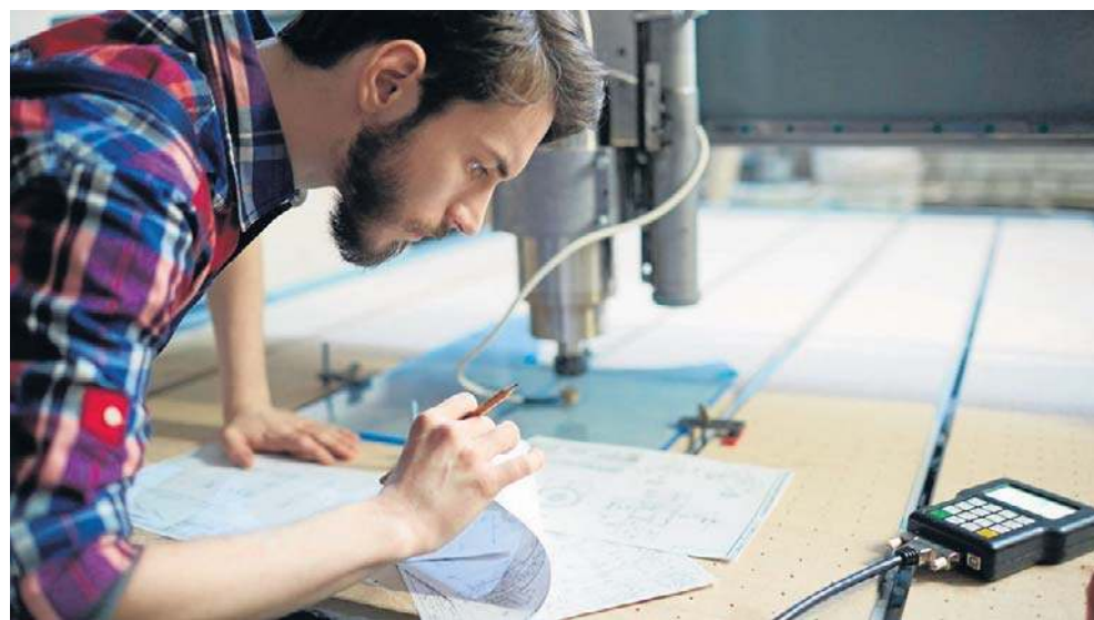
72,2% przedsiębiorców zapytanych w badaniu nie będzie nic zmieniać w zatrudnieniu

Ostatnie lata przynoszą wyraźną zmianę w strukturze rekrutacji. Najczęściej poszukiwani nie są już pracownicy niższego szczebla, ale średniego,