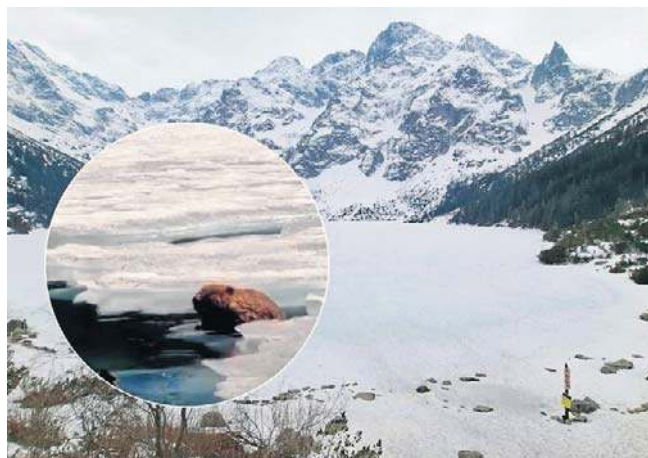
Bóbr z Morskiego Oka przyłapany. Udało się go nagrać jednemu z turystów

Historia obecności bobrów w tym rejonie jest krótka. Pierwsze sygnały o ich pojawieniu się w Tatrach pochodzą z 2015 roku z okolic Eyszej Polany. Do Morskiego Oka, położonego na wysokości blisko 1400 m n.p.m., zwierzęta dotarły w 2021 roku. Był to ewenement na skalę światową, gdyż wcześniej nie notowano obecności tych ssaków na tak znacznych wysokościach. ©©