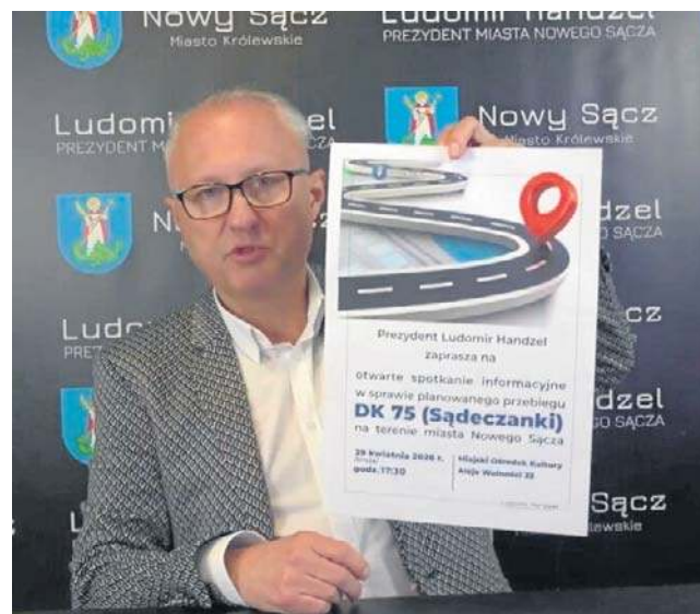
FOT. UM NOWY SĄCZ

W praktyce oznacza to, że dla tych odcinków powstaną nowe warianty przebiegu – w tym m.in. korekta tzw. wariantu społecznego (A) oraz zupełnie nowe propozycje projektanta. – Projektant sprawdzi możliwość zmiany przebiegu dla odcinków II i IV tej drogi w oparciu o proponowany przez część samorządów wariant A. Następnie zaproponuje także swój własny wariant przebiegu tych odcinków. W efekcie uzyskamy po trzy warianty dla każdego z dwóch proponowanych odcinków – wyjaśnia Bałdyga.