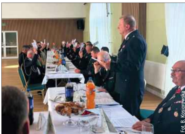
Sprawdzamy, kto wszedł w skład zarządu i prezydium.