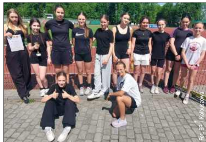
Młode lekkoatletki z Kolbuszowej zajęły dziewiąte miejsce w województwie.

Zakończyły się zmagania w szkolnej lidze lekkoatletycznej dziewcząt. W tegorocznej edycji zawodów z powodzeniem startowały reprezentantki Szkoły Podstawowej nr 1 w Kolbuszowej, które dotarły do najwyższego szczebla rywalizacji.