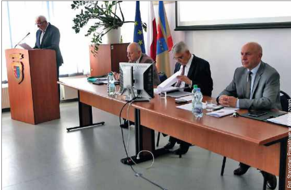
Jednym z kluczowych punktów obrad była debata nad Raportem o stanie Powiatu Kolbuszowskiego za 2025 rok.

Raport ten podsumowuje działalność Zarządu Powiatu w minionym roku: realizację polityk, programów i strategii, wykonanie uchwał Rady Powiatu oraz budżetu. Zgodnie z ustawą, po przedstawieniu dokumentu odbywa się debata, w której mogą uczestniczyć zarówno radni, jak i mieszkańcy.