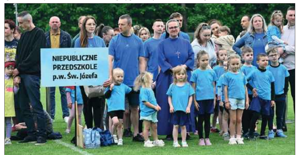
Przedszkolaki zebrały się na płycie boiska.