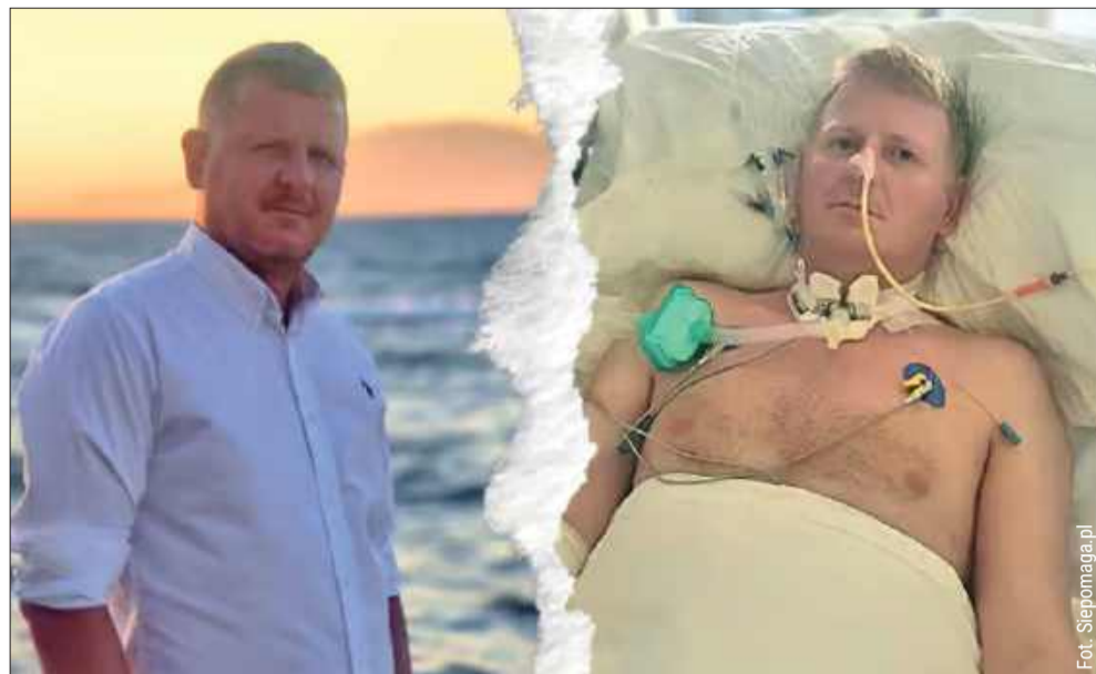
Mieszkaniec Zarębek walczy o powrót do sprawności. Rodzina prosi o pomoc.

To właśnie pobyt w ośrodku rehabilitacyjnym jest głównym celem zbiórki. Pieniądze potrzebne są także na leczenie oraz środki higieniczne. Koszty są