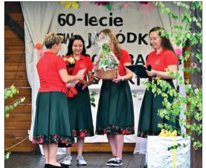
Był to czas wzruszeń i wdzięczności.