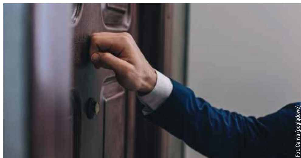
Mieszkańcy powinni zachować ostrożność.

W komunikacie podkreślono także, że WFOŚiGW w Rzeszowie nie współpracował i nie współpracuje z żadną firmą wykonawczą ani consultingową w ramach realizowanych projektów, w tym programu „Czyste Powietrze” czy wsparcia mikroretencji wód opadowych.