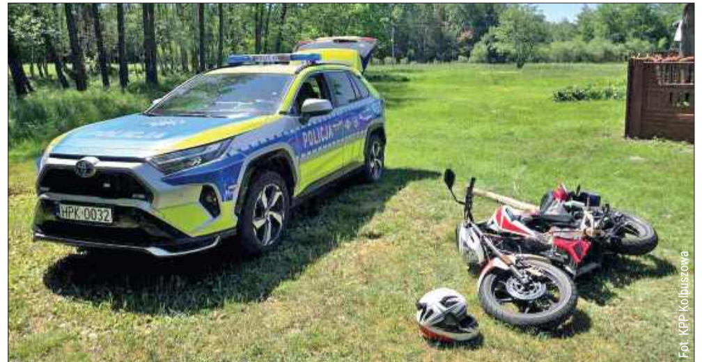
Po krótkim pościgu policjanci udaremnili próbę ucieczki.

Policjanci podkreślają, że niezatrzymanie się do kontroli