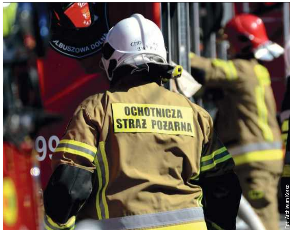
Strażacy z gminy Cmolas z wyższym ekwiwalentem. Rada przyjęła uchwałę.

Chodzi m.in. o alarmowanie i ostrzeganie ludności o zagrożeniach, udział w ochronie ludności i obronie cywilnej, propagowanie zasad ochrony