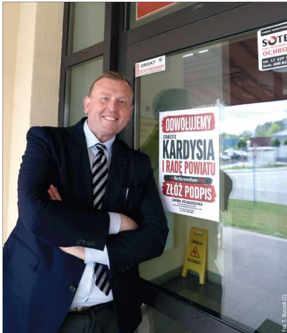
Na budynku starostwa pojawiły się plakaty zachęcające do złożenia podpisu pod referendum.