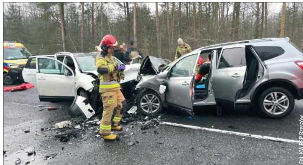
Tragiczne zderzenie nissanów w Głogowie Młp. miało miejsce na początku tego roku.

Jak przekazał prokurator Ciechanowski, badania nie potwierdziły obecności środków odurzających w organizmie 63-letniego mężczyzny. Wcześniej wiadomo było także, że badanie alkometrem wykonane na miejscu wykazało, że był trzeźwy.