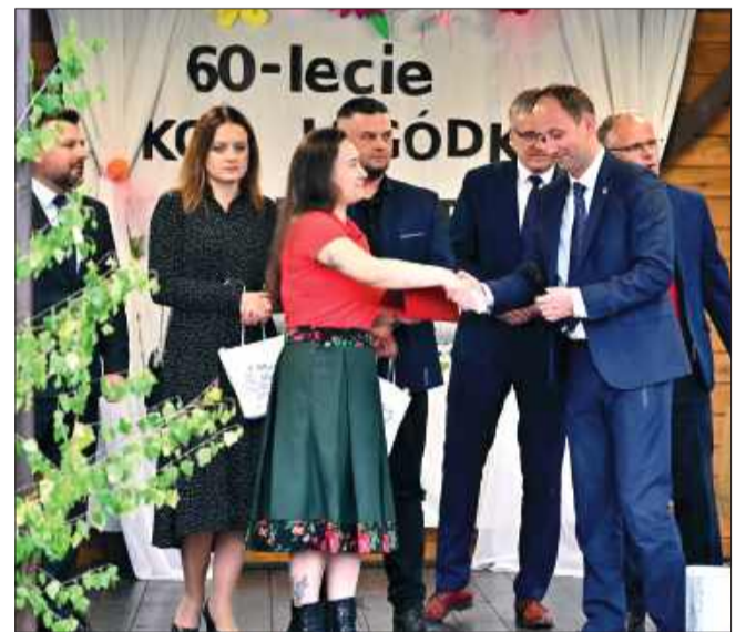
Władze podziękowały członkiniom za działalność.