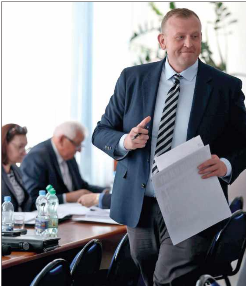
Plakaty trafiły także na biurka radnych powiatowych i starosty podczas sesji.