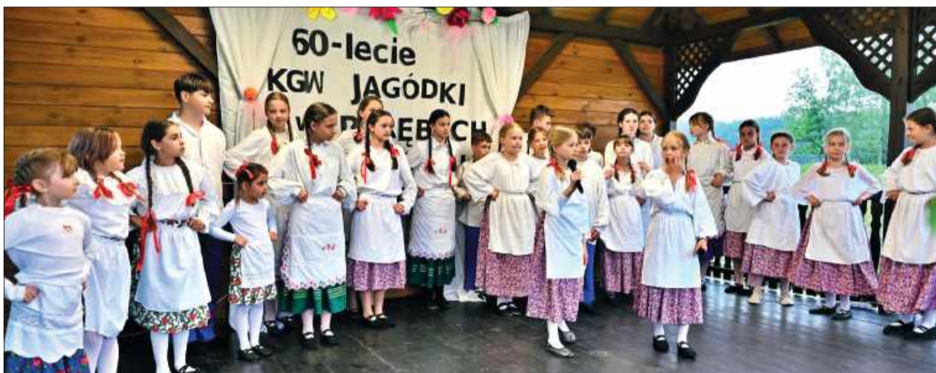
Na scenie zaprezentowali się młodzi „Lesianie” z Kupna.