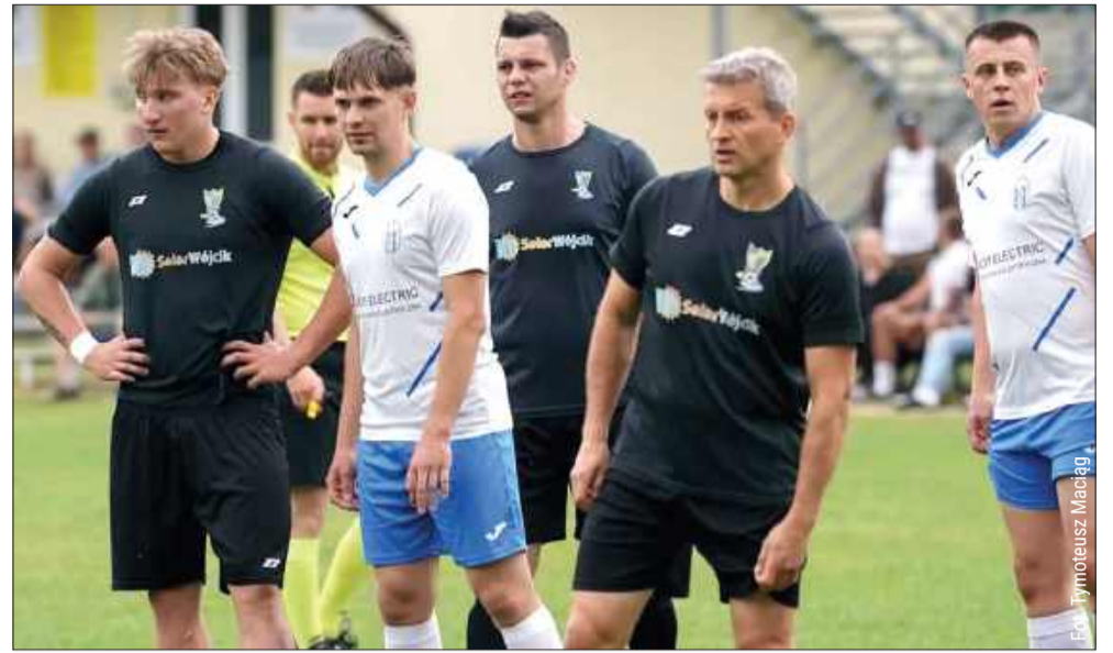
W derbach Gminy Cmolas padł remis.

W kolejnych minutach spotkanie mocno się otworło. Tempo, które nie miało nic do stracenia zaczęło grać odważnie. Swoje szanse na podwyższenie wyniku mieli także zawodnicy z Ostrow Tuszowskich. Ostatecznie w ostatniej akcji meczu piłkę po dośrodkowaniu z rzutu