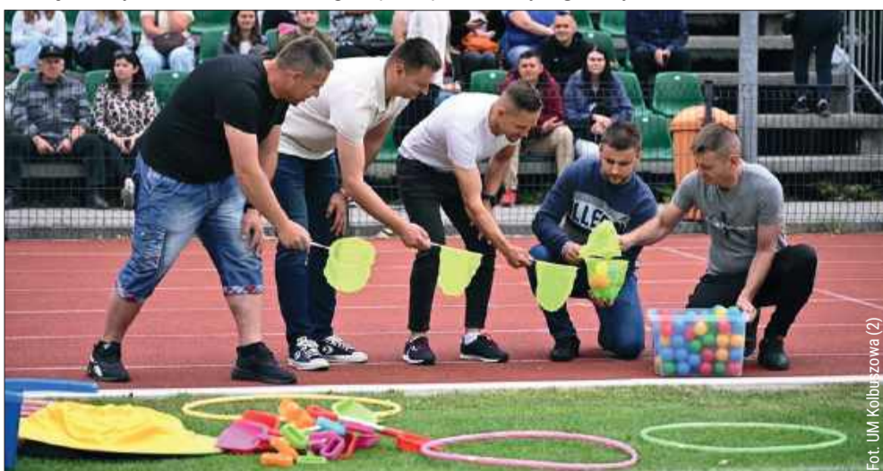
Rodzice też musieli wykazać się sprawnością.

Każde dziecko, które wzięło udział w olimpiadzie, otrzymało pamiątkowy medal. kz