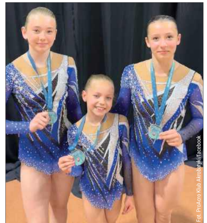
Młode akrobatki z Raniżowa wywalczyły złoto w Łańcucie

samego końca. Brawa należą się także dwóm pozostałym trójkom z raniżowskiego klubu, które