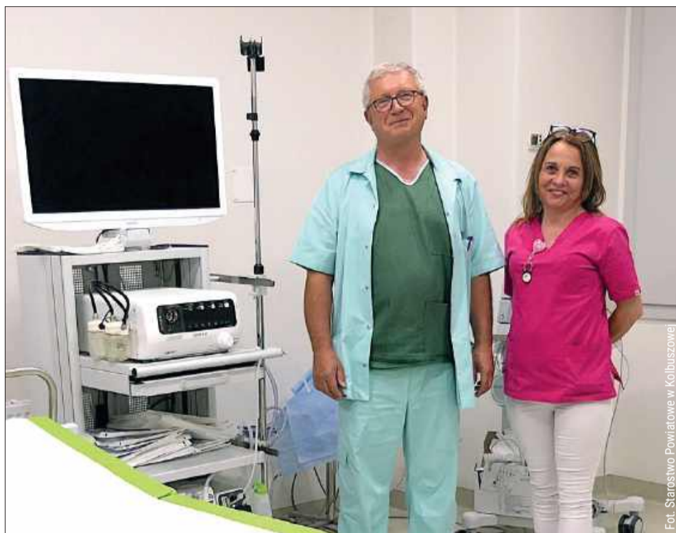
Szpital zyskał endoskopię w jakości 4K.

To, co wyróżnia nową aparaturę, to przede wszystkim niespotykana dotąd precyzja obrazu.