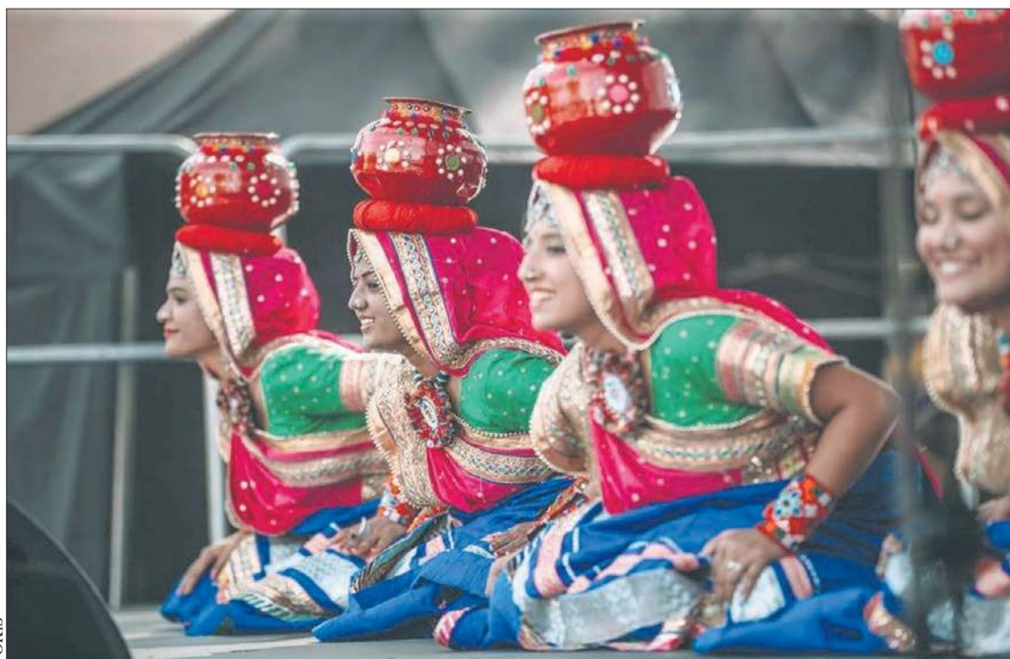
Wśród festiwalowych uczestników będzie indyjski SURTAAL PERFORMING ART