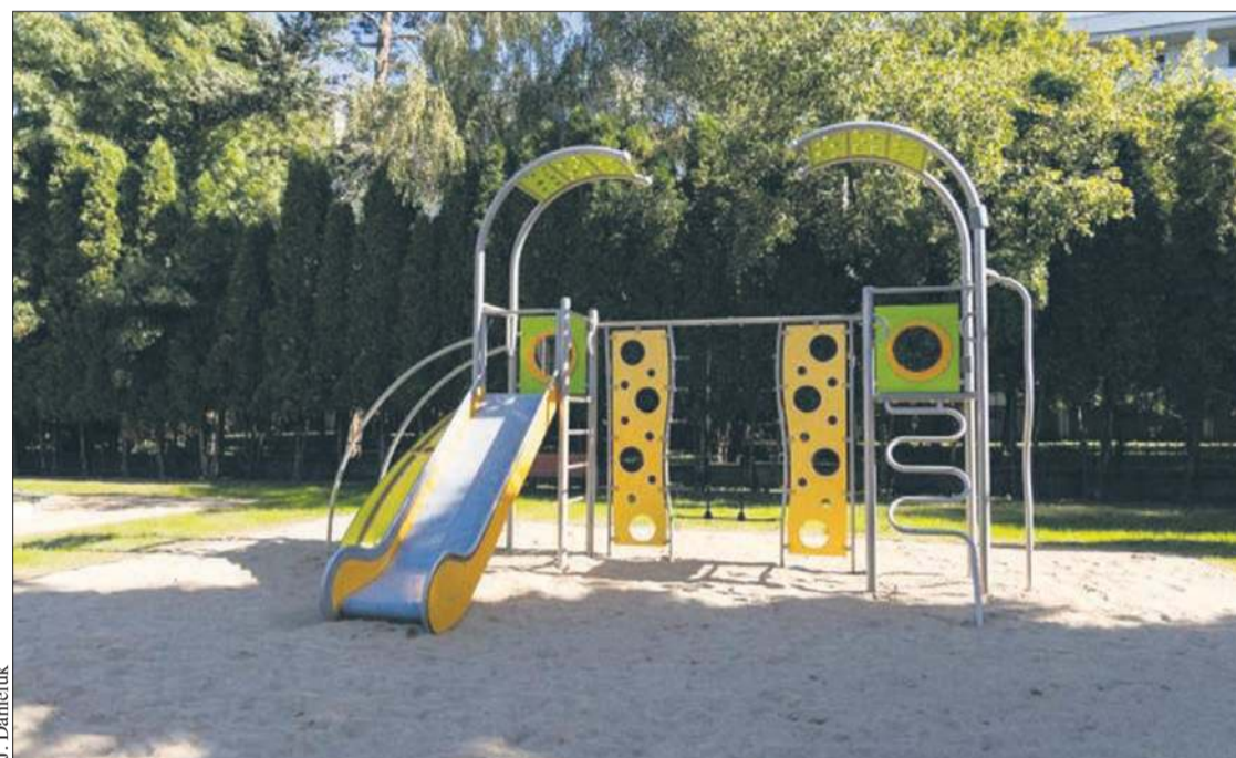
Przebudowa placu zabaw przy stadionie miejskim była jednym z projektów BOP. Prace zakończyły się jesienią ubiegłego roku

w tym rejonie miasta oraz wpłynęła znacząco na komfort poruszających się pieszo mieszkańców z całego miasta.