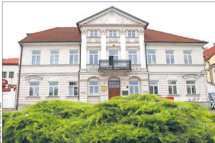
„Dom pod Opatrznością” przy pl. Narutowicza 2 – Biblioteka Naukowa im. Zielińskich TNP

Te prace dzięki wsparciu finansowemu mazowieckiego samorządu są systematycznie realizowane od 2021 r.