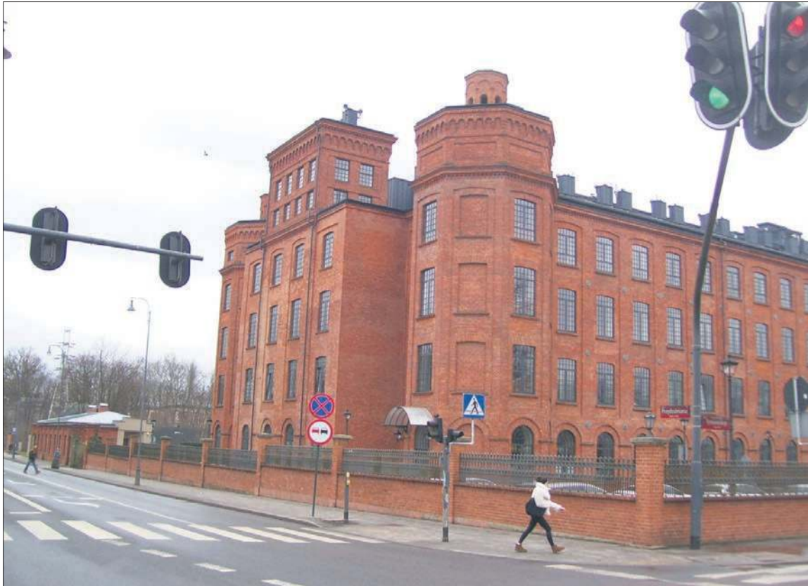
Fragment imperium Karola Scheiblera. Budynek dawnej przędzalni i tkalni, obecnie po rewitalizacji mieszczą się w nich lofty