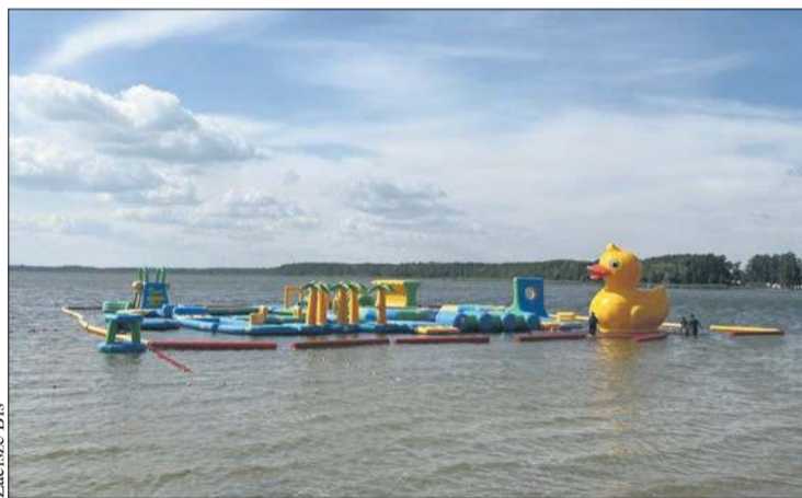
Jedną z najciekawszych atrakcji jest park wodny

miejskiego zgiełku. Otaczające je lasy sosnowe oraz bliskość plaży czynią to miejsce wyjątkowo malowniczym i zachęcającym zarówno do spędzenia kochających chwil w ciszy, jak i do lepszych spacerów czy aktywnego wypoczynku.