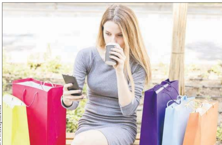
Zakupy w internecie są wygodne, ale mogą być pułapką

Takie hasła mają nakłonić klienta do szybkiej decyzji, bez analizy kosztów czy poszukiwania takiego samego towaru u innego sprzedawcy.