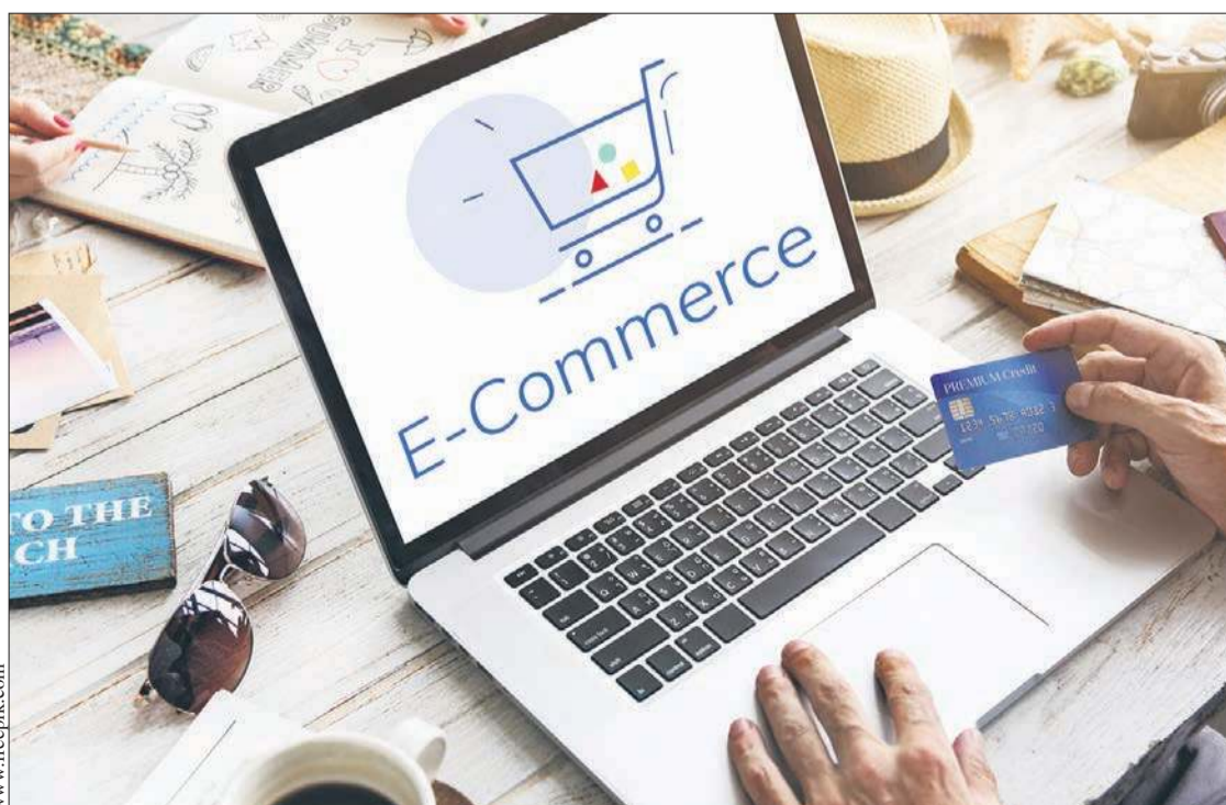
Podczas zakupów w internecie najlepiej płacić kartą

Upewnijcie się, czy przedsiębiorca działa z Polski lub innego kraju