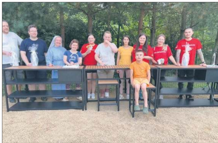
Kuchenne meble ogrodowe – to nowy nabytek zakupiony i złożony dla podopiecznych ośrodka w Mocarzewie przez wolontariuszy GK ORLEN

pik MATERIAŁY BUDOWLANE UL. KOSTROGAJ 4 UL. WYSZOGRODZKA