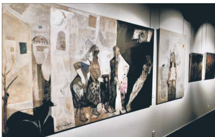
Wystawę można oglądać do 28 września 2025 r., w sali wystaw czasowych MMP przy ul. Kolegiальной 6

W sprowadzenie dzieł do Polski nieoceniony wkład miała Carmen