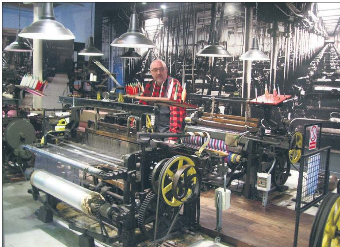
Hala maszyn w ruchu w Muzeum Włókiennictwa