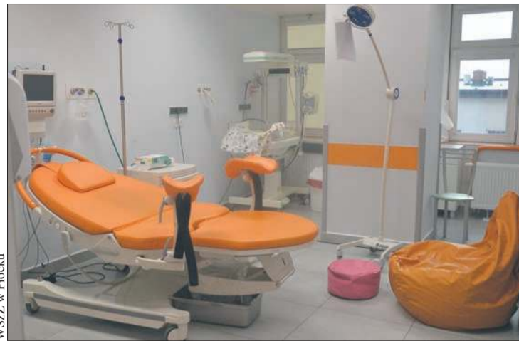
WSZ w Płocku