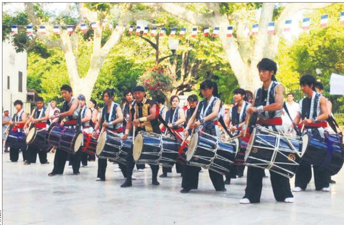
Na scenie zaprezentuje się grupa Super Taiko Junior