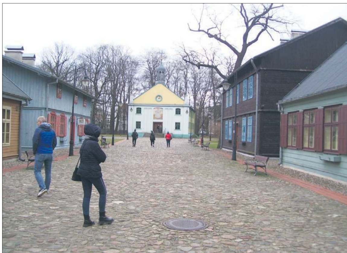
Łódzki Park Kultury Miejskiej przy Centralnym Muzeum Włókiennictwa w Łodzi

Pałac Herbstów jest budowlą jednopiętrową, odznaczającą się wycieczką proporcji, smakiem i elegancją. Pokoje w czasach pierwszych właścicieli urządzone były wygodnie i funkcjonalnie. Na parterze znajdowały się pomieszczenia i salony reprezentacyjne, takie jak: sala balowa, jadalnia, gabinety, sa-