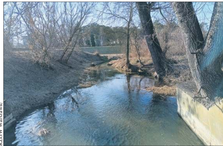
RZGW Warszawa Rzeka Słupianka