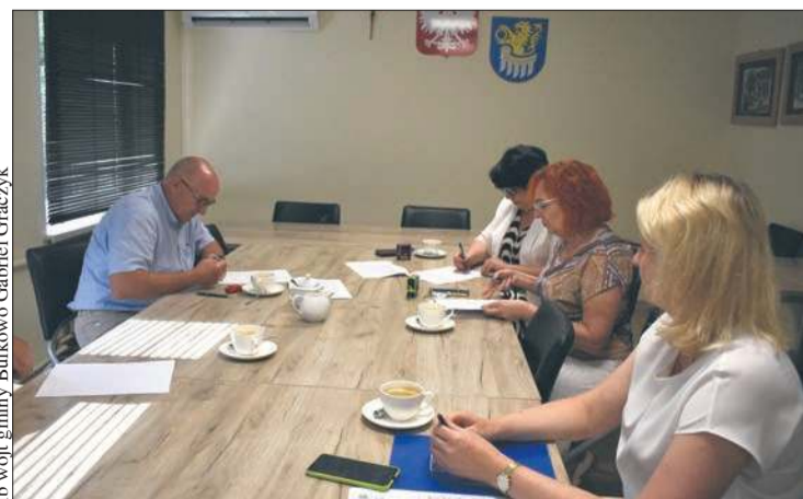
fb wójt gminy Bulkowo Gabriel Graczyk