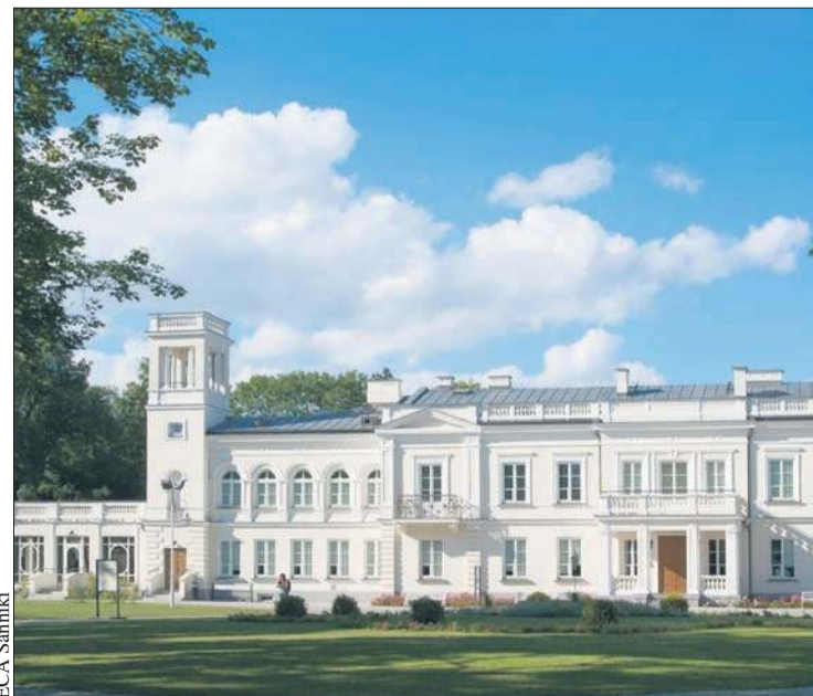
Fotografowie z pewnością znajdą w okolicy Gostynina wiele pięknych miejsc