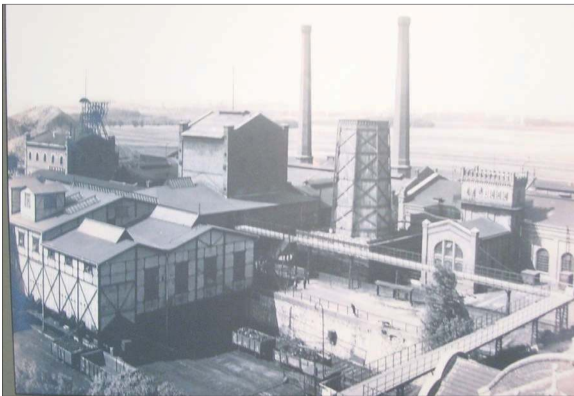
Kompleks przemysłowy Scheiblera na przełomie dziewiętnastego i dwudziestego wieku