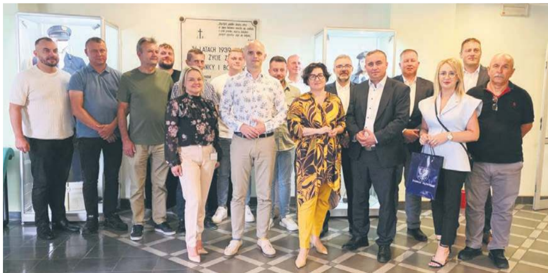
Uczestnicy spotkania w płockim oddziale Energa-Operator S.A.