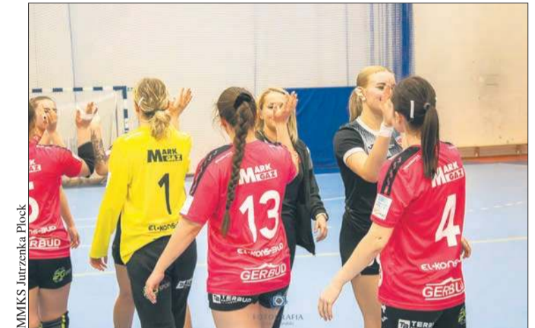
MMKS Jutrzenka Płock

W dniach 23-24 sierpnia Jutrzenka weźmie udział w wyjazdowym turnieju, z udziałem drużyn z Ligi Centralnej. Tydzień później na hali ZST 70 Jutrzenka zorganizuje turniej „PG