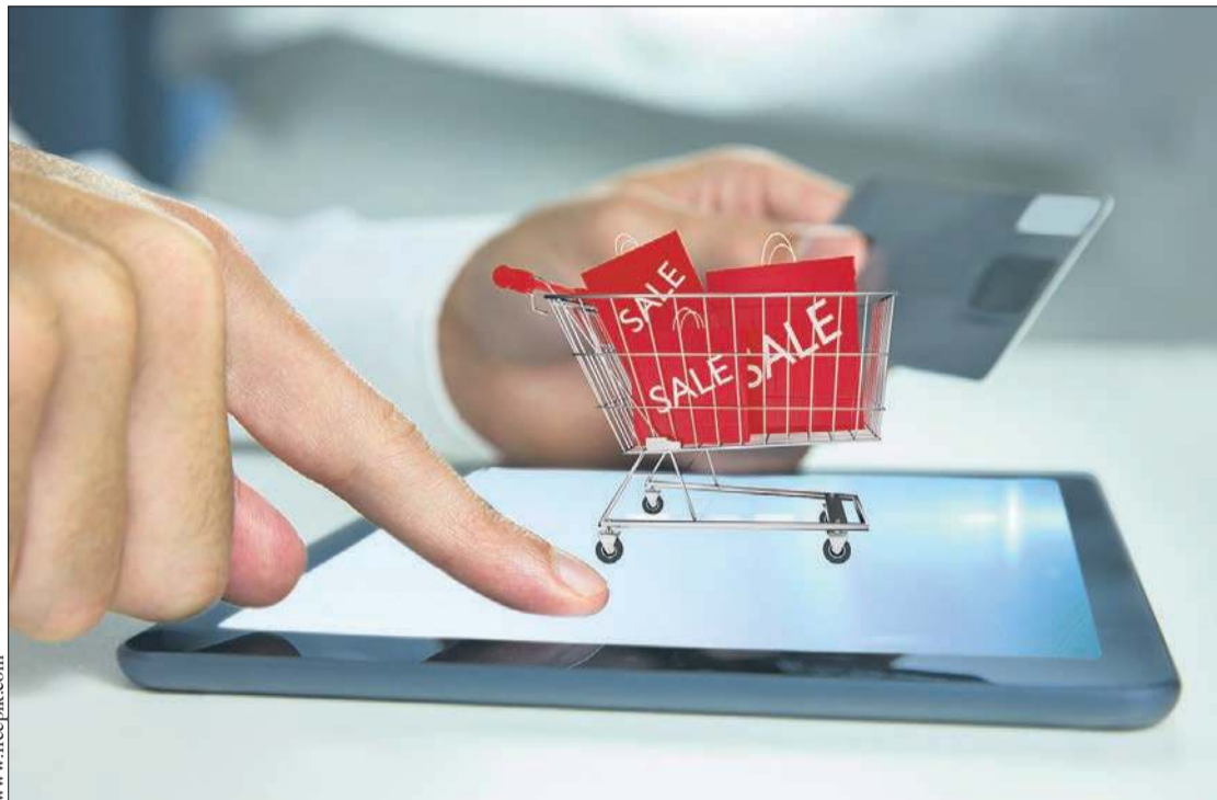
Zachowaj rozsądek podczas letnich wyprzedaży i promocji

Warto też uważać na marketingowe sztuczki podawane przez sprzedawców. Oto przykłady, które powinny wzmoczyć ostrożność: wyprzedaż do -90%, likwidacja sklepu/magazynu, 20 osób ogląda ten produkt, 10 osób kupiło ten produkt, 40 minut zostało do końca promocji.