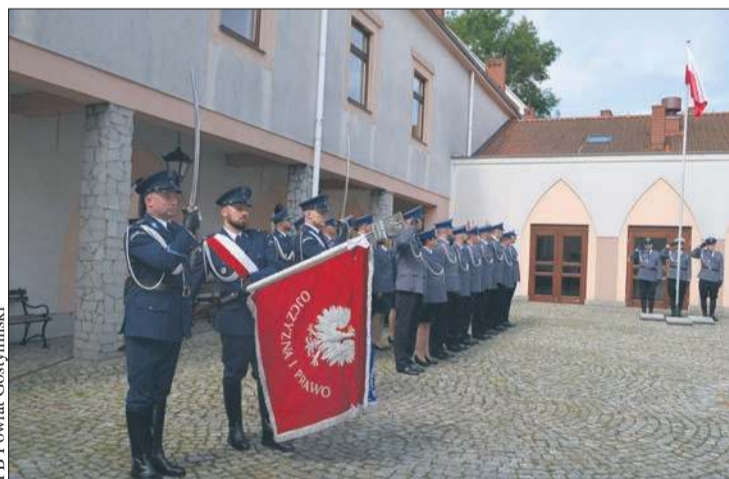
Święto Policji odbyło się na Zamku Gostynińskim

Święto było także okazją do nadania odznaczeń związkowych. Medale za zasługi dla Związku przyznane