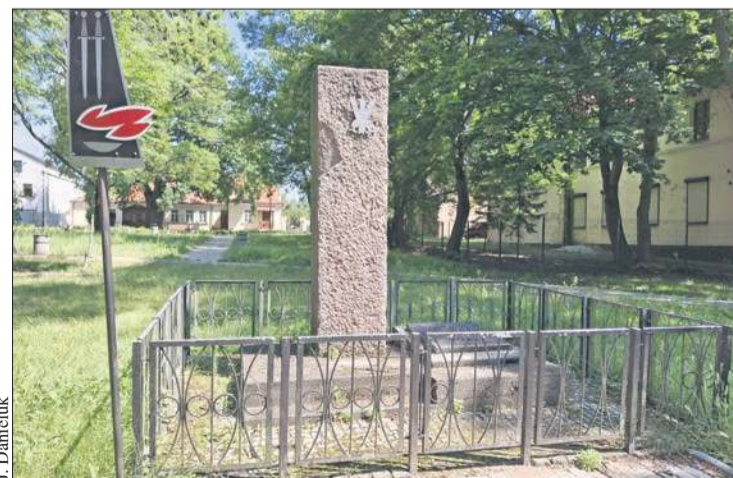
Pomnik nauczycieli w ogrodzie Władysława Broniewskiego zostanie wyremontowany

Przewidziany zakres prac: oczyszczenia pomnika z porostów i mchów; uzupełnienie ubytków i zabezpieczenie cokołu pomnika (np. płytami granitowymi); zaimpregnowanie nawierzchni pomnika przed wykwitami mchu; wymiana elementu metalowego na pomniku; oczyszczenie i malowanie ogrodzenia na kolor czarny; wymiana tablicy z inskrypcją; oczyszczenie kostki wokół pomnika.