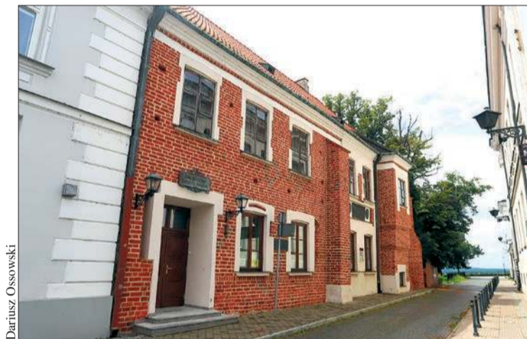
XV-wieczna kanonia przy pl. Narutowicza 8 – główna siedziba Towarzystwa Naukowego Płockiego