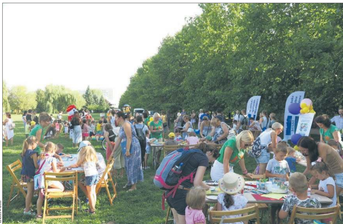
Park Północny to doskonałe miejsce na literacką zabawę