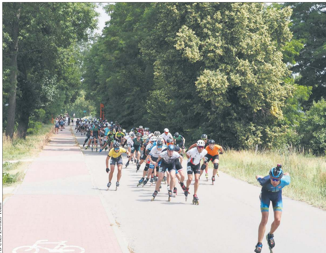
Runda Widawa okazała się szczęśliwa dla zawodników UKS Zwoleń Team

świadczeni zawodnicy na 11 km, 21 km, 42 km.