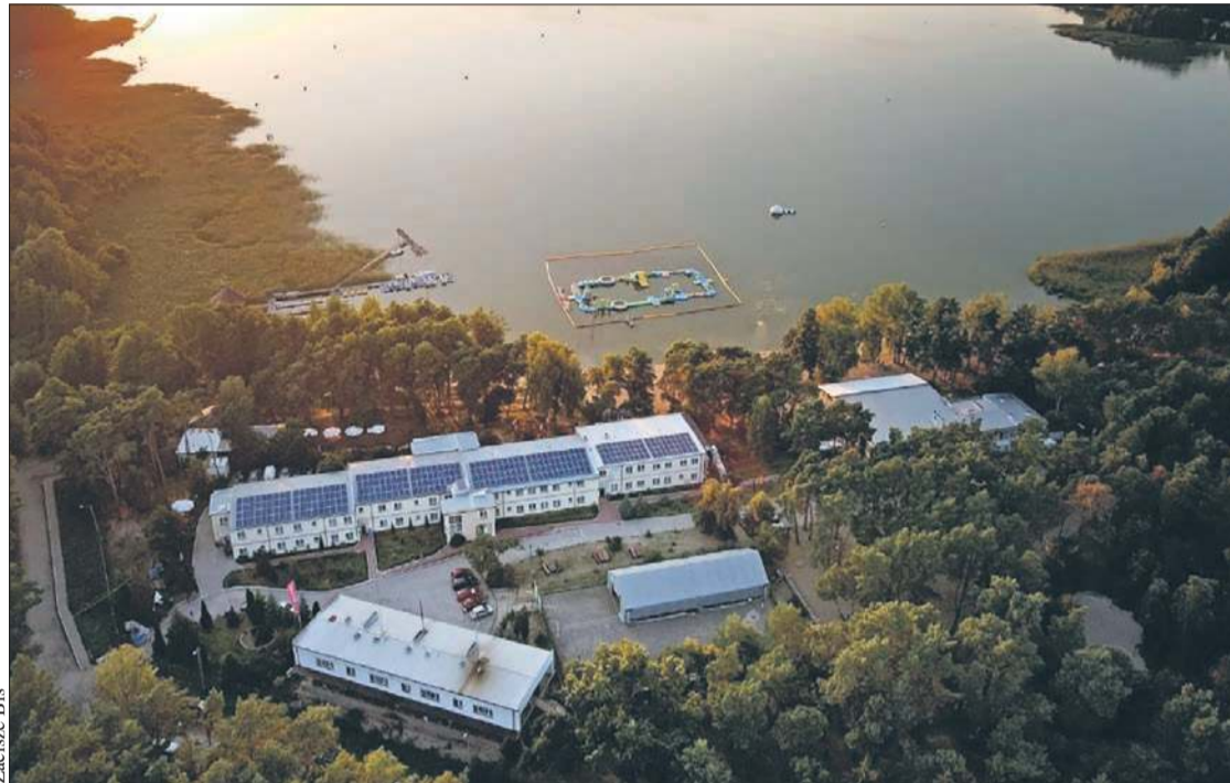
Ośrodki w Koszelówce dysponują ponad 250 miejscami noclegowymi

W miejscowości Koszelówka, w bezpośrednim sąsiedztwie Jeziora Zdwońskiego, funkcjonują dwa ośrodki wypoczynkowe – Zacisze i Zacisze Bis. Obiekty te od wielu lat cieszą się zaufaniem rodzin oraz grup zorganizowanych z Płocka i okolic. Ich niewątpliwym atutem jest lokalizacja – zaledwie 17 kilometrów od Płocka – oraz naturalny, spokojny charakter sprzyjający wypoczynkowi z dala od