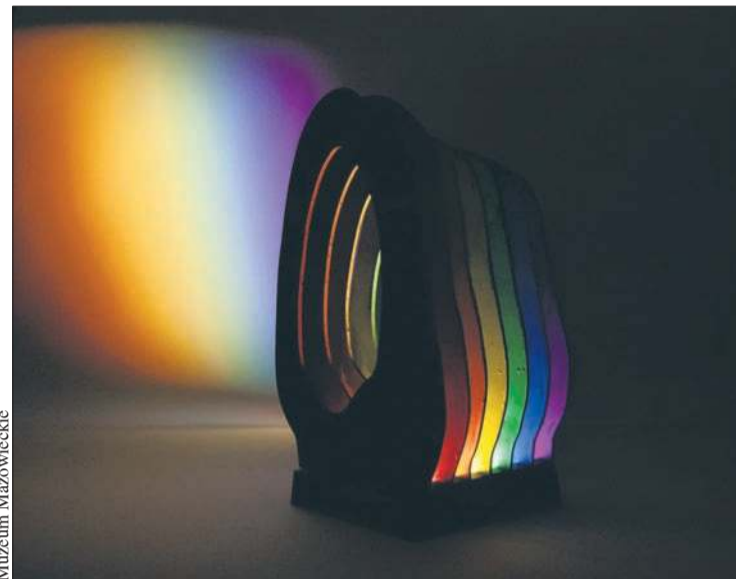
Rzeźby studentów Politechniki Łódzkiej zobaczymy przy Kolegialnej 6

Trwają zapisy na przeznaczony dla osób pełnoletnich warsztaty drzeworytu ludowego z Wojcie-