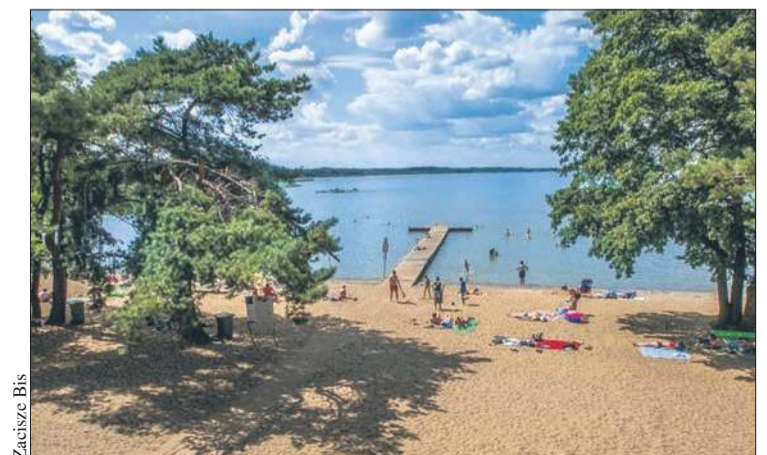
Plaża w Koszelówce należy do ulubionych miejsc wypoczynkowych mieszkańców powiatu płockiego

Lokalizacja w pobliżu dużych miast (Warszawa – 114 km, Łódź – 107 km