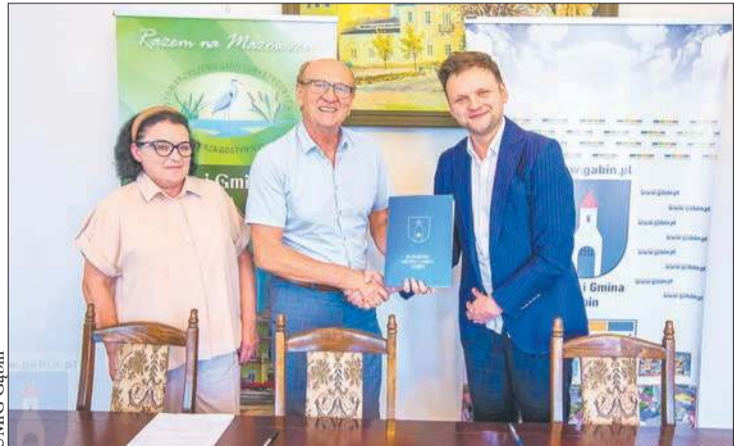
Burmistrz podpisał umowę na opracowanie planu ogólnego Miasta i Gminy

W Urzędzie Miasta i Gminy Gąbin podpisano cztery strategiczne umowy inwestycyjne o łącznej wartości około 7,5 mln zł. Umowy dotyczą trzech obszarów funkcjonowania samorządu. Chodzi o sport, planowanie przestrzenne oraz infrastrukturę komunalną.