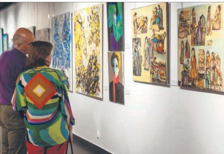
Wystawa zawiera ponad 80 prac 44 syryjskich artystów. Przeważa malarstwo, prezentujące różnorodne style: od realizmu po abstrakcję