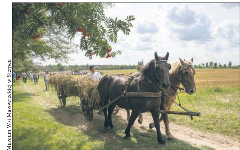
W niedzielę, 3 sierpnia odwiedzający MWM w Sierpcu będą mogli zobaczyć, jak wyglądały prace polowe w czasie żniw na dawnej wsi mazowieckiej

W Parku Traugutta trwa remont linii brzegowej stawu. Po kilku latach kiszka wiklinowa zużyła się i konieczna jest jej wymiana. To zabezpieczenie przed osypywaniem się ziemi otaczającej staw, jak również poprawa jego estetyki.