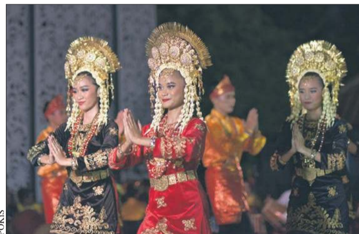
Indonezyjskie klimaty zaprezentuje gościom barwna grupa Karsa Seni Indonesia