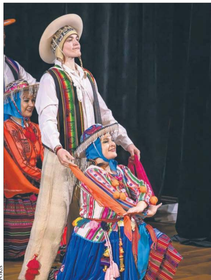
Podczas festiwalu wystąpi argentyński zespół Ballet Folklórico „Senderos Argentinos”