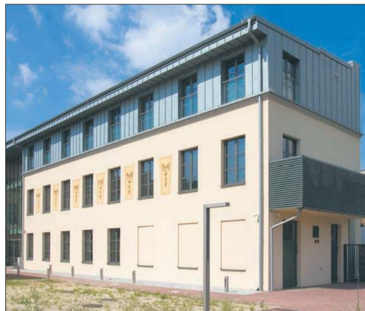
Nowa siedziba USC znajduje się na tyłach Pałacu Ślubów

Ściany zewnętrzne budynku będą odnowione i pomalowane, a ściana frontowa, z detalami ar-