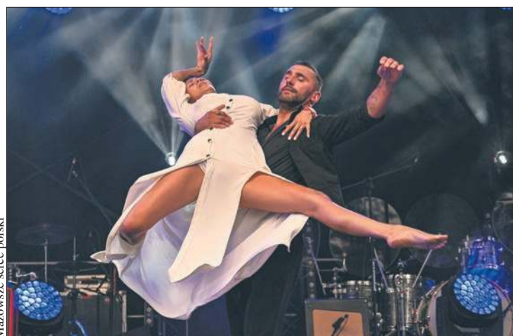
Koncert DeMono przyciągnął prawdziwe tłumy