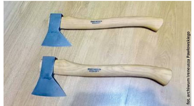
Siekierki na specjalne zamówienie - z toporzyskami wykonanymi z drewna hikorowego, które pozyskiwane jest z orzesznika. To wysoce ceniony i kosztowny materiał

Z tym opałem mam jednak spore problemy. To prawda – koks bardziej brudzi, wszędzie jest pełno pyłu. To zresztą wi-