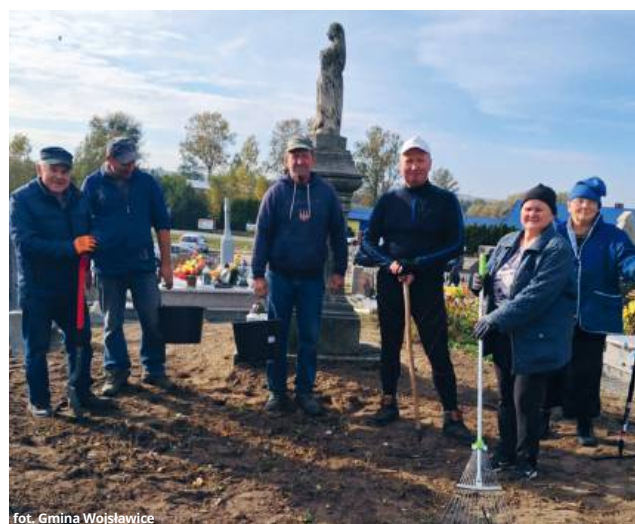
fol. Gmina Wojsławice

Zasadniczym celem przedsięwzięcia było uporządkowanie i zabezpieczenie nagrobków o znacznej wartości historycznej. Stanowią one niewątpliwie ważny element lokalnego dziedzictwa kulturowego. Wolontariusze zajęli się między innymi czyszczeniem kamiennych elementów z mchów i porostów, usunięciem zbędnej roślinności i wykonaniem podstawowych zabiegów zabezpieczających