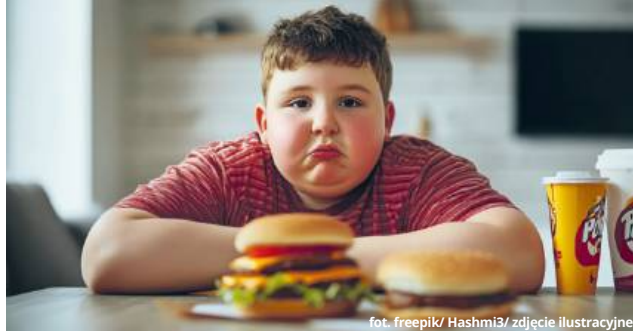
zdjęcie ilustracyjne

Tymczasem skutki są poważne: dzieci z nadwagą częściej mają problemy zdrowotne