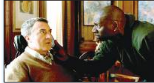
21.25 Nietykali - film obyczajowy, Francja 2011, reż. Olivier Nakache, Eric Toledano, wyk. Françoise Cluzet, Omar Sy, Anne Le Ny, Audrey Fleurot - Były skazaniec zostaje opiekunem niepełnosprawnego milionera. Przywraca mu radość życia.