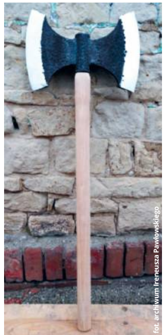
Jedno z niecodziennych zamówień - skandynawski topór