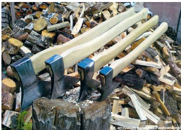
Siekierki większe i mniejsze - do różnych prac przy drewnie

- Tak... Kiedyś to był cały rytuał. Pamiętam, że do mojego dziadka przychodziło mnóstwo