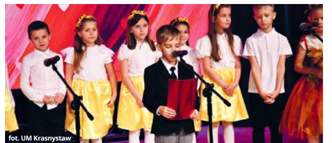
fol. UM Krasnystaw

Na scenie wystąpili uczniowie krasnostawskich szkół w tym Państwowej Szkoły Muzycznej im. Witolda Lutosławskiego. Młodzi artyści zabrali publiczność w barwną podróż przez wspomnienia i wyobraź-