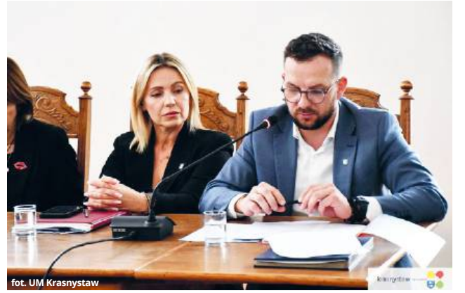
fol. UM Krasnystaw

burmistrz odniósł się również do kwestii mieszkalnictwa i potencjału turystycznego Krasnegostawu.