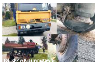
fol. KPP w Krasnymstawie

Podczas akcji funkcjonariusze Wydziału Ruchu Drogowego Komendy Powiatowej Policji w Krasnymstawie przeprowadzili 40 kontroli drogowych. W ich wyniku ujawniono aż 40 wykroczeń. - Najwięcej z nich dotyczyło