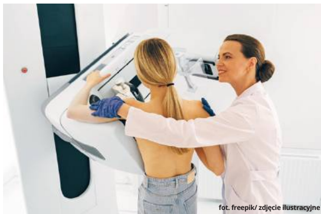
zdjęcie ilustracyjne

● REGION Do Włodawy i Gorzkowa Osady przyjadą mammbusy. To doskonała okazja, by wykonać bezpłatne prześwietlenie piersi.