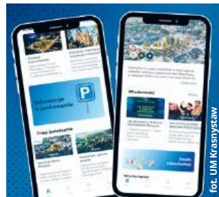
fol. UM Krasnystaw

Audioprzewodnik Tripplay przygotowano w dwóch wersjach językowych - polskiej i angielskiej - z możliwością łatwego rozszerzenia treści na inne języki. Tripplay to rozwiązanie wykorzystywane już przez 20 miast i gmin w Polsce, w tym wielu z regionu wschodniego i Lubelszczyzny. Warto dodać, że wśród miast znajdziemy także Chełm. Ta sieciowa korzyść wspiera turystykę regionalną,