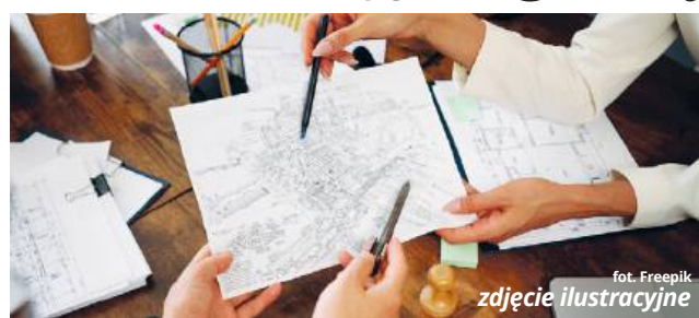
fol. Freepik zdjęcie ilustracyjne

- Nadanie nazw poszczególnym ulicom pozwoli nam przede wszystkim uporządkować numerację poszczególnych posesji. Przede wszystkim chodzi tutaj o zabudowę kolonijną. Zachęcam zresztą miejscowości, które funkcjonują w oparciu o taką kolonijną zabudowę, do podejmowania podobnych inicjatyw. Roztoka to już szósta miejscowość w naszej gminie,