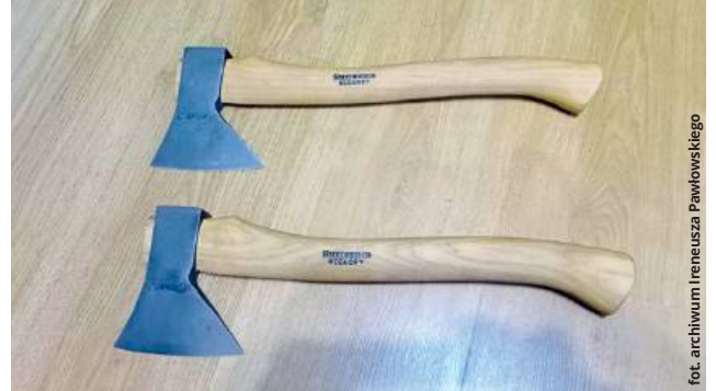
Siekierki na specjalne zamówienie - z toporzyskami wykonanymi z drewna hikorowego, które pozyskiwane jest z orzesznika. To wysoce ceniony i kosztowny materiał

Kuźnia Pawłowskiego stroni raczej od internetowych forów i popularnych dzisiaj mediów społecznościowych. Owszem, związani z branżą znawcy pole-