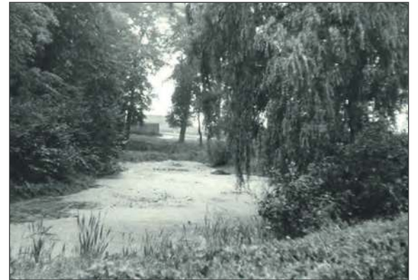
❖ W skład majątku w Podwierzbiu wchodził staw w zachodniej części parku