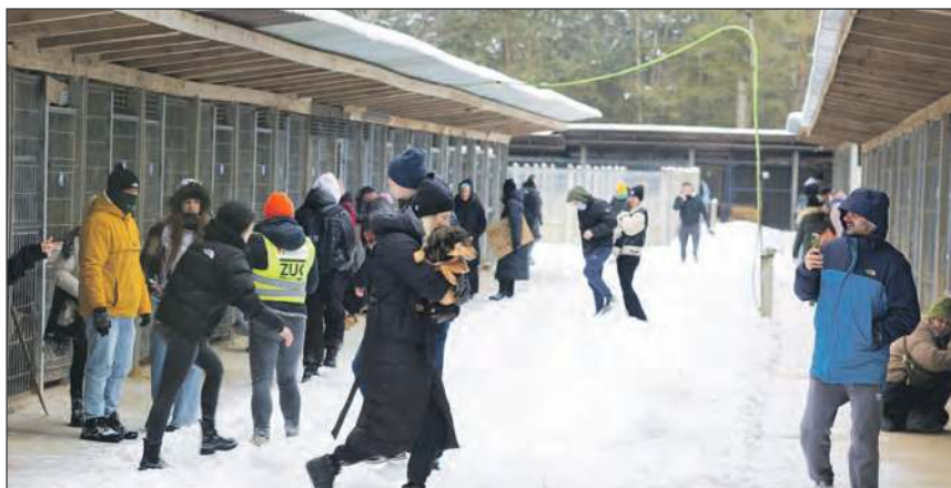
Po informacji, że schronisko zostało zamknięte, na jego teren kroczyli protestujący