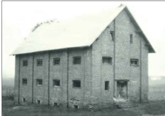
❖ Jednym z budynków gospodarskich majątku był spichlerz