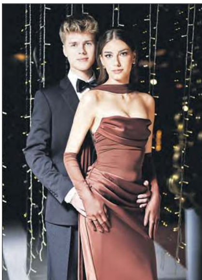
Maciej Pyza - Fotografia