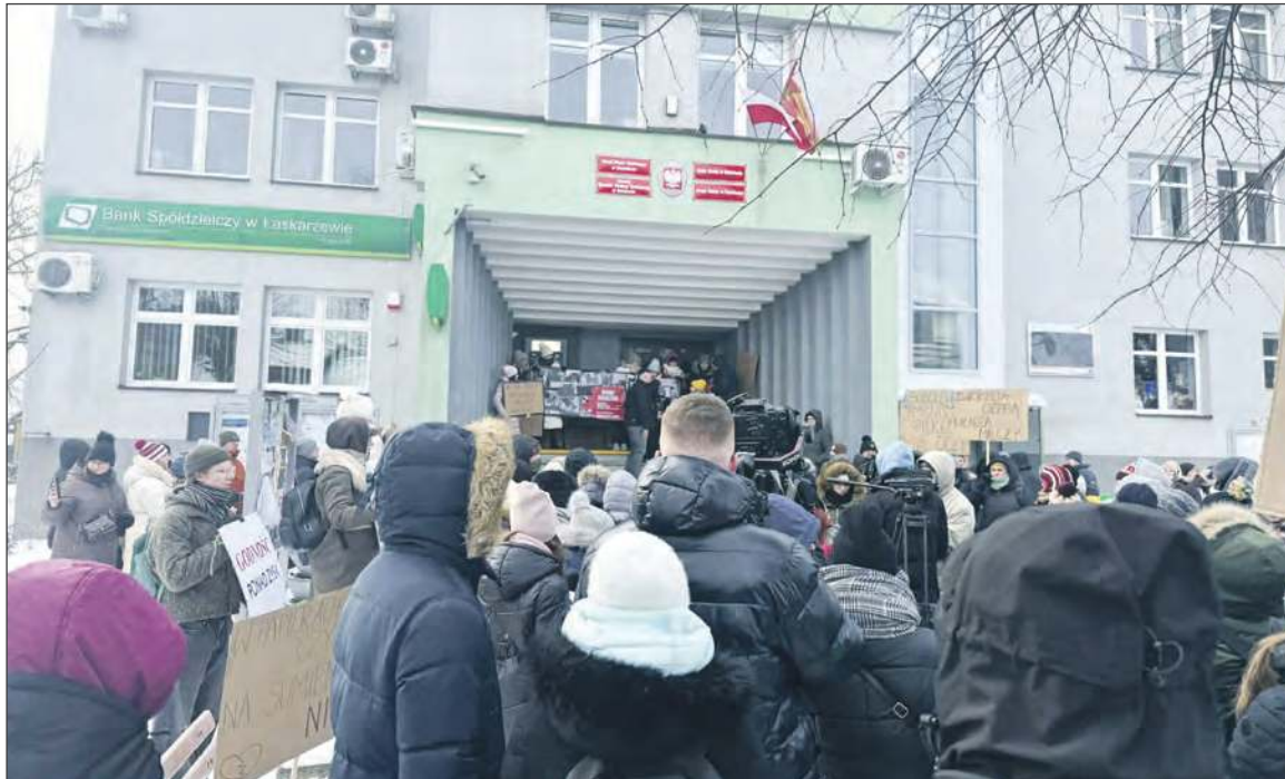
➡ Przed siedzibą Urzędu Gminy Sobolew odbyły się w ostatnim czasie dwa protesty przeciwko warunkom w schronisku Happy Dog w Nowej Krępie. Od ubiegłego poniedziałku sprawę placówki bada Najwyższa Izba Kontroli

Mieszkańcy powiatu wciąż żyją sprawą schroniska Happy Dog w Nowej Krępie. Po protestach i nagłym zamknięciu placówki pod koniec stycznia sprawą zajęła się Najwyższa Izba Kontroli. Kontrolerzy weszli już do Urzędu Gminy Sobolew. W planach jest także kontrola samego schroniska oraz Powiatowego Inspektoratu Weterynarii w Garwolinie.