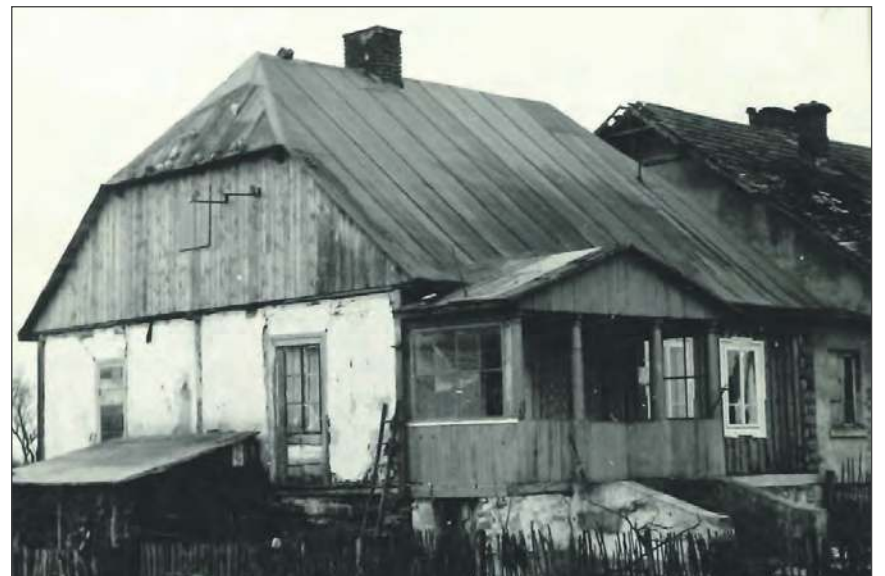
❖ Mimo niewielkiego rozmachu architektonicznego, dwór w Podwierzbiu prezentował się okazale