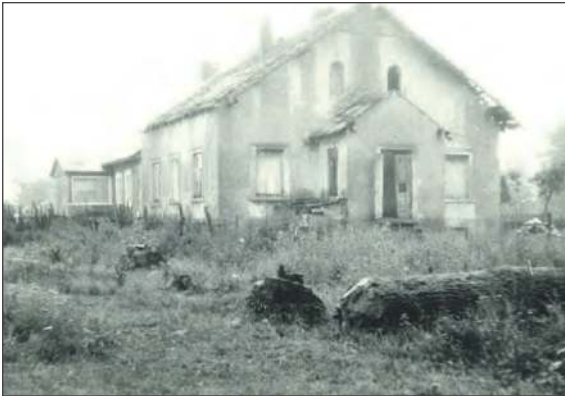
❖ Niestety czas zrobił swoje i z biegiem lat majątek ulegał stopniowej dewastacji