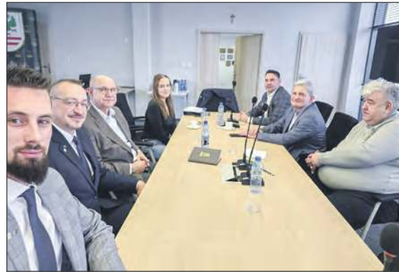
» Komisja Skarg, Wniosków i Petycji Rady Powiatu Garwolińskiego uznała za zasadną skargę dotyczącą zachowania starosty powiatu garwolińskiego

» Komisja Rady Powiatu Garwolińskiego przyznała rację skarżącym. Teraz sprawą zachowania starosty zajmie się cała rada powiatu