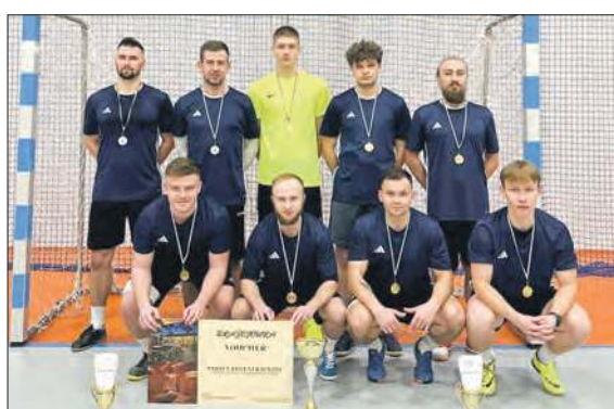
Lech Team - zwycięzca XII Futsal Areny

Turniej od fazy ćwierćfinałowej dostarczał wielu emocji. W meczu Boys - Sketch Nite padł remis 1:1, a o awansie zdecydowały rzuty