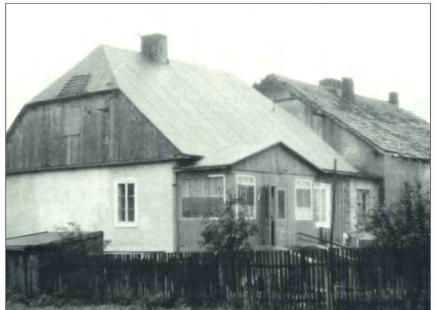
❖ Widok ogólny dworu od strony północno-wschodniej