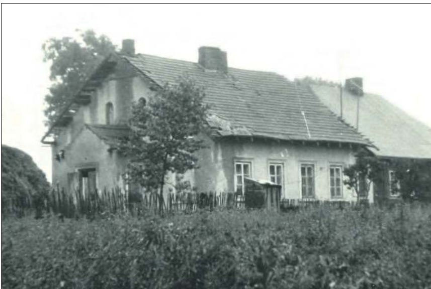
❖ Widok ogólny dworu od strony południowo-zachodniej (fot. A. Lubański, 1978 r., z archiwum WUOZ w Lublinie)