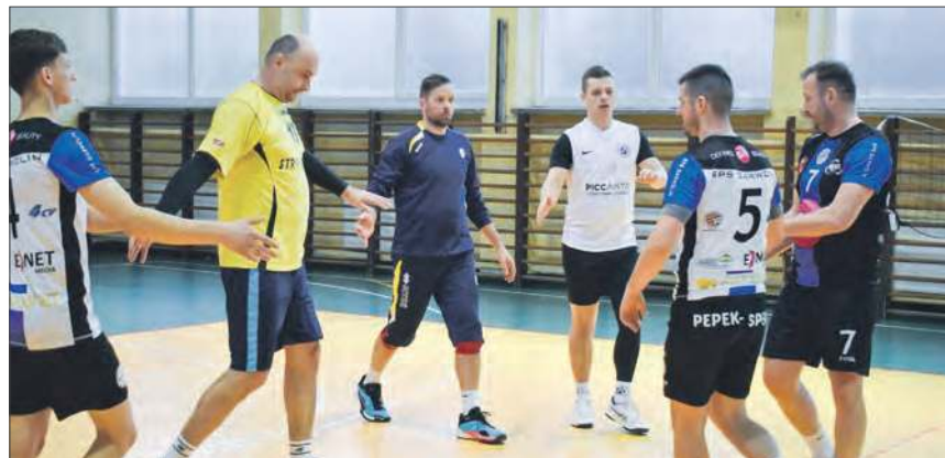
SPS 4CV Garwolinie pnie się w ligowej tabeli ALS

Kolejne sety przyniosły prawdziwą huśtawkę nastrojów. Oba zespoły szły punkt za punkt, a do okolic 20. punktu wynik niemal