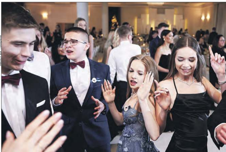
Pro-Foto Marcin Czajkowski