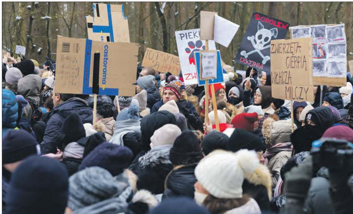
24 stycznia odbył się kolejny protest przeciwko funkcjonowaniu schroniska „Happy Dog”

W całym okresie współpracy ze schroniskiem „Happy Dog” z terenu gminy Ryki odłowiono 240 psów oraz 5 kotów. Placówka była wielokrotnie kontrolowana przez pracowników urzędu gminy oraz radnych. Podczas kontroli nie stwierdzono niczego niepokojącego, a wręcz przeciwnie - zachwalano warunki panujące w schronisku. Ostatnie dwie kontrole miały miejsce w grudniu i styczniu, czyli w czasie, gdy coraz częściej podnoszono wątpliwości co do prawidłowego funkcjonowania placówki. Temat był omawiany podczas ubiegłotygodniowej sesji rady miejskiej.