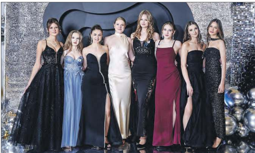
Maciej Pyza - Fotografia