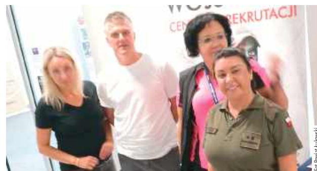
Mobilny Punkt Rekrutacyjny Wojskowego Centrum Rekrutacji w Białej Podlaskiej, w którym można było uzyskać informacje dotyczące służby wojskowej i procedur naboru do Sił Zbrojnych RP