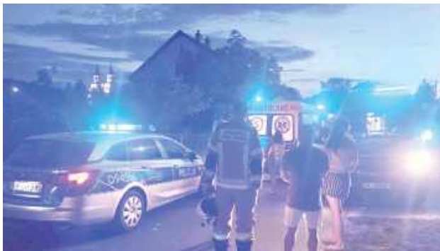
W wyniku zdarzenia nastolatki doznały obrażeń i zostały przetransportowane do szpitali – jedna do Siedlec, druga do Warszawy

Według wstępnych ustaleń policji 12-letnia mieszkanka gminy Wola Mysłowska, kierując hulajnogą elektryczną, przewoziła swoją 14-letnią koleżankę z gminy Żelechów. W pewnym momencie, w nieustalonych dotąd okolicznościach, obie dziewczynki straciły panowanie nad