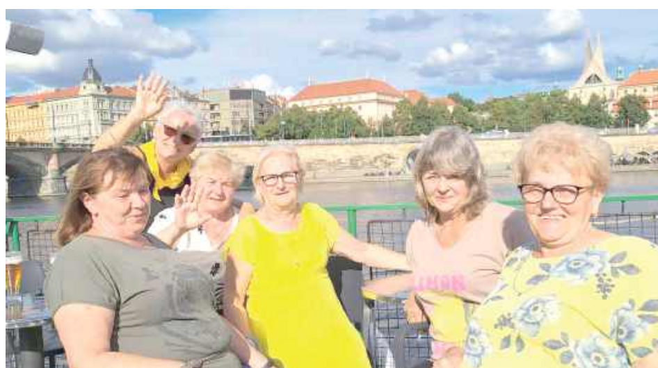
Niezapomniany rejs po Wełtawie w Pradze

Fot. Teraz pora na Seniora Klub Seniora Gminy Łuków