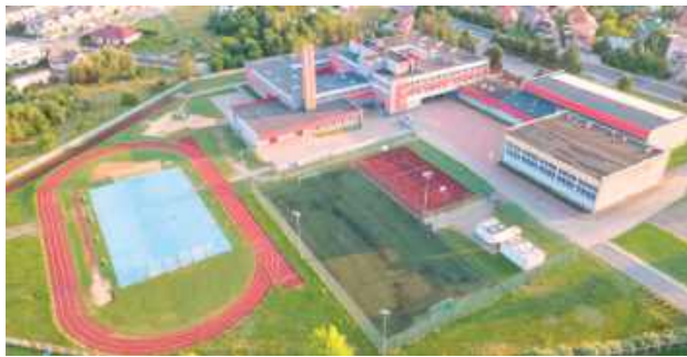
Całkowity koszt inwestycji szacowany jest na blisko 1 mln zł

Miasto Łuków otrzymało dofinansowanie w wysokości 499 500 zł z Ministerstwa Sportu i Turystyki na kompleksową modernizację kompleksu sportowego przy Szkole Podstawowej nr 5 w Łukowie.