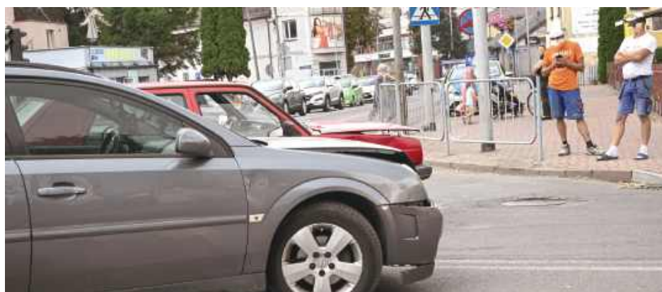
Do kolizji doszło w centrum Łukowa, na skrzyżowaniu ulic Partyzantów i Wyszyńskiego