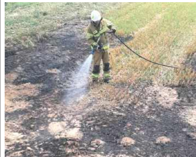
Zdarzenie miało miejsce 24 sierpnia