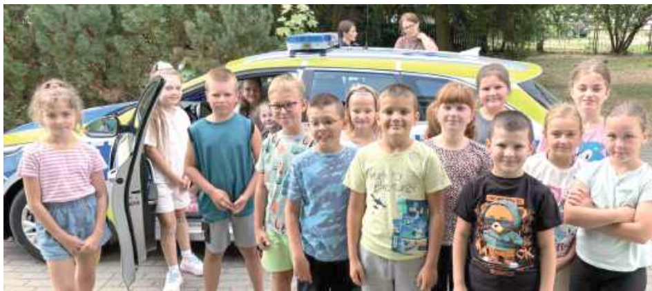
Uczniowie z ciekawością obejrżeli wnętrze radiowozu

Wraz z początkiem września uczniowie klas 1–3 Zespołu Szkół w Gołaszynie wzięli udział w niezwyklej lekcji bezpieczeństwa. Pla-