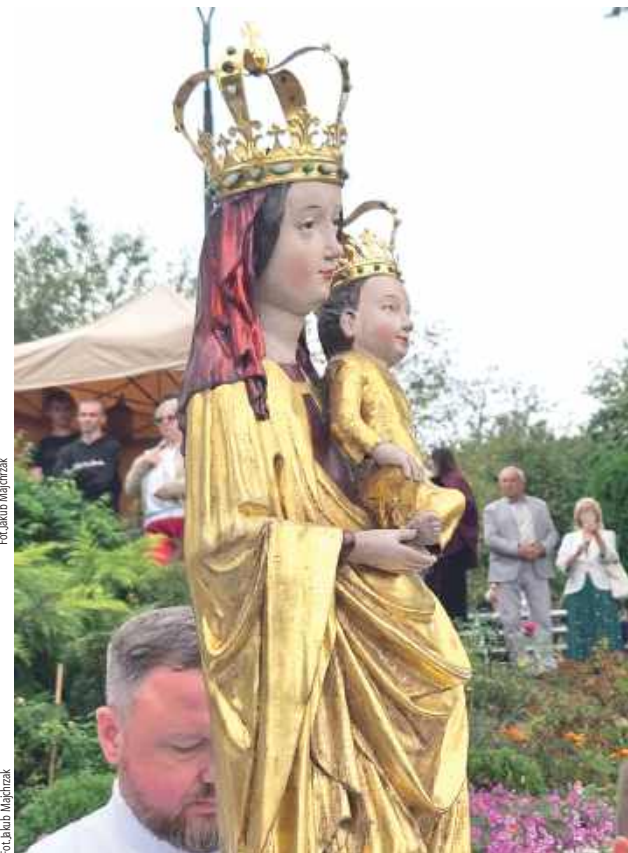
Cudowna figura Matki Bożej Kębelskiej znana jest z wielu cudów. W tym roku w księdze cudów zapisano kolejne cztery