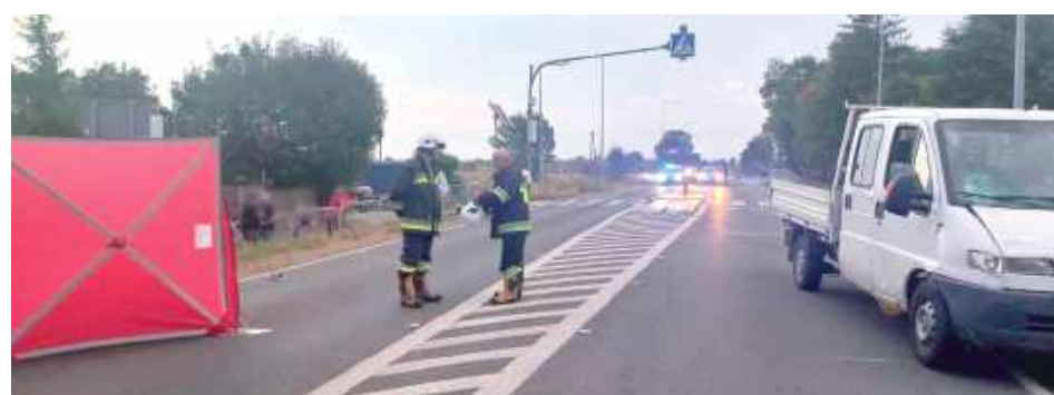
Śmiertelne potrącenie w powiecie lubartowskim

Do zdarzenia doszło około godziny 18:00 w piątek, 5 września, na drodze krajowej nr 48 Kock - Moszczanka. W miejscowości Poizdów, kierujący fiatem ducato 39-latek potrącił pieszego na prostym odcinku drogi. Niestety życia 78-lataka z gminy Kock nie udało się uratować. Mężczyzna zmarł na miejscu zdarzenia. Lubartowscy policjanci dodali,