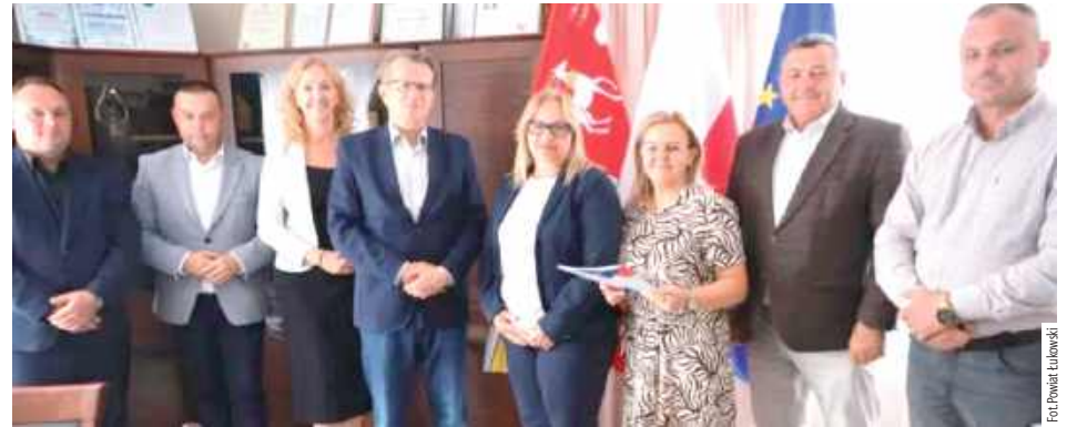
Wsparcie finansowe otrzymały trzy organizacje Koło Gospodyń Wiejskich „Stoczkowianki” a także dwie jednostki Ochotniczej Straży Pożarnej w Kopinie i w Popławach-Rogalach

W Starostwie Powiatowym w Łukowie podpisano umowy w ramach tzw. małych grantów. Dokumenty sygnowali przedstawiciele Zarządu Powiatu Łukowskiego.