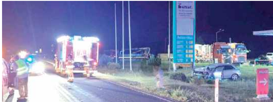
W czasie działań służb droga była całkowicie zablokowana. Policja wyznaczała objazdy

Na miejscu interweniowały dwa zastępy z JRG PSP w Łukowie, strażacy z OSP Łazy, ze-