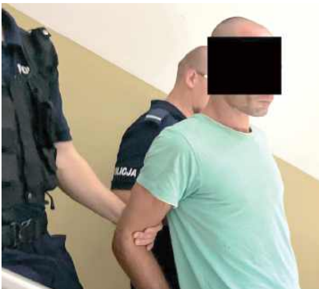
Mężczyzna ma zakaz zbliżania się z matką. Będzie odpowiadał za posiadanie środków odurzających

- Na widok funkcjonariuszy mężczyzna oświadczył, że ich nie zapraszał i nie ma zamiaru wykonywać ich poleceń. Bardzo szybko okazało się, że nie tylko musi ich wpuścić do pokoju, ale