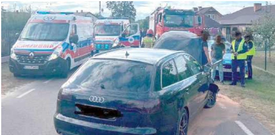
W wyniku kolizji jedna osoba została poszkodowana

W niedzielę, 24 sierpnia w powiecie łukowskim doszło do groźnego zdarzenia drogowego, gdzie interweniowali strażacy, policja oraz zespoły ratownictwa medycznego.