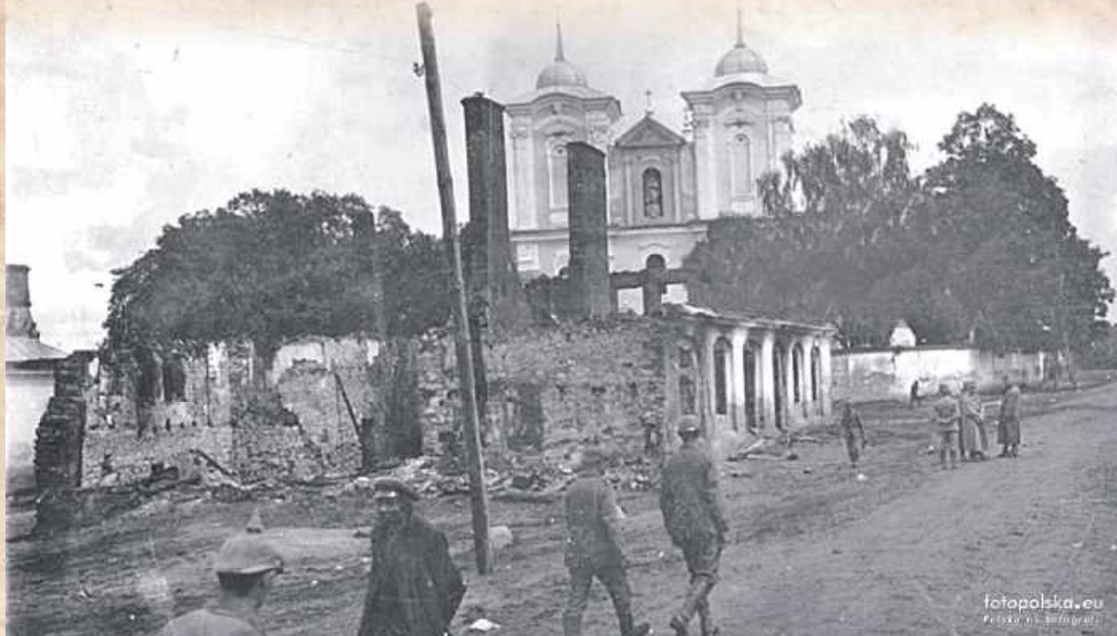
Sto dziesięć lat temu Końskowola niemal w całości przestała po prostu istnieć. Wycofujący się Rosjanie podpalili miasteczko, swoje zbroje zniszczenia w trakcie walk. Poza kościołem (który stracił dzwonnice) zrównano z ziemią 326 z 333 zewidencjonowanych budynków. Zdjęcie wykonane w sierpniu - wrześniu przez niemieckich żołnierzy znaleźliśmy na portalu www.fotopolska.eu