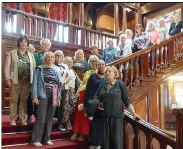
Zapraszają seniorów z Łukowa do zapisów. Przed uczestnikami zajęć wycieczki, warsztaty, prelekcje oraz ciekawe spotkania z ekspertami

W trakcie wydarzenia zaplanowany jest koncert zespołu Główny Zawór Jazzu – ośmioosobowego składu z Poznania, który nada największym polskim przebojom niebanalne, jazzowe brzmienie, czerpiąc inspiracje ze swingu, bluesa, latin, soulu i R&B. Usłyszeć będzie można reinterpretacje