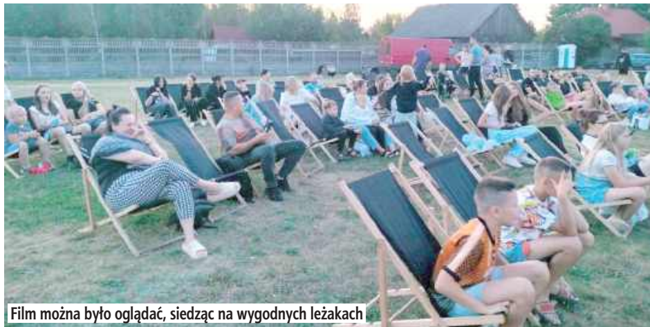
Film można było oglądać, siedząc na wygodnych leżakach

Seans filmowy przyciągnął wielu mieszkańców – najmłodszych, młodzież, dorosłych i całe rodziny. Organizatorzy zadbał o wyjątkową atmosferę: dla pierwszych stu gości przygotowano wygodne leżaki, a pozostali widzowie przynieśli ze sobą własne kocyki i krzeselka. Dzięki temu boisko w Kryncie zamieniło się w prawdziwe kino pod gwiazdami.