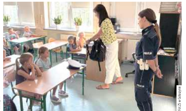
Pani policjantka z Wydziału Ruchu Drogowego opowiedziała dzieciom, jak bezpiecznie zachowywać się w drodze do szkoły

Największą atrakcją była możliwość obejrzenia policyjnego radiowozu z bliska.