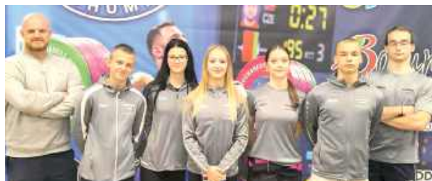
Dzięki solidnym występom, Olimpijczyk Łuków zajął trzecie miejsce w klasyfikacji drużynowej całego turnieju

miejsce, co jest świetnym wynikiem w silnie obsadzonej grupie. Startując z wagą 57,9 kg, zaliczył cztery z sześciu prób, a jego łączny wynik 144 kg pozwolił mu uplasować się tuż za podium.