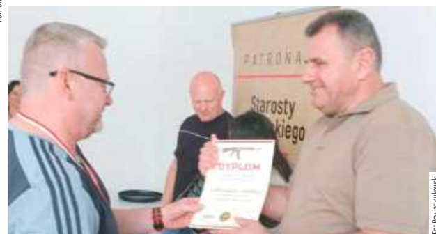
Nagrody dla zwycięzców sfinansowano z dotacji Powiatu Łukowskiego w ramach zadania związanego ze wspieraniem i upowszechnianiem kultury fizycznej i sportu