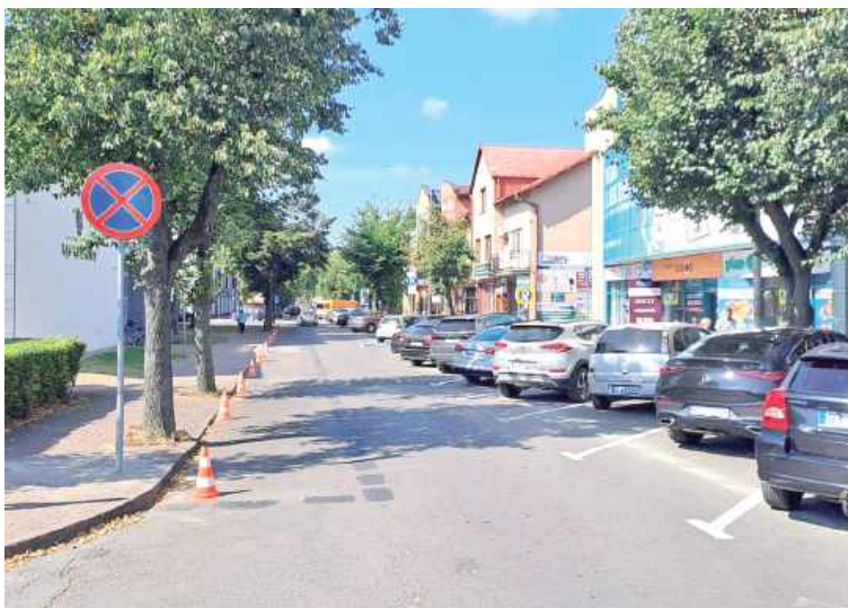
Aktualnie postój pojazdów na części ul. Staropijarskiej, zgodnie z oznakowaniem pionowym i poziomym, możliwy jest jedynie po prawej stronie drogi jednokierunkowej

W tej sprawie skontaktowaliśmy się z łukowską Policją.