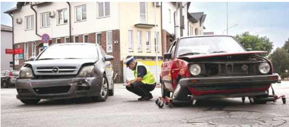
Oboje kierujący pojazdami byli trzeźwi

77-letni mieszkaniec Łukowa, kierujący samochodem marki Volkswagen Golf, wyjeżdżając z ul. Cieszkowizna, nie zastosował się do sygnalizacji świetlnej i nie ustąpił pierwszeństwa przejazdu. W wyniku tego uderzył w samochód marki Opel Vectra, którym kierowała 35-letnia mieszkanka Łukowa. Kobieta została przewieziona do szpitala, jednak po badaniach okazało się, że nie doznała żadnych obrażeń ciała. Sprawca kolizji - 77-letni kierowca - został ukarany mandatem karnym. Badanie alkomatem wykazało, że oboje uczestnicy zdarzenia byli trzeźwi.