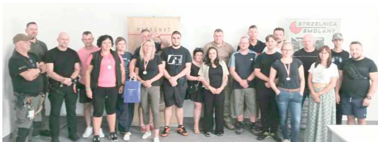
W rywalizacji uczestniczyło 24 zawodników, którzy startowali w trzech konkurencjach

30 sierpnia na strzelnicy w Radoryżu Smolanym odbył się Turniej Strzelecki „Letni Kaliber Smolany-2025”.