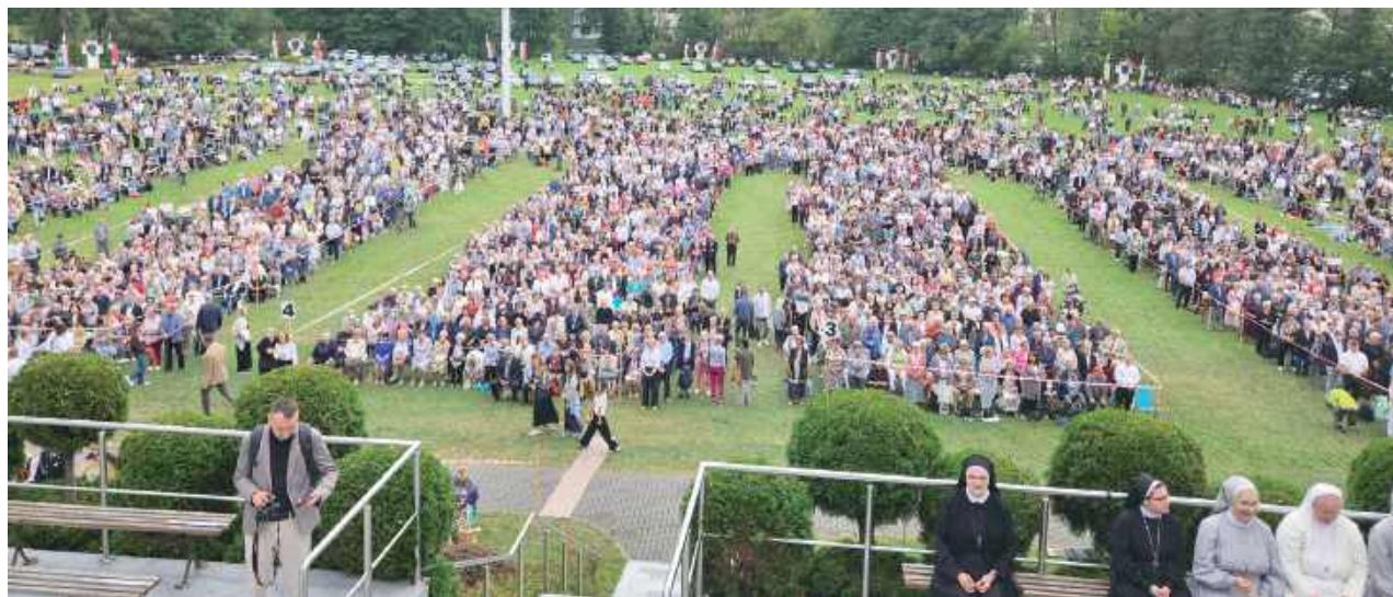
Pielgrzymi jak co roku licznie zgromadzili się na wąwolnickich błoniach