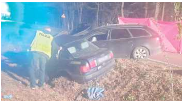
Ze wstępnych ustaleń policjantów wynikało, że 63-letnia kierująca audi 80 kobieta z gminy Łuków podczas włączania się do ruchu została uderzona przez samochód audi A6. Za jego kierownicą siedział 19-latek z gminy Ulan Majorat

POW. ŁUKOWSKI: W połowie kwietnia br. na drodze krajowej nr 63 w miejscowości Dminin zderzyły się dwa auta marki Audi. Wypadku nie przeżyła kierująca jednym z samochodów - 63-latką z gminy Łuków. Śledczy zamknęli już śledztwo, ale to nie koniec sprawy.