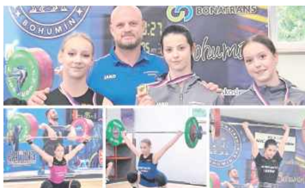
Nasze dziewczęta zdobyły dwa złote medale oraz jeden brązowy