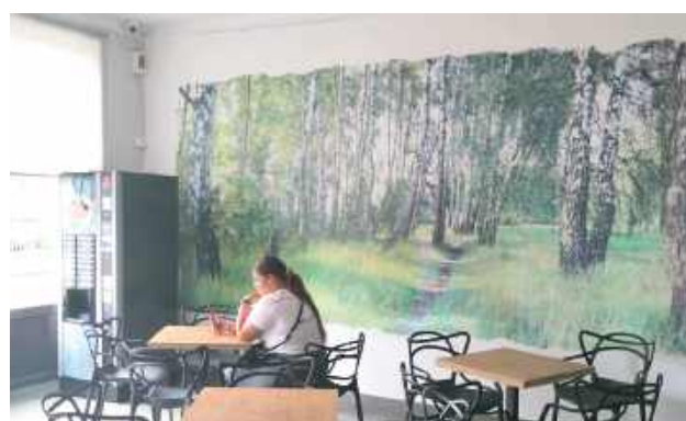
Przeprowadzono remont pomieszczenia i wykonano druk ścian

Od września uczniowie Zespołu Szkół nr 1 im. Henryka Sienkiewicza w Łukowie mogą korzystać z wyjątkowej przestrzeni – strefy relaksu, która powstała w „Alejach”. To miejsce inspirowane naturą, sprzyjające wyciszeniu, odpoczynkowi i regeneracji sił.