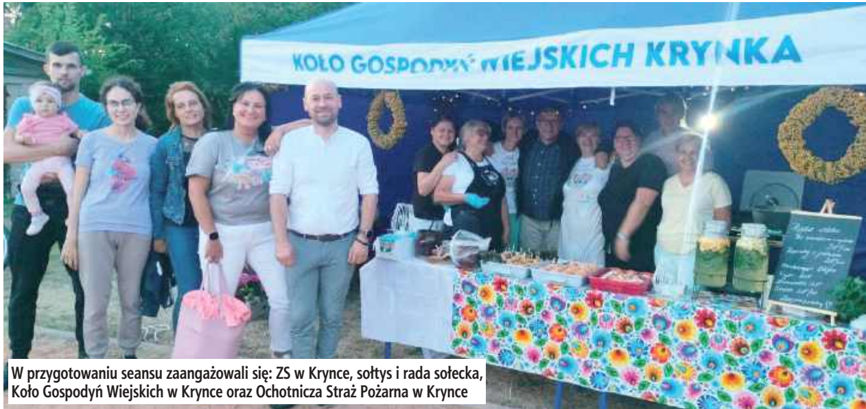
W przygotowaniu seansu zaangażowali się: ZS w Kryncie, sołtys i rada sołecka, Koło Gospodyń Wiejskich w Kryncie oraz Ochotnicza Straż Pożarna w Kryncie