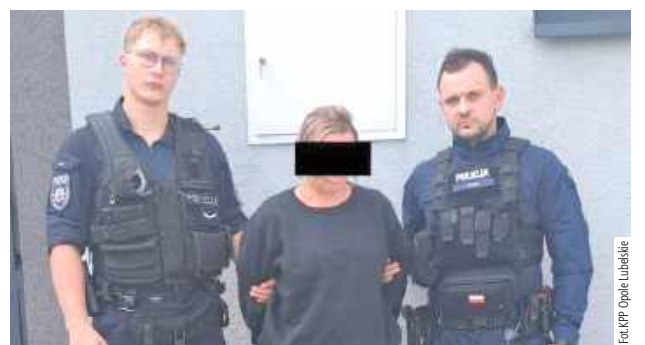
W minioną środę, 3 września, kobieta ukradła ze sklepu jubilerskiego trzy złote łańcuszki o wartości kilku tysięcy złotych. Jak się okazało, nie była tam pierwszy raz - rok wcześniej w tym samym miejscu wyniosła kolejny, równie cenny naszyjnik

Bezczelność i brak skrupułów - tak można określić zachowanie 46-letniej mieszkanki Chełma, która postanowiła wzbogacić się kosztem jubilera z Poniatowej. W minioną środę, 3 września, kobieta ukradła ze sklepu jubilerskiego trzy złote łańcuszki o wartości kilku tysięcy złotych. Jak się okazało, nie była tam pierwszy raz - rok wcześniej w tym samym miejscu wyniosła kolejny, równie cenny naszyjnik.