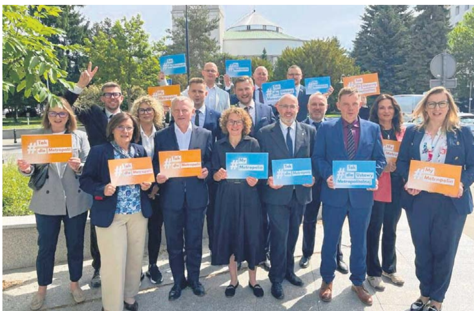
Przedstawiciele Pomorza w Sejmie, w czasie głosowania nad ustawą metropolitalną

Tymczasem Jacek Karnowski z KO, wiceminister funduszy i polityki regionalnej, daw-