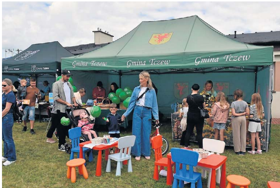
Gmina Tczew przygotowała dla dzieci prezenty-niespodzianki