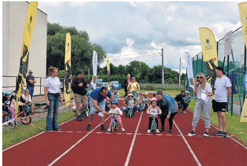
W zawodach wzięło udział niemal 200 dzieci w wieku od 3 do 8 lat

Choć pogoda nie zapowiadała się najlepiej, to dla nas wyszło słońce! Zrobiło się niezwykle ciepło. Na ochłodę każdy