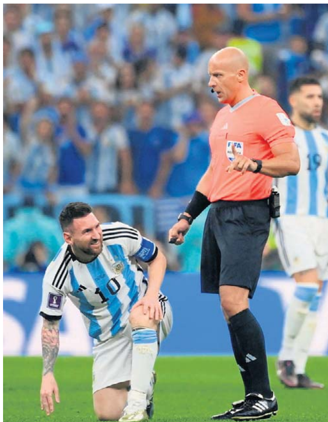
Szymon Marciniak sędziował Lionelowi Messiemu m.in. w finale mistrzostw świata 2022 Argentyna - Francja

Przygotowania do mundialu Marciniak zaczął już kilka miesięcy temu, zanim dowiedział się, że w ogóle otrzyma zaproszenie. W grudniu przeszedł zabieg kontuzjowanej nogi. Potem oszczędzał się w PKO Ekstraklasie. Aż w ostatnim dniu maja wyfrunął na zgrupowanie do Stanów Zjednoczonych. W wywiadzie