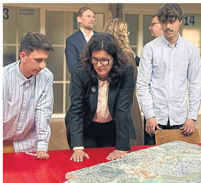
Podczas konferencji zaprezentowano wizję dla projektu „Gdańsk Nowe Południe”