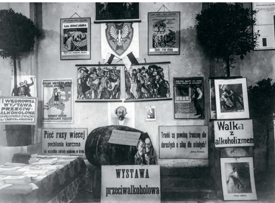
NARODOWE ARCHIWUM CYFROWE X2