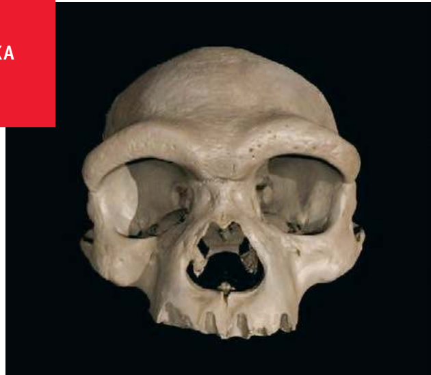
Czaszka z Harbinu, 140-300 tys. lat (linia denisowian)