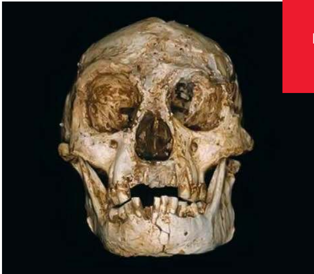
Homo floresiensis , 60-100 tys. lat (hobbit z Flores)