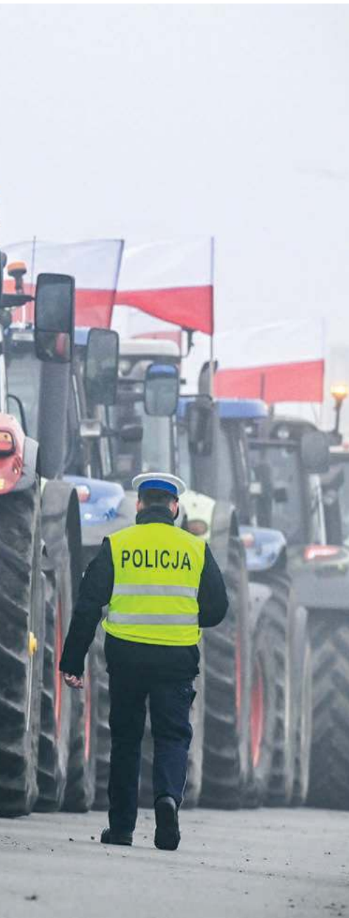
Protest rolników „Nie dla Mercosur” w Nowym Dworze Gdańskim, 18 grudnia 2025 r.

uczestniczyła w jednolitym rynku, nasze PKB per capita (wg parytetu siły nabywczej) byłoby w 2022 r. niższe o 39,6 proc.