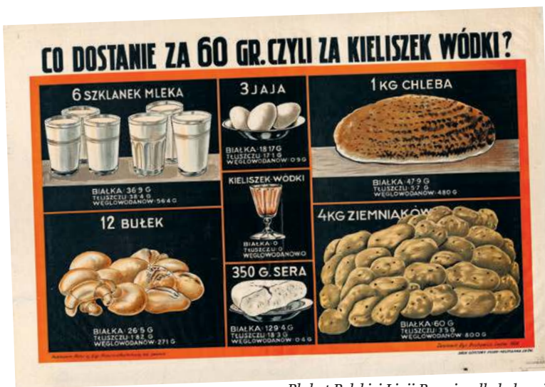
Plakat Polskiej Ligi Przeciwalkoholowej z 1928 r.