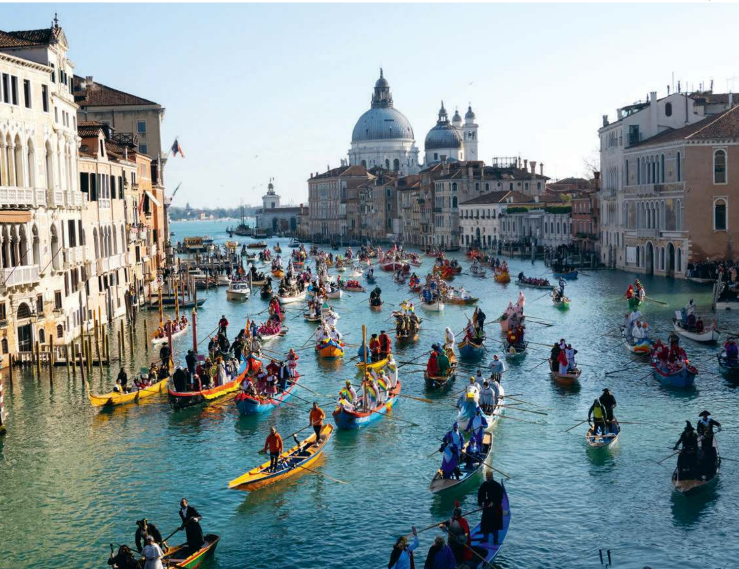
Karnawał w Wenecji, 1 lutego 2026 r.

Wizyta trwała może dwie i pół minuty: podpisaliśmy dokumenty i to wszystko – opowiada.