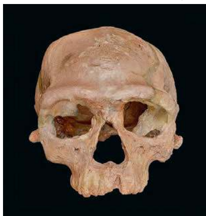
Czaszka z Jabel Irhud, 300 tys. lat (wczesny Homo sapiens )

Wyniki ułożyły się w trzy linie ewolucyjne – związane z H. sapiens , neandertalczykami i denisowianami –