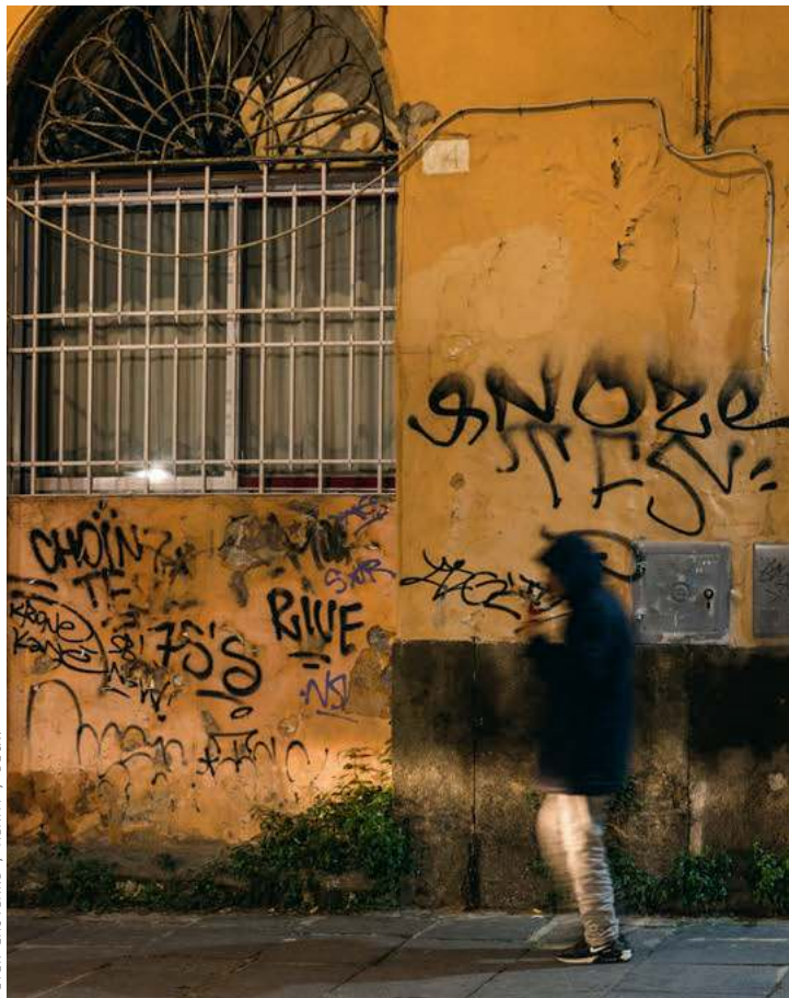
PETER EASTLAND / ALAMY / BE&amp;W

Wielkie bum po ostatniej partii Epstein files to jest nic w porównaniu z tym, co się rozpetęło po odkryciu sprzed tygodnia, że w pewnej gazecie indonezyjskiej z 1939 r. druko-