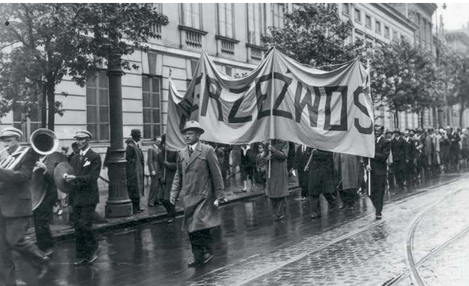
Pochód Polskiego Towarzystwa Walki z Alkoholizmem „Trzeźwość” w Warszawie, 1934 r.

popularne stały się metody statystyczne. Do świadomości elit przebiły się zaś medyczne spojrzenie na alkoholizm, teoria Darwina i inne osiągnięcia genetyki. Podążając za modą na ekonomię polityczną, publicyści co rusz przeliczali wypitą wódkę na zmarnowane dniówki, a zmarnowane dniówki uznawali za przyczynę klęsk historycznych i nadchodzących.