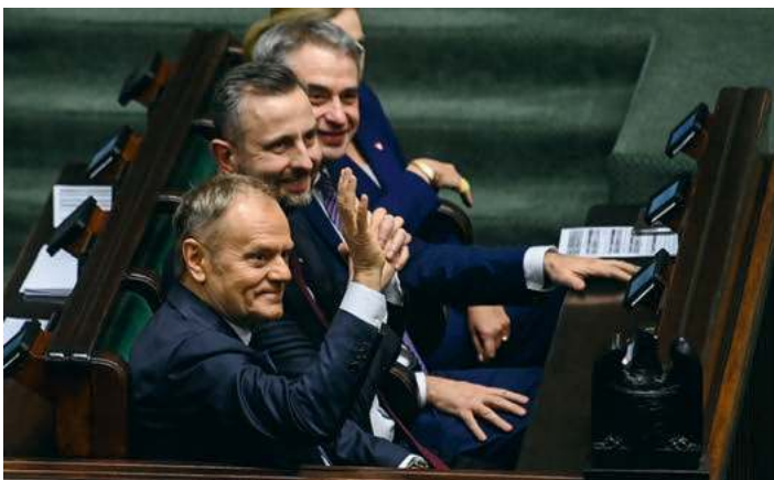
Donald Tusk, Władysław Kosiniak-Kamysz i Krzysztof Gawkowski w Sejmie. Warszawa, 17 grudnia 2025 r.

Media i tak ledwo wiążą koniec z końcem. Większość przychodów z reklam odpłynęła do platform, które nie produkują reportaży międzynarodowych ani śledztw kontrolujących władzę. Za to ich właściciele decydują, jak promować treści użytkowników i dystrybuować płynące z nich zyski. Nie trzeba więc wszędzie dokonywać czystek, jak w „Washington Post”. Wystarczy zagłodzić media i przekonywać, że TikTok, X czy Instagram są lepszą alternatywą. To nie jest tylko problem USA. ©