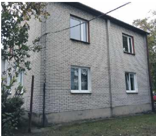
Gomulin, ul. Trybunalska 10

równości szans i niedyskryminacji poprzez unikanie wzmacniania stereotypów płciowych. Projekt nie będzie wpływał na dyskryminację jakiegokolwiek grupy społecznej. Z efektów jego realizacji będą mogły korzystać wszystkie osoby, w tym osoby z niepełnosprawnościami.