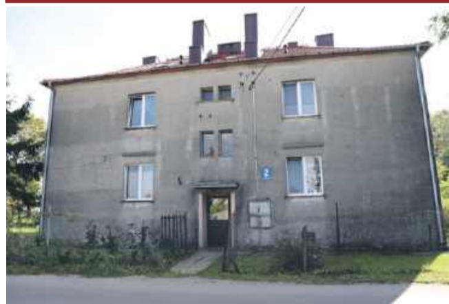
Wola Krzysztoporska ul. Piotrkowska 2