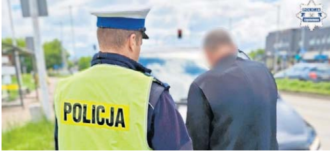
Kierowcy grożą surowe konsekwencje prawne

Z relacji zgłaszającego wynikało, że samochód pogrzeboby jechał slalomem, zjeżdżając od krawężnika do krawężnika i stwarzając bezpośrednie zagrożenie dla życia i zdrowia innych uczestników ruchu drogowego. Choć czujny świadek po pewnym czasie stracił Mercedesa z oczu, policyjne patrole na-