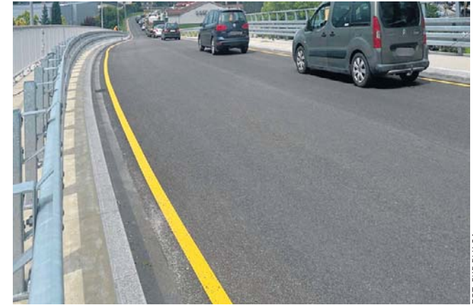
Nowo wybudowany 166-metrowy obiekt zastąpił przejazd na ulicy Bielskiej

trakcyjnej, co wpłynie na podniesienie prędkości pociągów pasażerskich do 160 km/h i towarowych do 120 km/h. Zwiększy się bezpieczeństwo przejazdów na 25 przebudowywanych lub modernizowanych obiektach inżynierskich. Kluczowym obiektem powstającym na tym odcinku jest nowy, 600-metrowy most kolejowy w Zebrzydowicach, który skoryguje przebieg linii i usprawni przejazd pociągami od granicy z Czechami w kierunku Czechowic-Dziedzic, Bielska-Białej i Katowic - podkreśla Hamarnik.