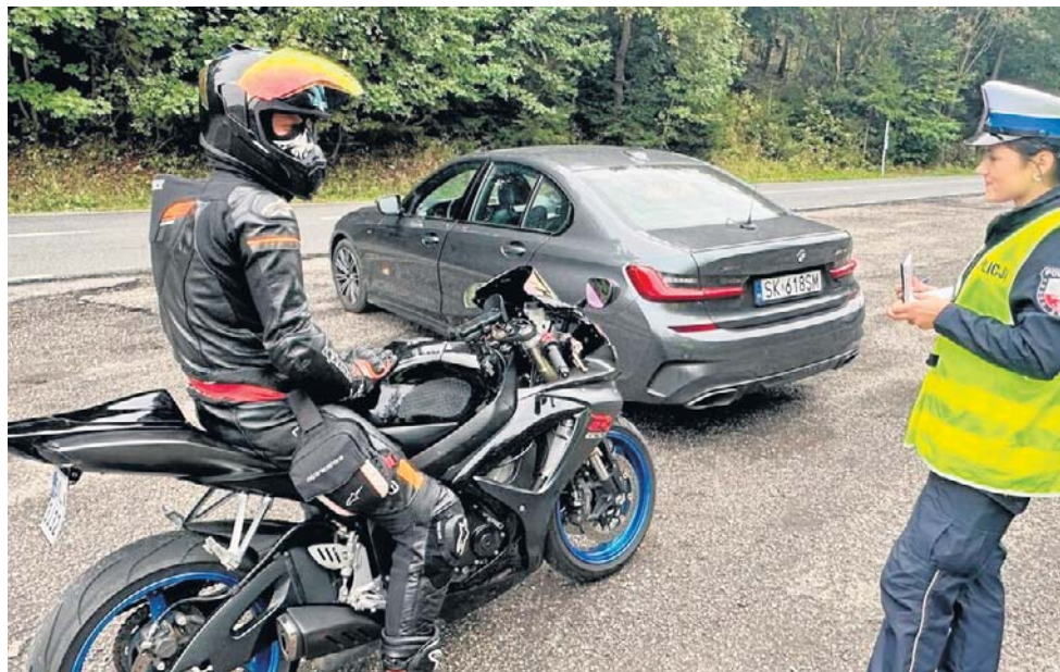
Policja wzmoczyła kontrole motocyklistów. Mundurowi zwracają uwagę nie tylko na przekraczanie dozwolonej prędkości, ale również na stan techniczny pojazdów

Apel mieszkańców wywołał oburzenie części środowiska motocyklowego. Pod artykułem na facebookowym profilu „Dziennika Zachodniego” pojawiły się dziesiątki mniej lub bardziej kulturalnych komentarzy motocyklistów przekonujących