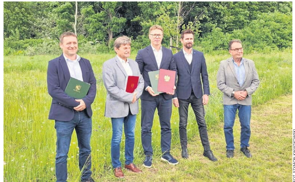
Władze Świętochłowic podpisały umowę na rekultywację hałdy przy stawie Kalina

– Zanieczyszczenie, które dotknęło staw, było spowodowane znajdującą się obok hałdą. Przez kilkadziesiąt lat substancje zanieczyszczające przedostawały się