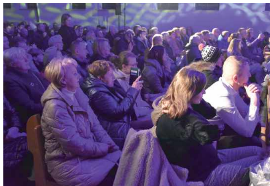
Koncert stanowił prawdziwą muzyczną ucztę! Wstęp był wolny – w świątyni zgromadziły się tłumy amatorów wokalnych wrażeń z miejscowej parafii oraz okolicznych miejscowości