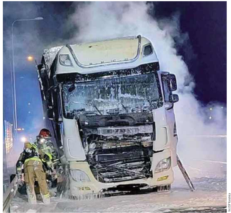
ok W pożarze nikt nie ucierpiał

JRG Garwolin, JRG Ryki, OSP Korytnica, OSP Trojanów, OSP Kozice oraz OSP Wola Korycka.