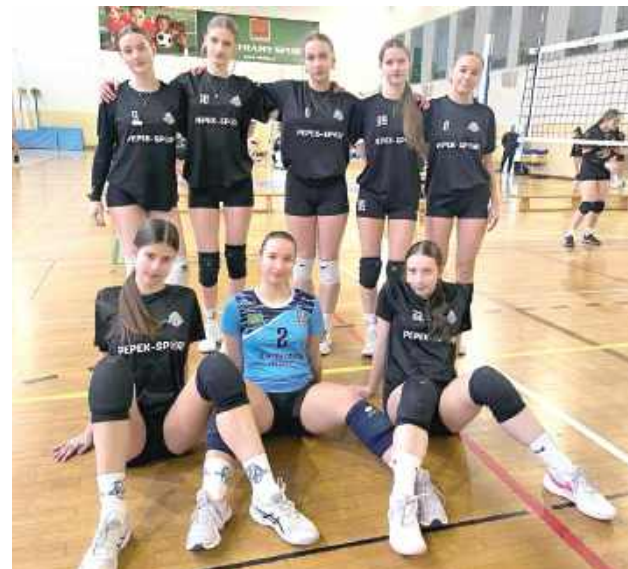
Kadetki Sępa zajęły trzecie miejsce na turnieju w Białej Podlaskiej, mierząc się z bardzo silnymi rywalkami

Po niezwykle zaciętych spotkaniach w obydwu przypadkach były słabsze w trzecim secie, najpierw od organizatorek