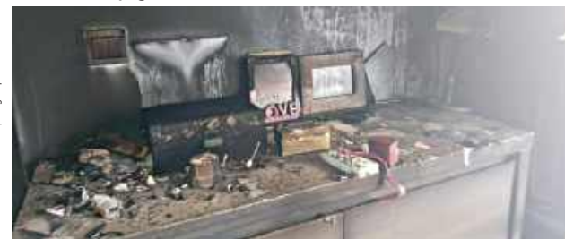
Zniszczenia są tak poważne, że budynek musi zostać całkowicie rozebrany