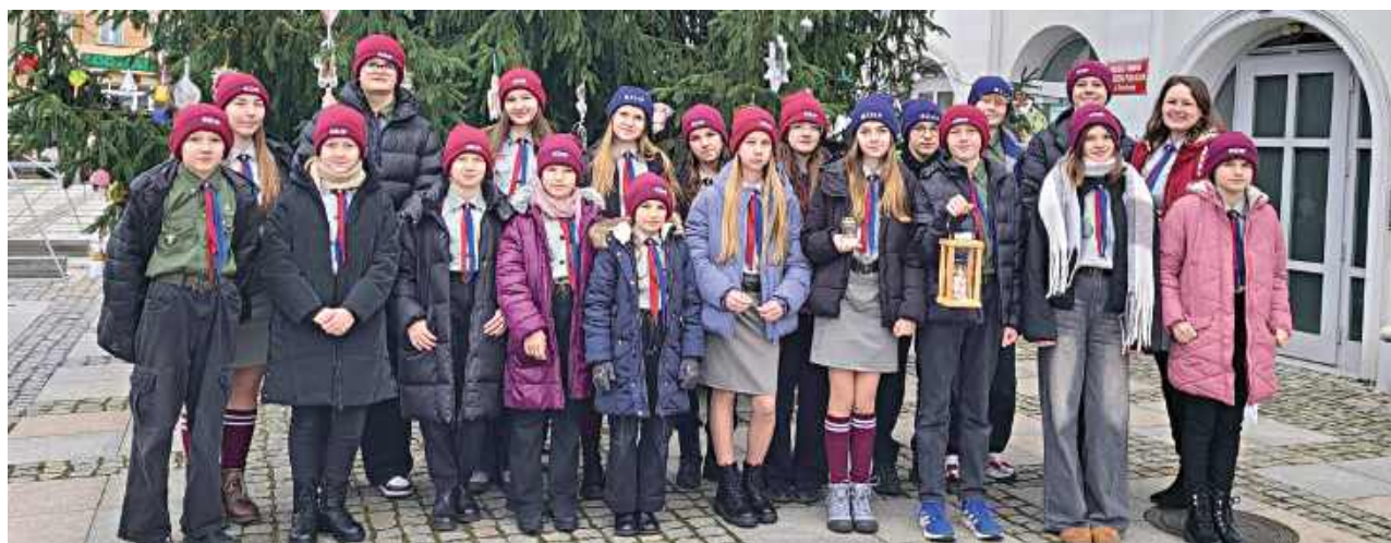
Harcerze z Żelechowa podtrzymują piękną tradycję dzielenia się Betlejemskim Światłem

Jak każdego roku, 11 Drużyna Harcerska w Żelechowie przekazała Betlejemskie Światło Pokoju do Urzędu Miejskiego w Żelechowie, szkół, lokalnych instytucji i organizacji, aby ten wyjątkowy płomień – znak pokoju, nadziei i braterstwa – mógł dotrzeć do jak najszerszego grona mieszkańców. Tegoroczne hasło Betlejemskiego Światła Pokoju brzmi „Pielęgnuj dobro w sobie”, przypominając,