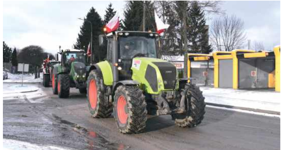
Rolnicy ustawiali oflagowane ciągniki i pojazdy rolnicze wzdłuż dróg o dużym natężeniu ruchu oraz na wiaduktach. Wcześniej przejechali ulicami Ryk

Kilkudziesięciu rolników z powiatu ryckiego oraz sąsiednich gmin wzięło udział w zorganizowanym proteście przeciwko planowanej umowie handlowej Unii Europejskiej z krajami Mercosur. Protest był również w Łukowie i Lublinie.