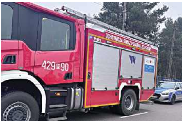
Wstępne ustalenia nie wskazują, aby do śmierci mężczyzny przyczyniły się osoby trzecie

Ciało 71-letniego mężczyzny znaleziono w drugi dzień świąt w jednym z domów w Żelechowie, po zgłoszeniu od zaniepokojonego członka rodziny.