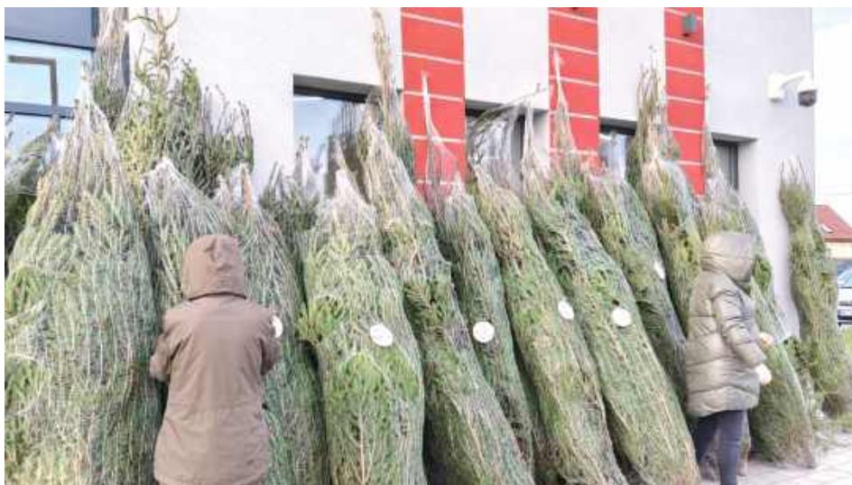
Nadleśnictwo Garwolin 17 grudnia w RCKiK Warszawa OT Garwolin w ramach podziękowania rozdawało żywe drzewka

Akcja objęła ponad 40 miast w całej Polsce, w tym wszystkie Regionalne Centra Krwiodawstwa i Krwiolecznictwa (RCKiK) oraz wybrane oddziały terenowe (m.in.