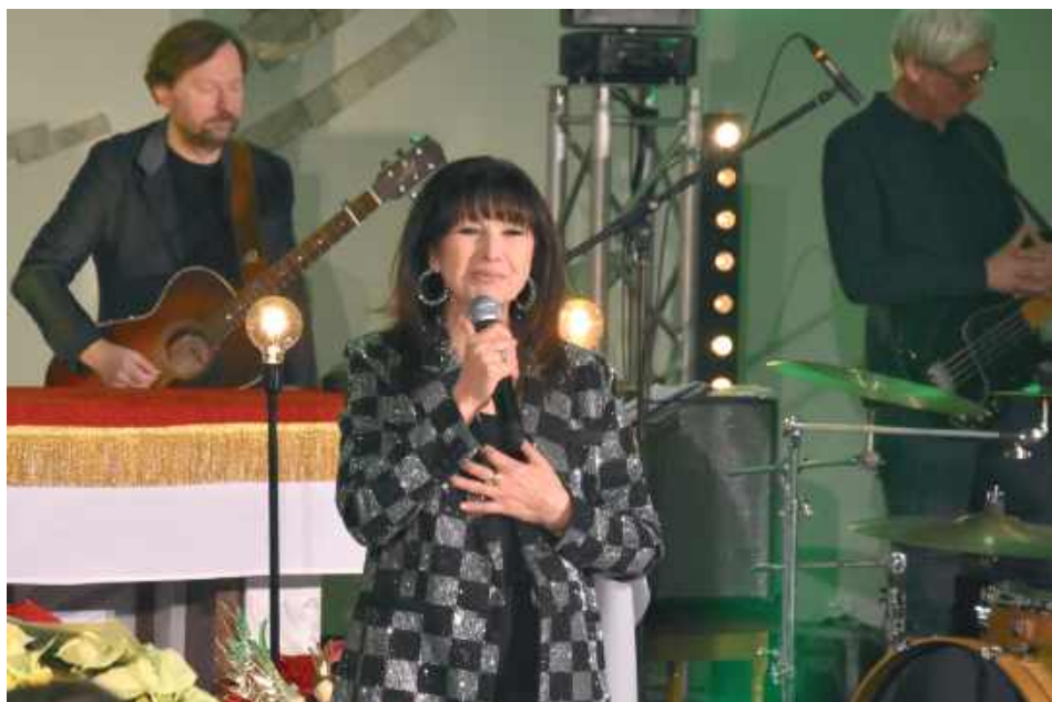
Krystyna Giżowska przypomniała także swoje największe przeboje, dzięki którym zyskała sympatię muzycznej publiczności w całej Polsce