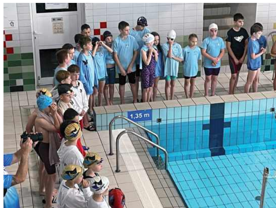
Klub z Miętnego wkrótce zorganizuje ogólnopolskie zawody na pływalni „Garwolanka”

Już w połowie stycznia przed nami wielkie wydarzenie pływackie w „Garwolance”. ULKS „Mazowsze” Miętne organizuje zmagania.