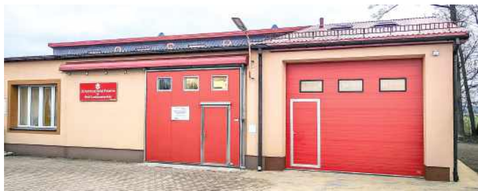
Zadanie polegało na rozbudowie budynku OSP Wola Łaskarska z przeznaczeniem na garaż

Samorząd Gminy Łaskarzew poinformował o zakończeniu kolejnej inwestycji. Budynek OSP Wola Łaskarska został rozbudowany o nowoczesny garaż.