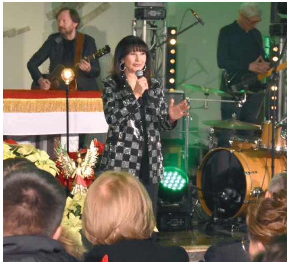
Krystyna Giżowska jest legendą rodzimej sceny muzycznej, szczególnie popularną w latach 80. XX wieku, znaną z takich hitów jak: „Nie było ciebie tyle lat”, „Złote obrączki” czy „Przeżyłam z Tobą tyle lat”