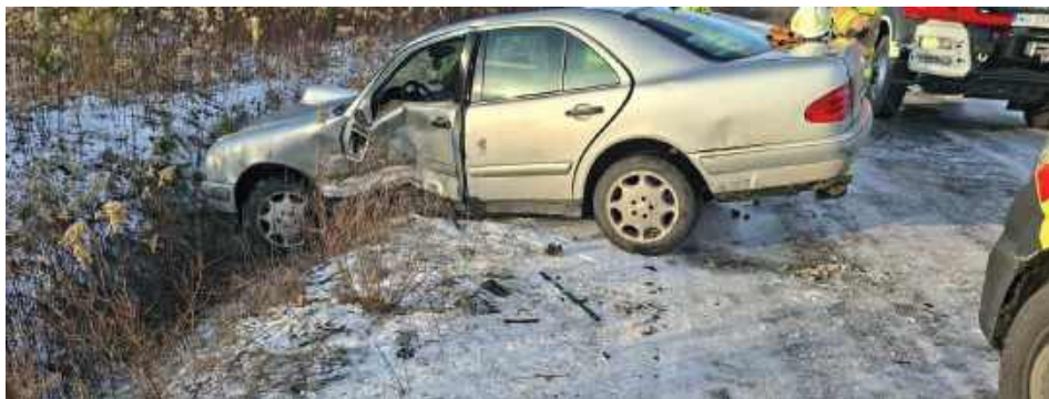
Kierujący Mercedesem nie dostosował prędkości do warunków panujących na drodze, wpadł w poślizg i zatrzymał pojazd w poprzek jezdni

Wypadek miał miejsce 30 grudnia, przed godz. 13 w okoli-