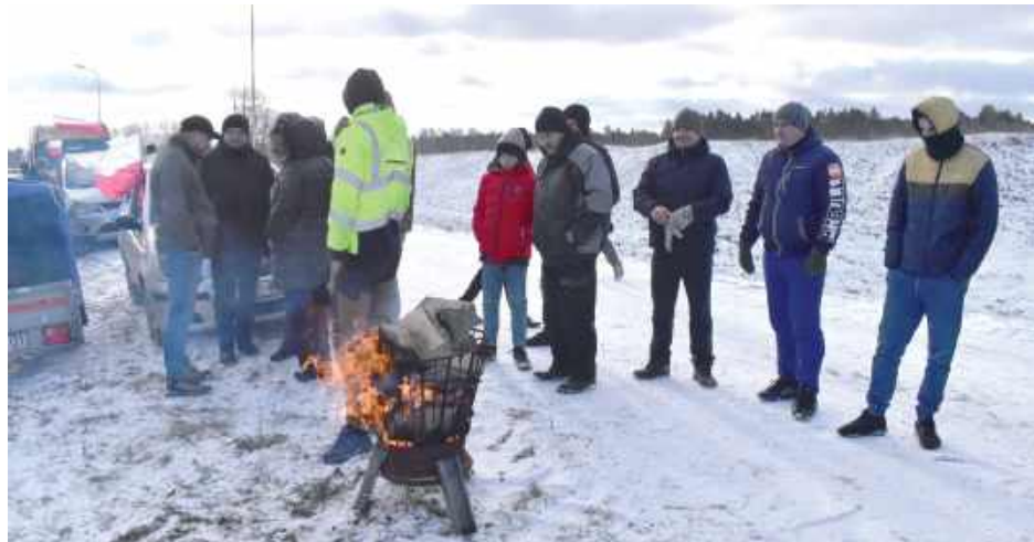
Rolnicy protestowali przy naprawdę niskiej temperaturze. Na szczęście mieli miejsce, gdzie mogli się ogrzać

Kilkudziesięciu rolników z powiatu ryckiego oraz sąsiednich gmin wzięło udział w zorganizowanym proteście przeciwko planowanej umowie handlowej Unii Europejskiej z krajami Mercosur. Protest był również w Łukowie i Lublinie.