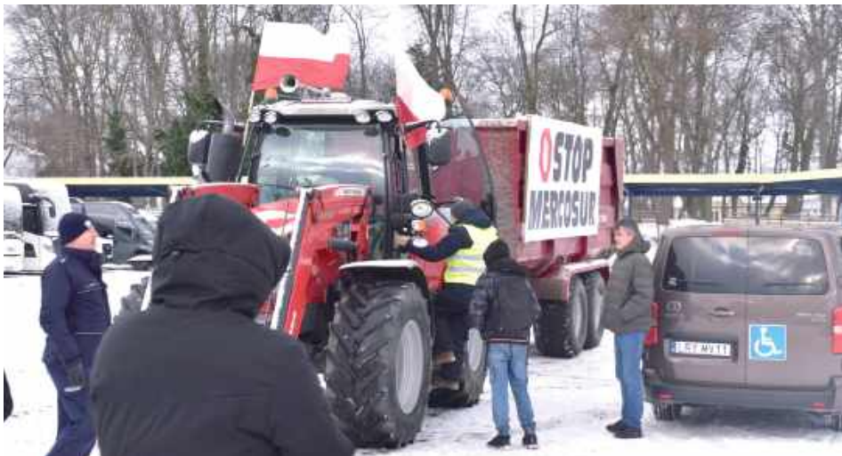
Demonstracja rozpoczęła się w Rykach, a następnie przeniosła do Sierskowoli, gdzie podobnie jak w ponad 170 innych miejscowościach w całej Polsce rolnicy zamianifestowali swój sprzeciw wobec zapisów porozumienia