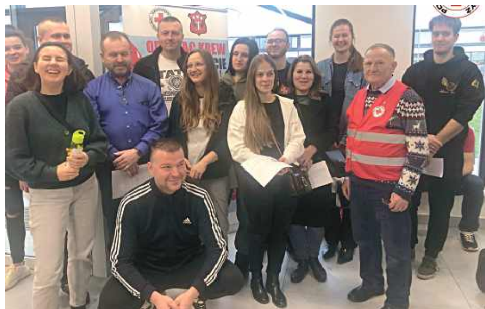
Krew oddało aż 94 krwiodawców

Jak podkreśla PCK, wszystkie akcje krwiodawstwa organizo-