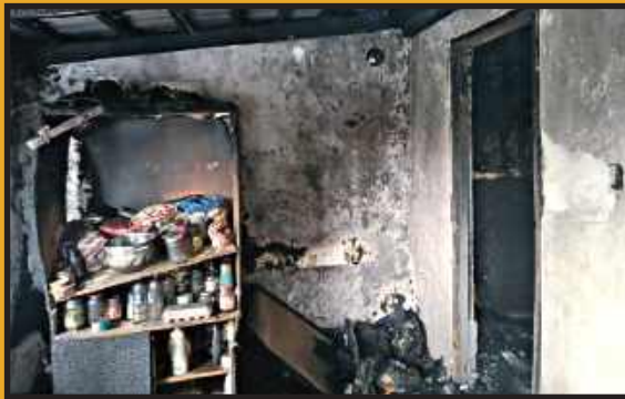
Zniszczenia są tak poważne, że budynek musi zostać całkowicie rozebrany