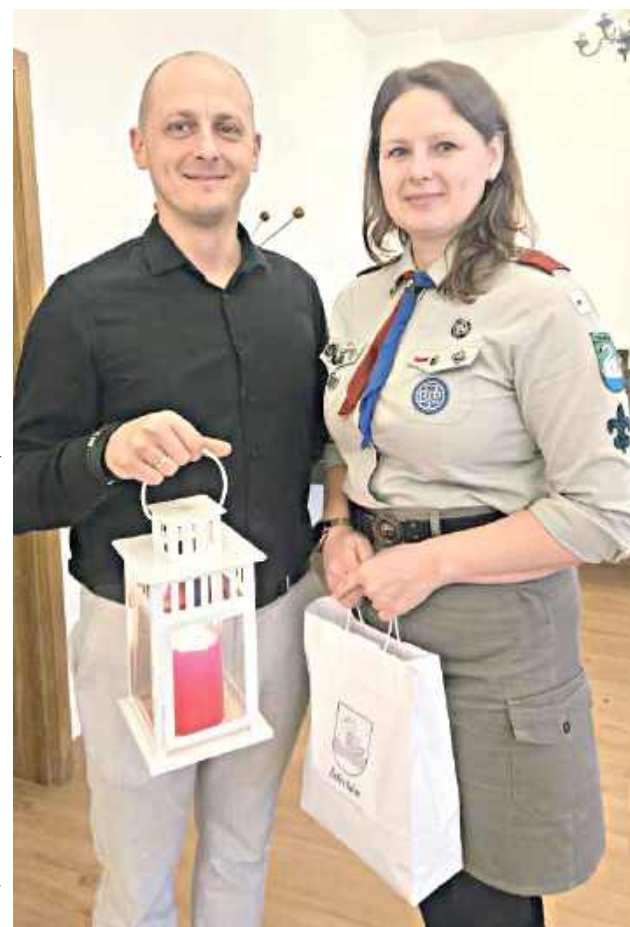
Tegoroczne hasło Betlejemskiego Światła Pokoju brzmi „Pielęgnuj dobro w sobie”