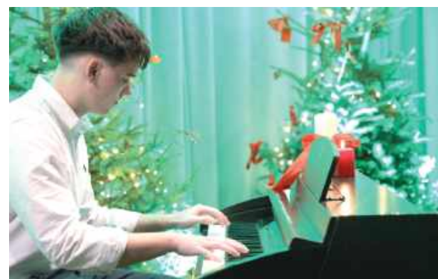
Starsi uczniowie prezentowali utwory trudniejsze i dłuższe

Dobra, przyjazna atmosfera, wspólne śpiewanie i pamiątkowe zdjęcia uczyniły ten wieczór piękną kartką świątecznego spotkania.