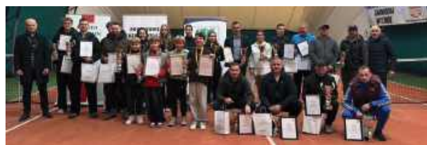
15 grudnia 2025 w samo południe w hali tenisowej przy ul. Olimpijskiej w Garwolinie odbyła się uroczystość zakończenia XXV Jubileuszowego Tenisowego Challenge