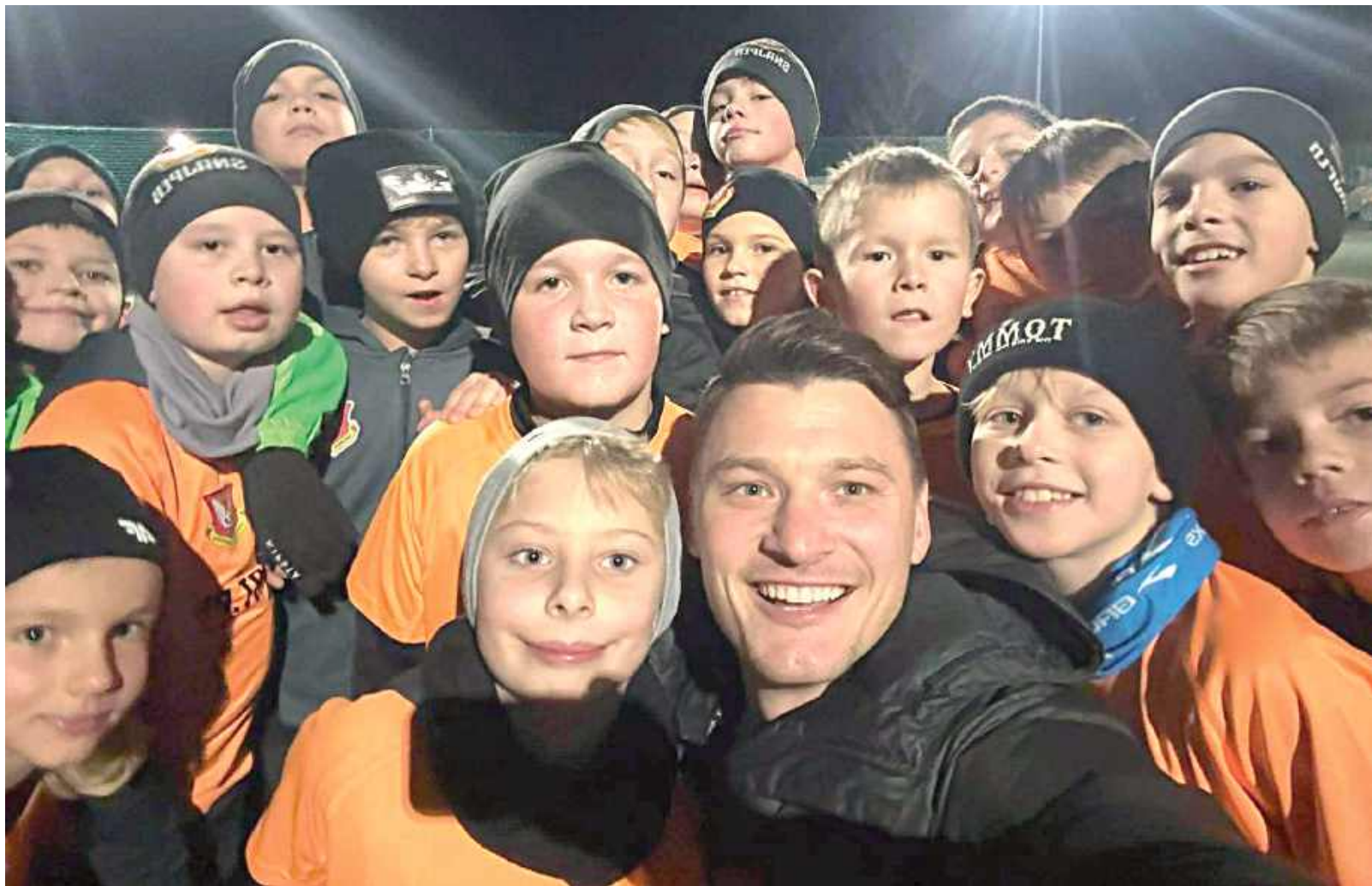
Jedna z grup sekcji piłki nożnej Snajpera wraz z trenerem

Obecnie w strukturach KS Snajper Sośninka funkcjonują sekcje piłki nożnej dla chłopców i dziewczynek oraz sekcja siatkówki dziewcząt. Są pomysły na powstanie sekcji kolarstwa górskiego MTB czy tenisa stołowego. Analizujemy możliwości dalszego rozwoju – wszystko zależy jednak od zapotrzebowania, dostępnej infrastruktury, kadry