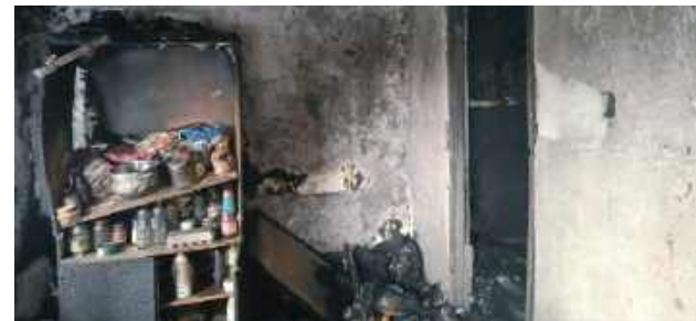
Zniszczenia są ogromne

Para straciła wszystko, co znajdowało się w części mieszkalnej: ubrania, sprzęt RTV, większość rzeczy codziennego użytku, dorobek wielu lat. Udało się ocalić jedynie część dokumentów.