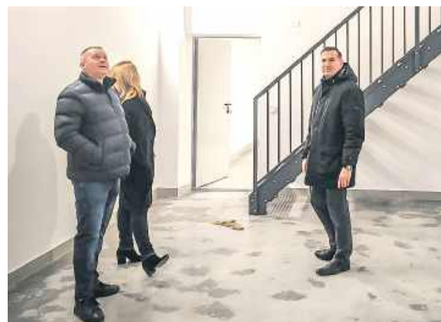
Środki na realizację inwestycji pochodziły w całości z budżetu gminy Łaskarzew

Zadanie polegało na rozbudowie budynku OSP Wola Łaskarska z przeznaczeniem na garaż do przechowywania sprzętu strażackiego wraz z pomieszczeniem pomocniczym oraz antresolą nad pomieszczeniem pomocniczym.