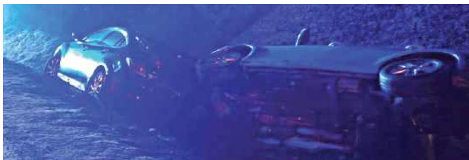
Kierowca oraz pasażerka skody zostali przewiezieni do szpitala, po udzieleniu pomocy medycznej zwolnieni do domu

Zgłoszenie w wypadku wpłynęło w piątek, 26 grudnia o godz. 15.40. Dotyczyło ono zderzenia dwóch aut osobowych, do którego doszło w Trąbkach, na ul. Osadniczej. Jak wynika z informacji przekazanych przez biuro prasowe KPP Garwolin, kierowca skody nie dostosował prędkości do warunków ruchu, stracił panowanie nad pojazdem, po czym