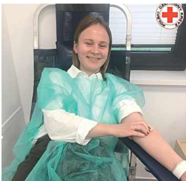
To była niezwykła akcja!

nawet w Walentynki - cieszą się organizatorzy.