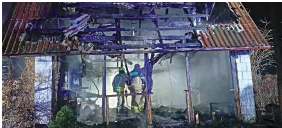
Domek letniskowy spalił się doszczętnie

W sobotę, 27 grudnia, wybuchł pożar w jednym z domków letniskowych przy ul. Andersa w Garwolinie.