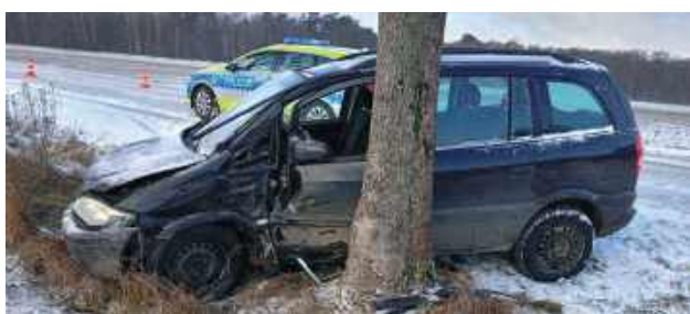
W wyniku poślizgu samochód zjechał z jezdni i zakończył jazdę na drzewie. Kobieta została przetransportowana do szpitala. Na szczęście nie doznała poważnych obrażeń

Do zdarzenia doszło na drodze powiatowej. Jak ustalili policjanci, kierująca nie dostosowała prędkości do panujących