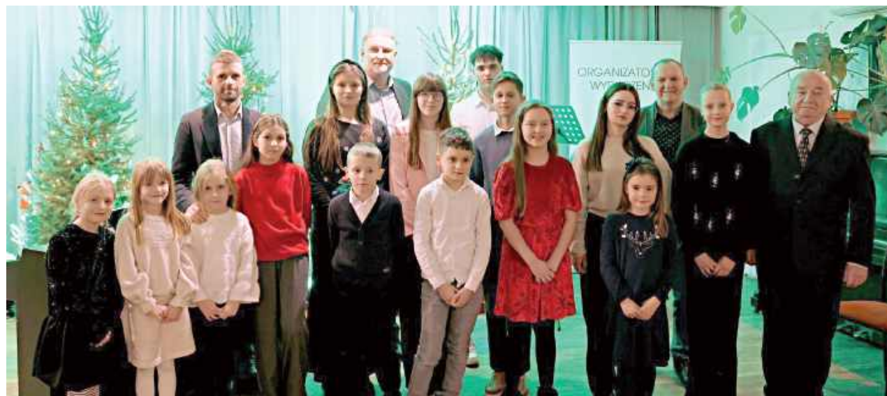
Dzieci wykonały piękne koledy

W aurze Świąt Bożego Narodzenia w poniedziałek popołudnie 29 grudnia w sali konferencyjnej Centrum Sportu i Kultury w Garwolinie odbył się wspólny koncert koled. Przy pianinie zasiedli uczniowie Ogniska muzycznego prowadzonego od lat przez maestro Juliana Czaporowskiego.