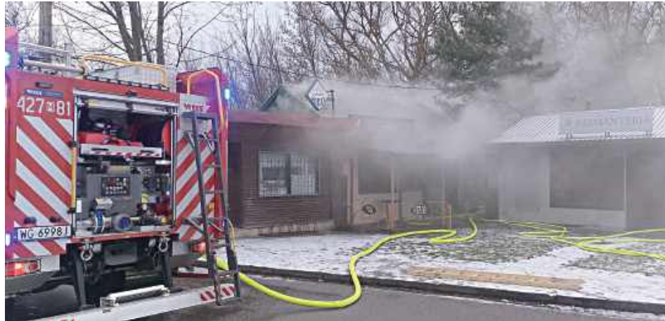
Zgłoszenie o pożarze popularnego kebaba przy ul. Przemysłowej wpłynęło do służb o godz. 7:50

- Strażacy, którzy zjawili się na miejscu, około pół godziny