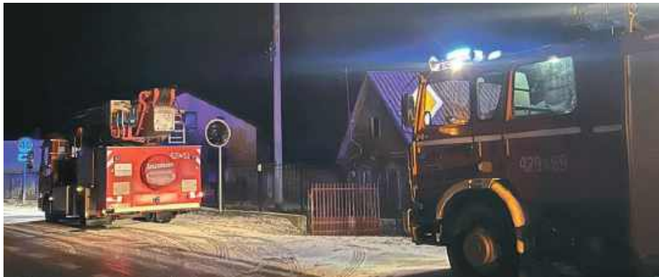
Na miejscu dokonano dramatycznego odkrycia

Policjanci, pod nadzorem prokuratora, przeprowadzili szczegółowe oględziny miejsca zdarzenia,