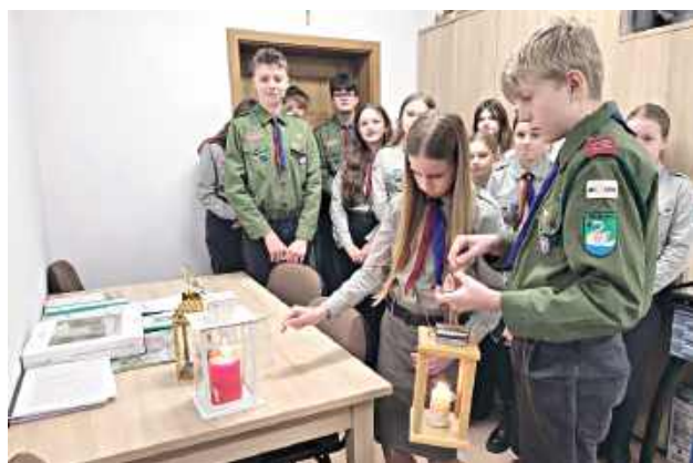
ok Niech ten płomień rozjaśnia serca i przypomina o tym, co naprawdę ważne

Niech ten płomień rozjaśnia serca i przypomina o tym, co naprawdę ważne!