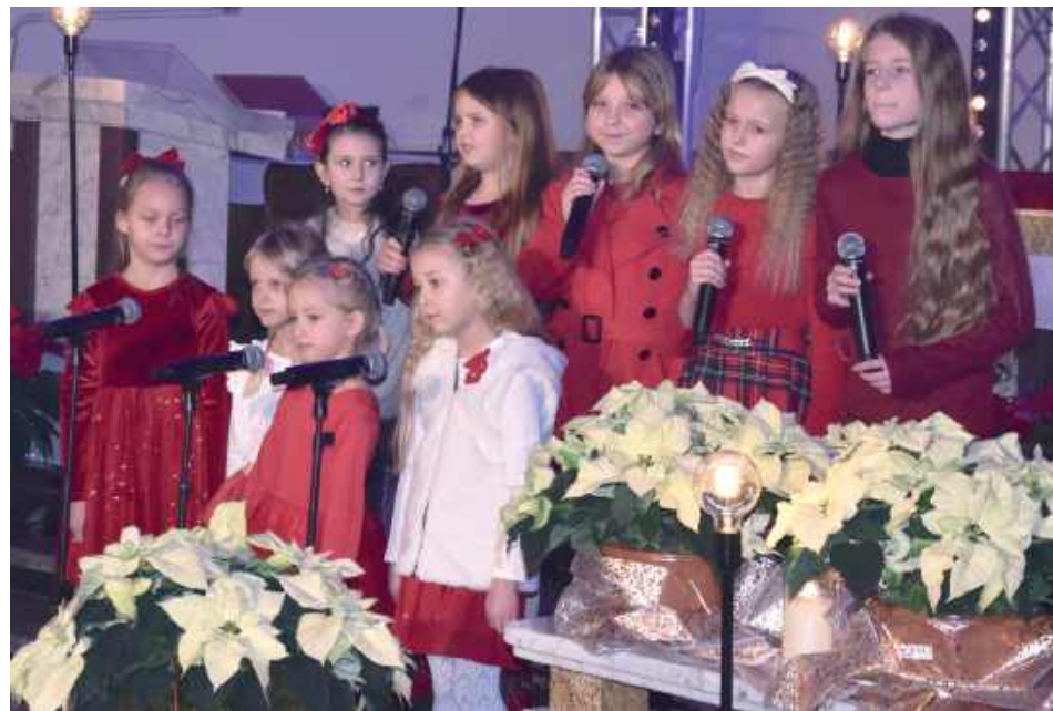
O godzinie 15.30 z repertuarem pięciu kolęd zaprezentował się dziecięcy zespół Złote Nutki z Borowia

W niedzielę, 28 grudnia o godzinie 15.30 w kościele parafialnym pw. Trójcy Świętej w Borowiu odbył się świąteczny koncert kolęd. Gwiazdą wieczoru była ikona polskiej sceny muzycznej, Krystyna Giżowska.